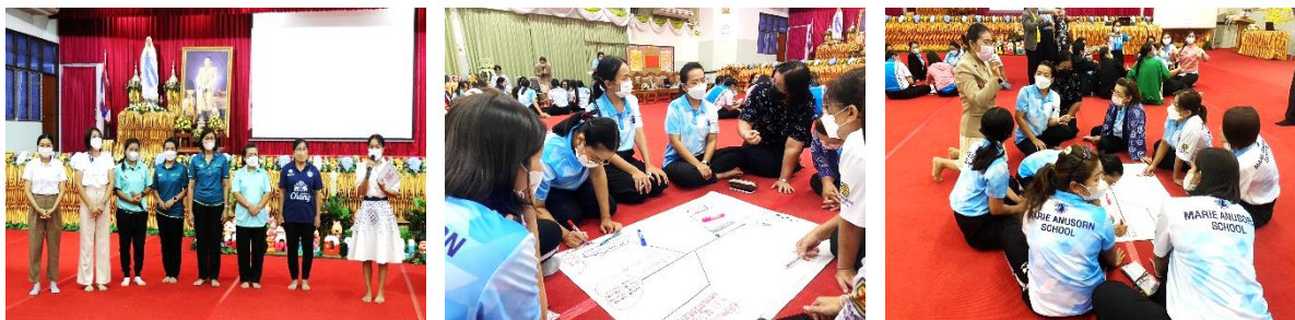
อบรม PLC เพื่อพัฒนาแผนการจัดการเรียนรู้ และนวัตกรรม

กลุ่มสาระการเรียนรู้ภาษาไทยจัดประชุมครูในกลุ่มสาระฯ เพื่อศึกษาปัญหาและวิเคราะห์ สภาพปัญหาด้านการจัดการเรียนการสอนในแต่ละสายชั้น หลังจากนั้นจึงไปออกแบบการจัดการเรียนรู้ โดย ใช้การเรียนการสอนแบบ Active Learning