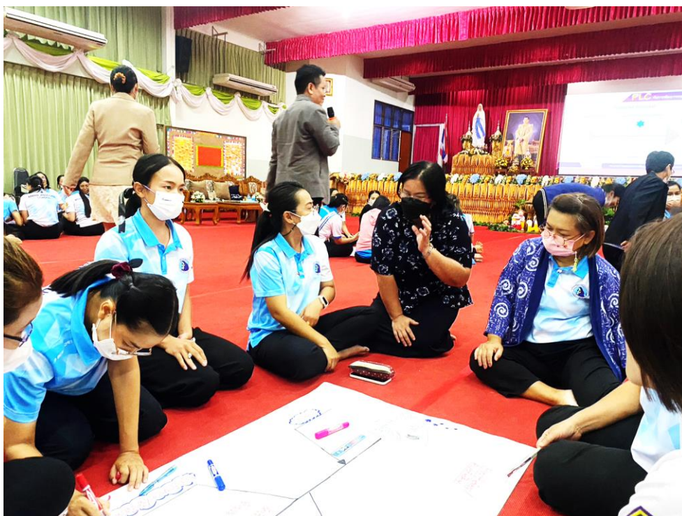
อบรม PLC เพื่อพัฒนาแผนการจัดการเรียนรู้ และนวัตกรรม