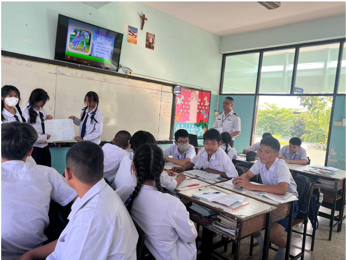
การจัดการเรียนการสอนให้กับนักเรียนโดยใช้กระบวนการเรียนรู้เชิงรุก Active Learning