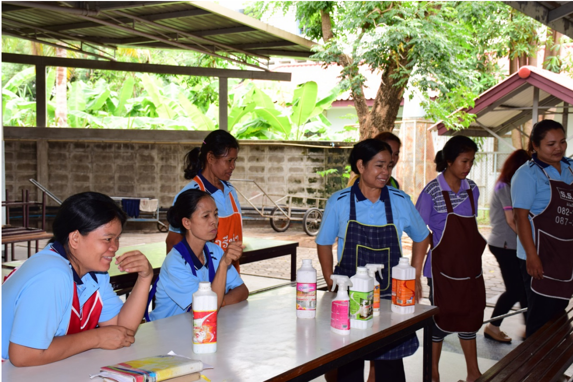
เจ้าหน้าที่เรียนรู้เรื่องการทำความสะอาดห้องเรียน อาคารเรียน