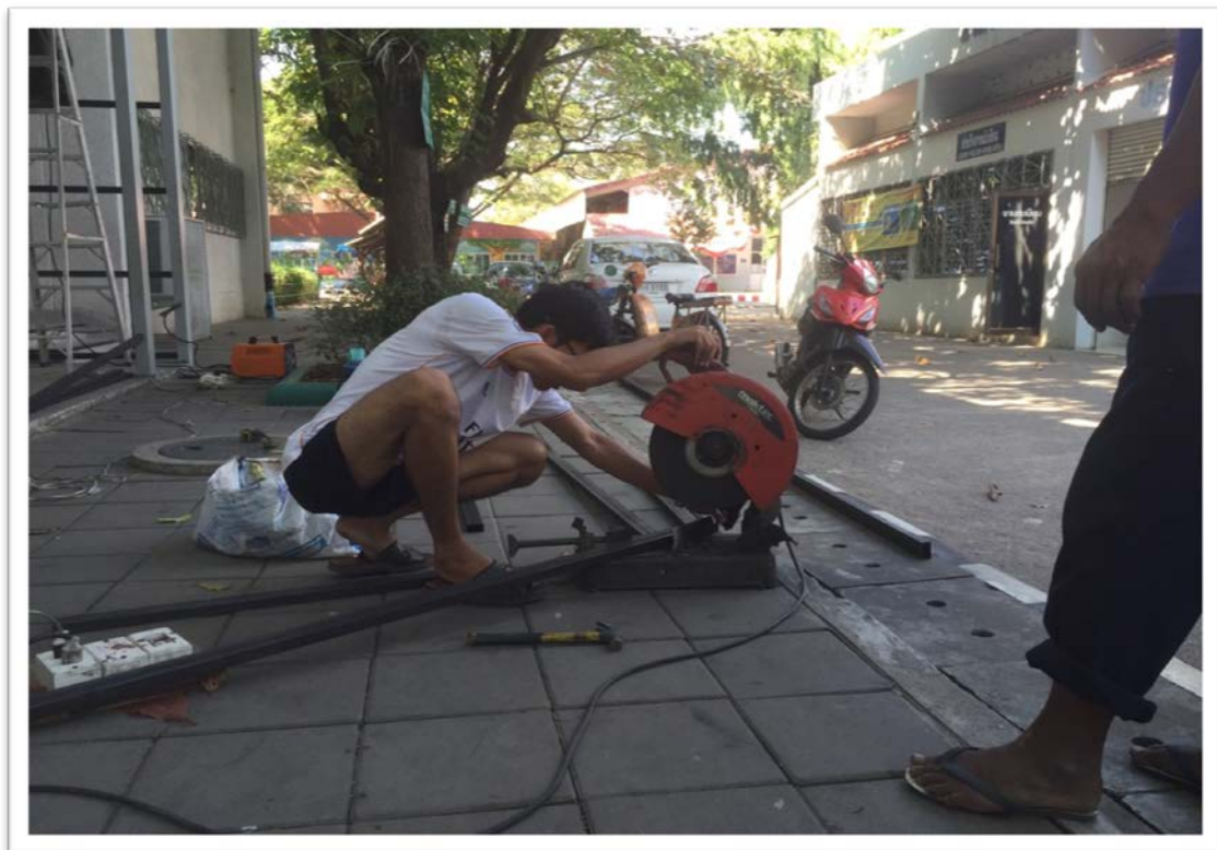
งานซ่อมบำรุงงานเหล็กและเชื่อม