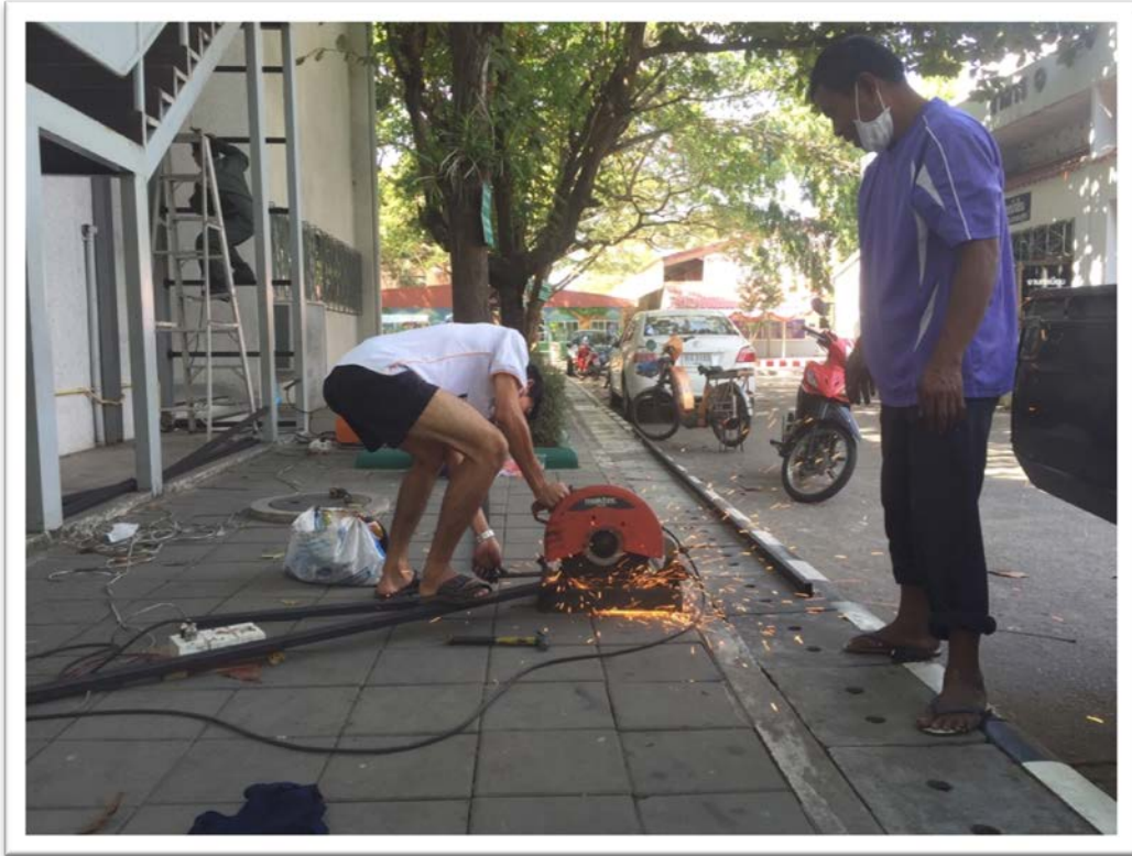
งานซ่อมบำรุงงานเหล็กและเชื่อม