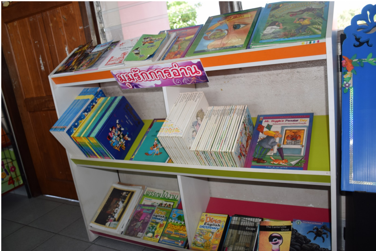
จัดมุมหนังสือรักการอ่านแต่ละห้องเรียน