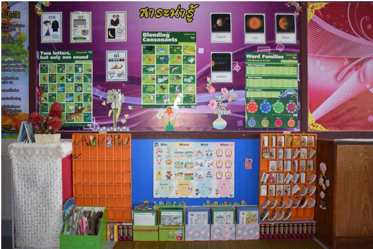
จัดป้ายนิเทศให้ความรู้แก่นักเรียน