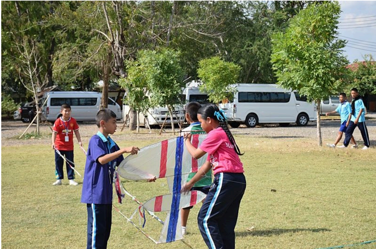
การประกวดการวิ่งว่าวประเภทต่าง ๆ