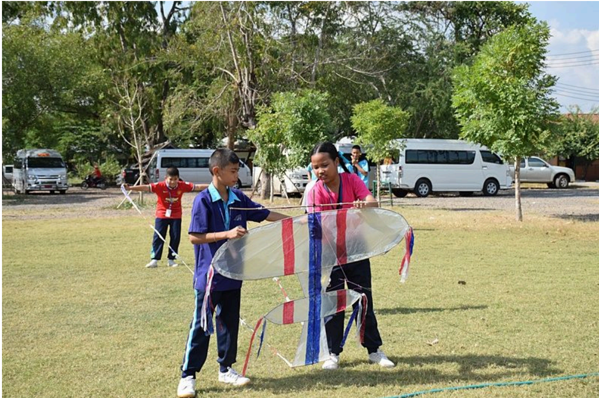
การประกวดการวิ่งว่าวประเภทต่าง ๆ