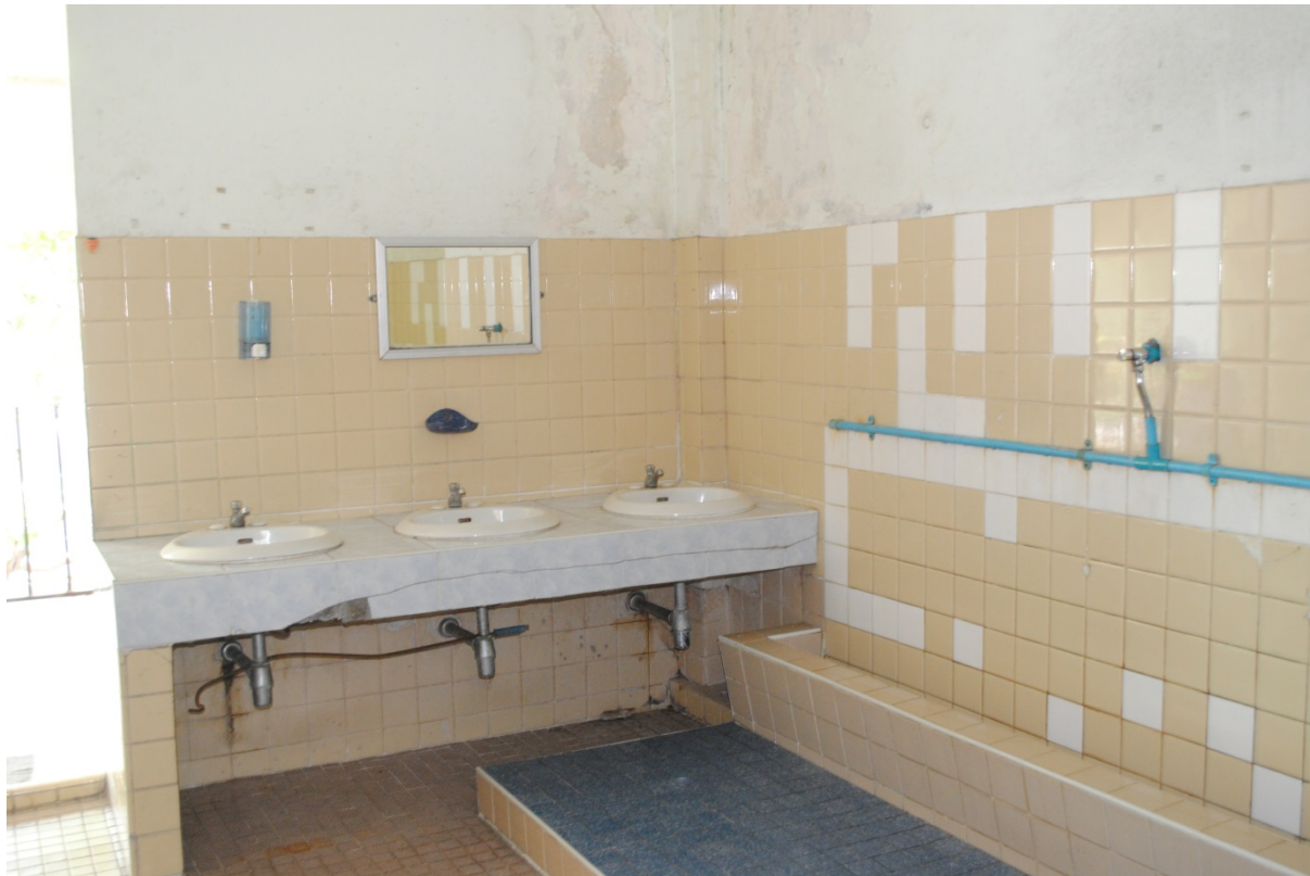
ความสะอาดของห้องน้ำ