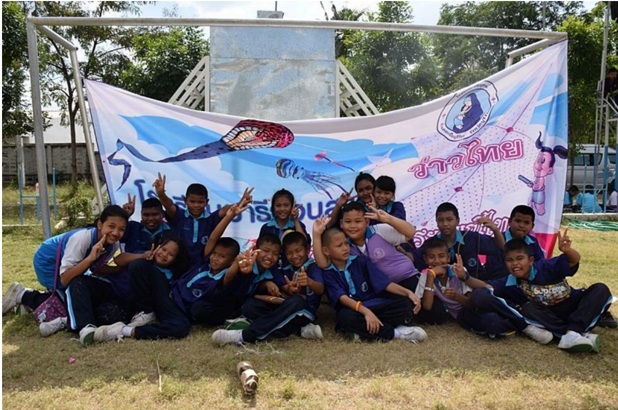
การประกวดการวิ่งว่าวประเภทต่าง ๆ