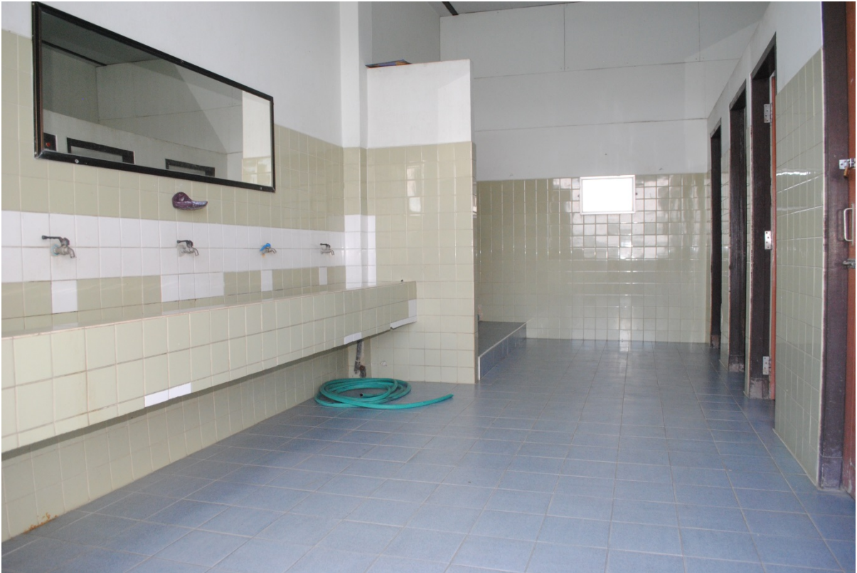
ความสะอาดของห้องน้ำ