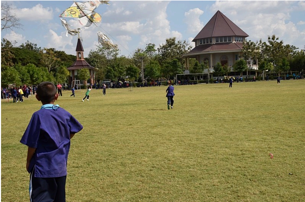
การประกวดการวิ่งว่าวประเภทต่าง ๆ