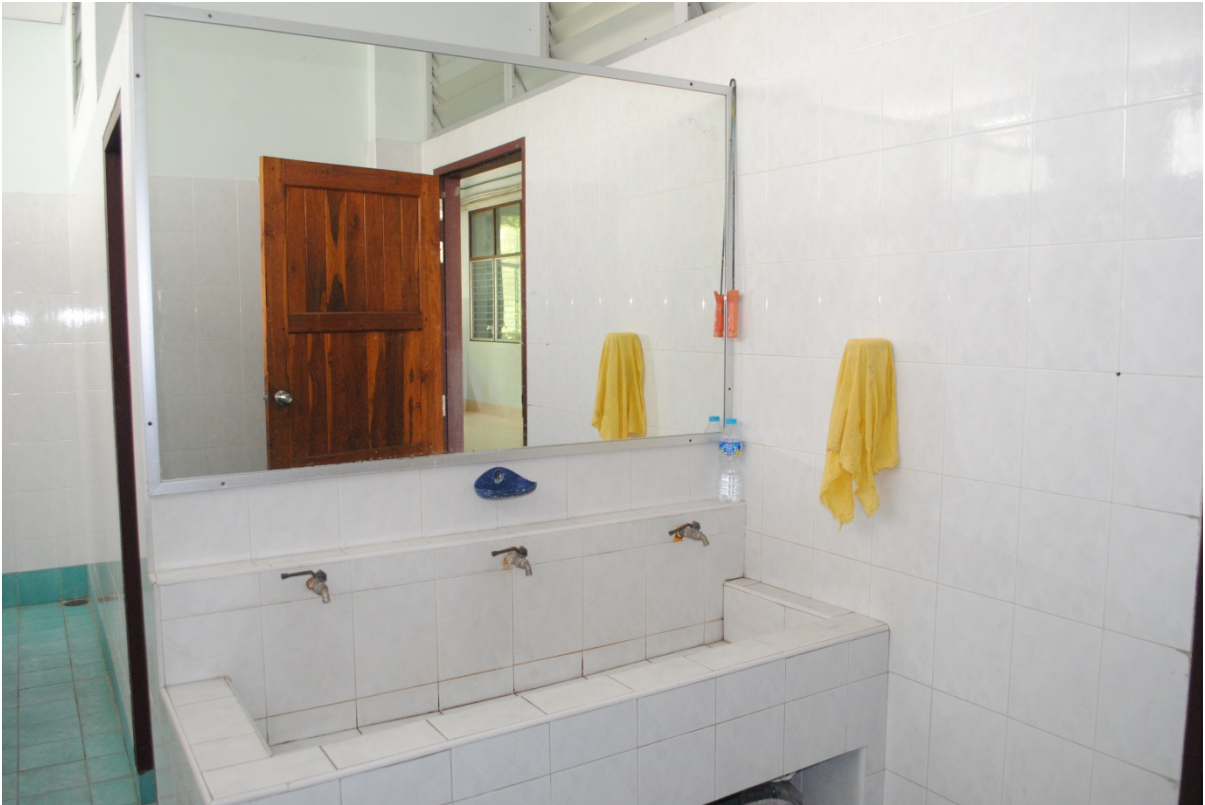
ความสะอาดของห้องน้ำ