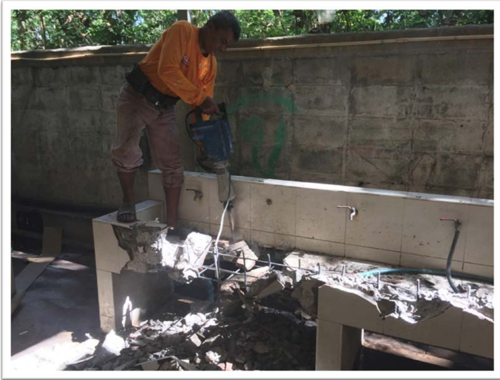
งานสร้างที่ล้างจานสำหรับนักเรียน