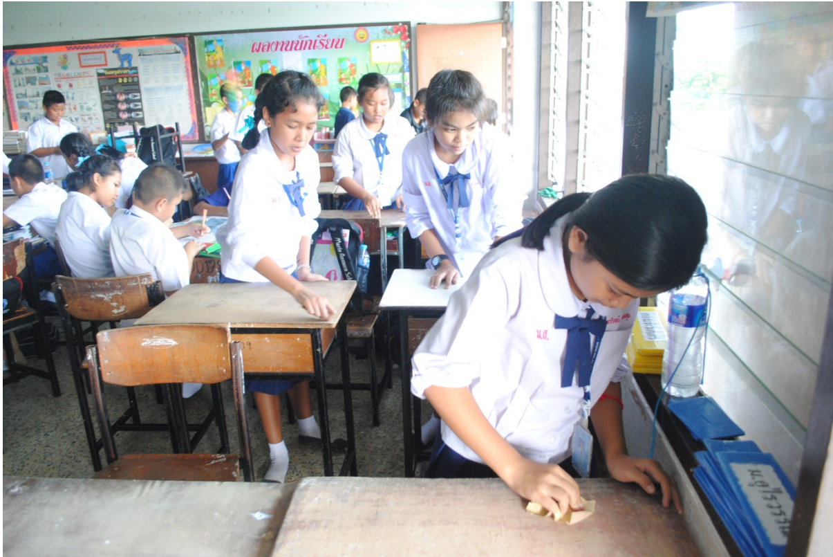
นักเรียนมีส่วนร่วมในการทำความสะอาดห้องเรียน