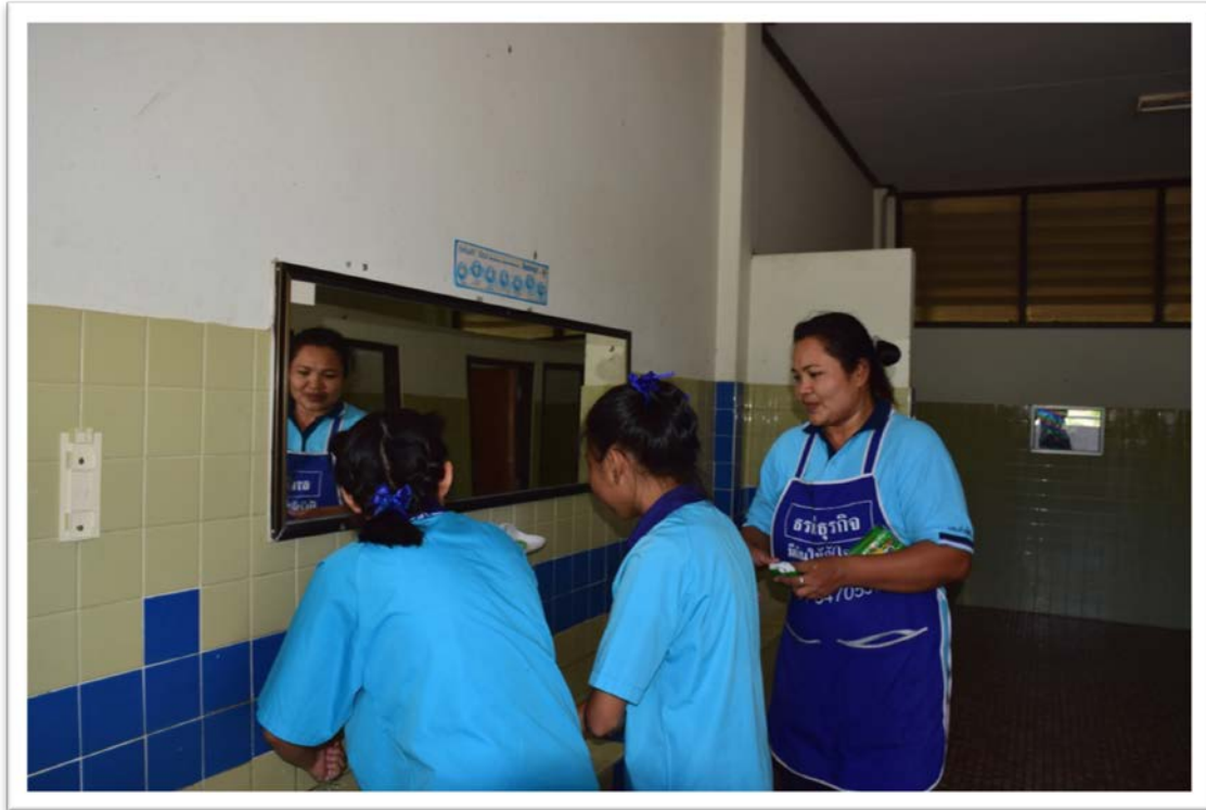
ห้องน้ำอาคารโจแซฟ