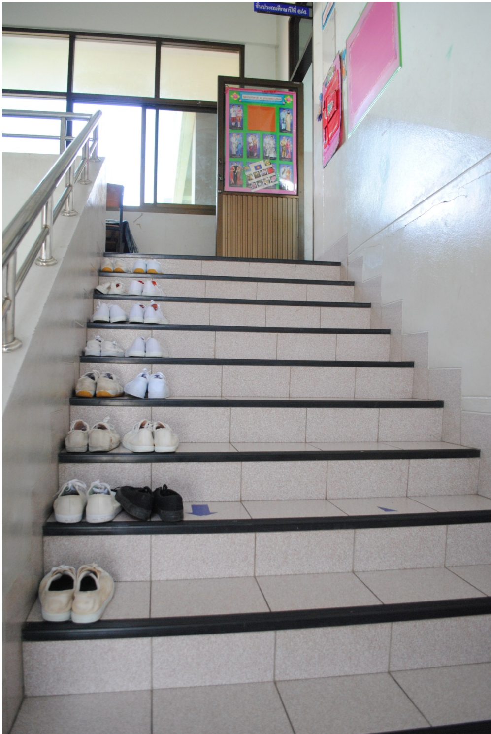
ความสะอาดของบันไดและการวางรองเท้าของนักเรียน