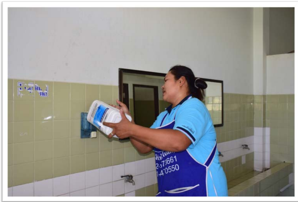
มีระบบสิ่งอำนวยความสะดวก (สบู่เหลวเพื่อล้างมือ)