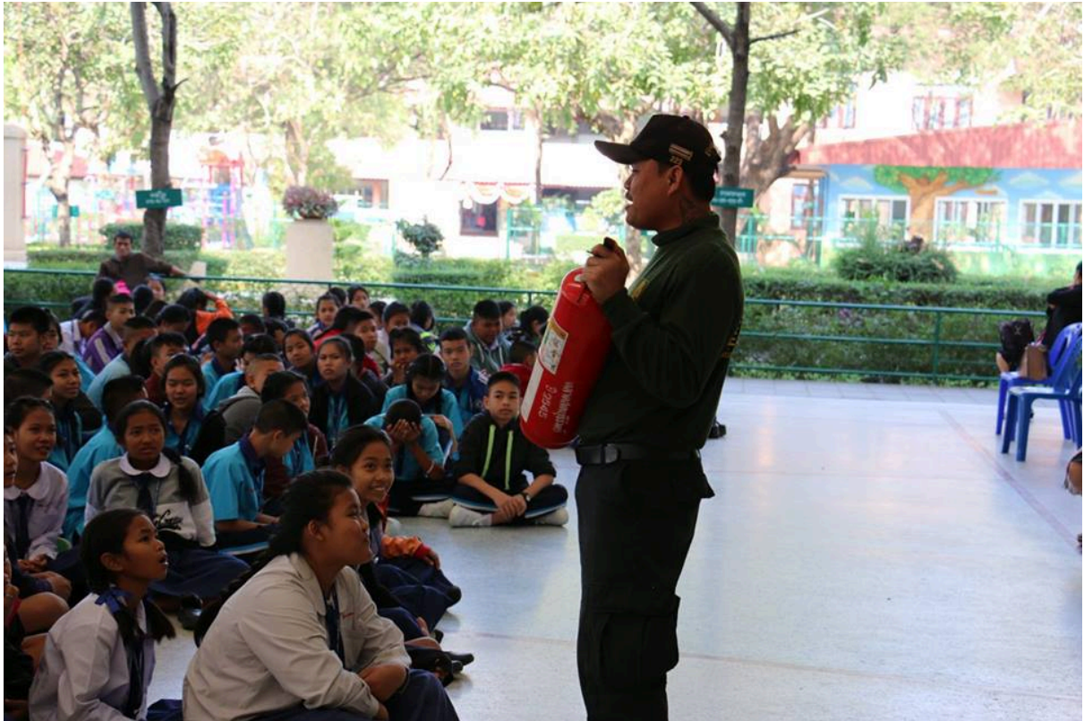
วิทยากรให้ความรู้แก่นักเรียนทั้งหมด