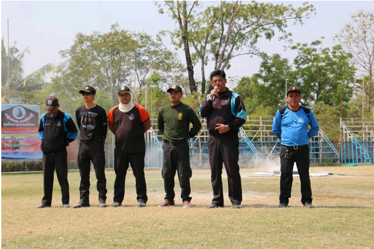
คณะวิทยากรที่มาอบรมให้กับนักเรียนในครั้งนี้