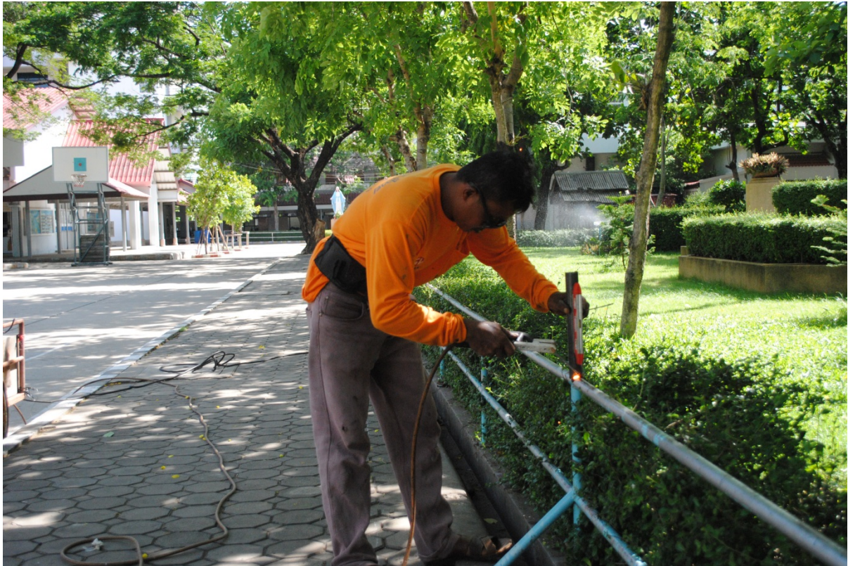
งานซ่อมแซมรั้วสวนหย่อมหน้าเสาธง (งานเหล็ก)