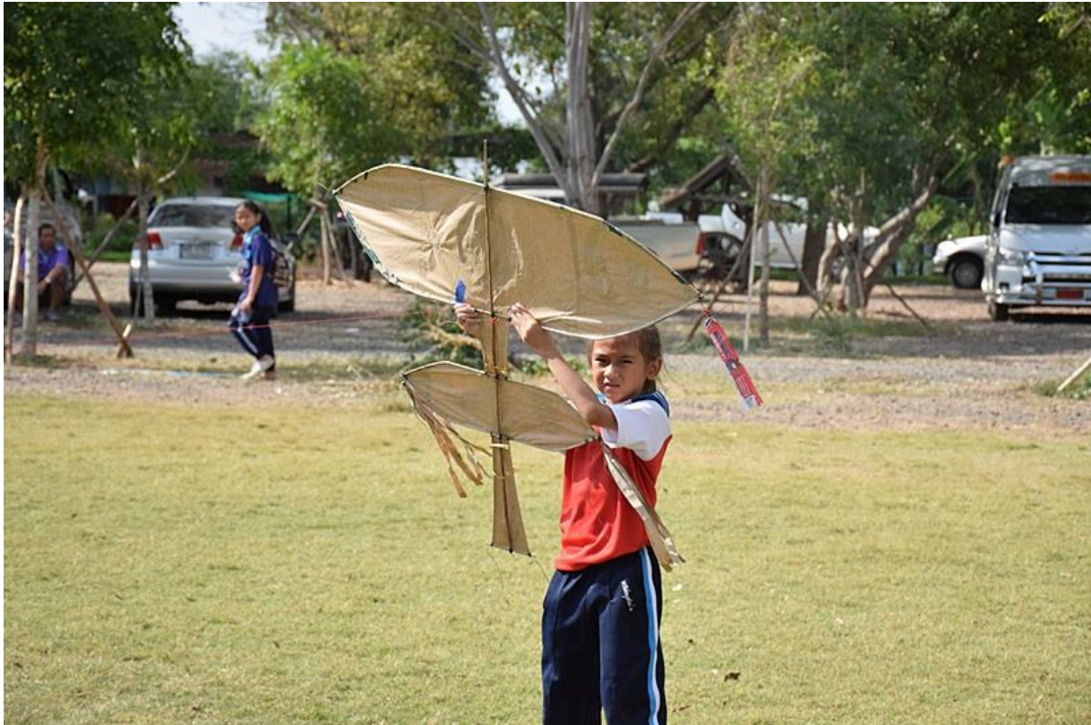
การประกวดการวิ่งวาวประเภทต่าง ๆ