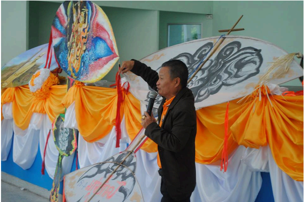
วิทยากรบรรยายว่าวอีสาน และมอบของที่ระลึก