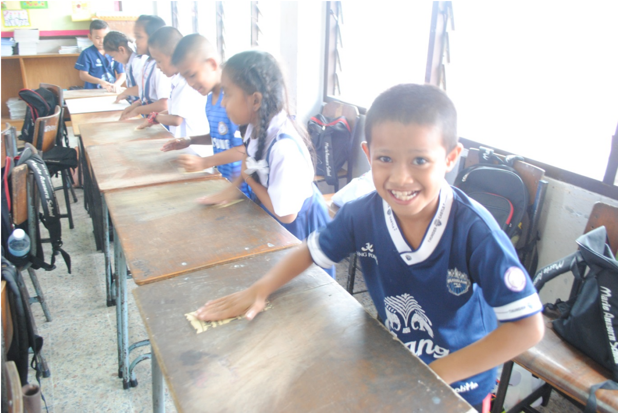
ครูและนักเรียนมีส่วนร่วมในการทำความสะอาดห้องเรียน