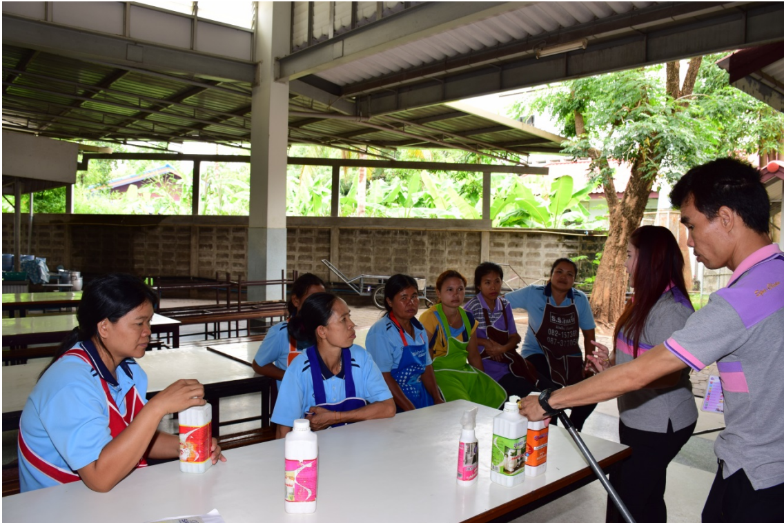
เจ้าหน้าที่เรียนรู้เรื่องการทำความสะอาดห้องเรียน อาคารเรียน