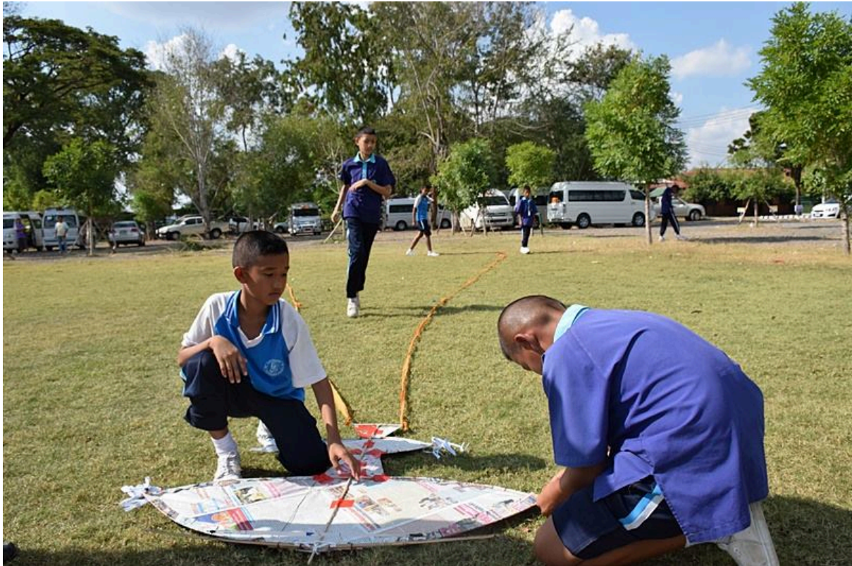
การประกวดการวิ่งว่าวประเภทต่าง ๆ