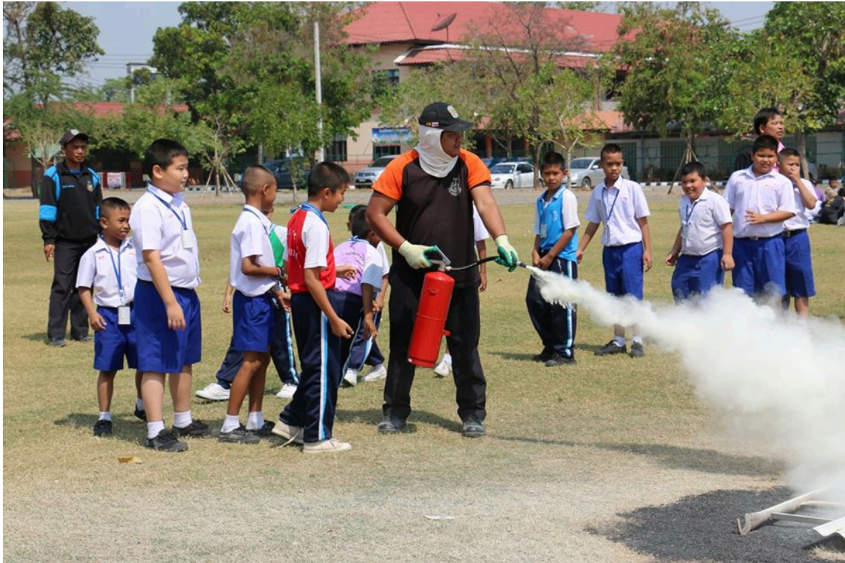
นักเรียนมีส่วนร่วมในการจัดกิจกรรมในครั้งนี้