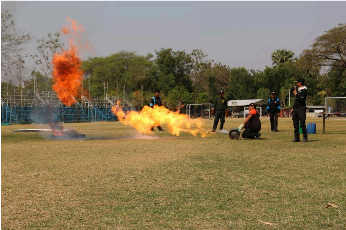
สาธิตการซ้อมอัคคีภัย