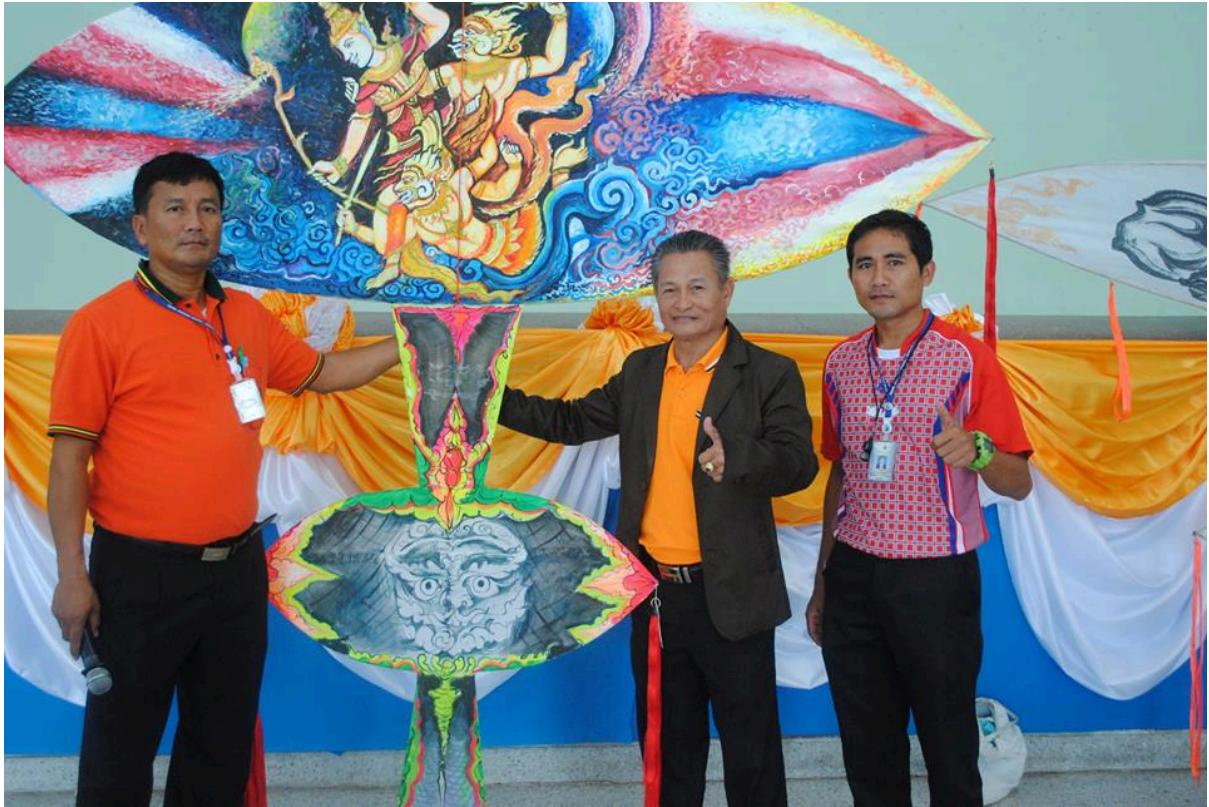
วิทยากรบรรยายว่าอีสาน