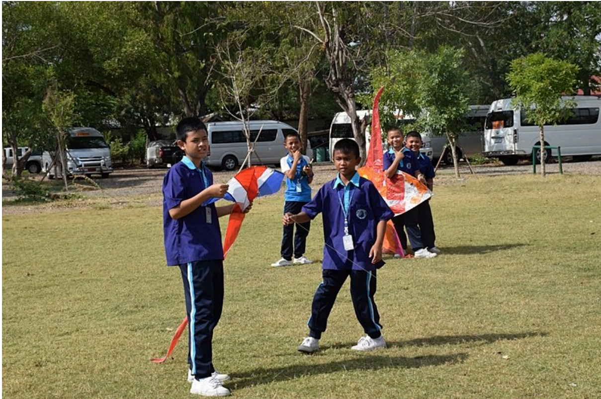
การประกวดการวิ่งว่าวประเภทต่าง ๆ