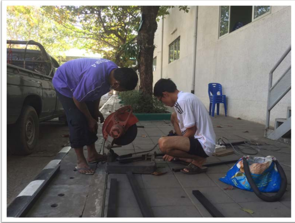
งานซ่อมบำรุงงานเหล็กและเชื่อม