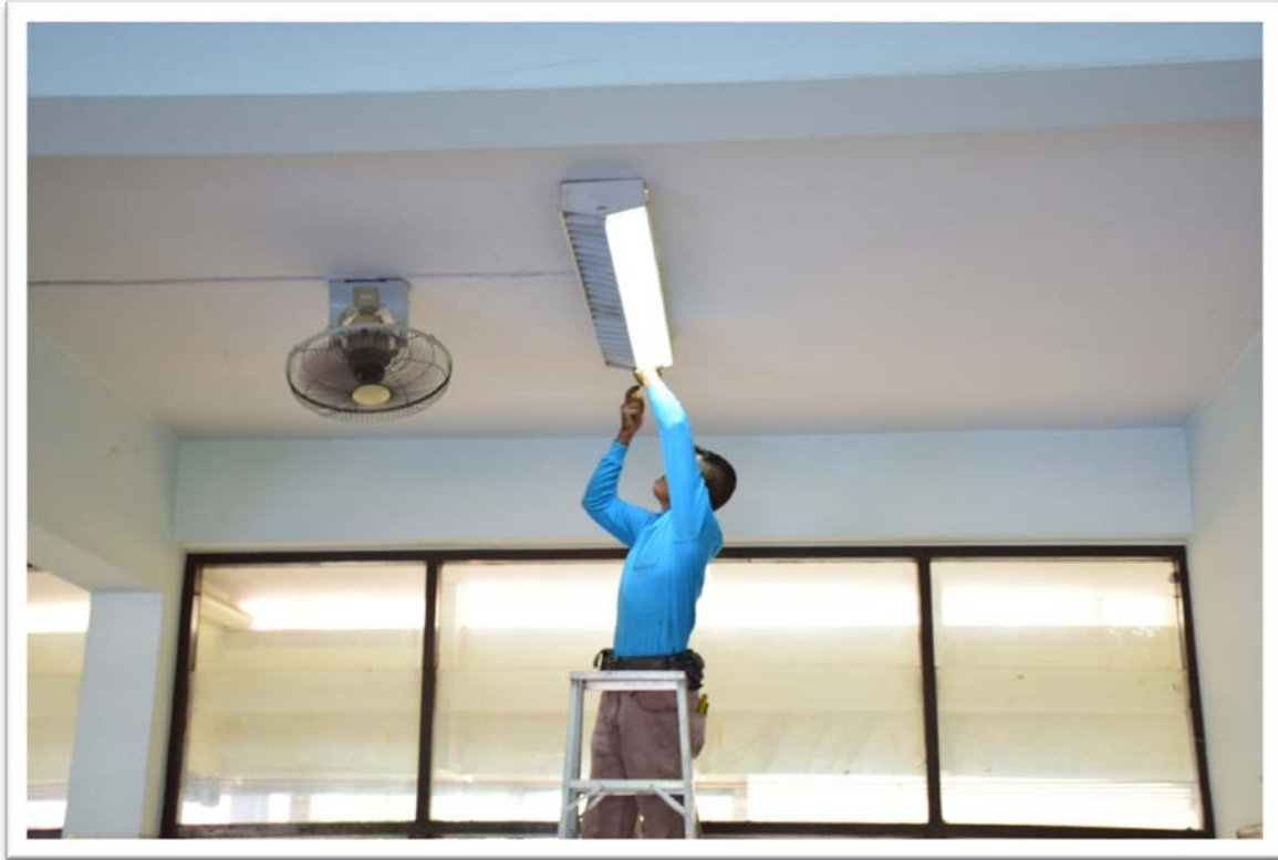
งานซ่อมแซมระบบไฟฟ้า