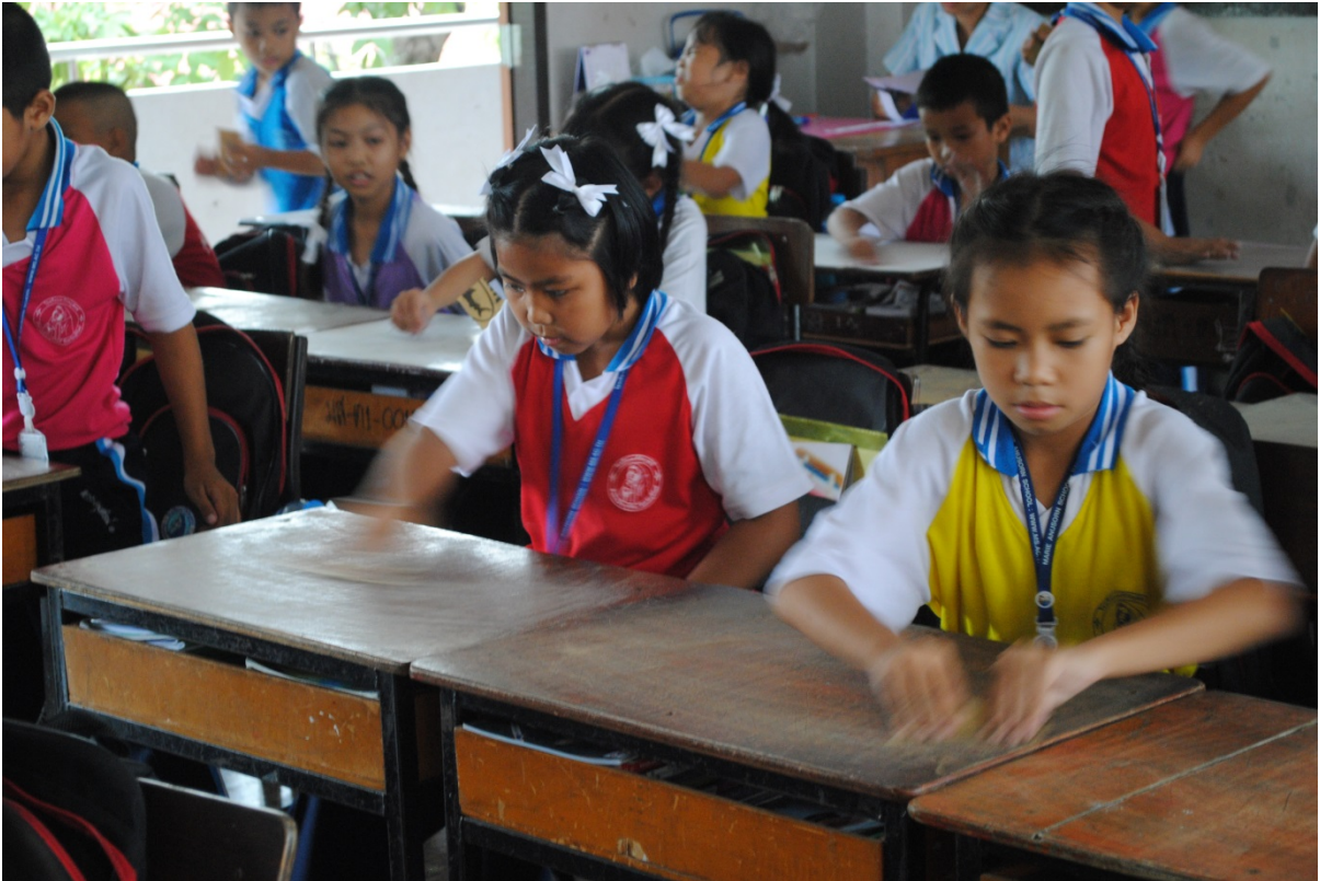
ครูและนักเรียนมีส่วนร่วมในการทำความสะอาดห้องเรียน