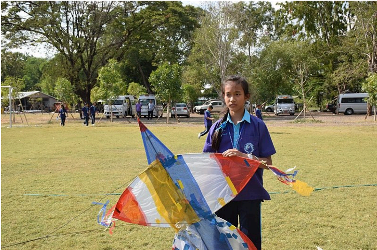
การประกวดการวิ่งวาวประเภทต่าง ๆ