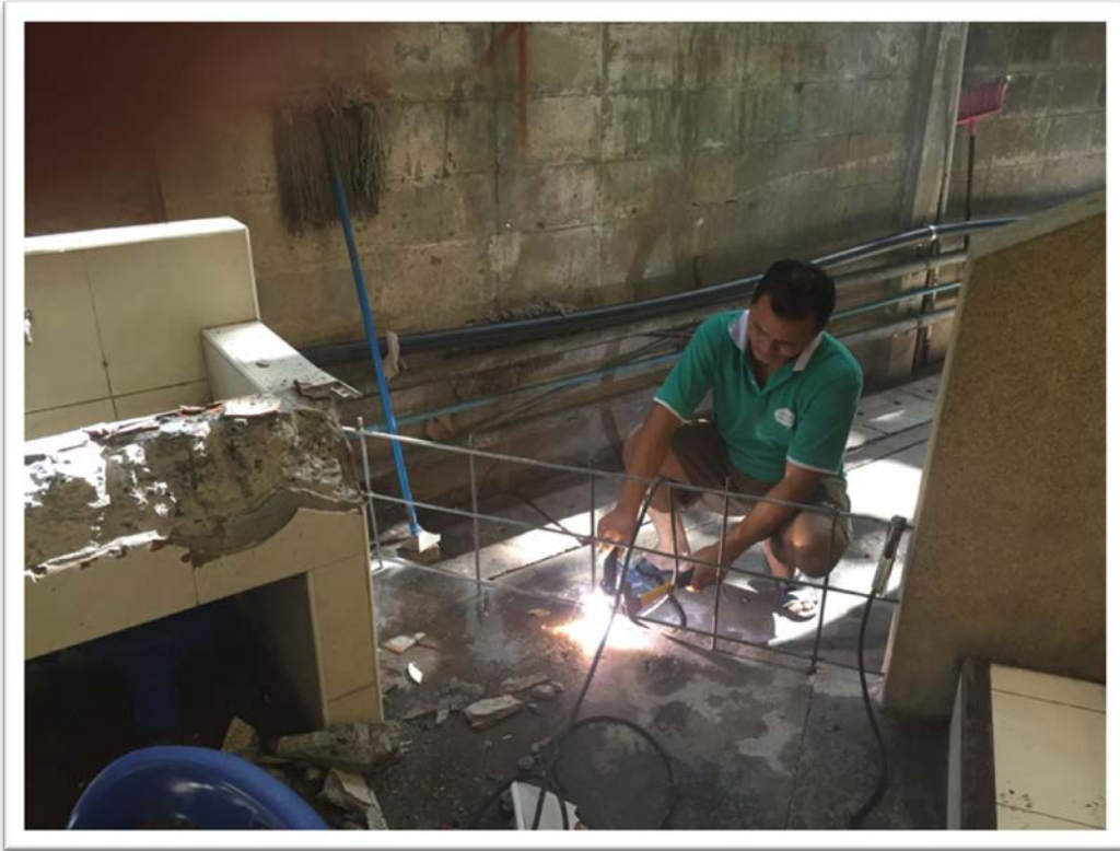
งานสร้างที่ล้างจานสำหรับนักเรียน