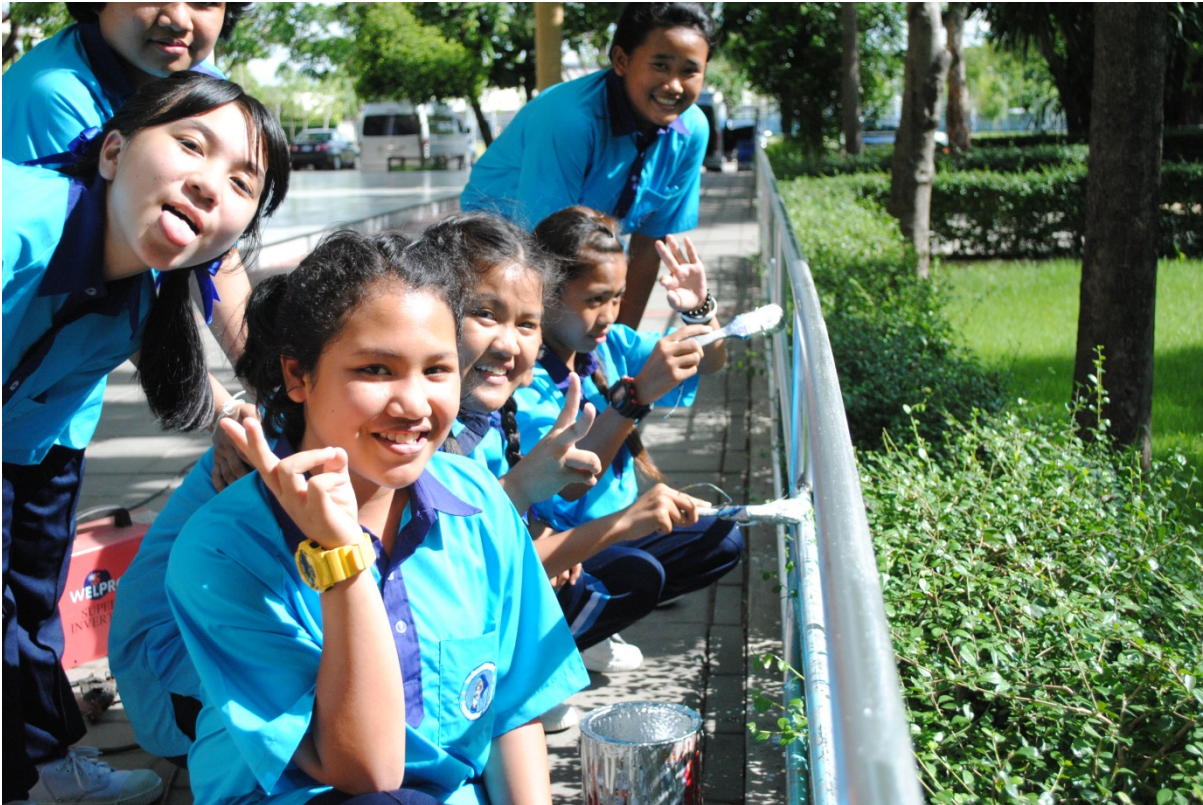
งานซ่อมแซมรั้วสวนหย่อมหน้าเสาธง (งานหลัก)