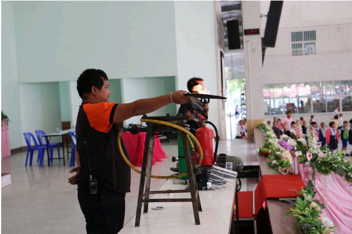
วิทยากรให้ความรู้แก่นักเรียนทั้งหมด