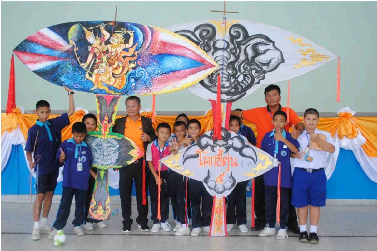
วิทยากรบรรยายว่าวอีสาน