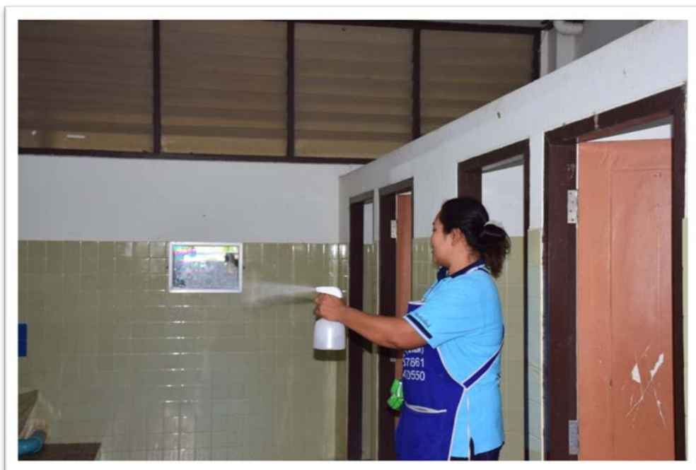
มีการใช้น้ำยาดับกลิ่นหลังทำความสะอาดเพิ่มมากขึ้น