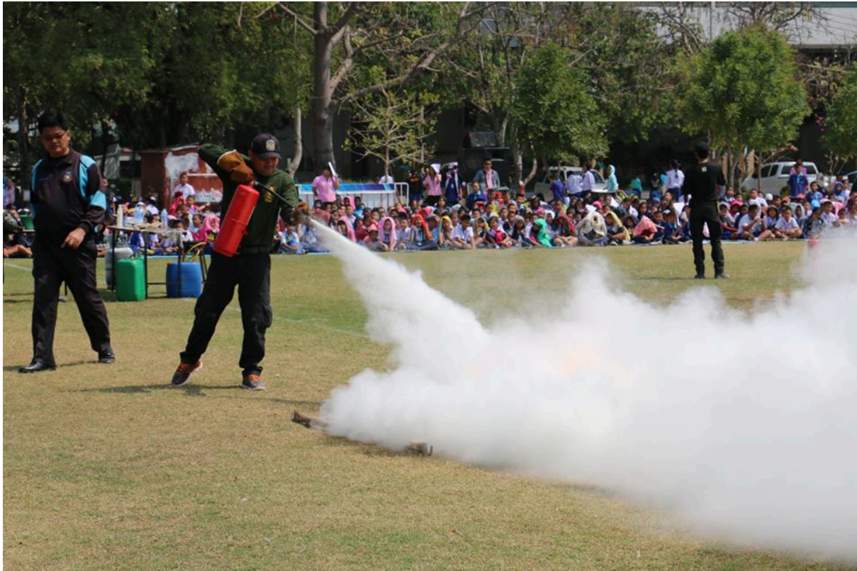
สาธิตการซ้อมอัคคีภัย