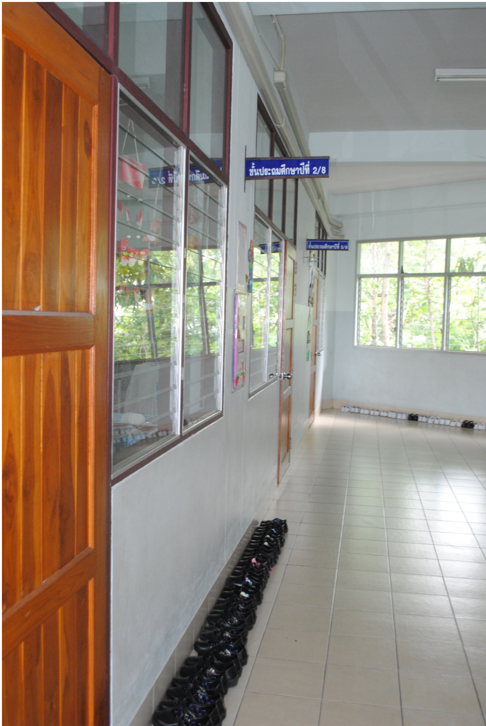
ความสะอาดของระเบียบหน้าห้องและการวางรองเท้าอย่างเป็นระเบียบ