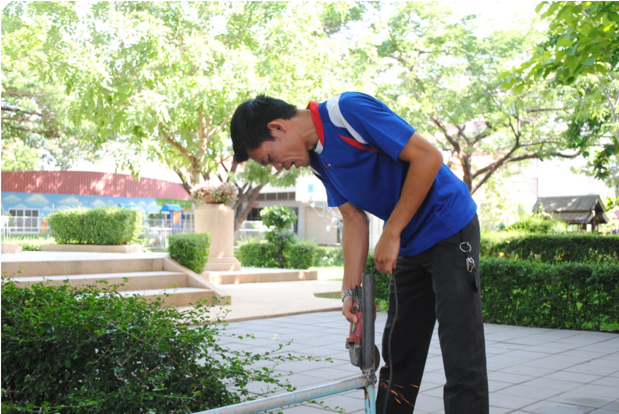
งานซ่อมแซมรั้วสวนหย่อมหน้าเสาธง (งานเหล็ก)