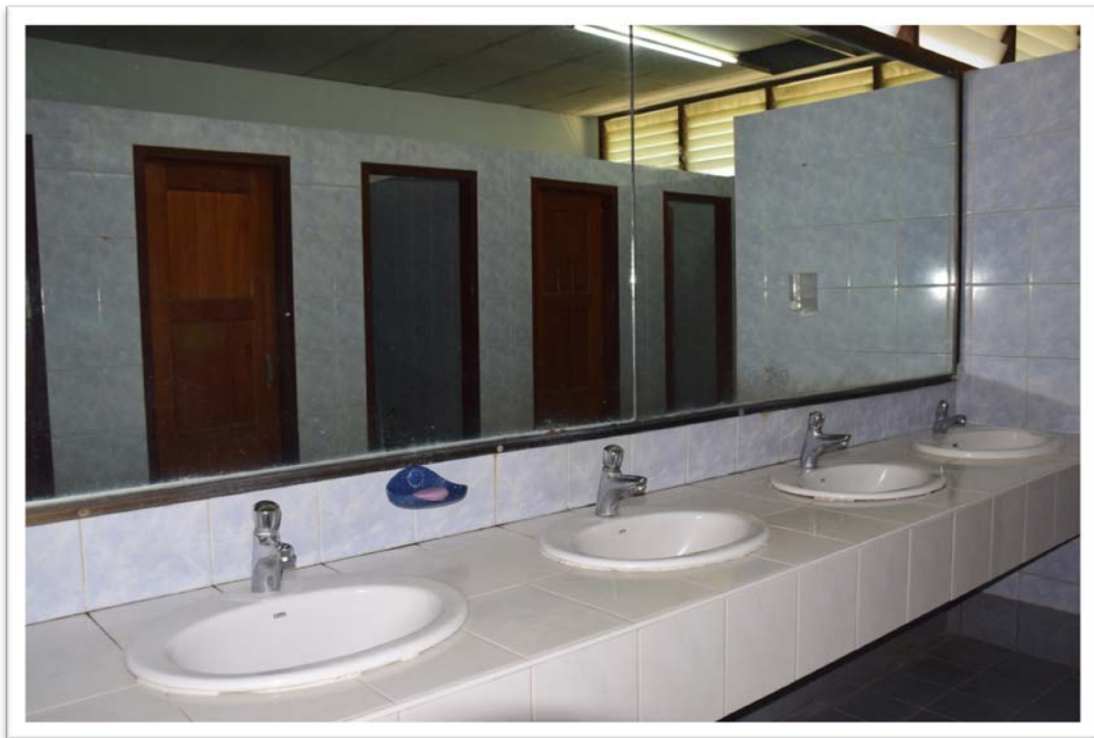
มีระบบสิ่งอำนวยความสะดวก (สบู่ล้างมือ)