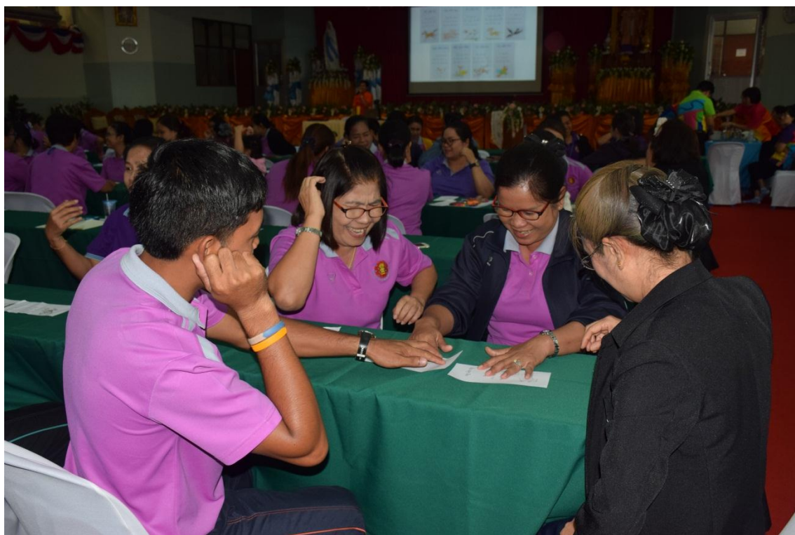
การจัดการเรียนการสอนแบบ BBL