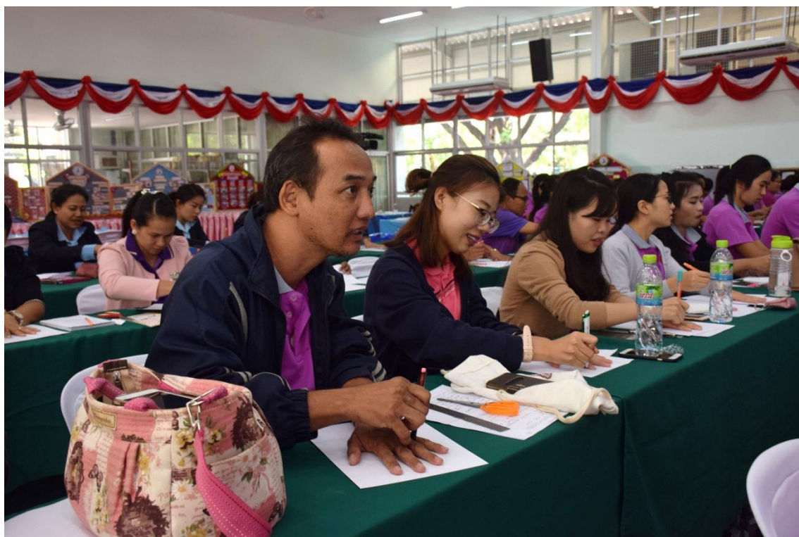
การจัดการเรียนการสอนแบบ BBL