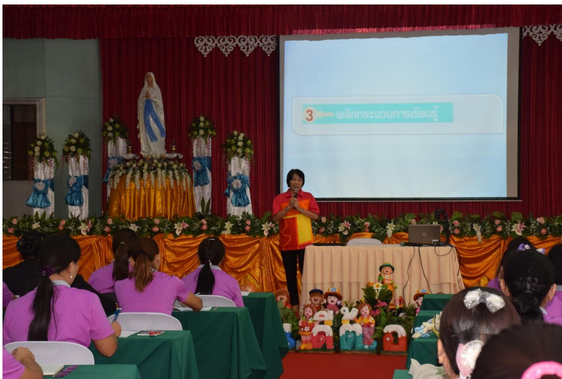
วิทยากรบรรยาย การจัดการเรียนการสอนแบบ BBL