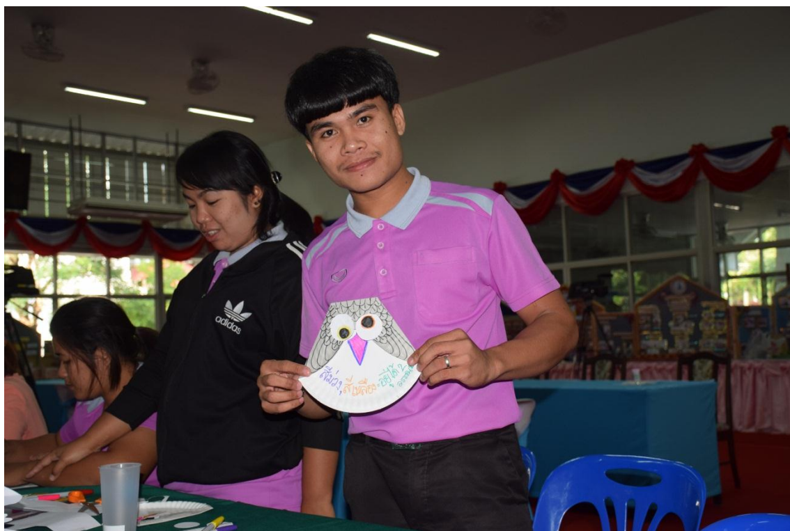
การจัดการเรียนการสอนแบบ BBL