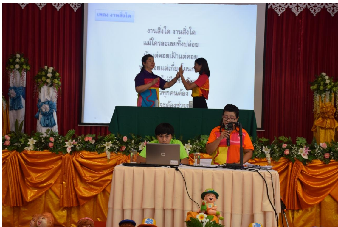
การจัดการเรียนการสอนแบบ BBL