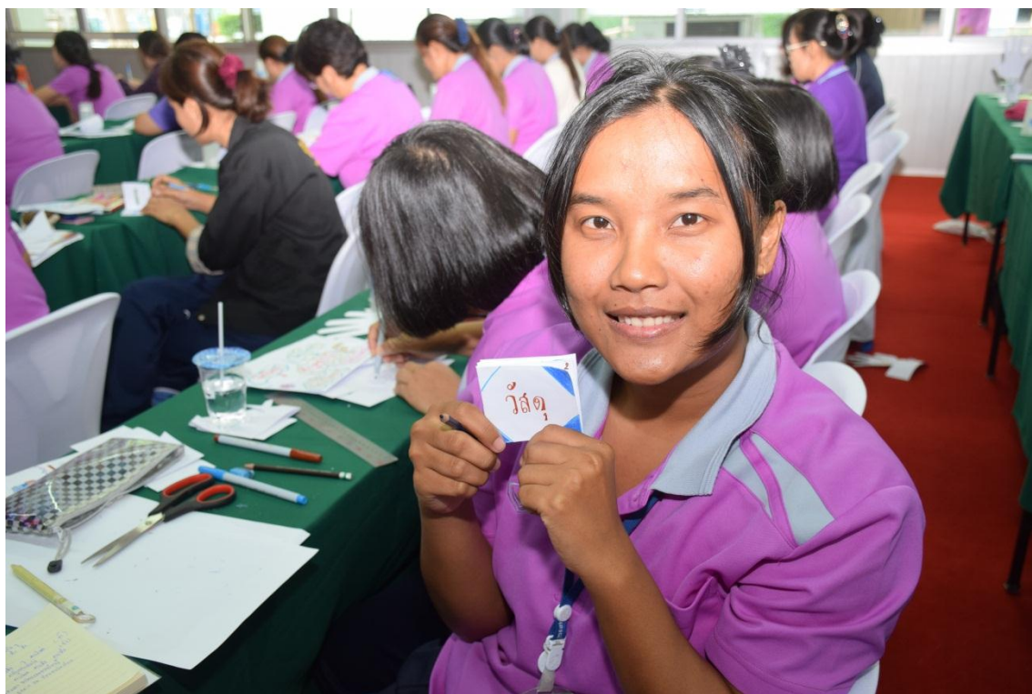
การจัดการเรียนการสอนแบบ BBL