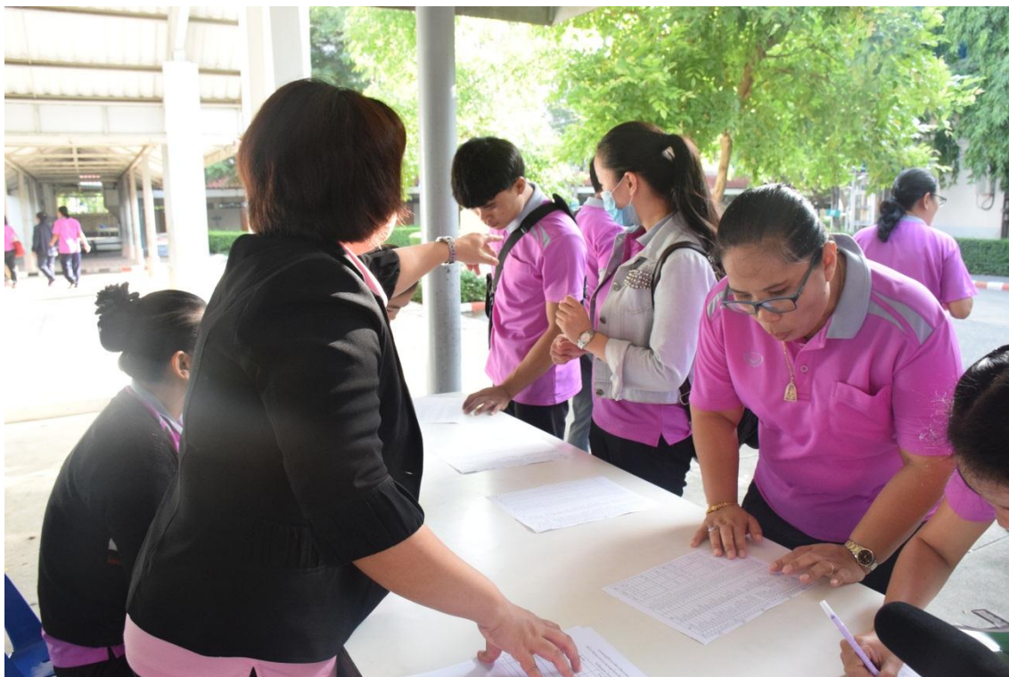
คณะครูลงทะเบียนอบรม