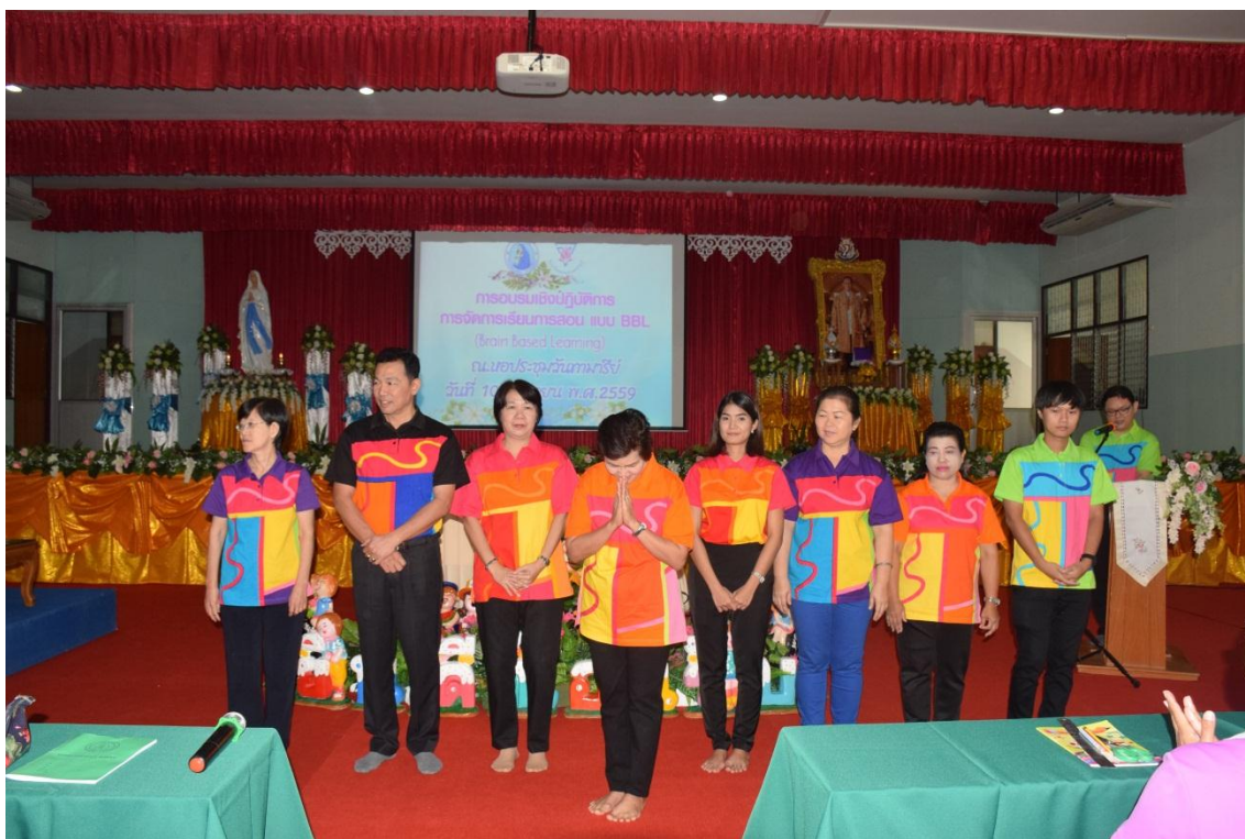
คณะวิทยากรจาก โรงเรียนอนุบาลชลบุรี