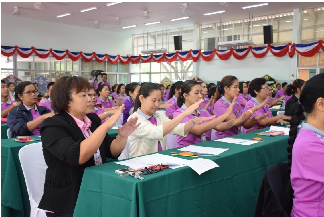
การจัดการเรียนการสอนแบบ BBL