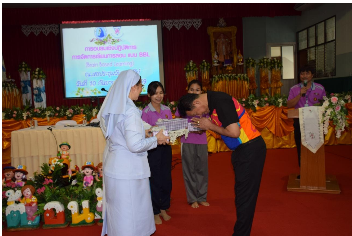
กล่าวขอบคุณวิทยากร