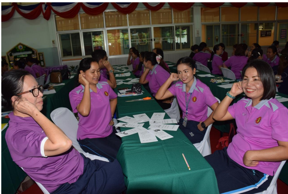
การจัดการเรียนการสอนแบบ BBL