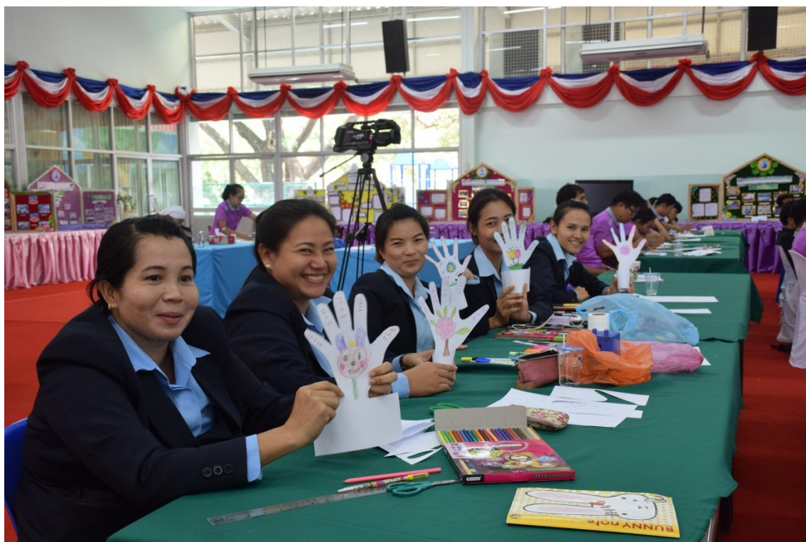
การจัดการเรียนการสอนแบบ BBL