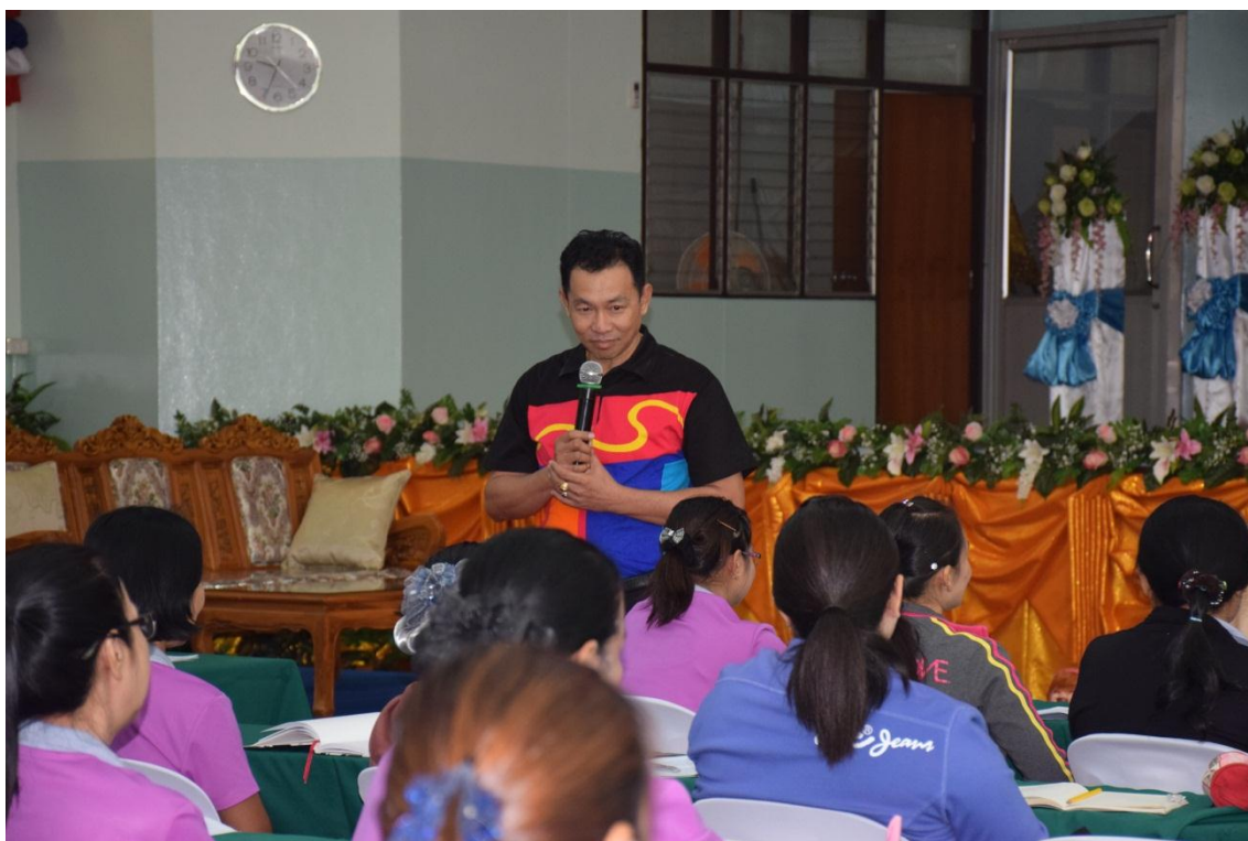
วิทยากรเตรียมความพร้อมก่อนเริ่มการอบรม