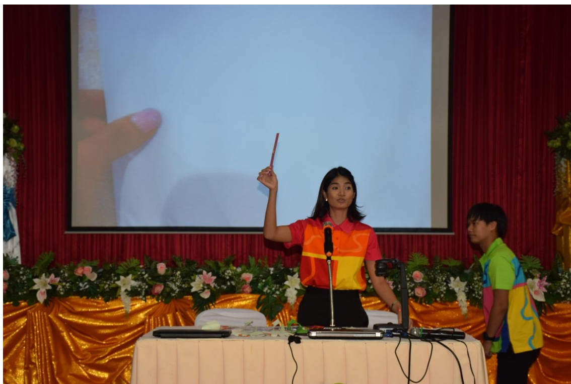
การจัดการเรียนการสอนแบบ BBL