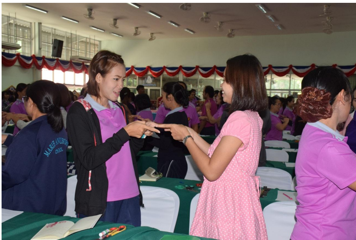
คณะครูทำกิจกรรมเตรียมความพร้อมก่อนการอบรม