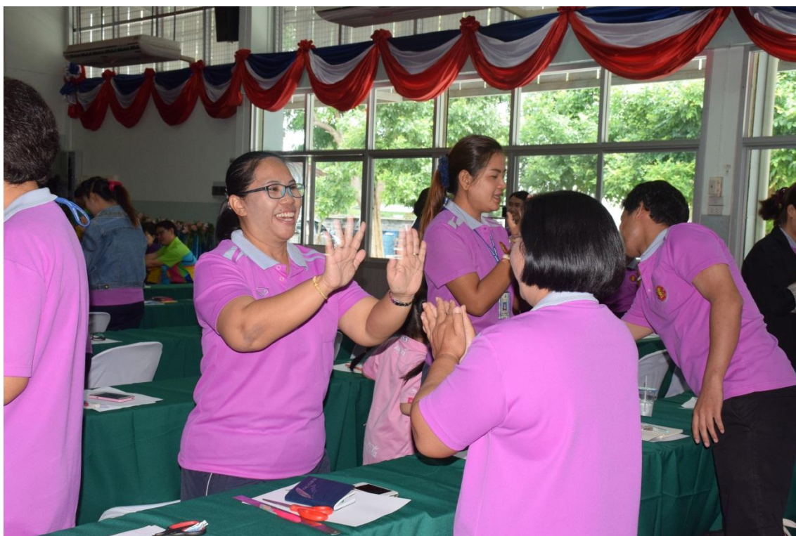
คณะครูทำกิจกรรมเตรียมความพร้อมก่อนการอบรม