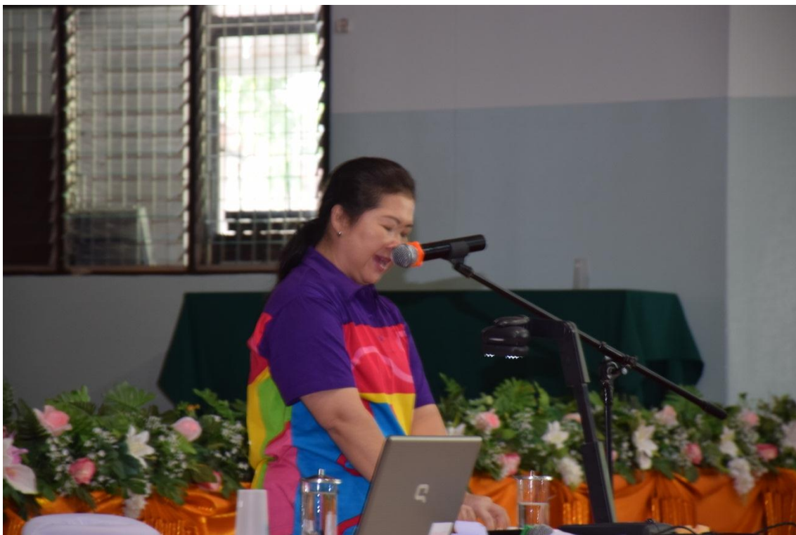
การจัดการเรียนการสอนแบบ BBL