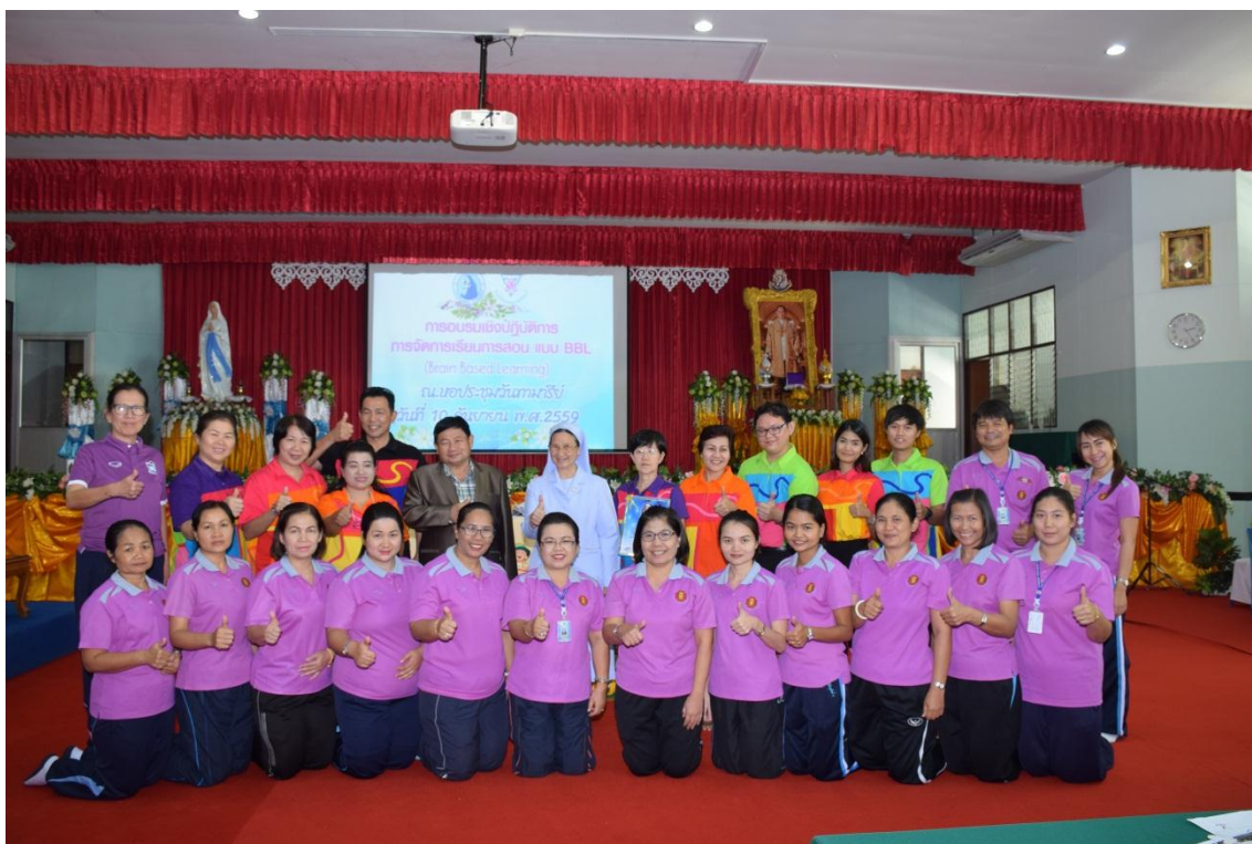
ถ่ายภาพร่วมกับกับวิทยากร