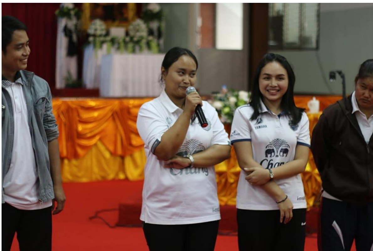
กิจกรรมลงมือปฏิบัติการเรียนการสอนด้วยหลากหลายวิธีการสอนและเทคนิคการสอน