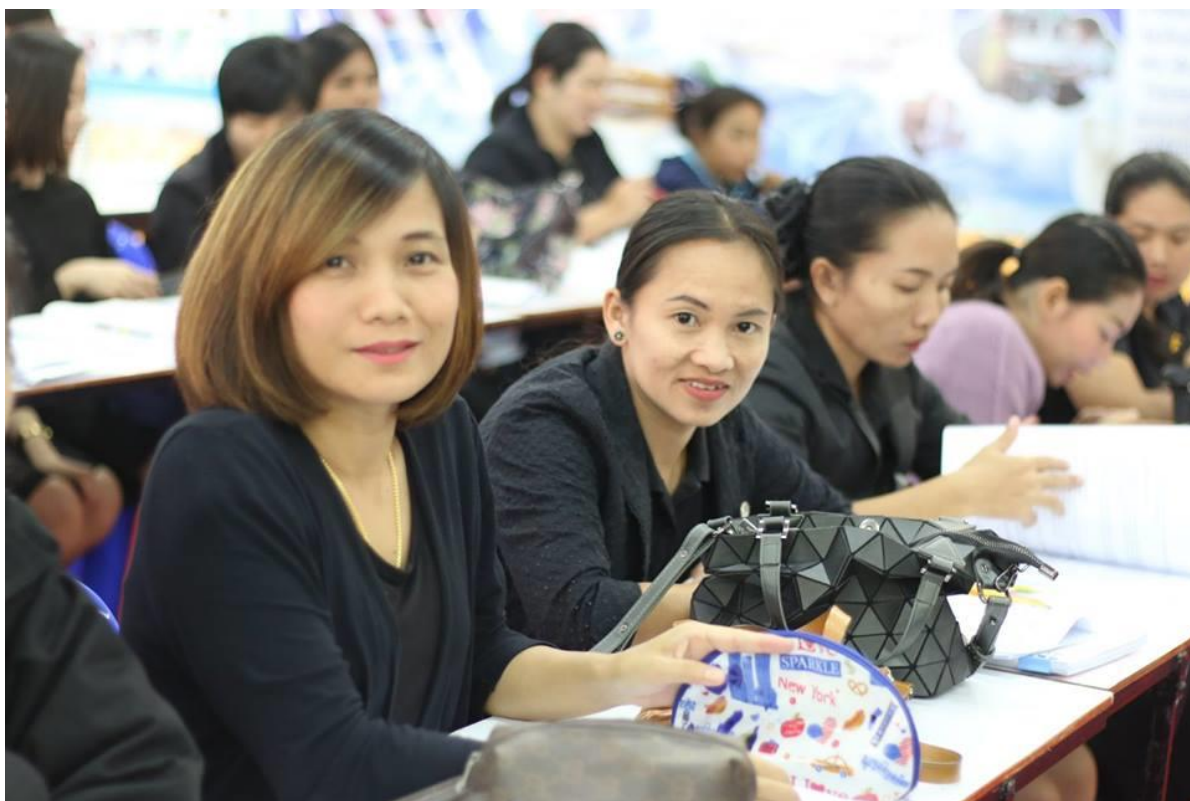
คณะครูเข้าร่วมอบรมด้วยความสนใจและตั้งใจเป็นอย่างดี