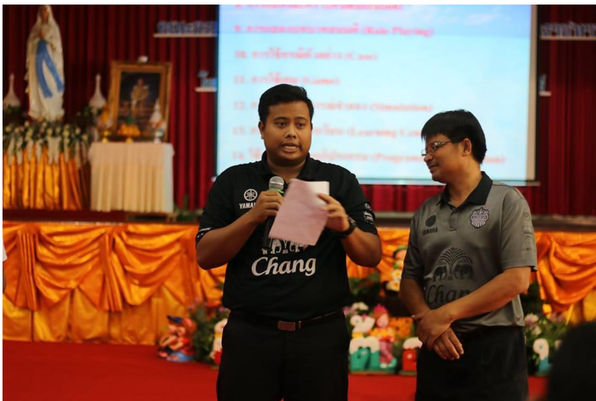
กิจกรรมลงมือปฏิบัติการเรียนการสอนด้วยหลากหลายวิธีการสอนและเทคนิคการสอน