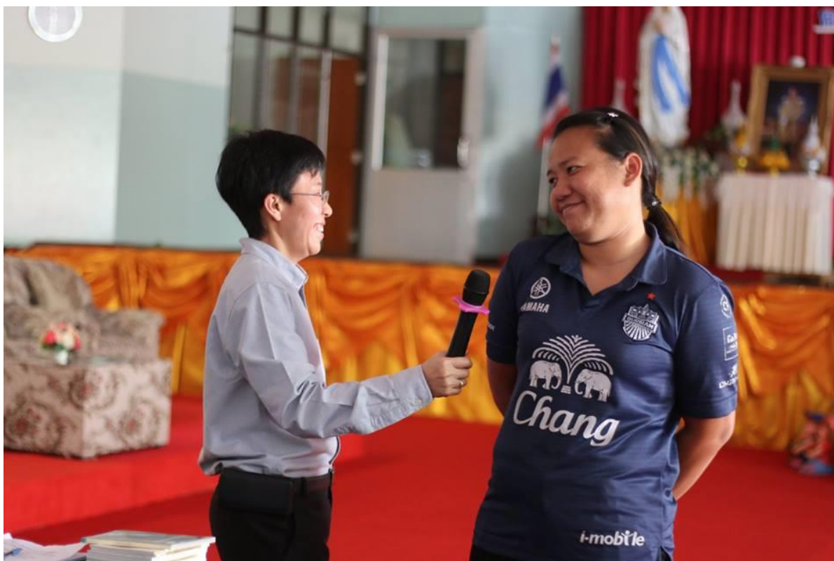
กิจกรรมลงมือปฏิบัติการเรียนการสอนด้วยหลากหลายวิธีการสอนและเทคนิคการสอน