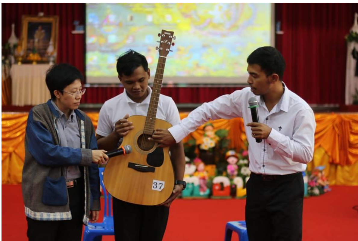
กิจกรรมลงมือปฏิบัติการเรียนการสอนด้วยหลากหลายวิธีการสอนและเทคนิคการสอน