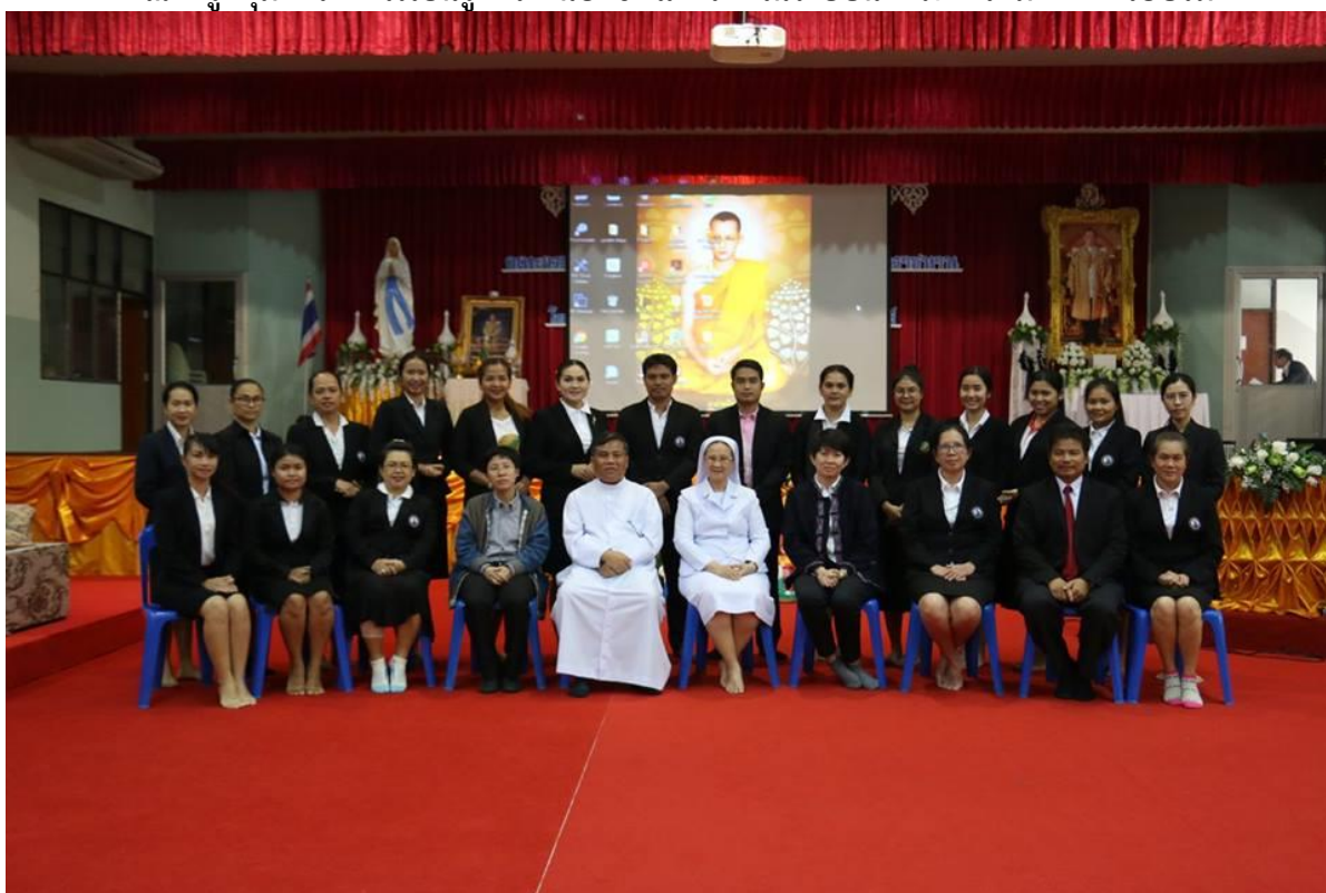
คณะครูกลุ่มสาระการเรียนรู้ภาษาต่างประเทศบันทึกภาพรวมหลังการอบรม