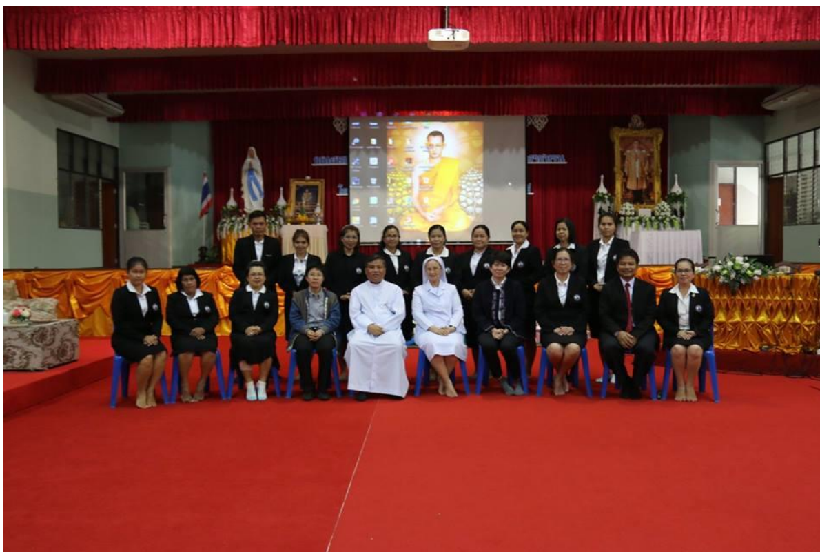
คณะกรรมการการเรียนรู้ภาษาไทยบัณฑิตภาพรวมหลังการอบรม