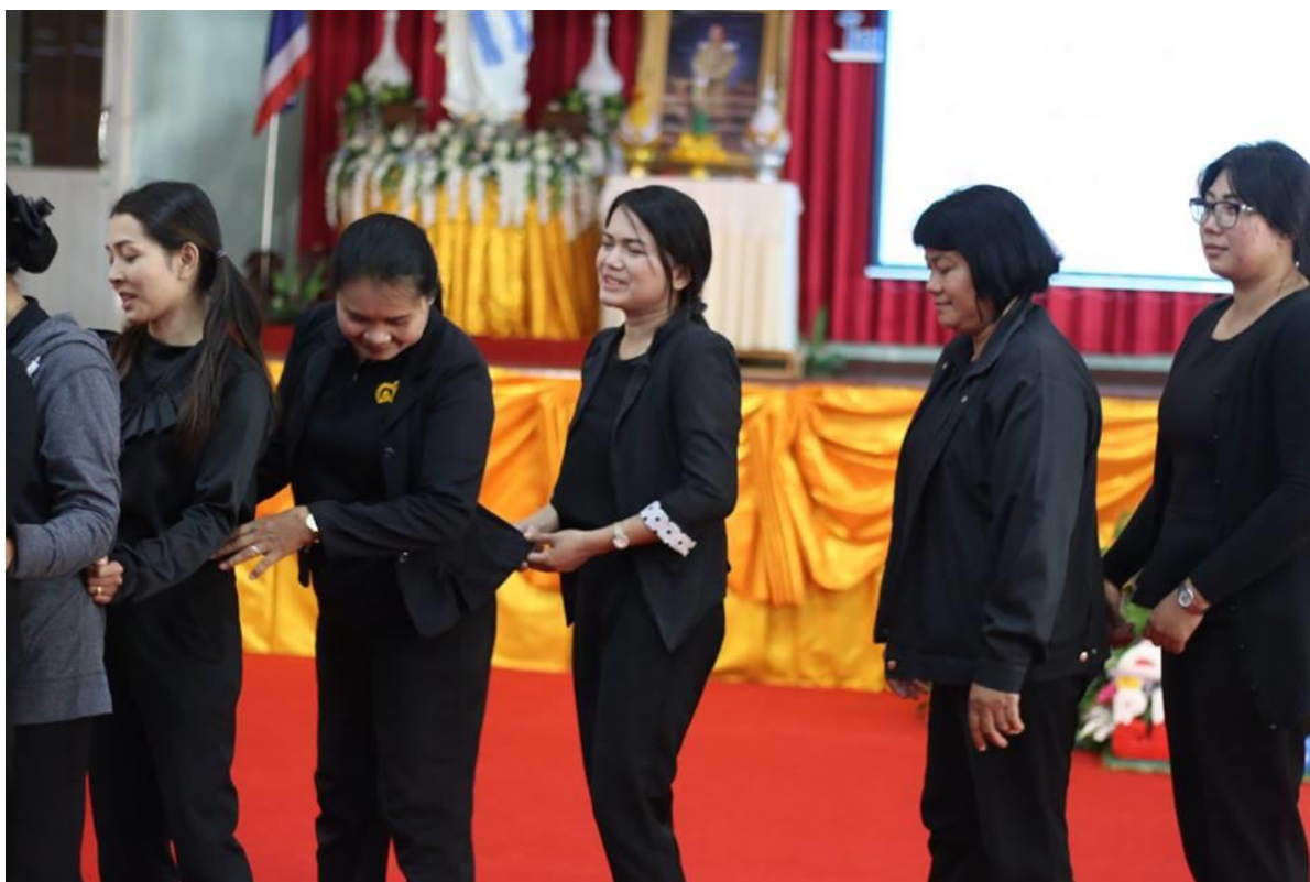
กิจกรรมลงมือปฏิบัติการเรียนการสอนด้วยหลากหลายวิธีการสอนและเทคนิคการสอน