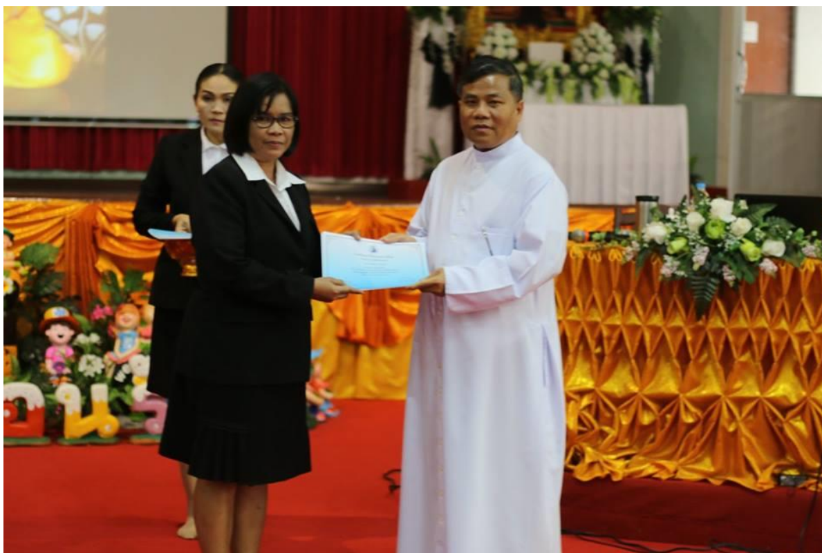
พิธีมอบเกียรติบัตรให้ครูผู้การอบรม “การพัฒนาวิธีการสอนและเทคนิคการสอนให้มีประสิทธิภาพ”