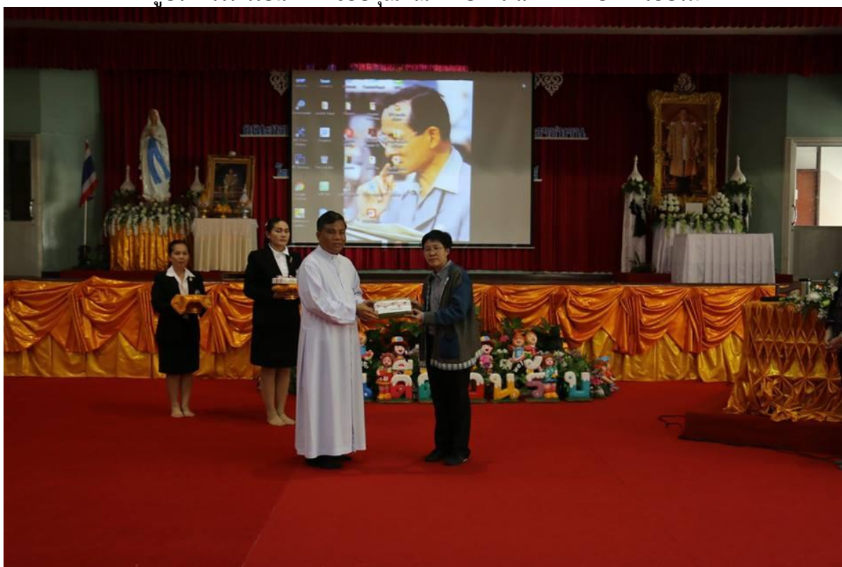
คณะผู้บริหารมอบของที่ระลึกให้คณะวิทยากร