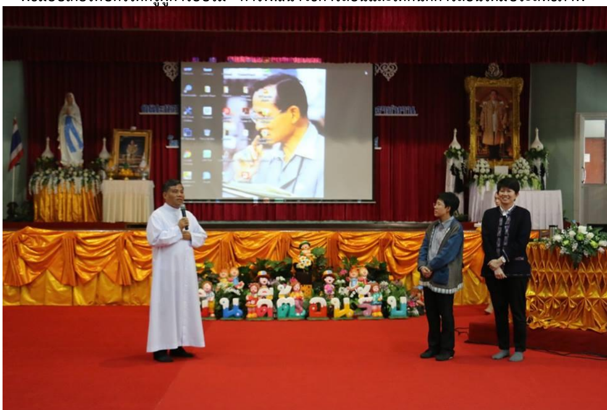
ผู้บริหารโรงเรียนกล่าวขอบคุณคณะวิทยากร และกล่าวปิดการอบรม