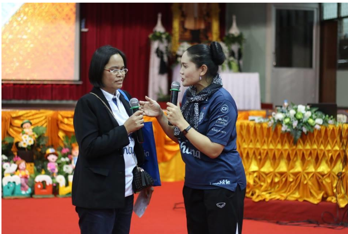
กิจกรรมลงมือปฏิบัติการเรียนการสอนด้วยหลากหลายวิธีการสอนและเทคนิคการสอน