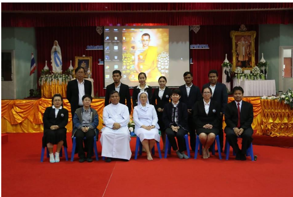
คณะกรรมการการเรียนรู้ศิลปะบัณฑิตภาพรวมหลังการอบรม