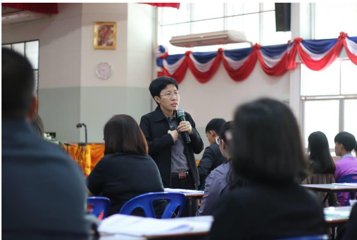
คณะครูเข้าร่วมอบรมด้วยความสนใจและตั้งใจเป็นอย่างดี