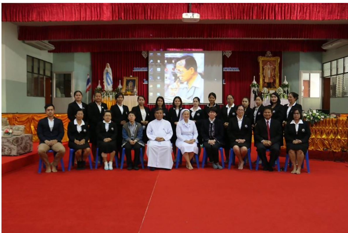
คณะครูกลุ่มสาระคณิตศาสตร์บันทึกภาพรวมหลังการอบรม