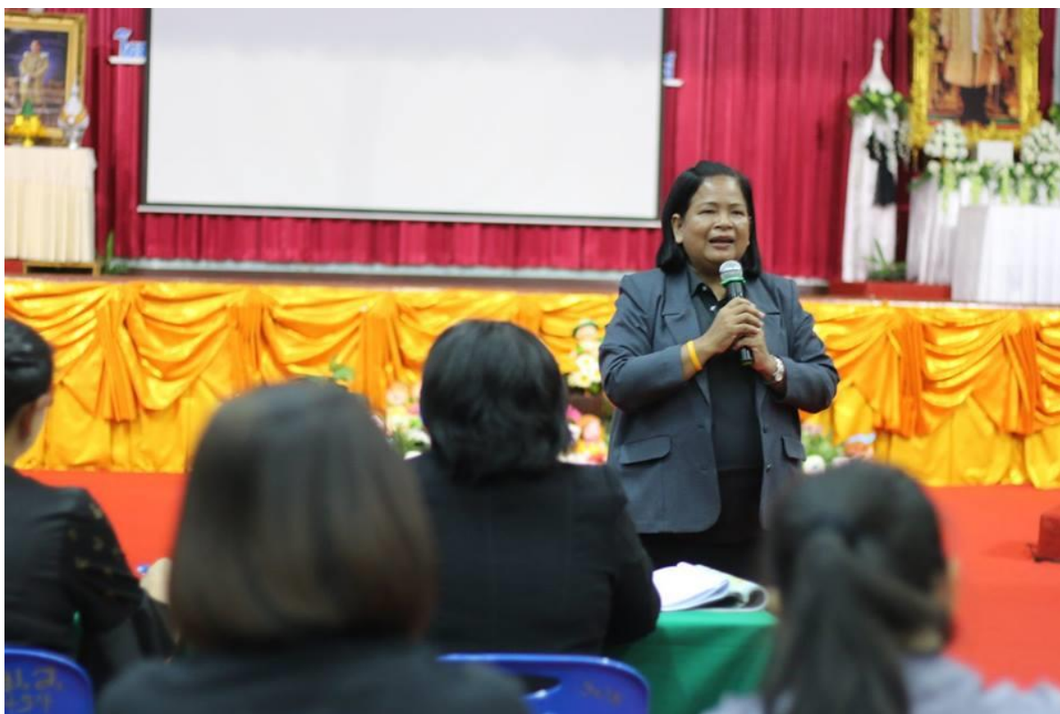
คณะครูผู้เข้าอบรมสาธิตการสอนด้วยวิธีการสอนที่หลากหลาย