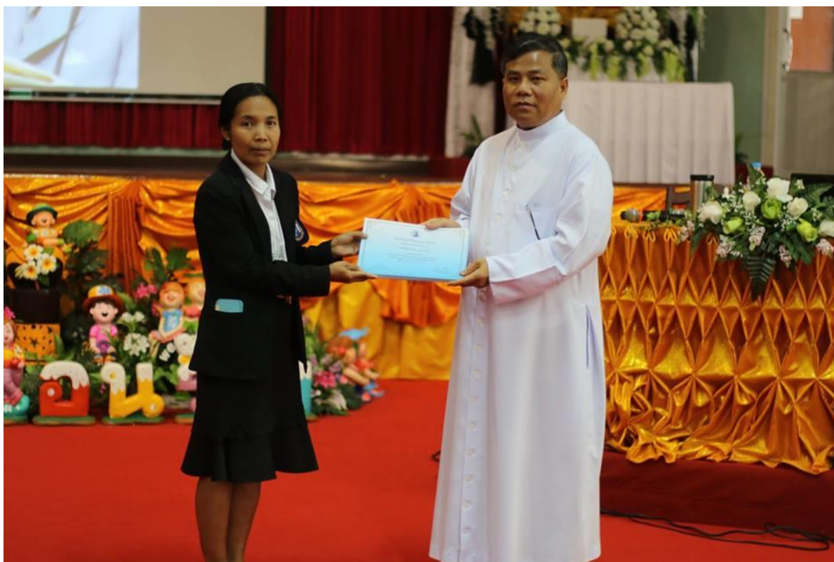
พิธีมอบเกียรติบัตรให้ครูผู้การอบรม “การพัฒนาวิธีการสอนและเทคนิคการสอนให้มีประสิทธิภาพ”