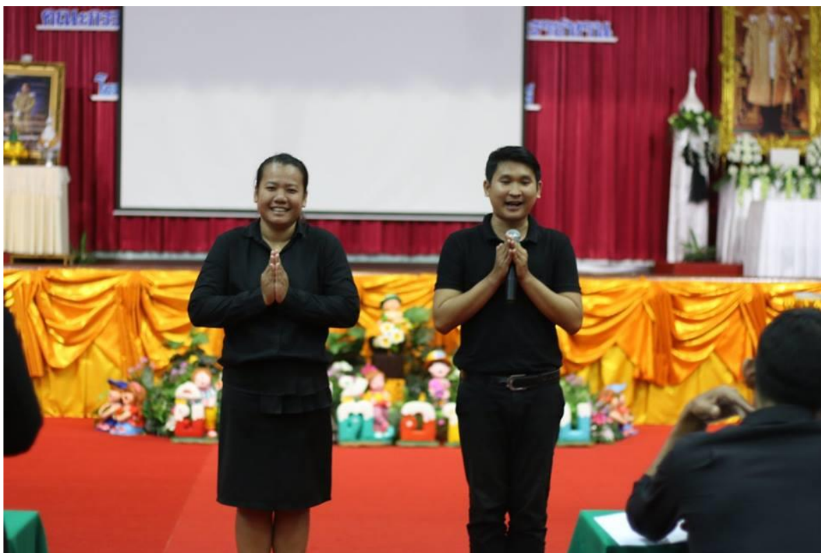
คณะครูผู้เข้าอบรมสาธิตการสอนด้วยวิธีการสอนที่หลากหลาย