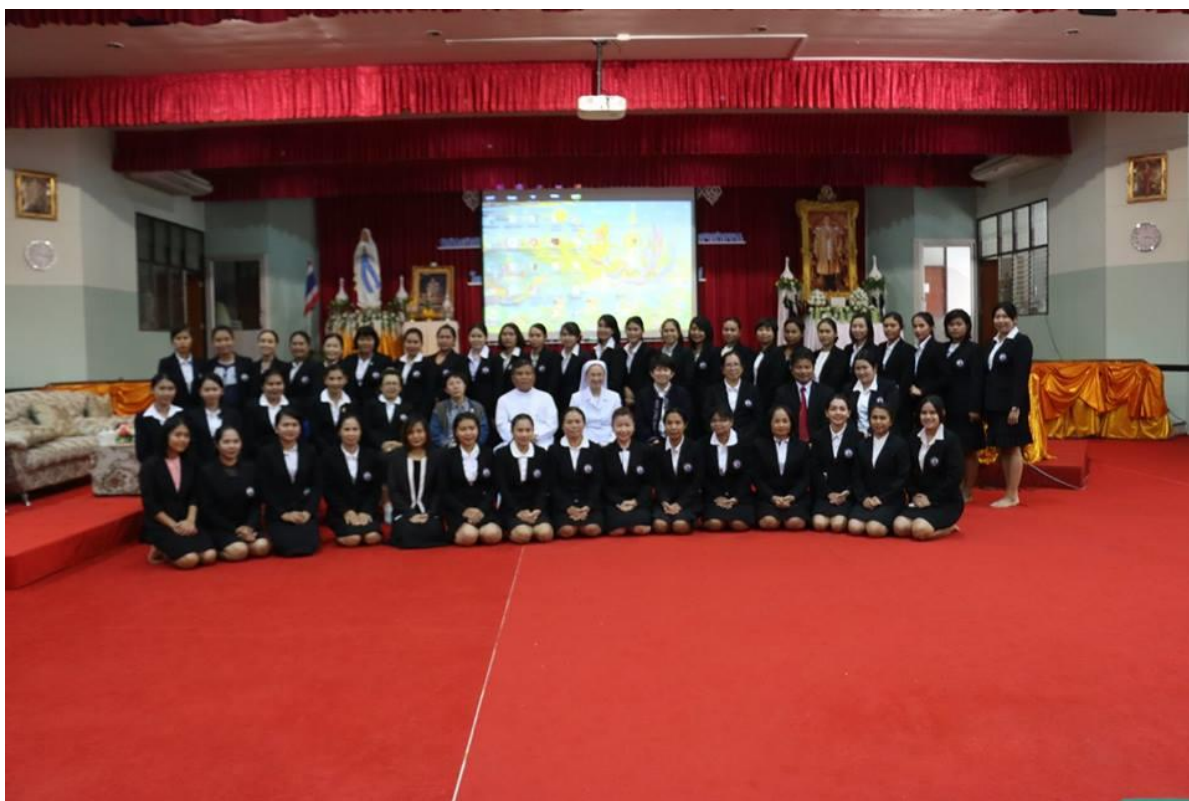
คณะกรรมการศึกษาปฐมวัยบัณฑิตภาพรวมหลังการอบรม