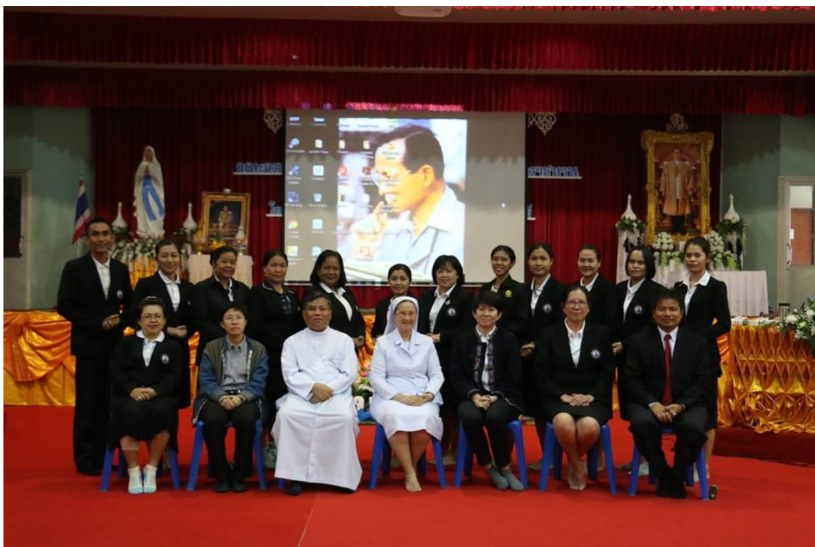
คณะครูกลุ่มสาระการเรียนรู้วิทยาศาสตร์บัณฑิตภาพรวมหลังการอบรม