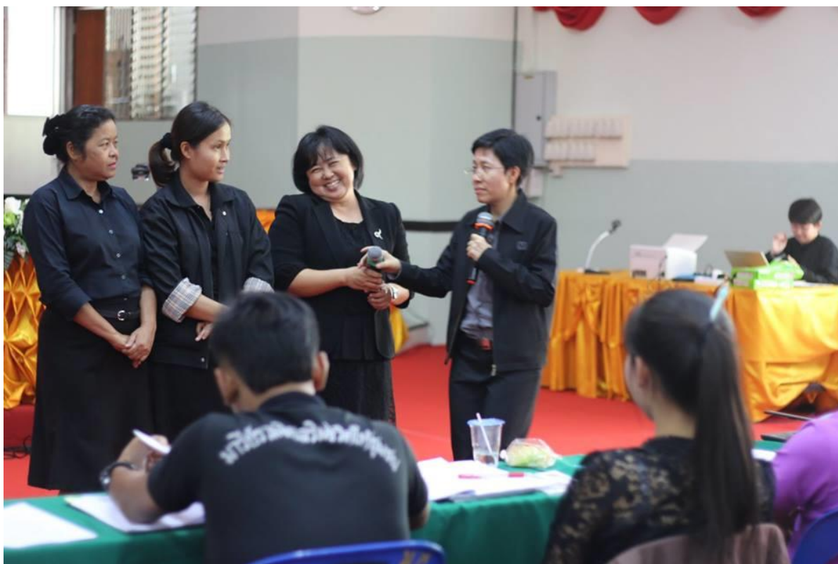
คณะวิทยากร ให้ความรู้เพิ่มเติมเป็นรายกลุ่ม