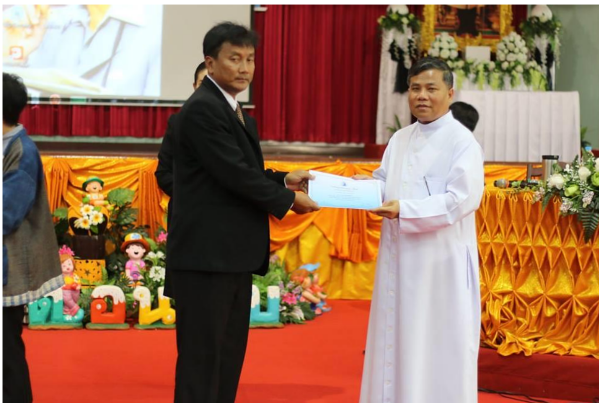
พิธีมอบเกียรติบัตรให้ครูผู้การอบรม “การพัฒนาวิธีการสอนและเทคนิคการสอนให้มีประสิทธิภาพ”