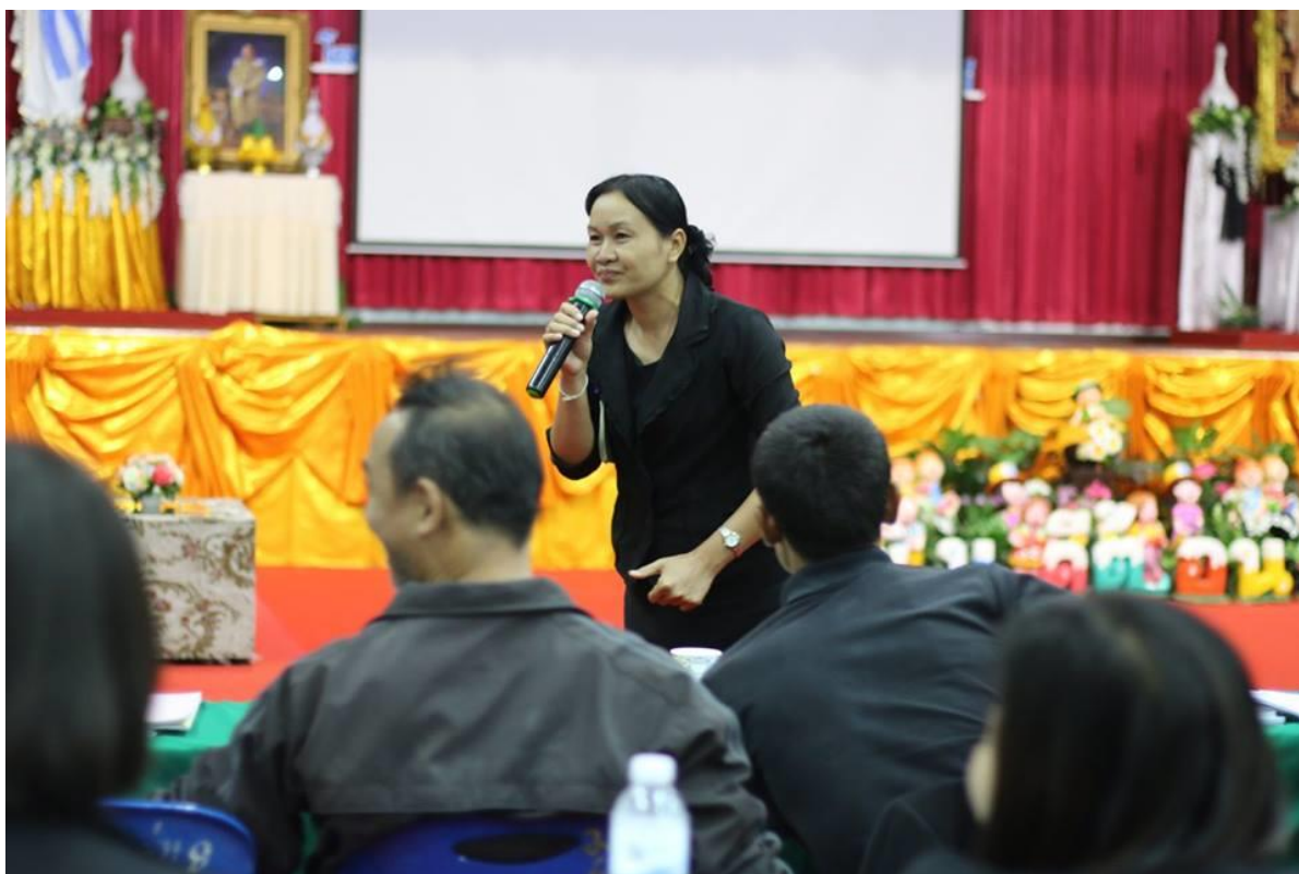
คณะครูผู้เข้าอบรมสาธิตการสอนด้วยวิธีการสอนที่หลากหลาย