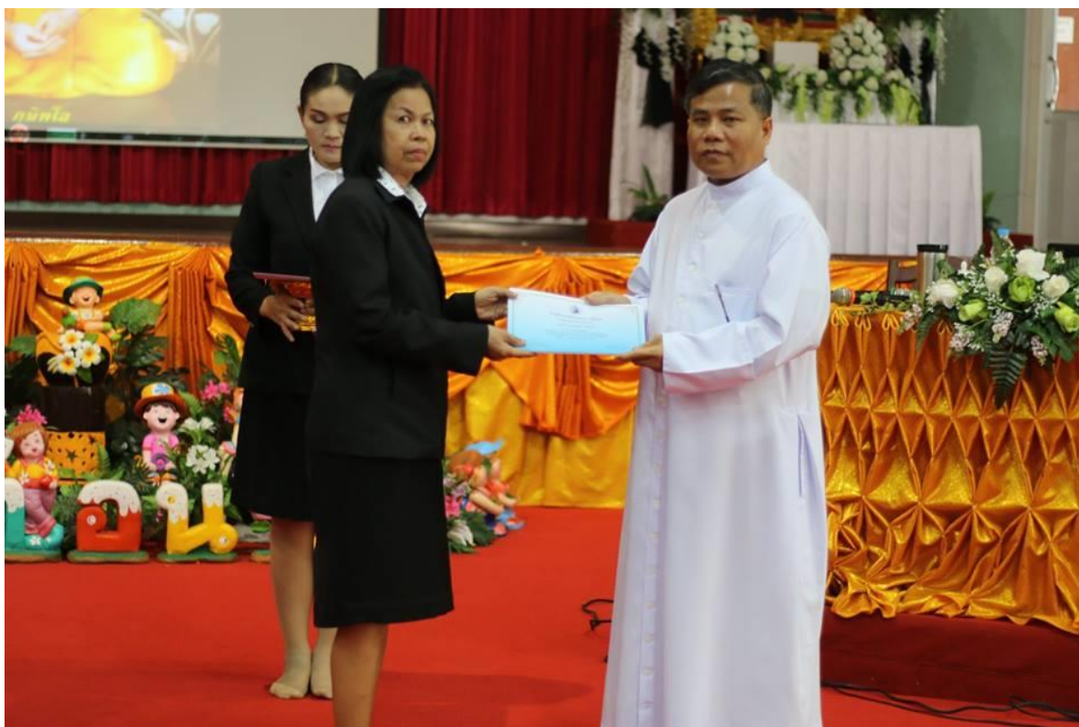
พิธีมอบเกียรติบัตรให้ครูผู้การอบรม “การพัฒนาวิธีการสอนและเทคนิคการสอนให้มีประสิทธิภาพ”