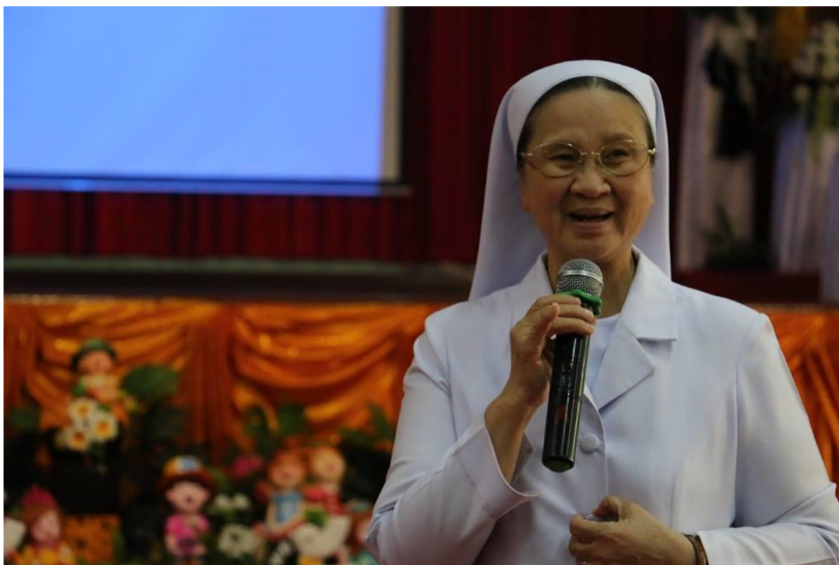
ผู้บริหารโรงเรียนกล่าวขอบคุณคณะวิทยากร และกล่าวปิดการอบรม