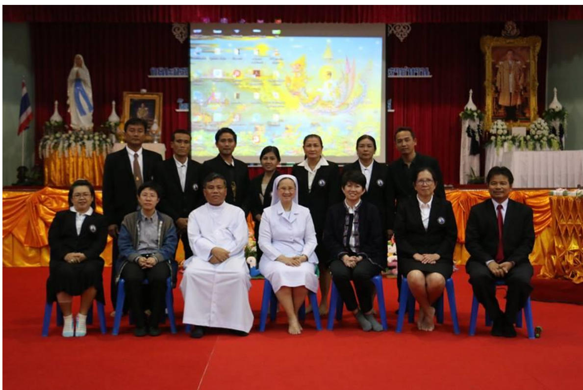
คณะครูกลุ่มสาระการเรียนรู้พลศึกษาและสุขศึกษาบัณฑิตภาพรวมหลังการอบรม