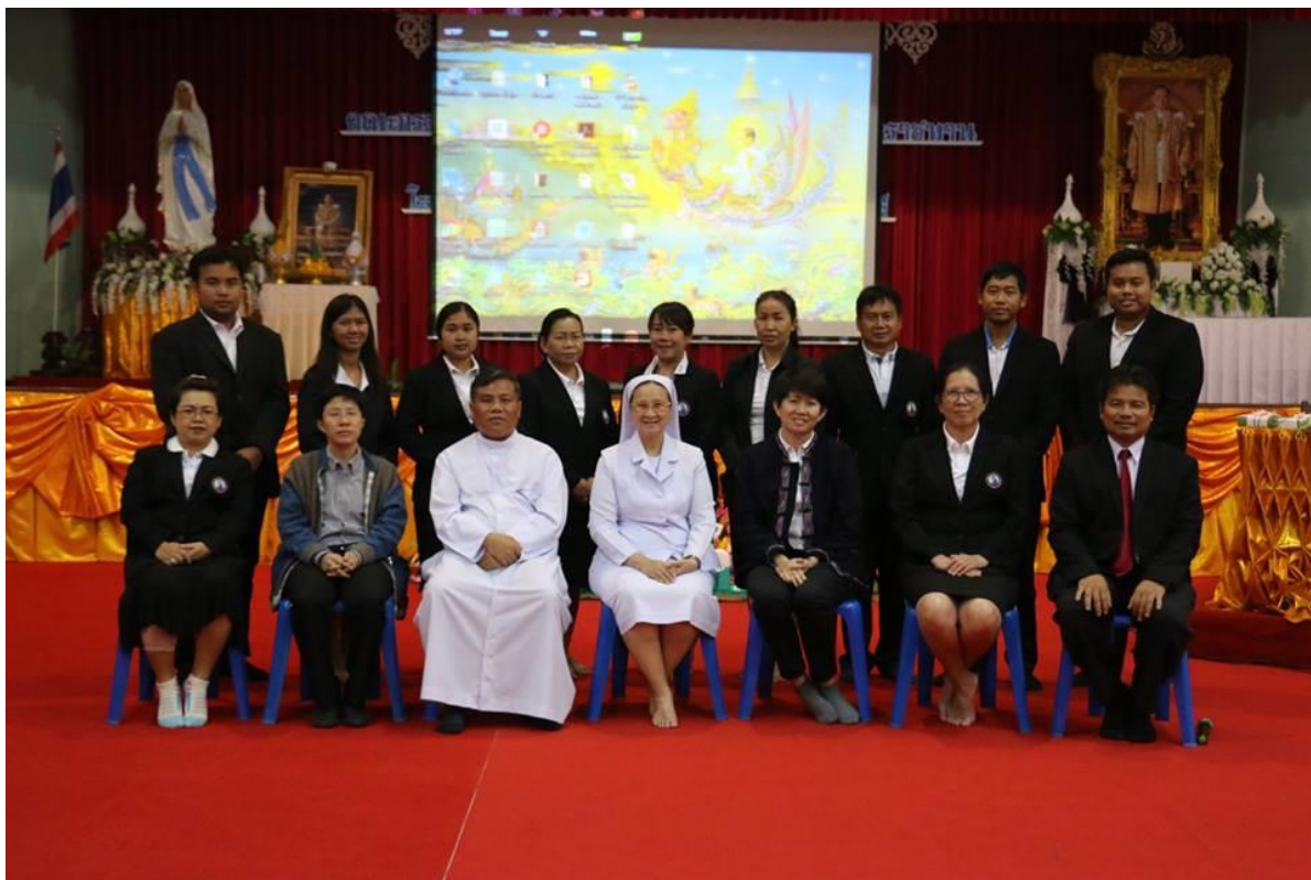
คณะครูกลุ่มสาระการเรียนรู้การงานอาชีพและเทคโนโลยีบันทึกภาพรวมหลังการอบรม