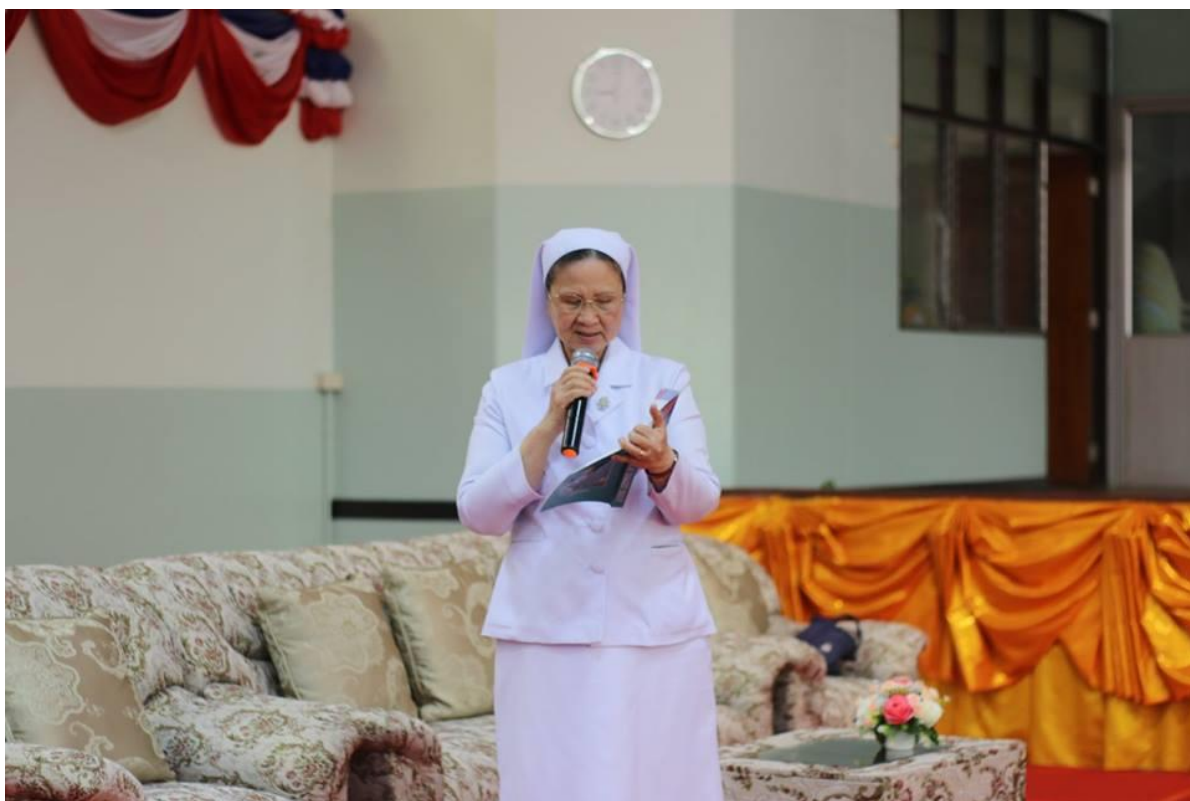
พิธีเปิดการอบรมเชิงปฏิบัติการ