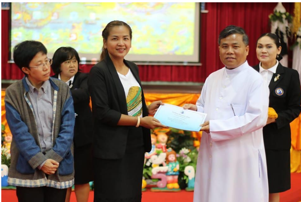
พิธีมอบเกียรติบัตรให้ครูผู้การอบรม “การพัฒนาวิธีการสอนและเทคนิคการสอนให้มีประสิทธิภาพ”