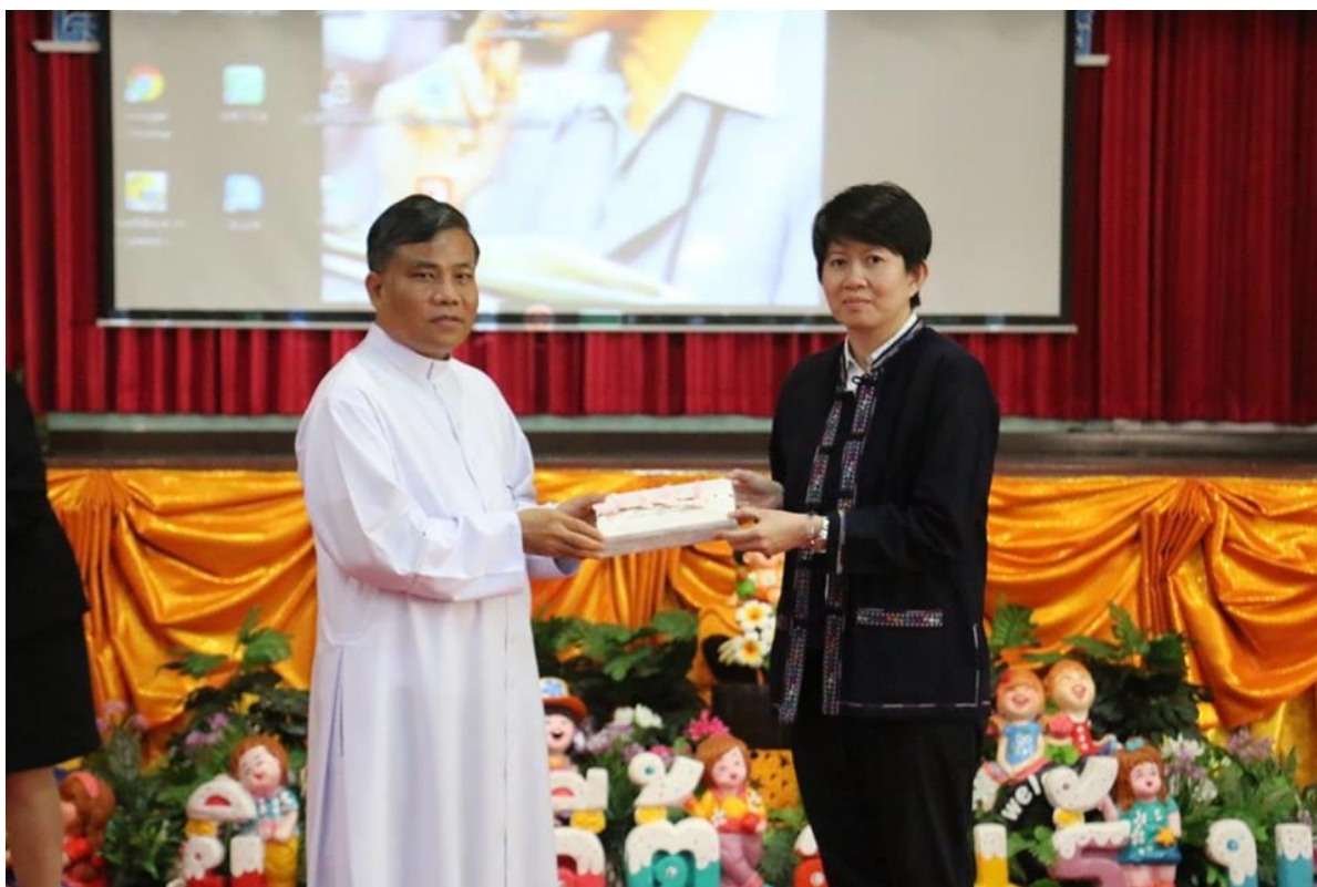
คณะผู้บริหารมอบของที่ระลึกให้คณะวิทยากร