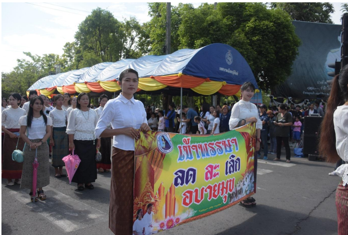
นักเรียนที่เข้าร่วมกิจกรรมสืบสานประเพณีไทยในครั้งนี้