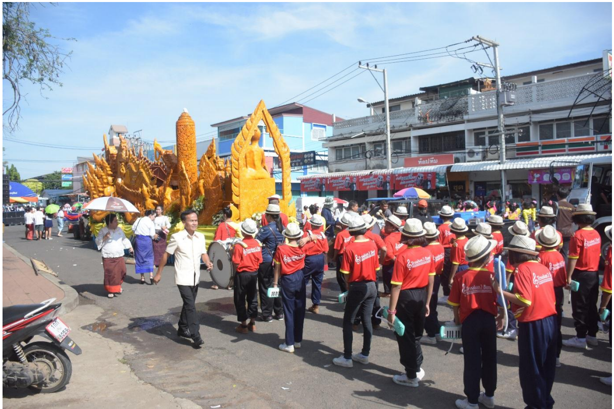
ขบวนนักเรียนของมารีย์อนุสรณ์มีแต่งงดงามครับ