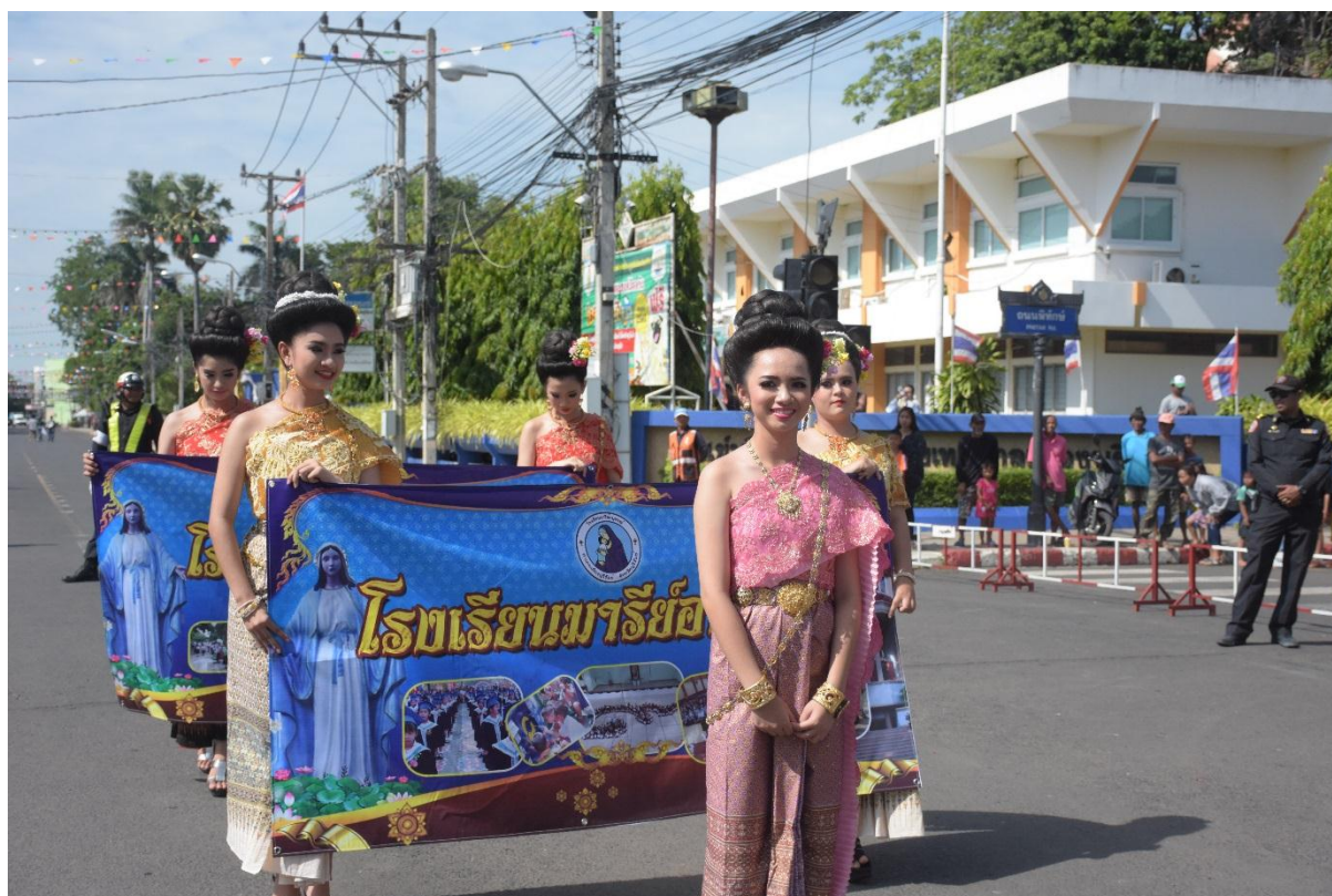
นักเรียนที่เข้าร่วมกิจกรรมสืบสานประเพณีไทยในครั้งนี้