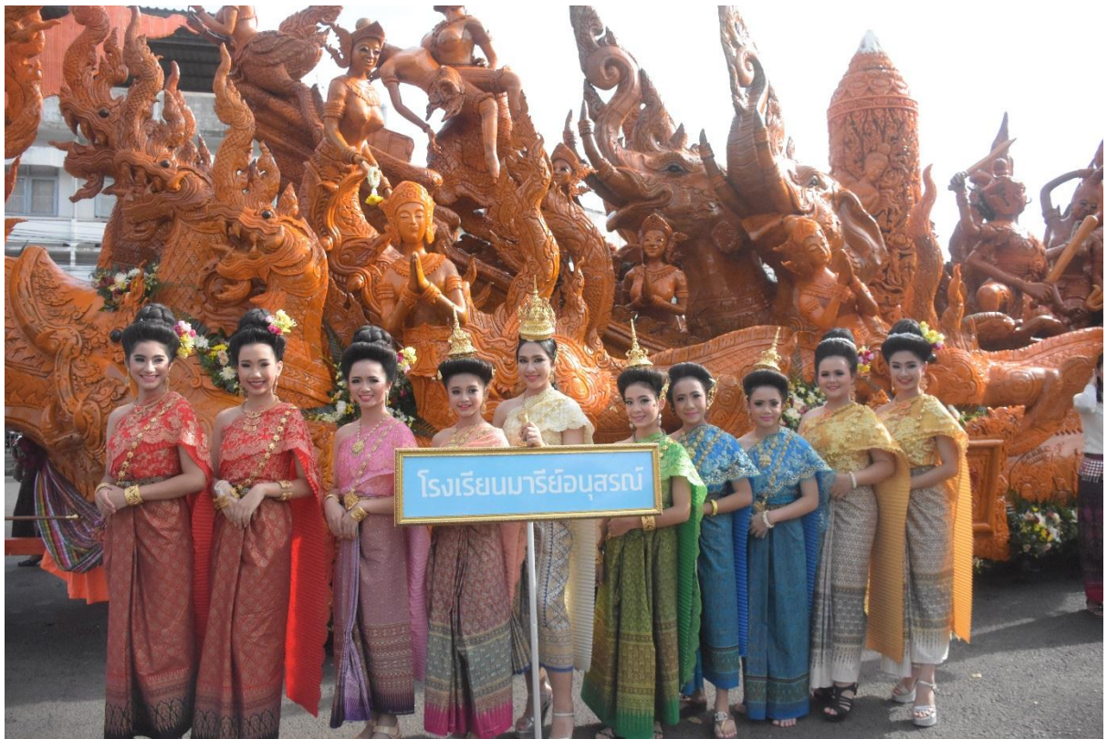
ภาพบรรยากาศที่ถ่ายกับต้นเทียนชุมชนวัดหนองไผ่น้อยงดงามจริง ๆ