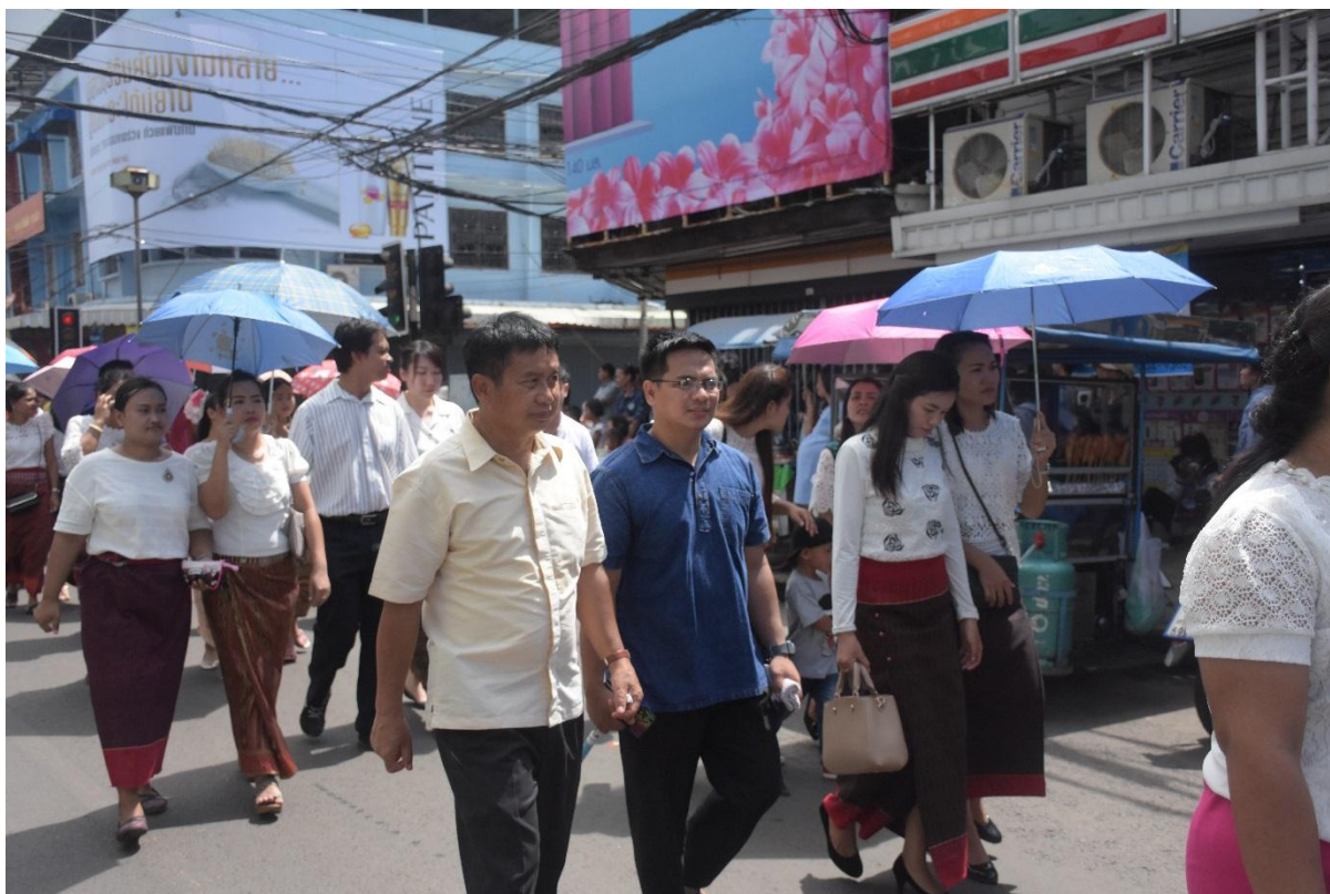
คณะครูร่วมเดินขบวนเพื่อสืบสานประเพณีไทย”แห่เทียนพรรษา”