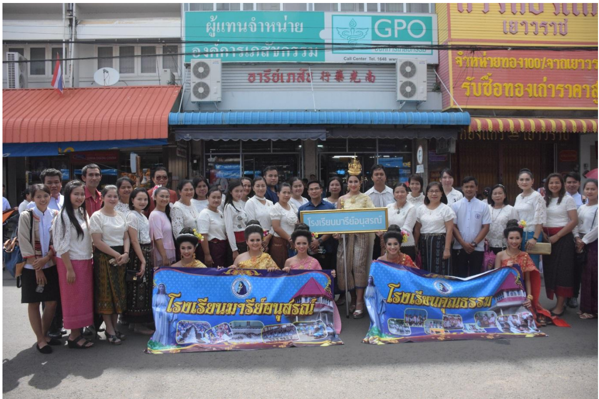
ขบวนในการเดินเพื่อสืบสานประเพณีไทย