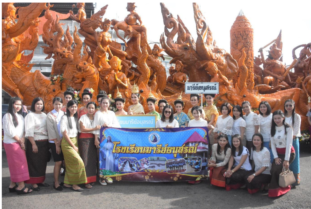
ภาพบรรยากาศที่ถ่ายกับต้นเทียนชุมชนวัดหนองไผ่น้อยงดงามจริง ๆ