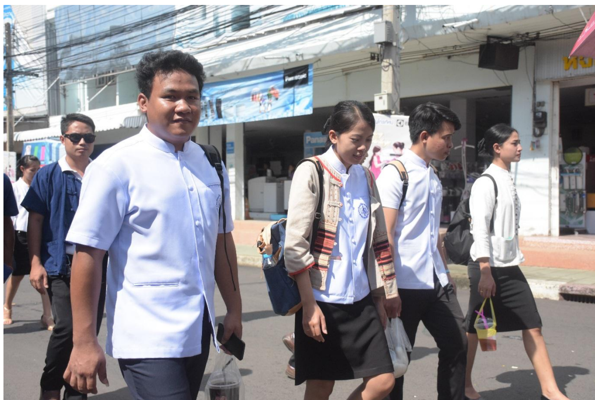
ภาพบรรยากาศการเดินสืบสานประเพณีแห่เทียนพรรษาของเทศบาลเมืองบุรีรัมย์