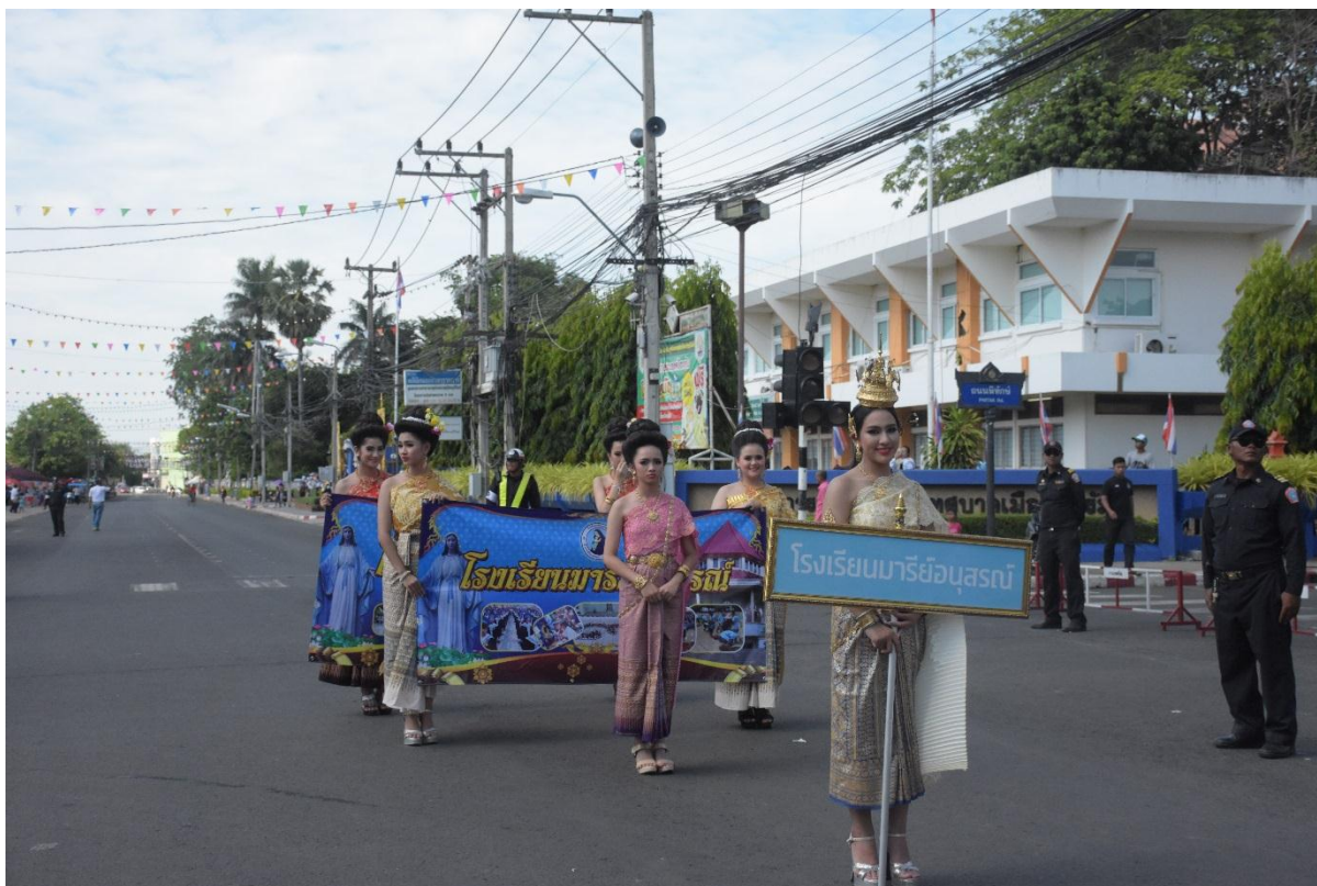
นักเรียนที่เข้าร่วมกิจกรรมสืบสานประเพณีไทยในครั้งนี้