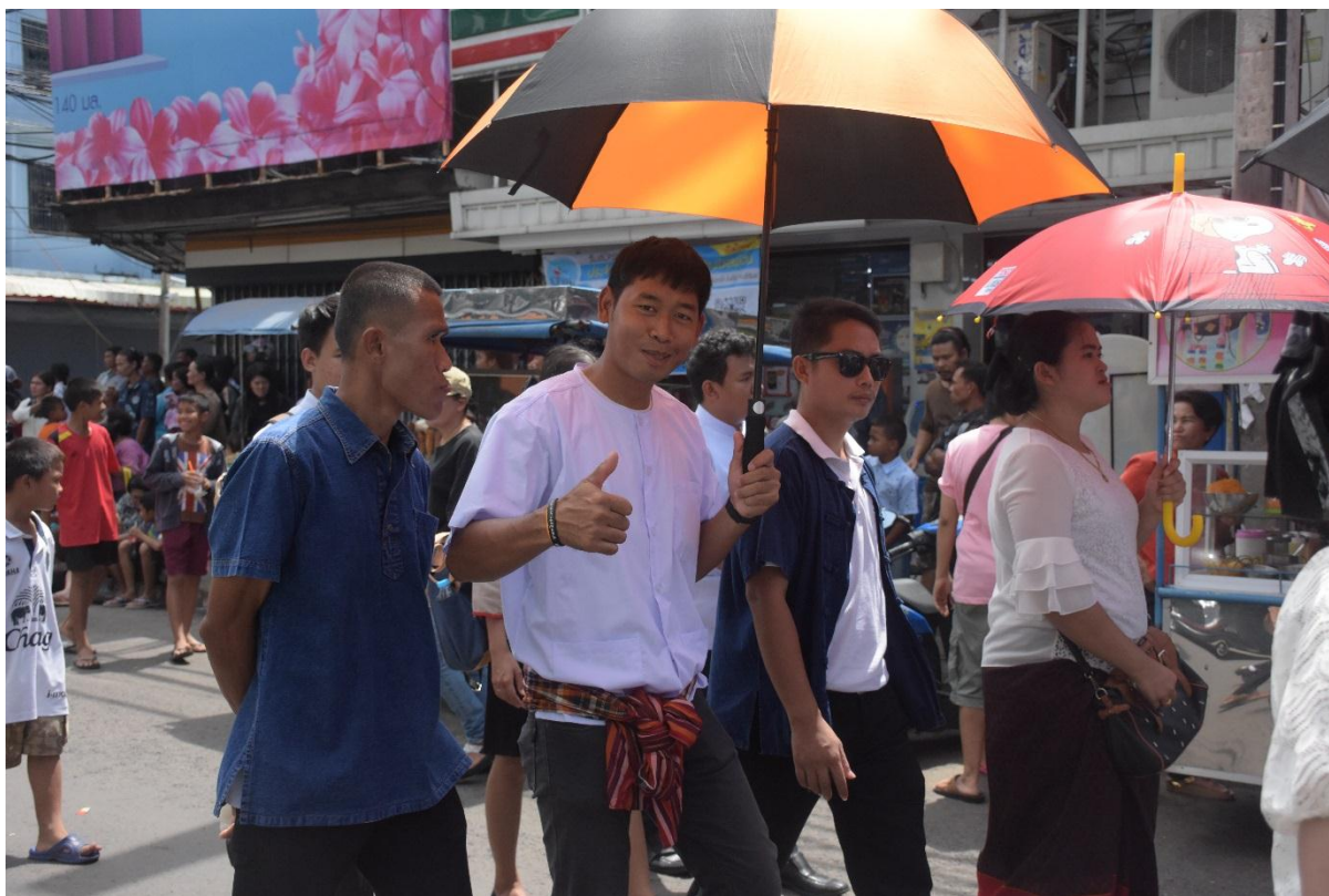
คณะครูร่วมเดินขบวนเพื่อสืบสานประเพณีไทย”แห่เทียนพรรษา”