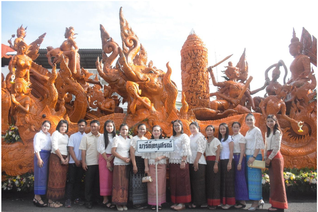
ภาพบรรยากาศที่ถ่ายกับต้นเทียนชุมชนวัดหนองไผ่น้อยงดงามจริง ๆ