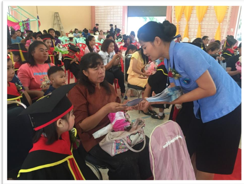
บริการให้ข้อมูลการรับสมัครนักเรียนแก่ผู้ปกครอง