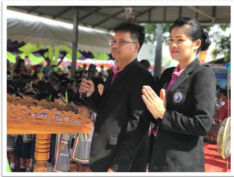
แนะแนวการศึกษาต่อโดย รองผู้อำนวยการโรงเรียนมารีย์อนุสรณ์