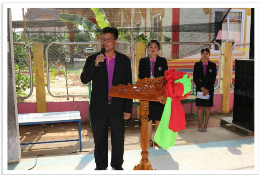
แนะแนวการศึกษาต่อโดย รองผู้อำนวยการโรงเรียนมารีย์อนุสรณ์