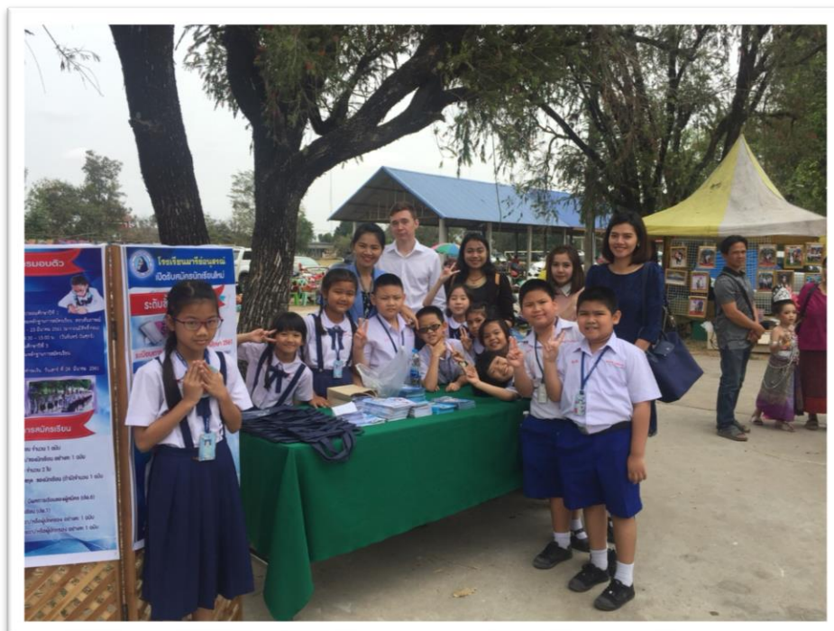
นักเรียนโรงเรียนมารีย์อนุสรณ์ ร่วมประชาสัมพันธ์โรงเรียน