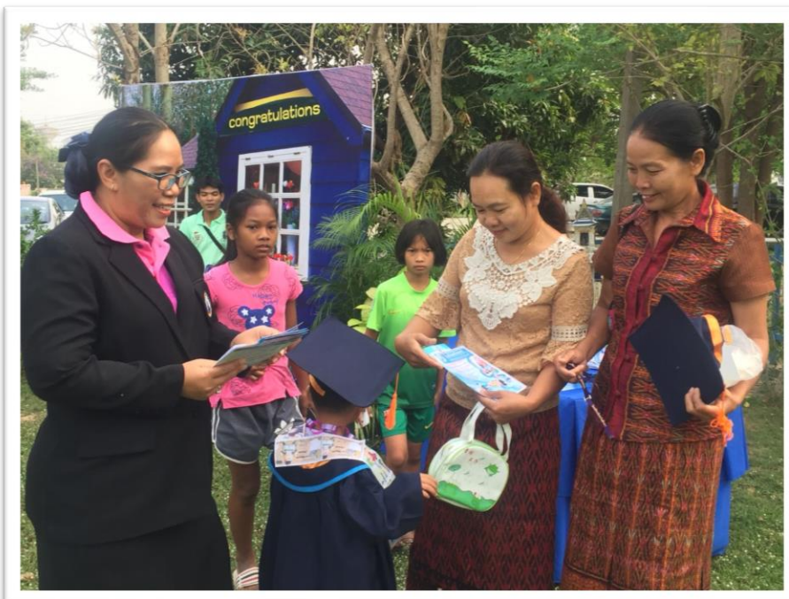
บริการให้ข้อมูลการรับสมัครนักเรียนแก่ผู้ปกครอง