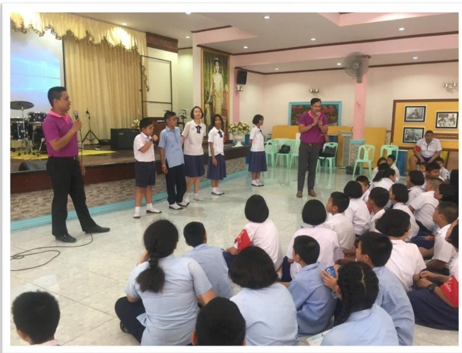
แนะแนวการศึกษาต่อโดยคณะครูโรงเรียนมารีย์อนุสรณ์