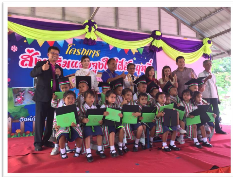
ร่วมสร้างกำลังใจให้นักเรียนที่สำเร็จการศึกษา ระดับก่อนปฐมวัย