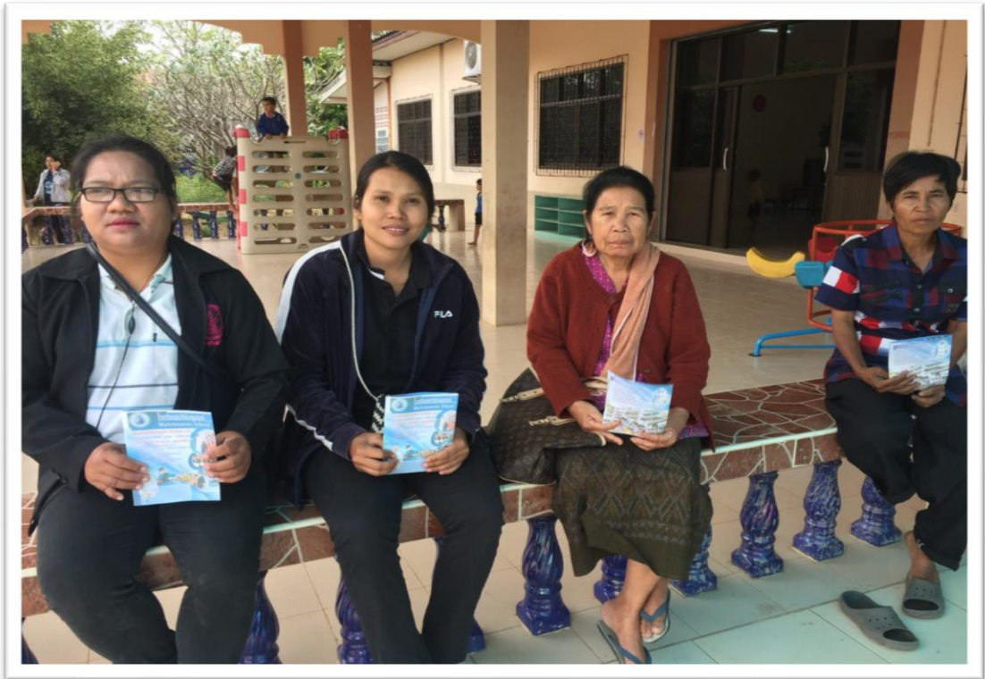
ผู้ปกครองได้รับแผ่นพับ ใบปลิว ในการประชาสัมพันธ์รับสมัครนักเรียน