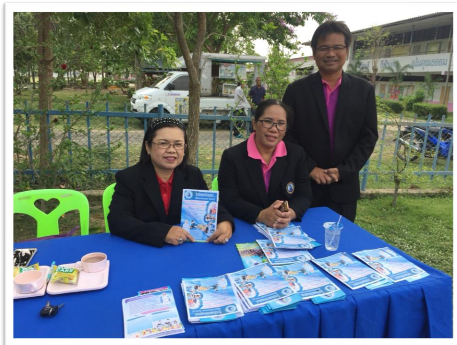
บริการให้ข้อมูลการรับสมัครนักเรียนแก่ผู้ปกครอง