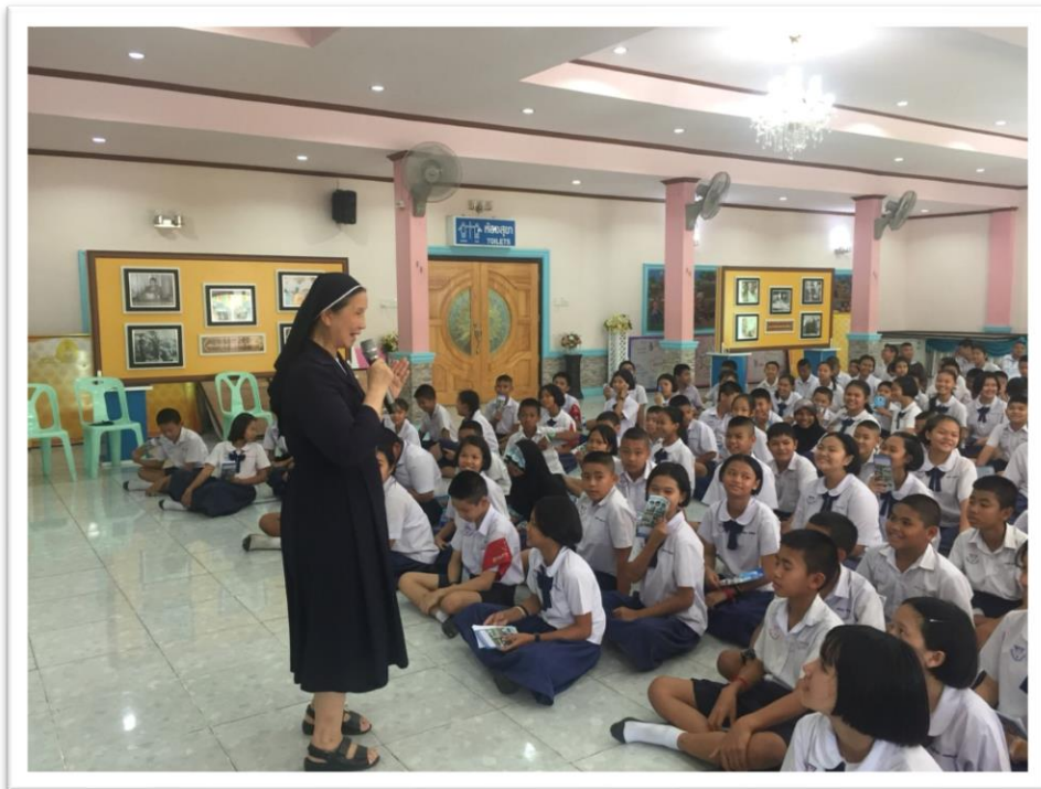
แนะแนวการศึกษาต่อโดยผู้อำนวยการโรงเรียนมารีย์อนุสรณ์