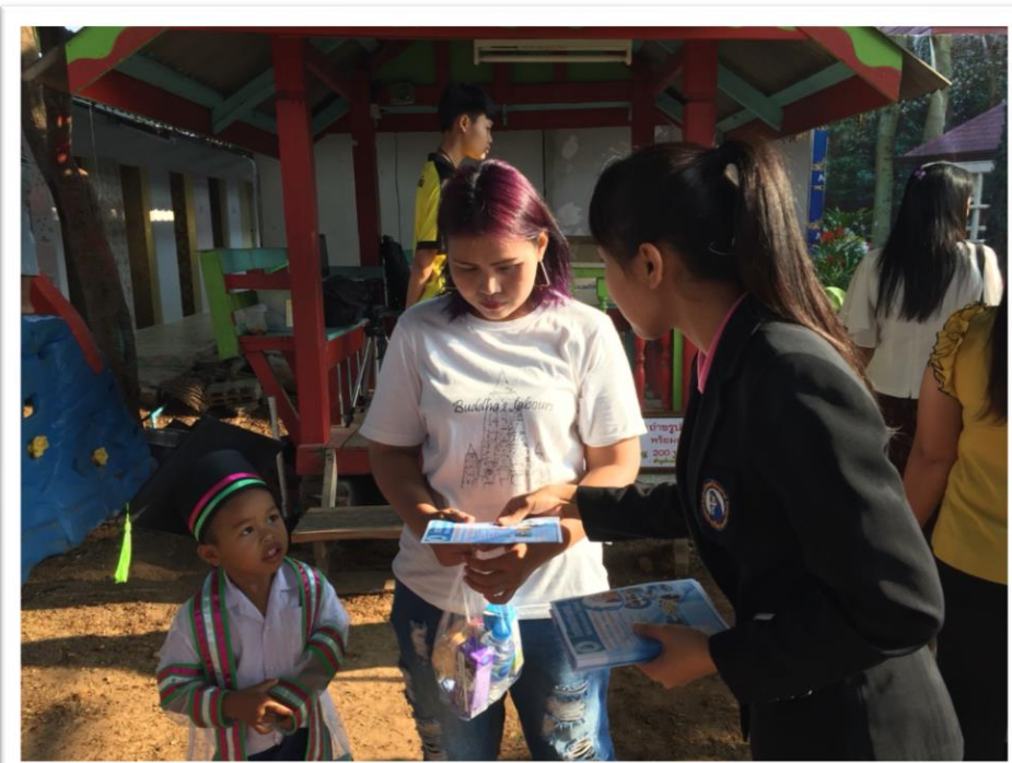
บริการให้ข้อมูลการรับสมัครนักเรียนแก่ผู้ปกครอง