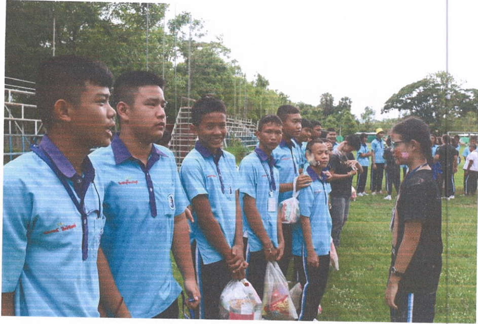
กิจกรรมสายรหัสของนักเรียนมัธยม และบูมต้อนรับน้องมัธยมศึกษาปีที่ 1