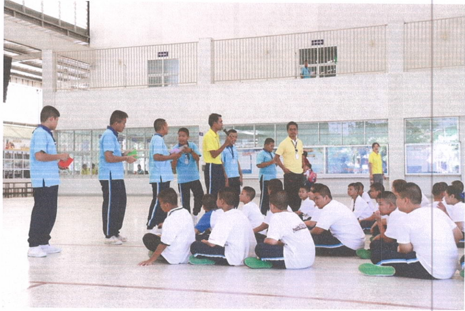
นักเรียนระดับชั้นมัธยมศึกษาปีที่ 1 ทุกคนพร้อมกัน ณ อาคารแมรี่โดม