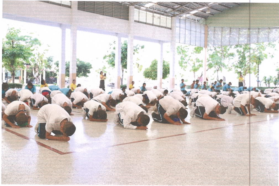
กิจกรรมอบรมธรรมะ นักเรียนชั้นมัธยมศึกษาปีที่ 1