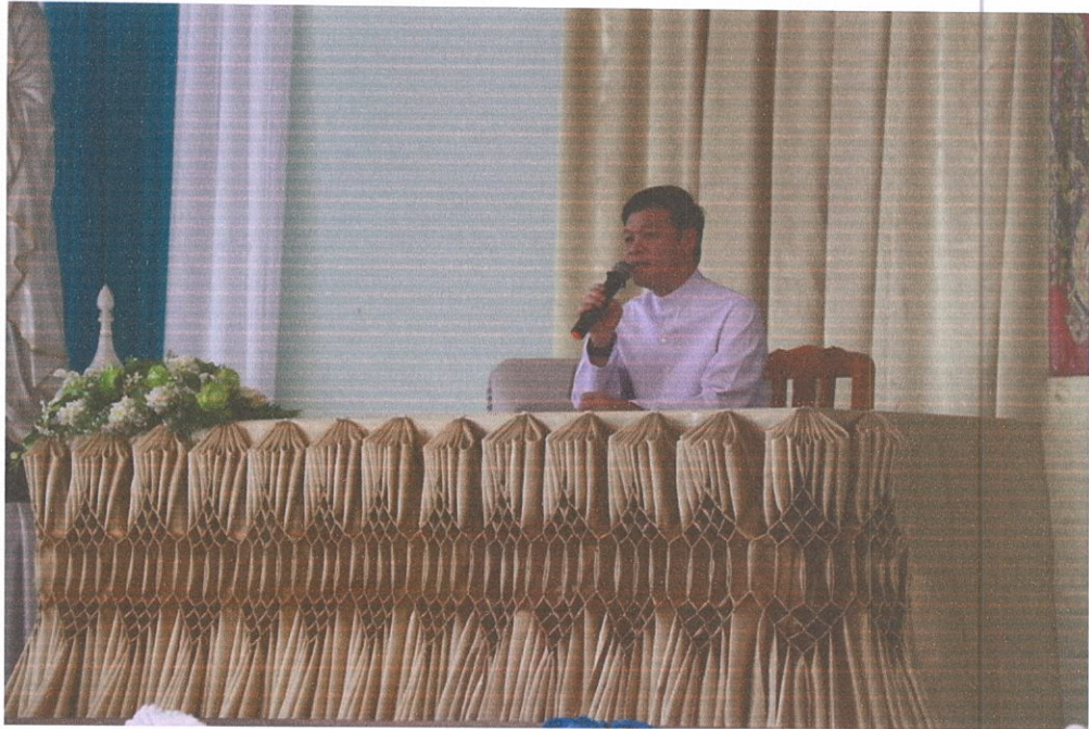
ประธานในพิธีกล่าวเปิดงานและให้โอวาท