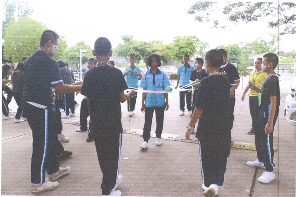
กิจกรรมฐานวิชาการ / กู้ระเบิด และอื่นๆ