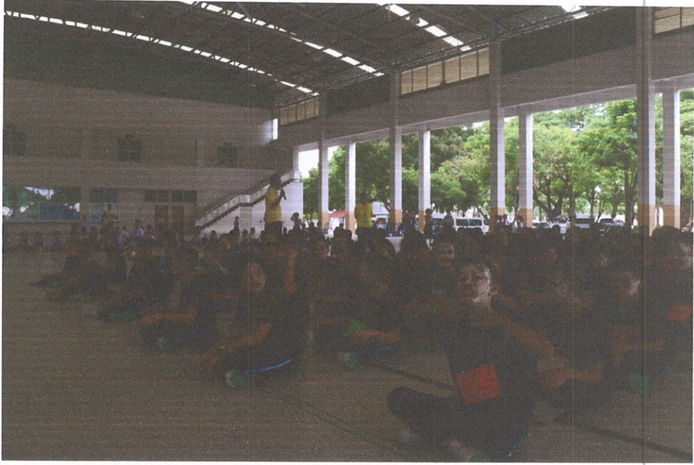
รวมพลน้องมัธยมศึกษาปีที่ 1 สันทนาการ