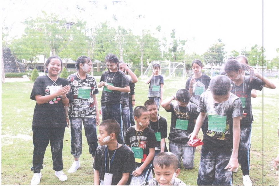
กิจกรรมฐานมารยาทดีมีชัย / ลูกบอลเหินเวหา