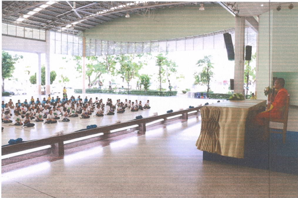
กิจกรรมอบรมธรรมะ โดยพระธรรมทัต ชินทตโต ณ อาคารแม่รีโคม