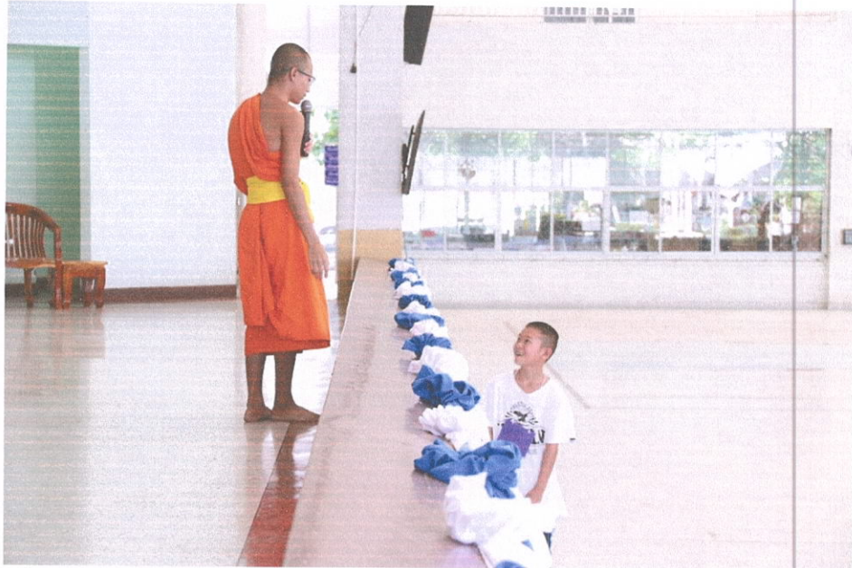
กิจกรรมอบรมธรรมะ นักเรียนชั้นมัธยมศึกษาปีที่ 1