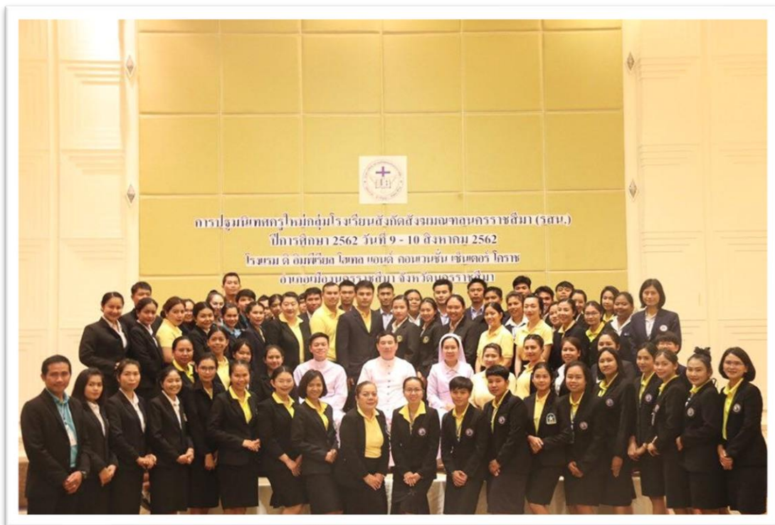
คณะครูเข้าร่วมปฐมนิเทศบุคลากรใหม่กลุ่มโรงเรียนสังกัดสังฆมณฑลนครราชสีมา (รสน.) ณ ห้องประชุมอิมพีเรียล จังหวัดนครราชสีมา วันที่ 9-10 สิงหาคม 2562