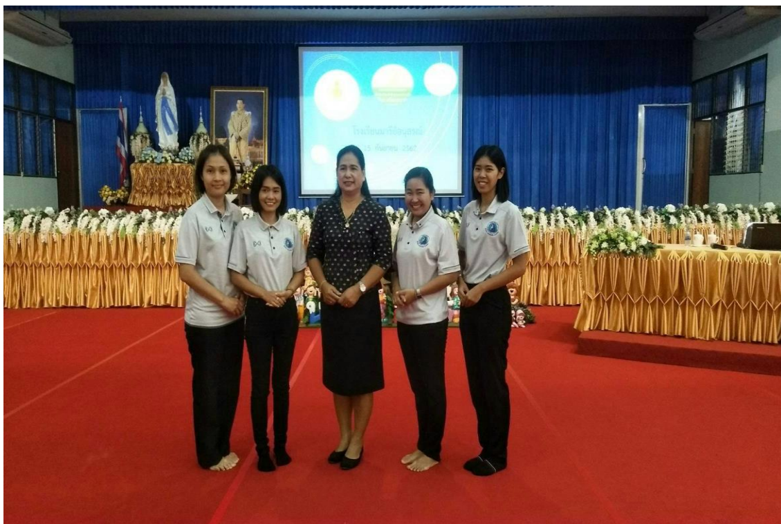
คณะครูอบรมเชิงปฏิบัติการเพื่อจัดทำรายงานโรงเรียนเพื่อรับรางวัลพระราชทาน ณ ห้องประชุมวันทามารี๋ย โรงเรียนมารีย์อนุสรณ์ วันที่ 15 กันยายน 2562