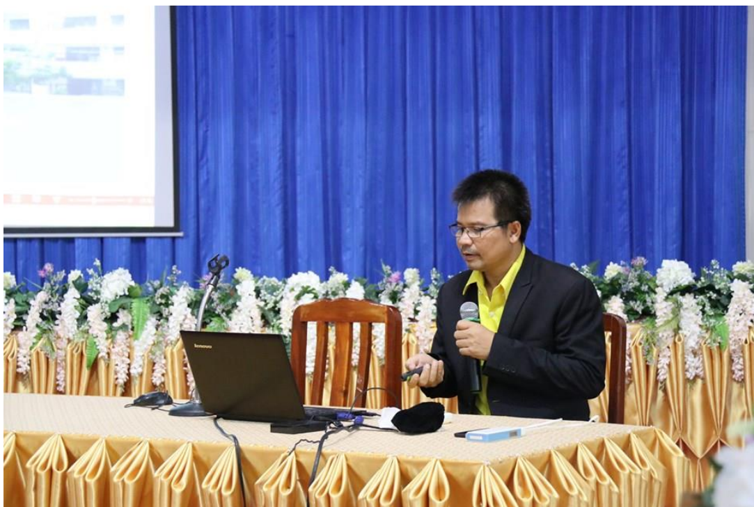
คณะครูอบรมเชิงปฏิบัติการสร้างสื่อประสมด้วยโปรแกรมคอมพิวเตอร์ เพื่อยกระดับผลสัมฤทธิ์อย่างยั่งยืน