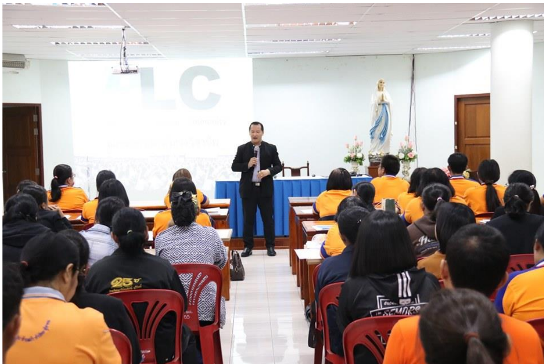
คณะกรรมการเชิงปฏิบัติการโครงการพัฒนาศักยภาพครูผู้ครุมีอาชีพ PLC ณ วัดแม่พระแห่งสายประคำศักดิ์สิทธิ์ วันที่ 13-14 ตุลาคม 2562