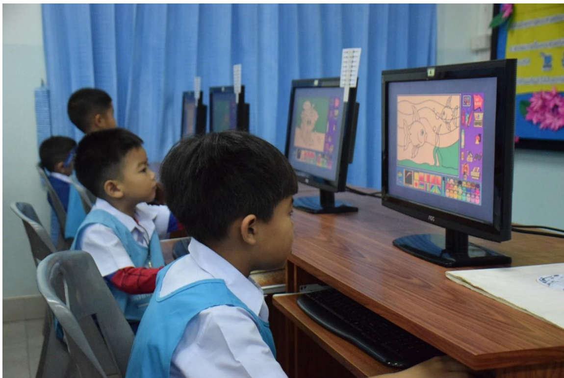
นักเรียนอนุบาลเรียนรู้พื้นฐานการใช้ Coding ผ่านโปรแกรมสำเร็จรูป