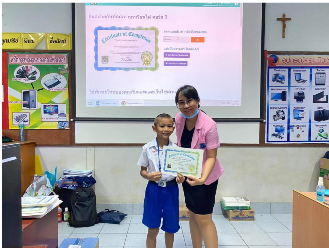
พิธีมอบเกียรติบัตรสำหรับนักเรียนที่ผ่านการอบรม