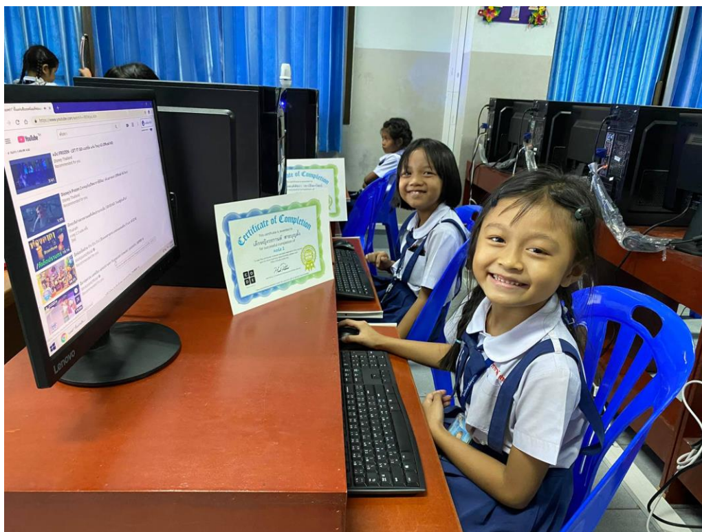
ความสำเร็จของพวกเราได้รับใบเกียรติบัตรผ่านออนไลน์ทุกคน ได้ความรู้ความสนุก