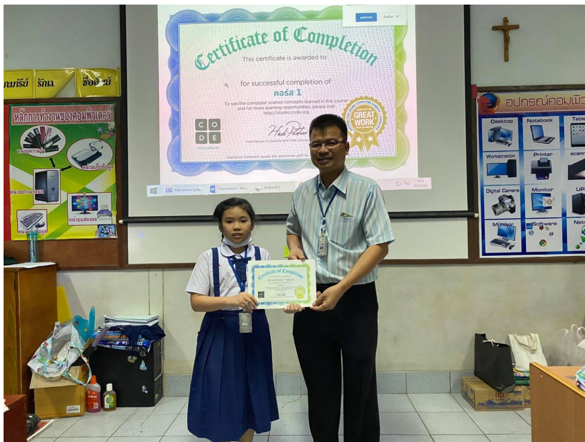
พิธีมอบเกียรติบัตรสำหรับนักเรียนที่ผ่านการอบรม