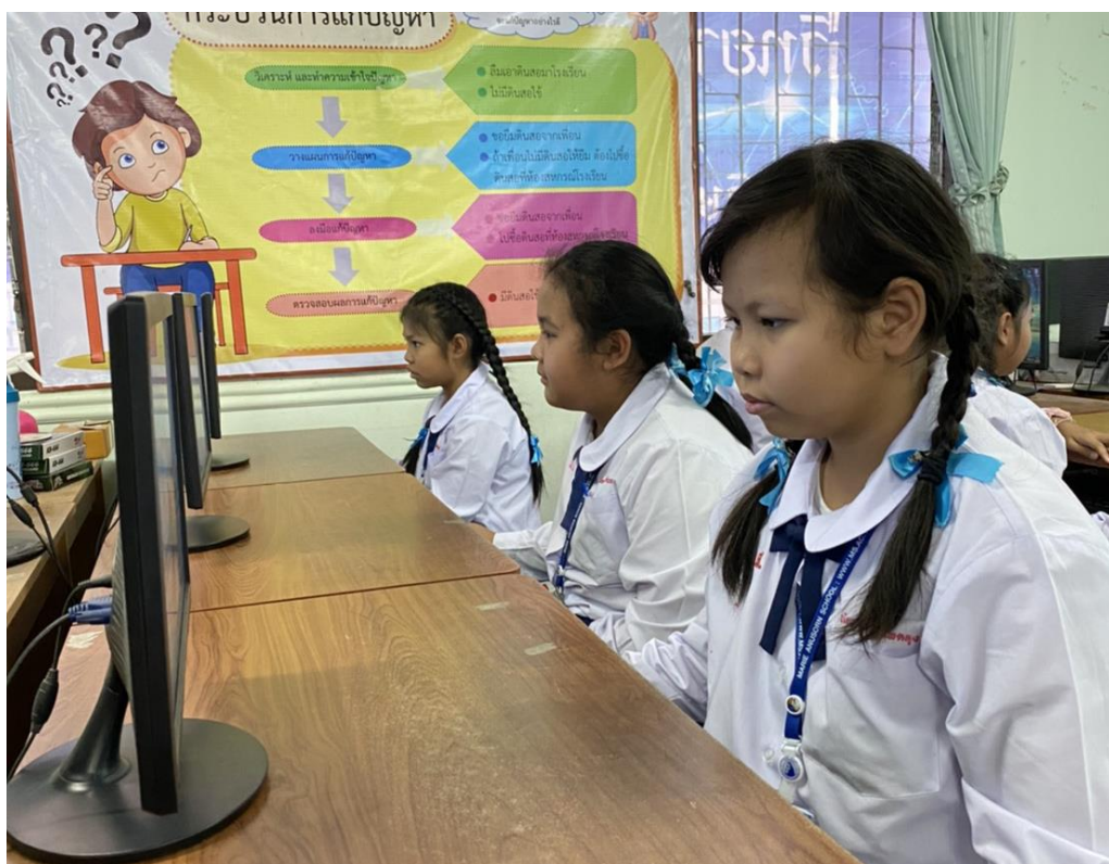
อบรมผ่านออนไลน์ผ่าน https://makecode.microbit.org/