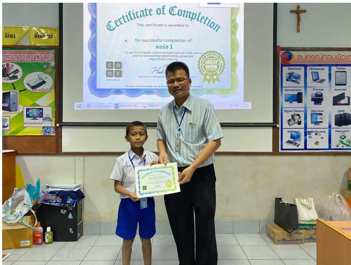
พิธีมอบเกียรติบัตรสำหรับนักเรียนที่ผ่านการอบรม