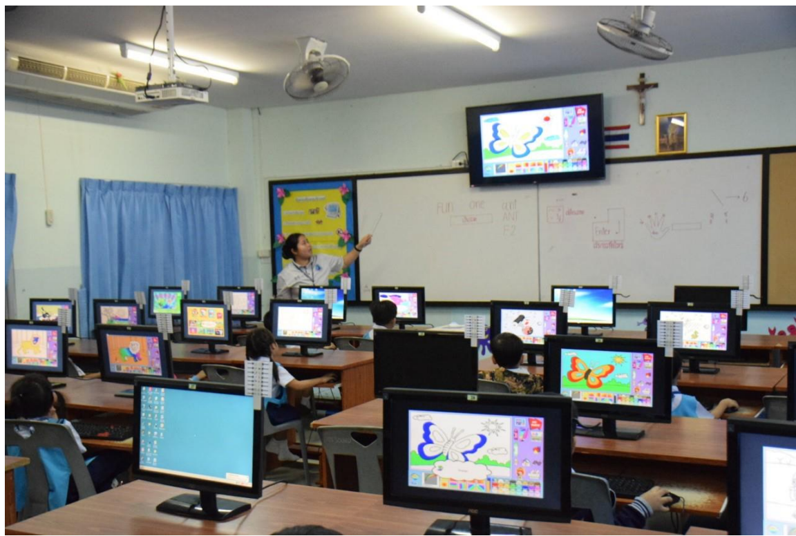
นักเรียนอนุบาลเรียนรู้พื้นฐานการใช้ Coding ผ่านโปรแกรมสำเร็จรูป