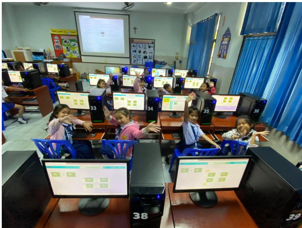
ความสำเร็จของพวกเราได้รับใบเกียรติบัตรผ่านออนไลน์ทุกคน ได้ความรู้ความสนุก