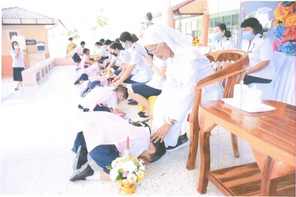
อนุบาล 2 ระลึกถึงพระคุณครู ร่วมกิจกรรมวันไหว้ครู