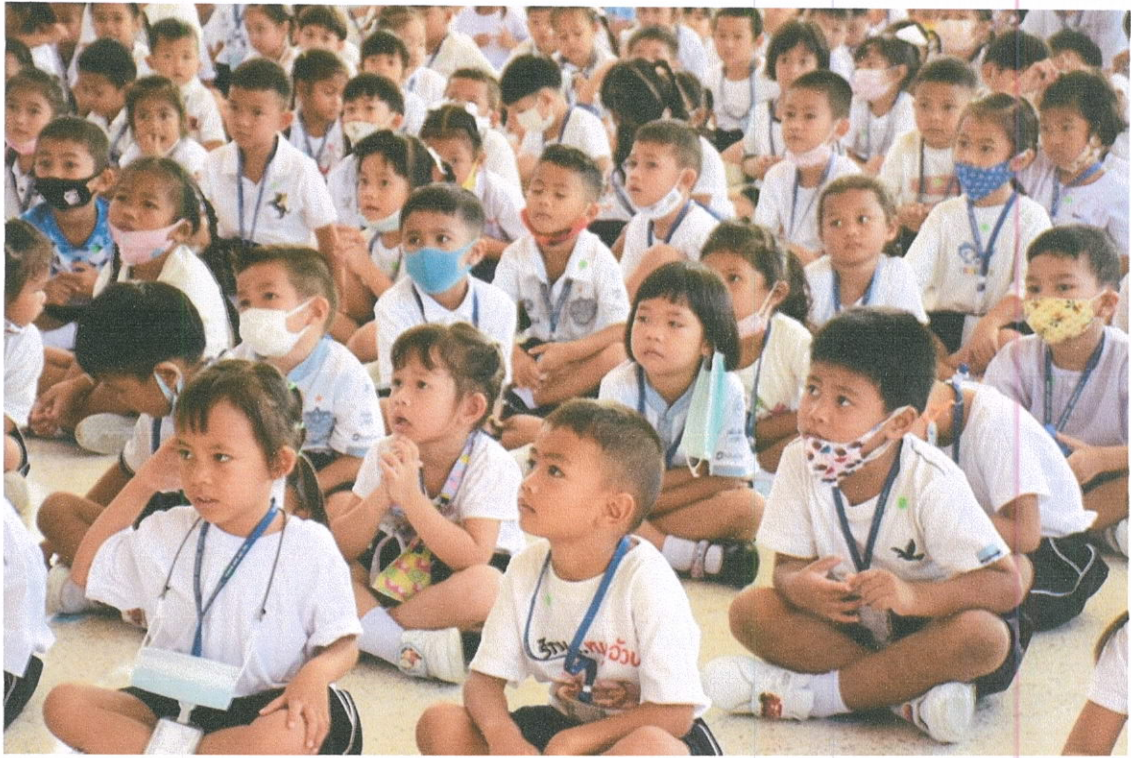
เด็กๆตั้งใจฟังนิทาน คุณธรรมเรื่องเด็กดี