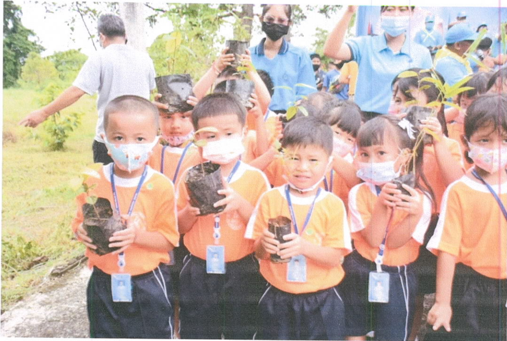
เด็ก ๆ ร่วมกันปลูกต้นไม้