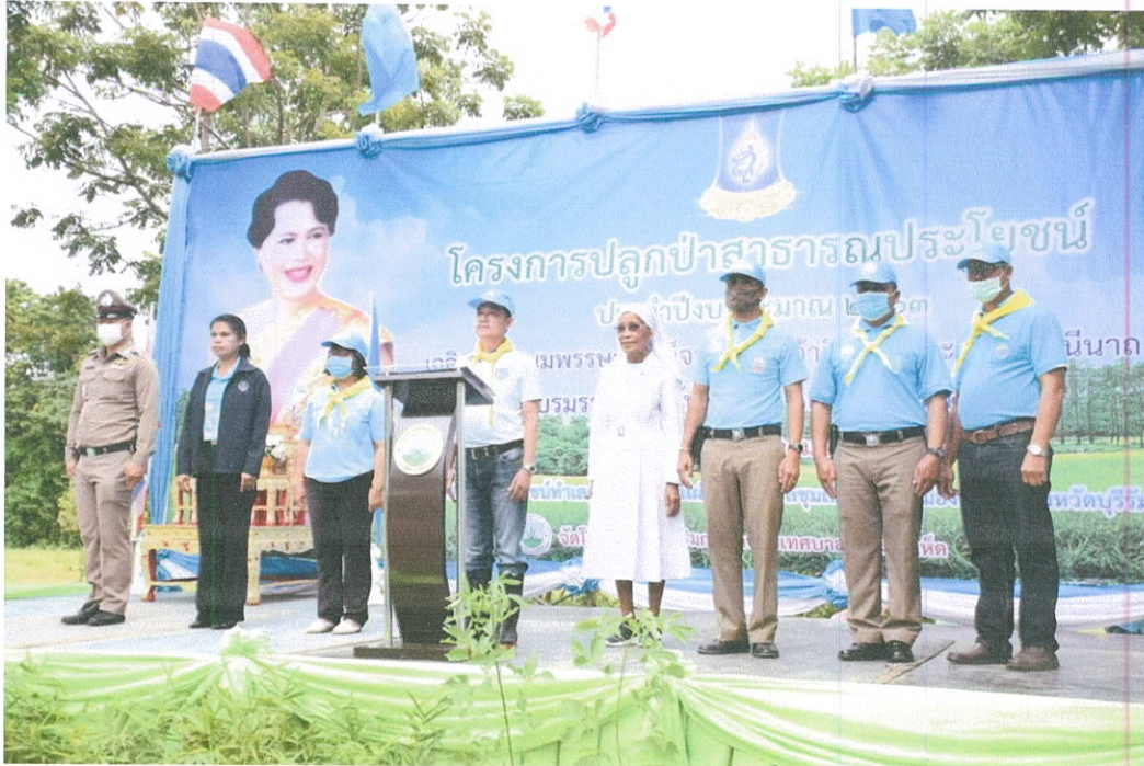
คณะผู้บริหารโรงเรียนมารีย์อนุสรณ์ ร่วมกับส่วนราชการร่วมใจกันปลูกป่า สาธารณประโยชน์