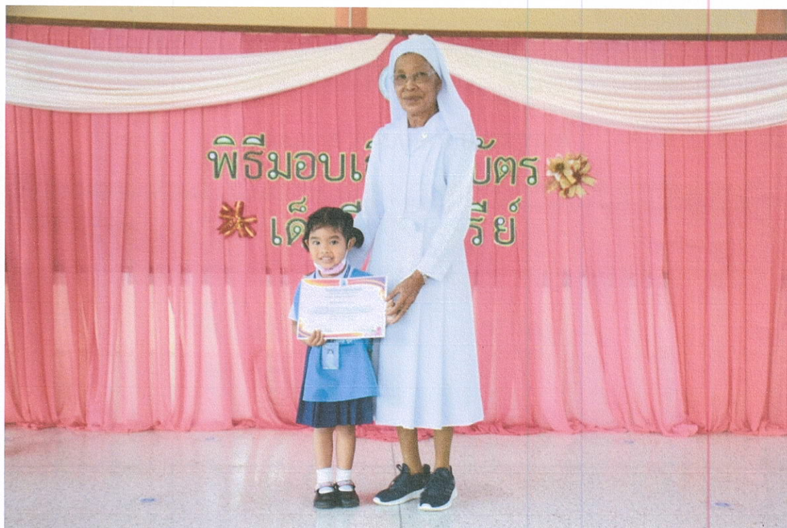
น้องอนุบาล 1 รับเกียรติบัตรความดี