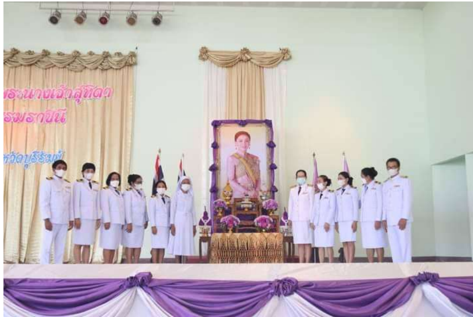
หลังจากเสร็จพิธีคณะผู้บริหาร คณะครู และนักเรียนถ่ายรูปร่วมกัน