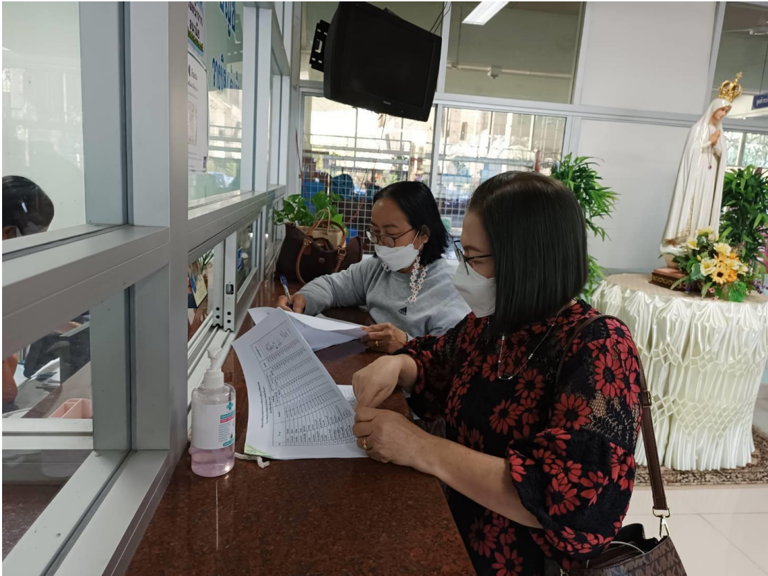
ครู บุคลากร เจ้าหน้าที่ เซ็นรับใบอนุญาตประจำปี