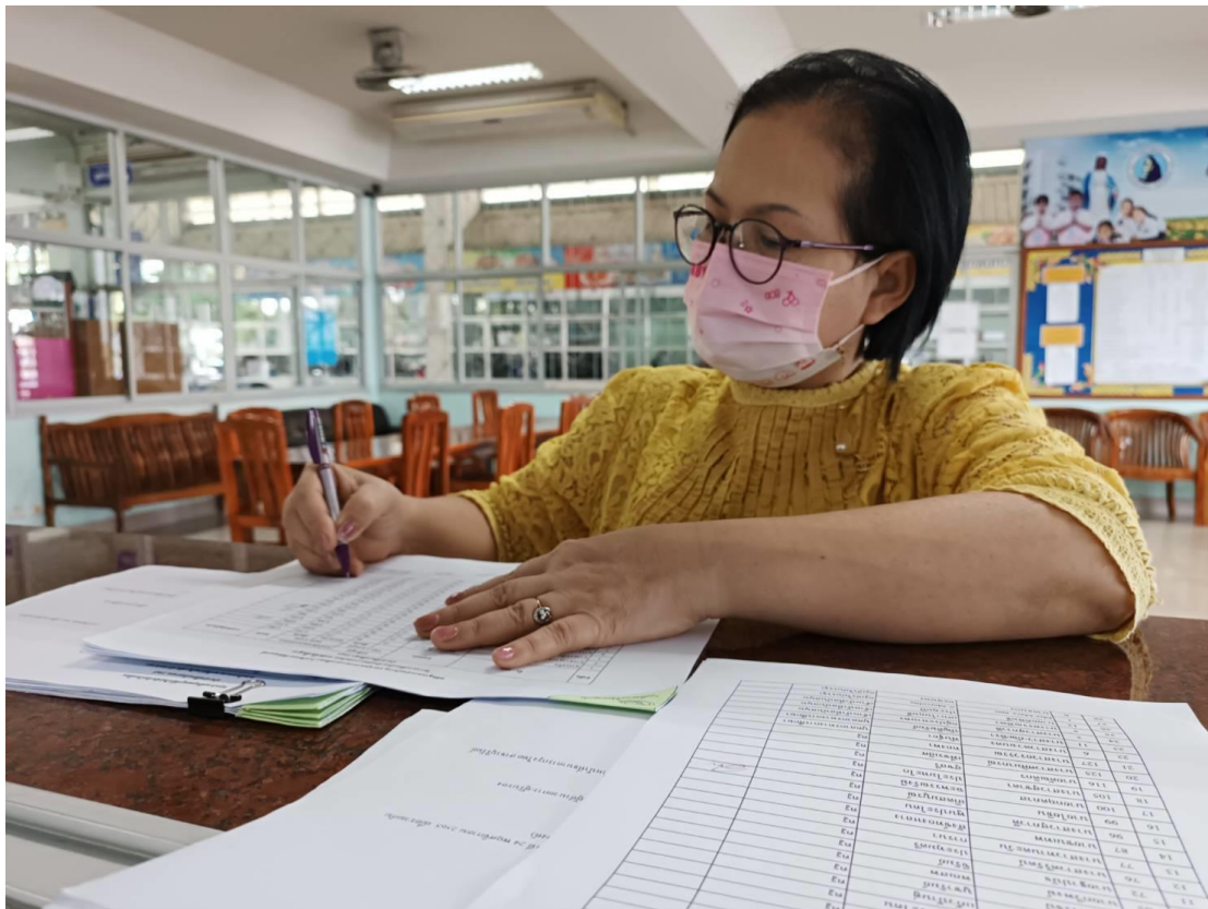
ครู บุคลากร เจ้าหน้าที่ เซ็นรับโบนัสประจำปี