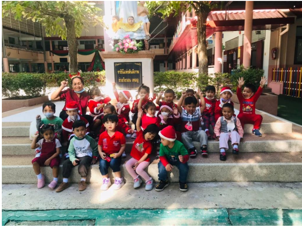
ร่วมกิจกรรมวันคริสต์มาส