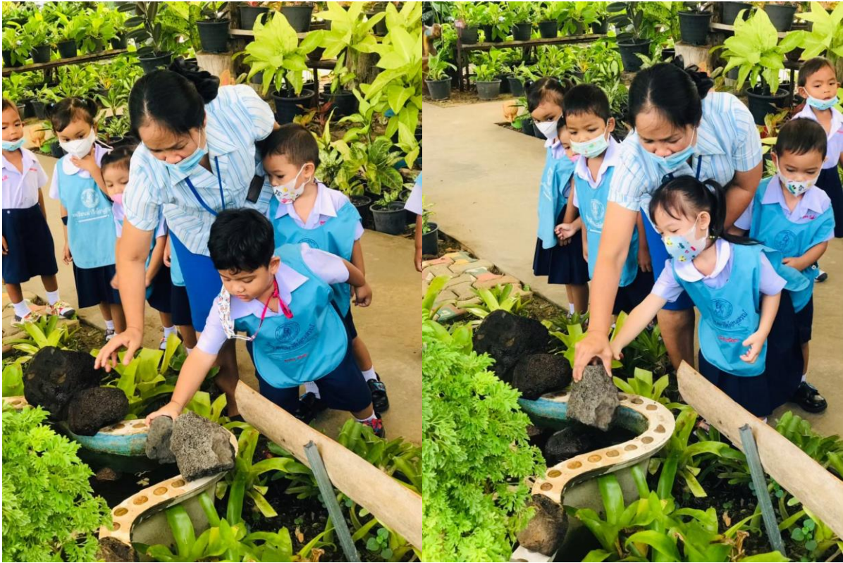
กิจกรรมเรียนรู้กลางแจ้ง