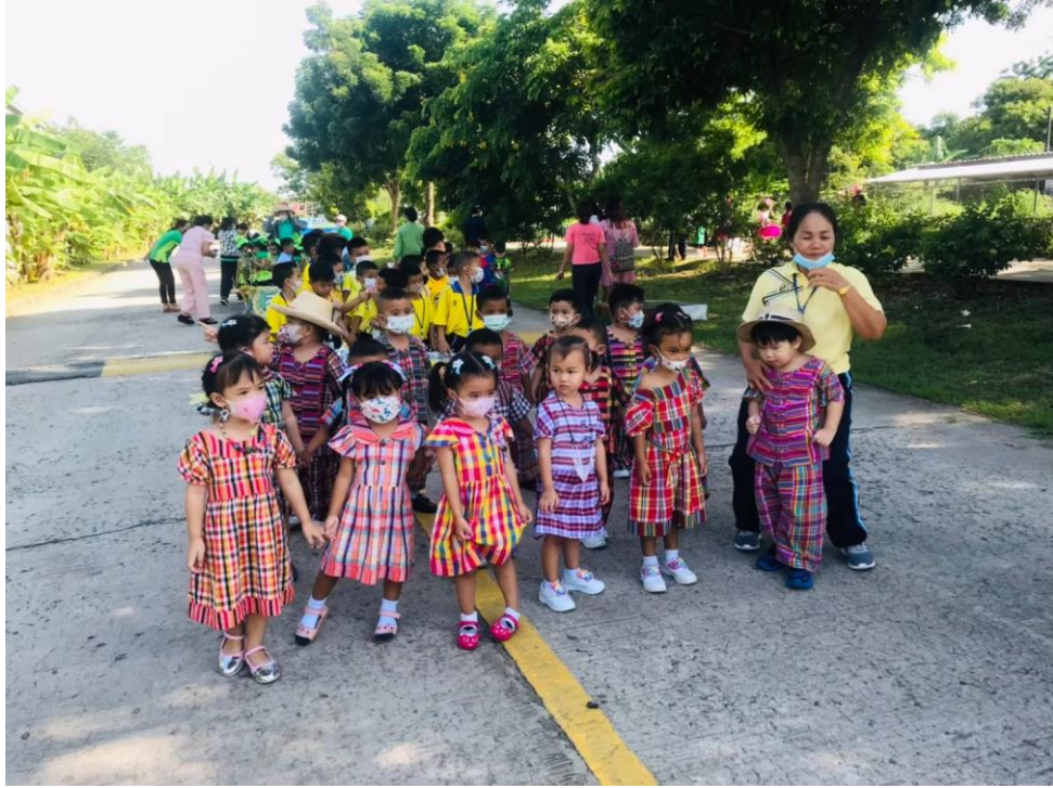
ร่วมกิจกรรมกีฬาอนุบาลลูกรัก