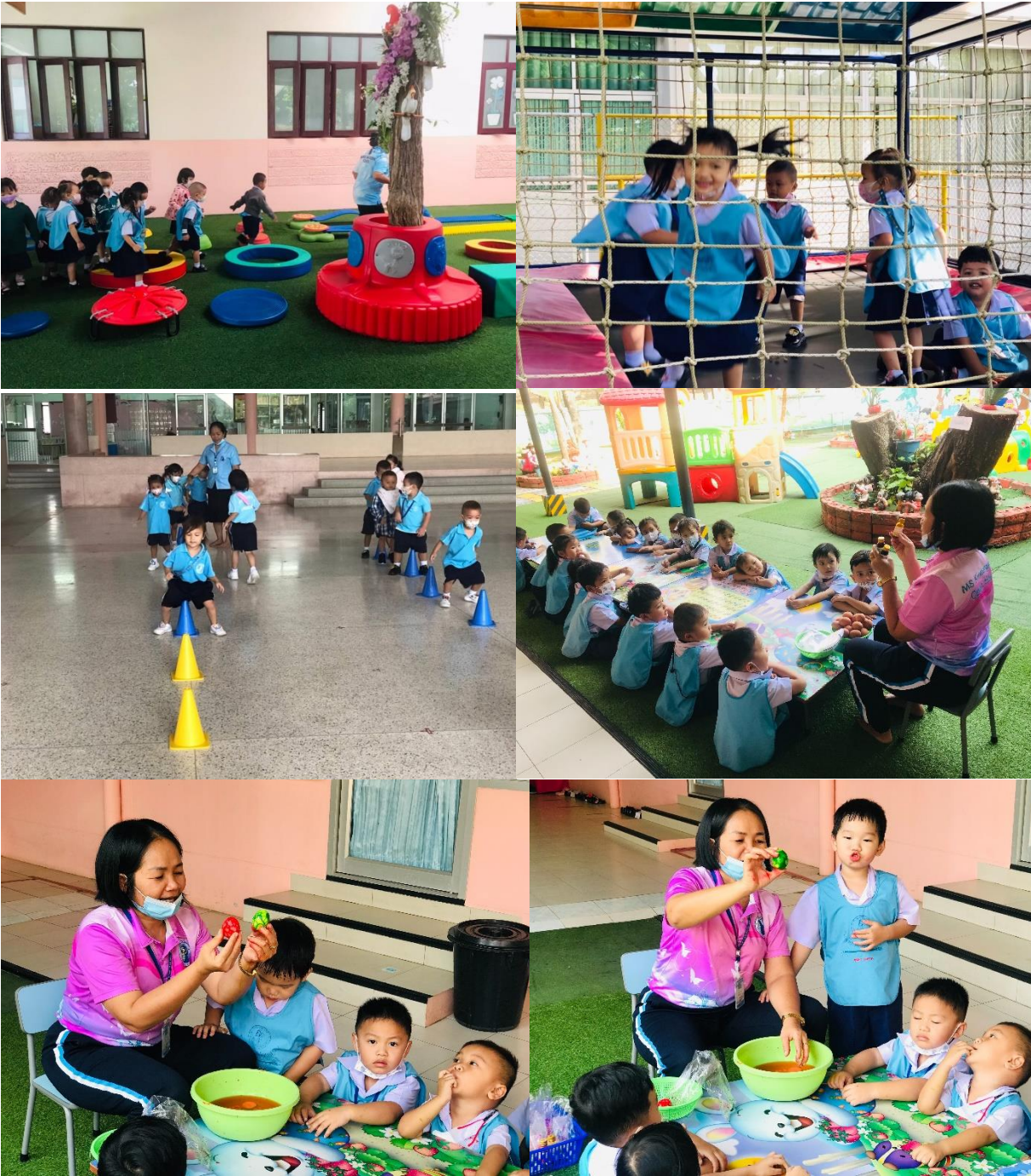
กิจกรรมการเรียนรู้นอกห้องเรียน