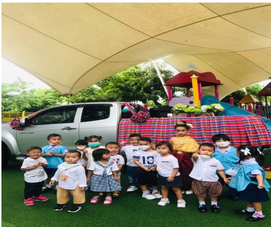
ร่วมกิจกรรมแห่เทียนพรรษา