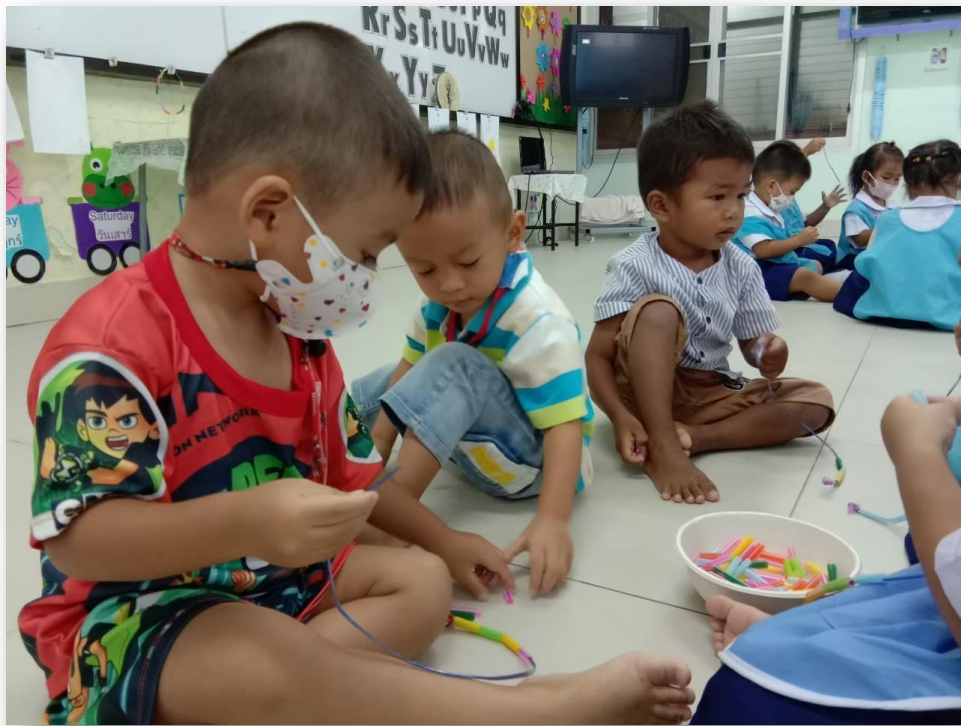
กิจกรรมเสรี