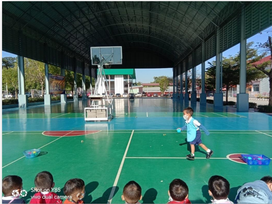
กิจกรรมเกมการศึกษา