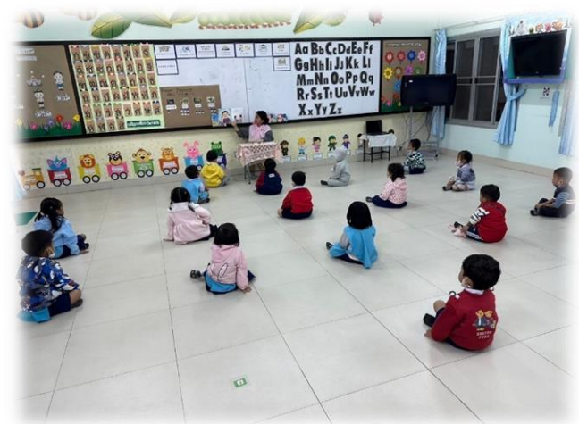
กิจกรรมเสริมประสบการณ์