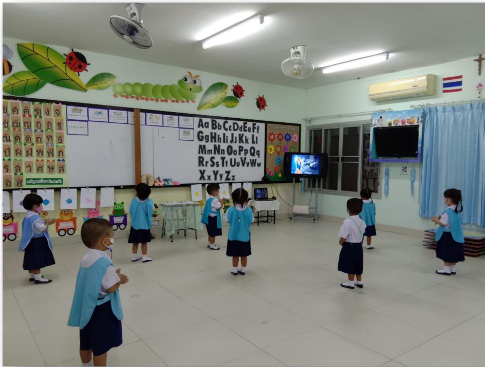
กิจกรรมเคลื่อนไหวและจังหวะ