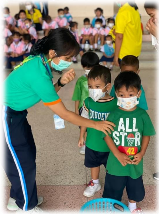
กิจกรรมพิเศษ