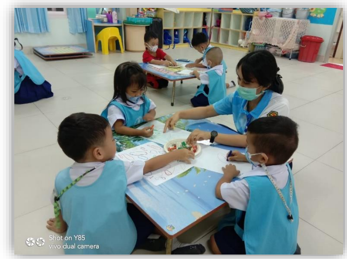
กิจกรรมสร้างสรรค์