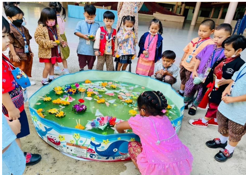
รูปภาพที่ 8 กิจกรรมวันลอยกระทง