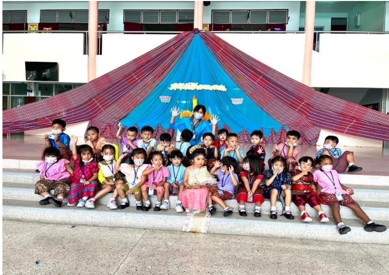
รูปภาพที่ 7 กิจกรรมวันลอยกระทง