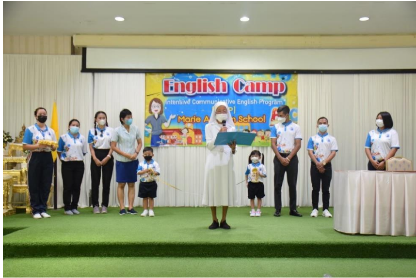
รูปภาพที่ 5 กิจกรรมทัศนศึกษาเฟลาเฟลิน