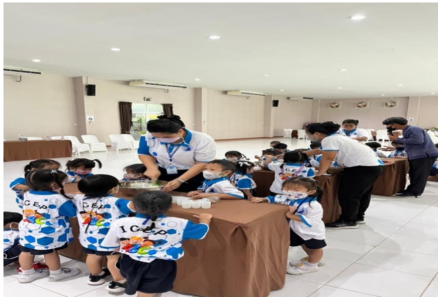
รูปภาพที่ 6 กิจกรรมทัศนศึกษาเฟลาเฟลิน