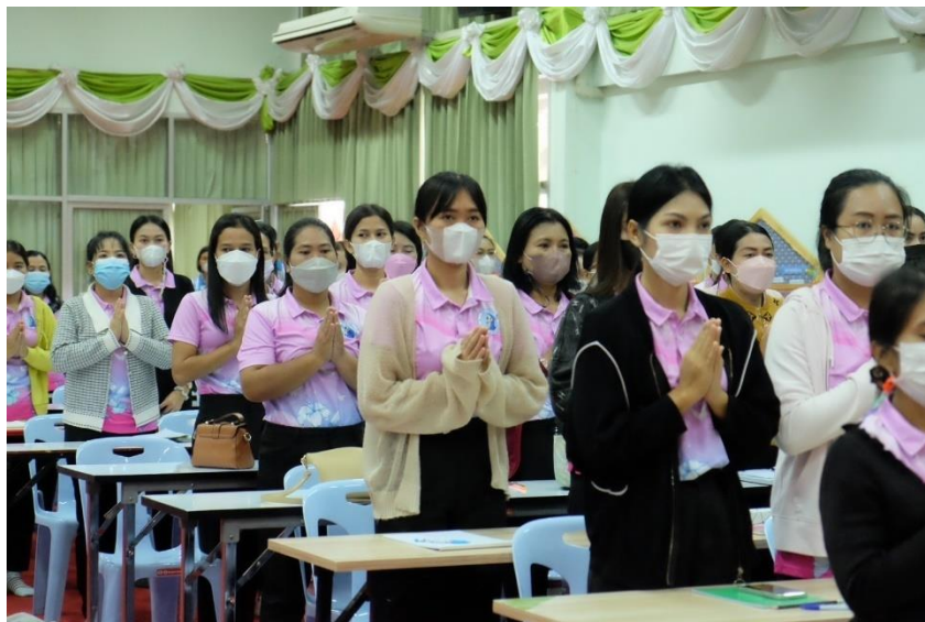
รูปภาพที่ 1 กิจกรรมอบรมเชิงปฏิบัติการการจัดทำแผนพัฒนาคุณภาพการศึกษา