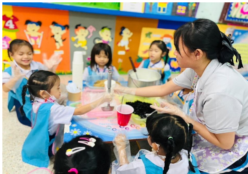
รูปภาพที่ 10 กิจกรรมการเรียนรู้การสอนเรื่องการทำแกก้วยนมสด