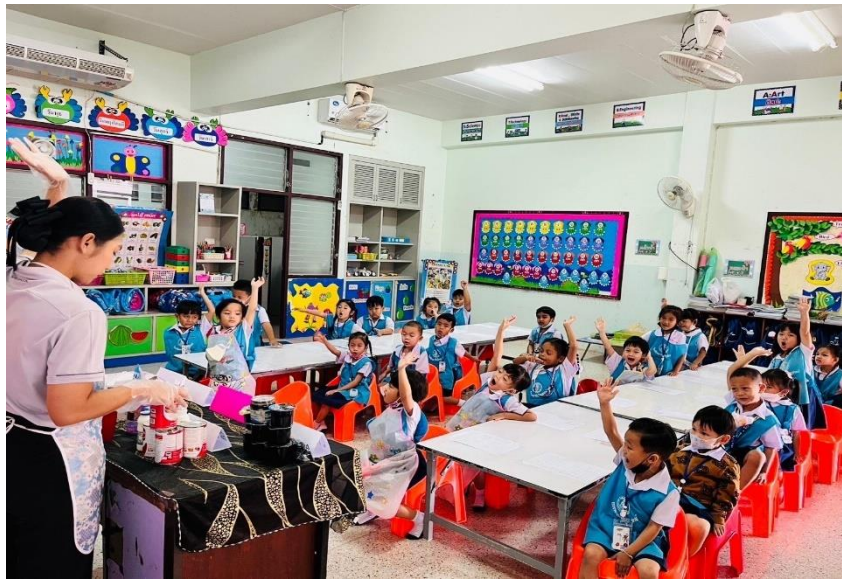
รูปภาพที่ 9 กิจกรรมการเรียนรู้การสอนเรื่องการทำแกก้วยนมสด