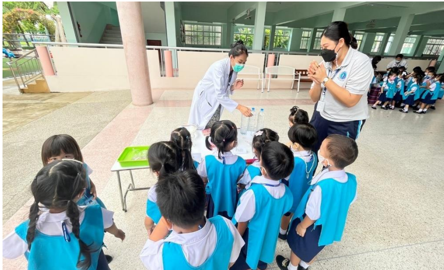
รูปภาพที่ 4 กิจกรรมเข้าค่ายวันวิทยาศาสตร์