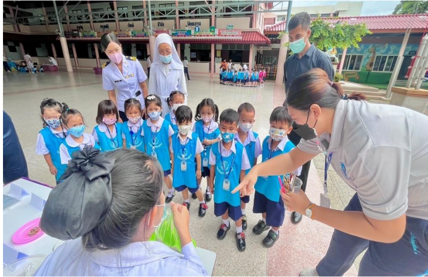
รูปภาพที่ 3 กิจกรรมเข้าค่ายวันวิทยาศาสตร์