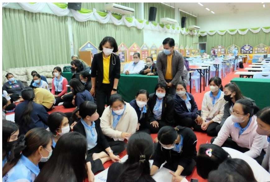
รูปภาพที่ 2 กิจกรรมอบรมเชิงปฏิบัติการการจัดทำแผนพัฒนาคุณภาพการศึกษา