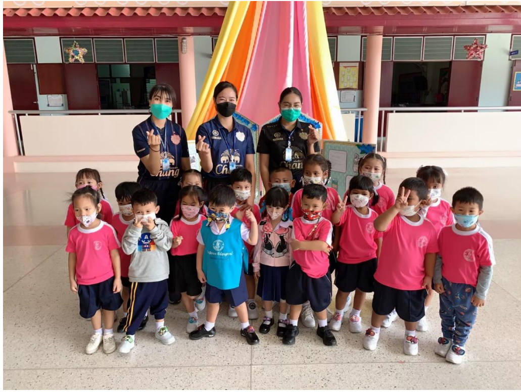
กิจกรรมค่ายวิทยาศาสตร์ – ศิลปะระดับชั้นอนุบาล 1-3