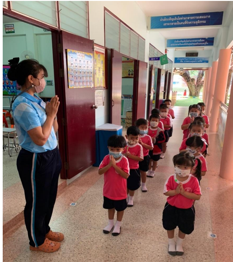
การจัดกิจกรรมการเรียนรู้การสอน โครงการ “หนูน้อยไหว้”