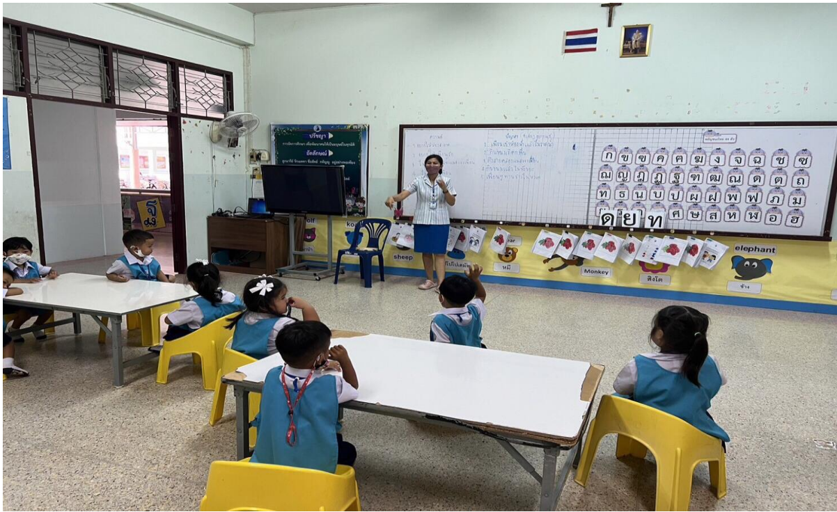
กิจกรรมเสริมประสบการณ์