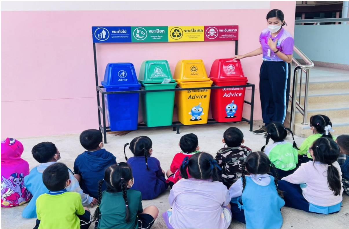
โครงการตาวีเศษอนุบาล1/6