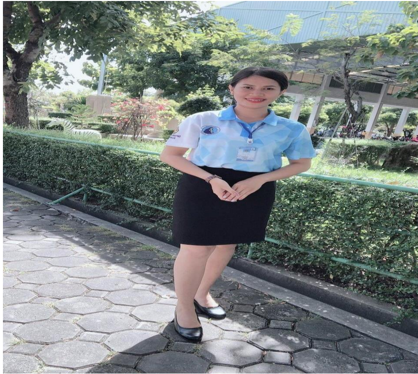
ปฏิบัติงานสอนอย่างเต็มที่กับงานที่รับผิดชอบ