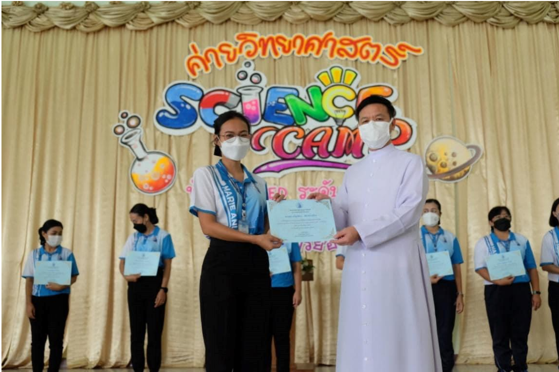
รับเกียรติบัตรวิทยากร ค่ายวิทยาศาสตร์