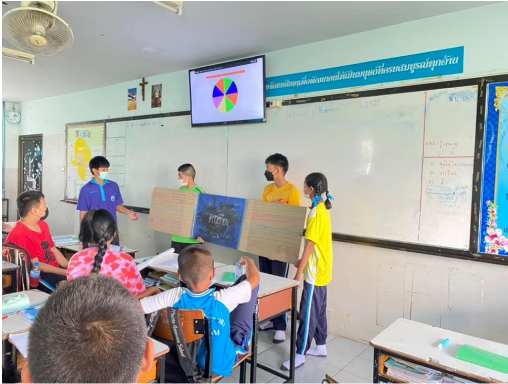
กิจกรรมการเรียนการสอน นักเรียนฝึกนำเสนอผลงาน