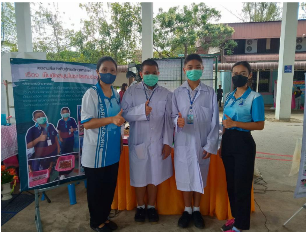
ครูผู้ฝึกสอนนักเรียนกิจกรรมการประกวดผลงานสิ่งประดิษฐ์ทางวิทยาศาสตร์ ระดับชั้น ป.1-ป.6