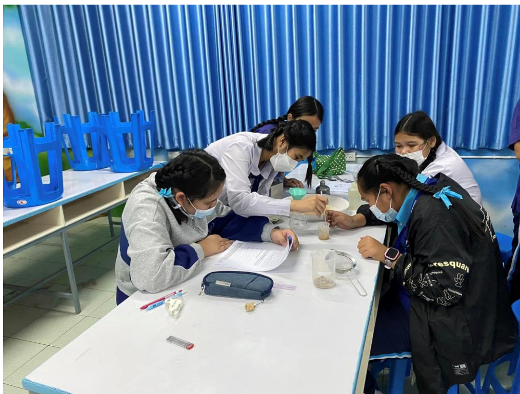
สอนกิจกรรมการทดลอง เรื่อง การแยกสาร