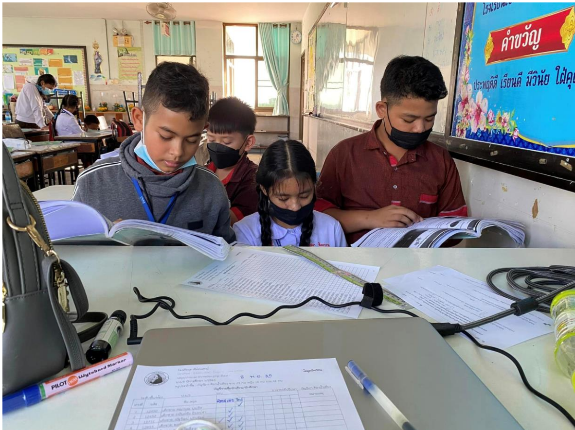
ให้นักเรียนอ่าน และเปลี่ยนกันถาม-ตอบกับเพื่อน