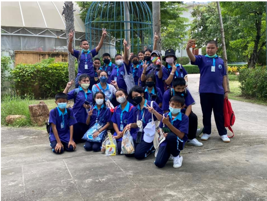
ทัศนศึกษาที่เฟลาเฟลิน