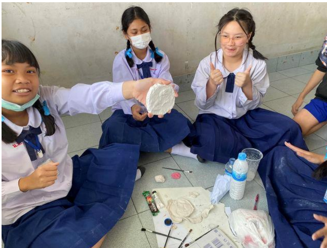
สอนกิจกรรมการทดลอง เรื่อง ซากดึกดำบรรพ์