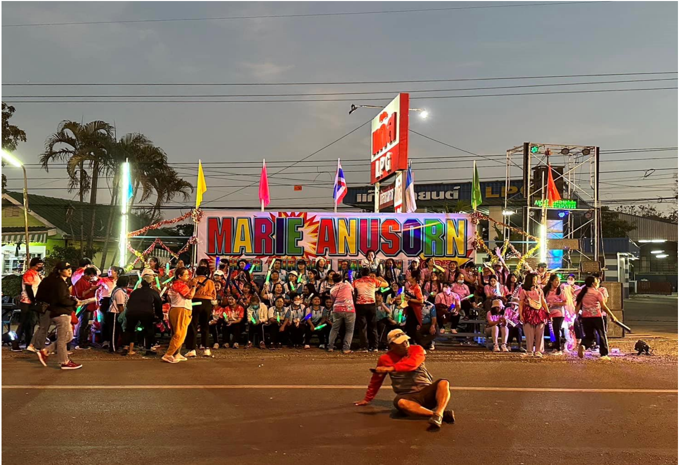
ร่วมเชียร์กิจกรรมมาราธอนจังหวัด ประจำปีการศึกษา 2565