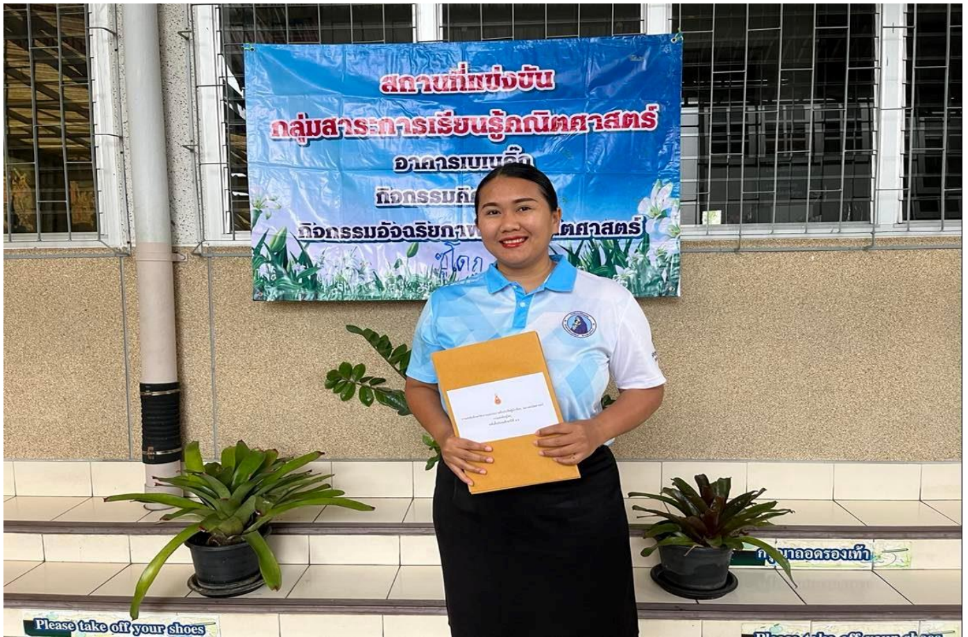
เป็นกรรมการตัดสินรายการซูโดกุ การแข่งขันโรงเรียนกลุ่มเอกชน