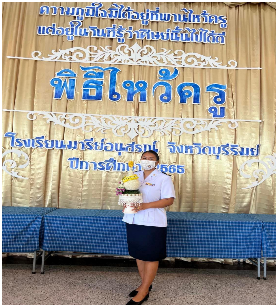
กิจกรรมไหว้ครูประจำปีการศึกษา 2565