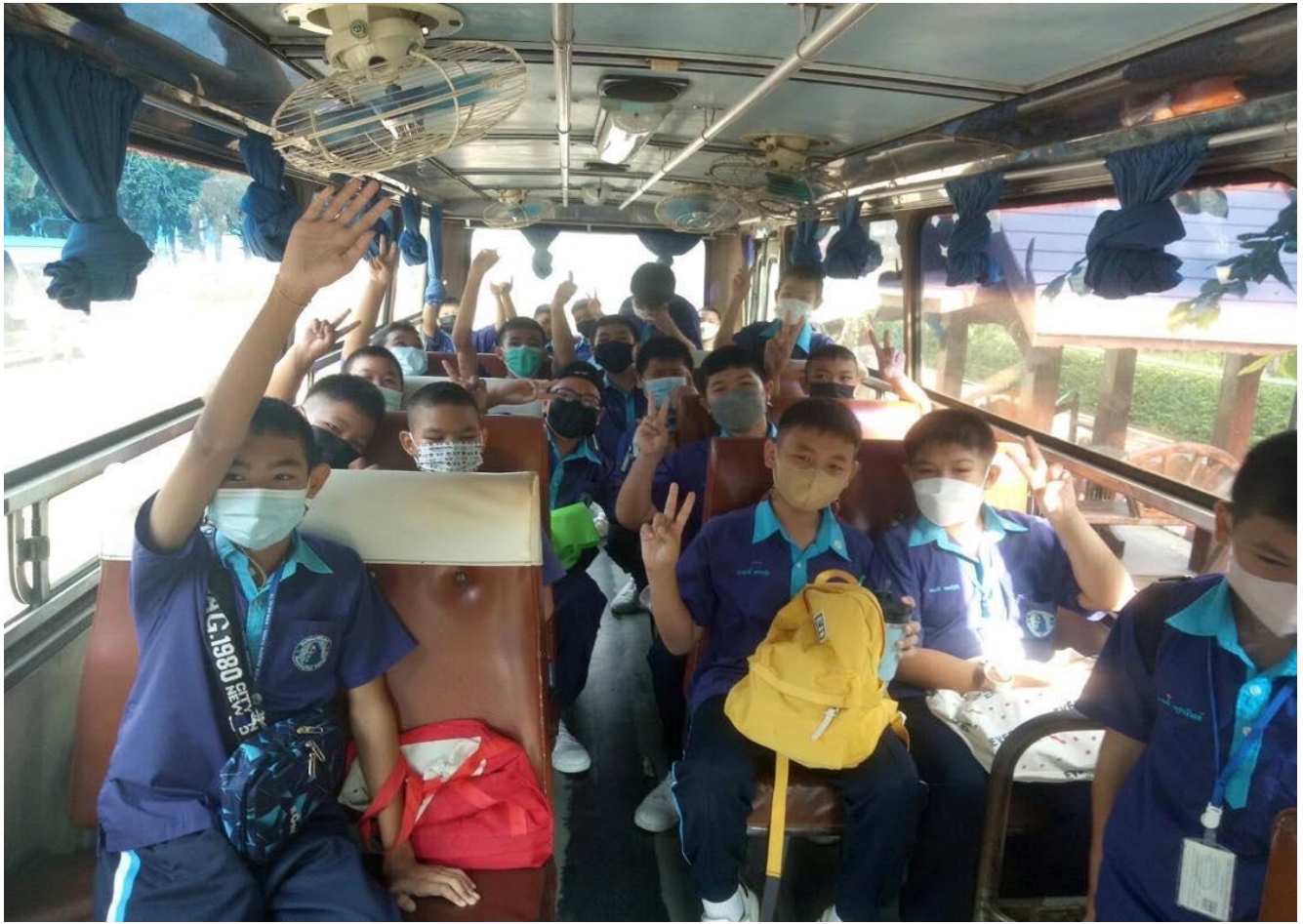
ร่วมทัศนศึกษา ณ เพลลาเพลิน