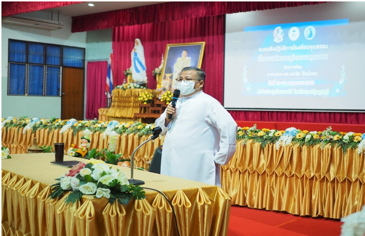
อบรมเชิงปฏิบัติการโรงเรียนคุณธรรม