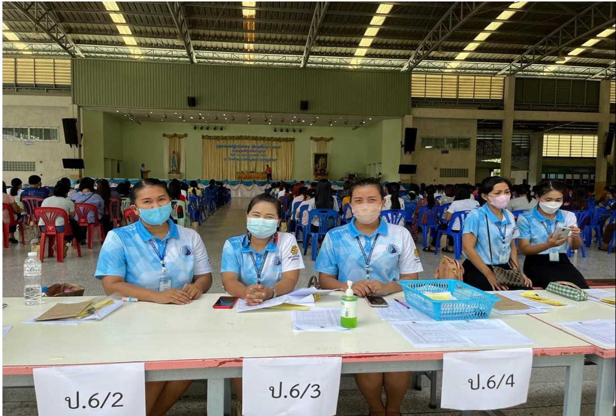
ปฐมนิเทศผู้ปกครองนักเรียนชั้นประถมศึกษาปีที่ 6