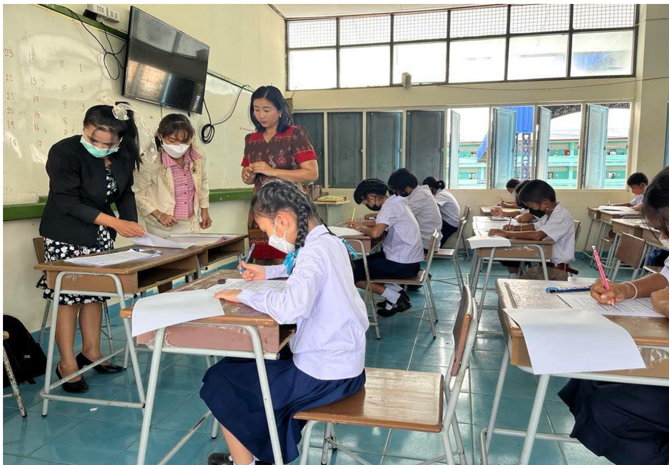
เป็นกรรมการตัดสินชุดอกุ