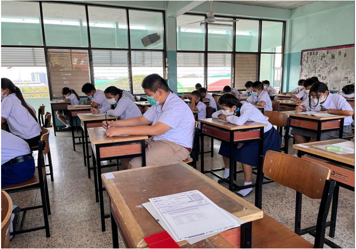
เป็นกรรมการคุมสอบโอเน็ตประจำปีการศึกษา 2565