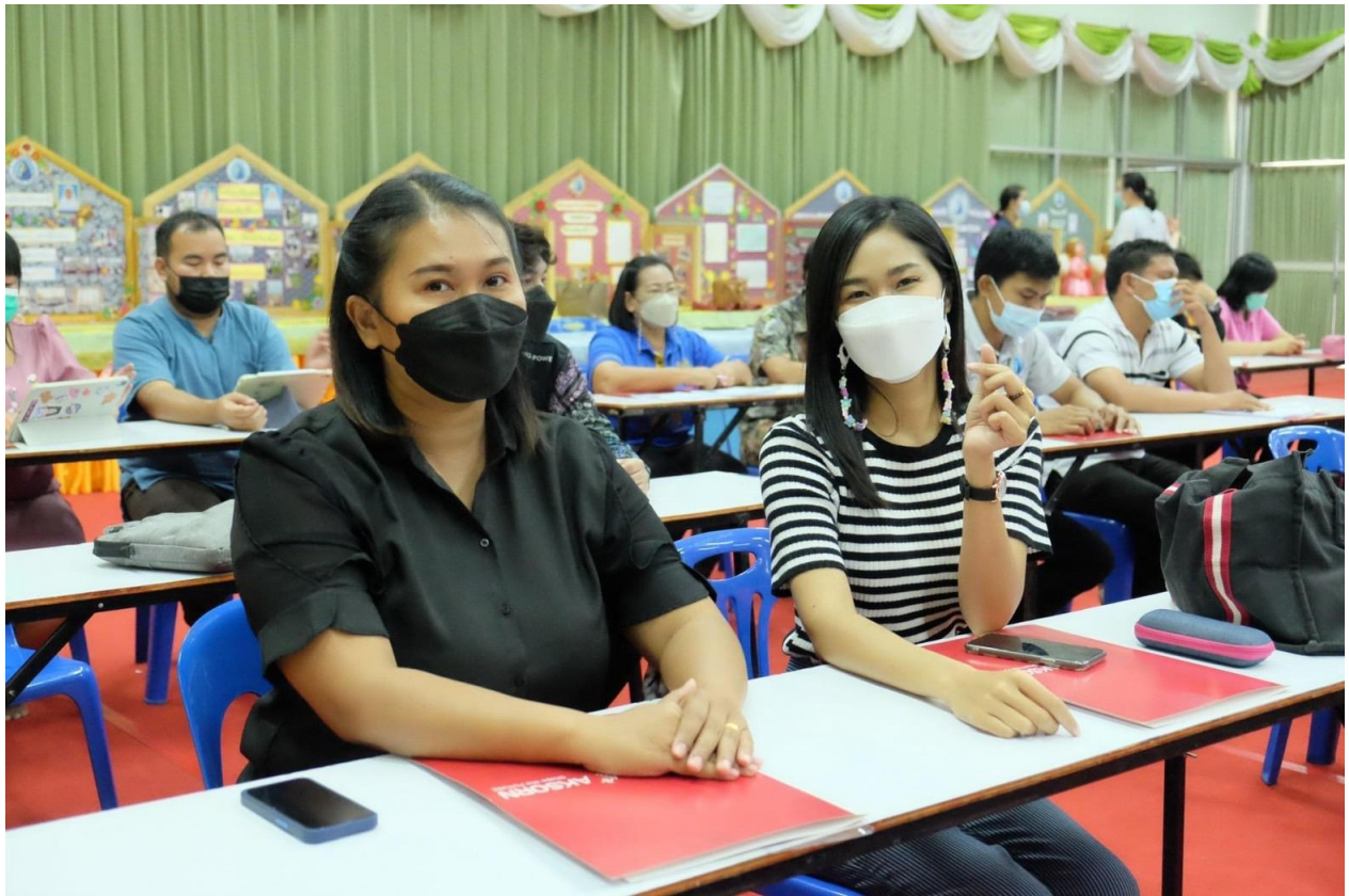
อบรมการพัฒนาหลักสูตรฐานสมรรถนะ