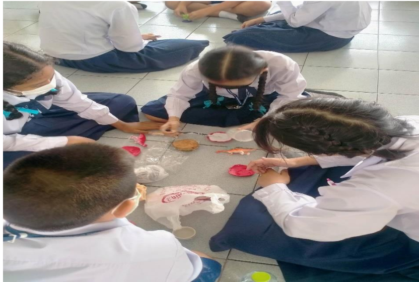
กิจกรรมการเรียนรู้การสอนเรื่องการเกิดลม