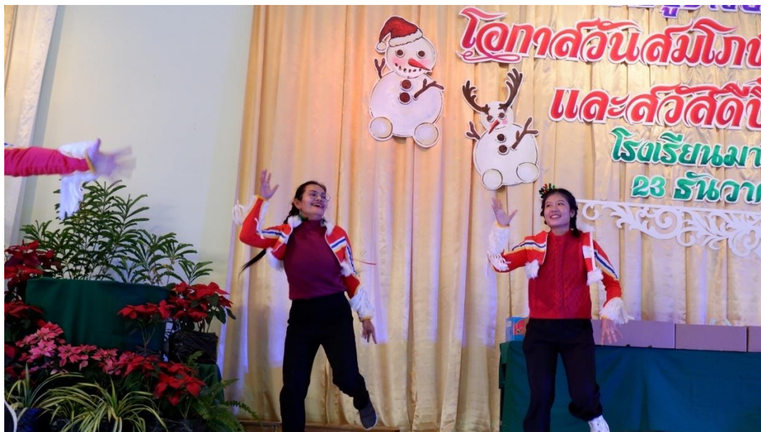
ร่วมกิจกรรมคริสต์มาส