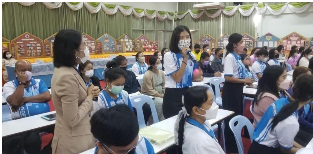
อบรมเชิงปฏิบัติการการจัดทำแผนพัฒนาคุณภาพการศึกษาโรงเรียนมารีย์อนุสรณ์ ปีการศึกษา 2566-2570