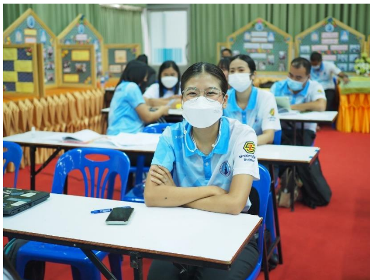
อบรมเชิงปฏิบัติการ “การพัฒนาสมรรถนะผู้เรียน ด้วยหลักสูตรแกนกลางฯ พ.ศ.2551 (ฉบับปรับปรุง พ.ศ. 2560) สู่หลักสูตรฐานสมรรถนะ