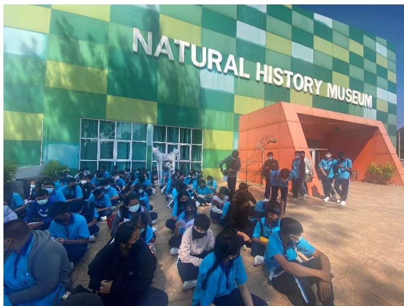
ร่วมกิจกรรมทัศนศึกษานักเรียน มัธยมศึกษาปีที่ 2 ณ พิพิธภัณฑ์มหาวิทยาลัยขอนแก่น