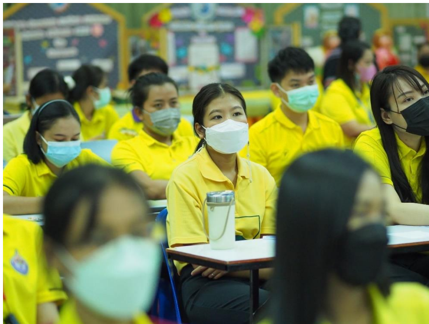
อบรมเชิงปฏิบัติการโรงเรียนคุณธรรม เรื่อง การพัฒนาครูโครงการคุณธรรม