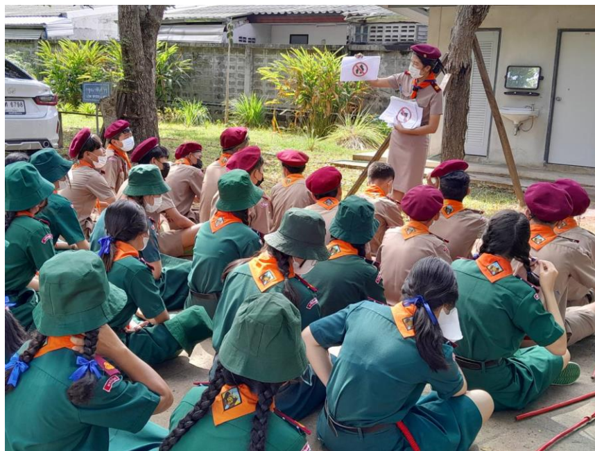
ปฏิบัติหน้าที่ตามหนังสือแต่งตั้งการฝึกทักษะทางลูกเสือ ชั้นมัธยมศึกษาปีที่ 1-3