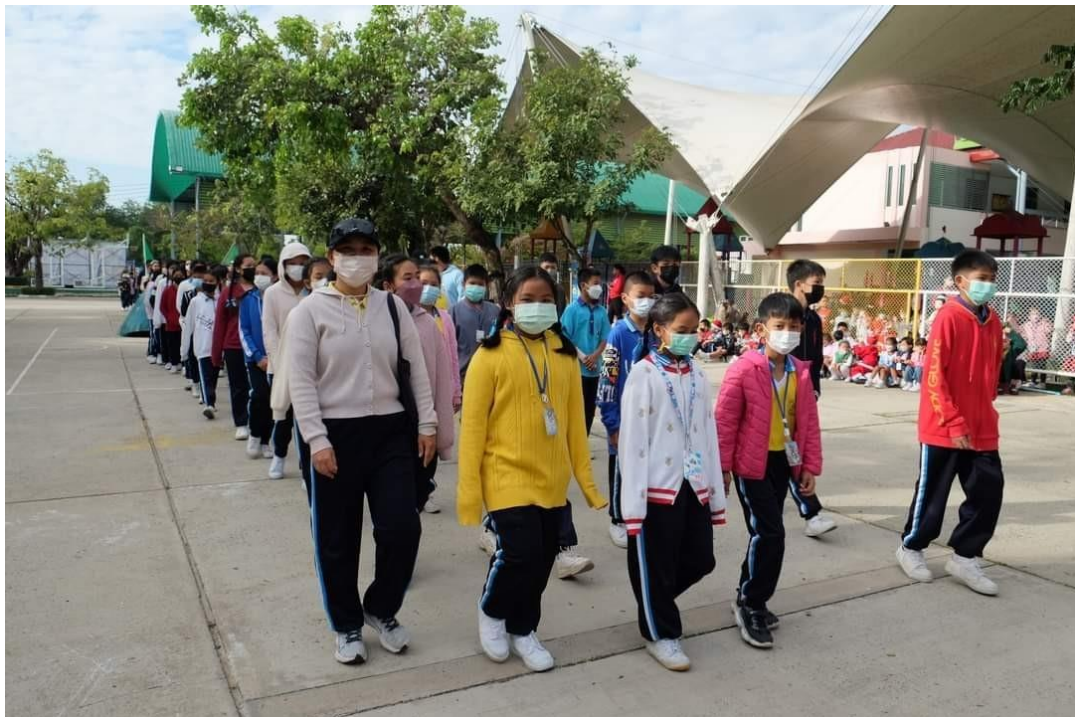
ร่วมกิจกรรมกีฬาโรงเรียน