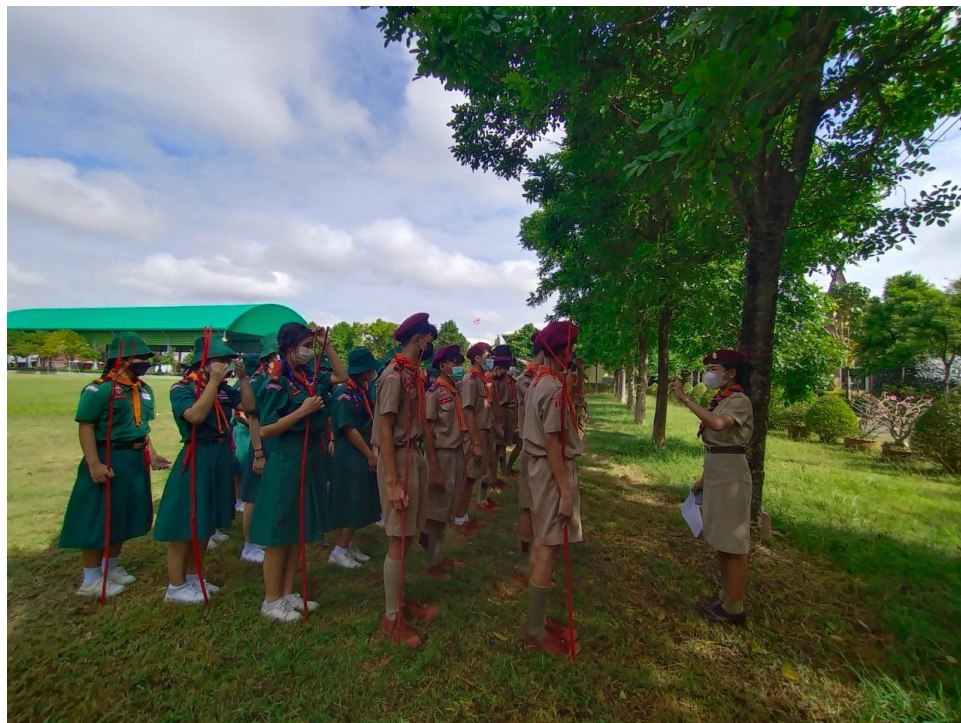
กิจกรรมเข้าค่ายลูกเสือ เนตรนารี ระดับชั้นมัธยมศึกษาปีที่ 1 - 3