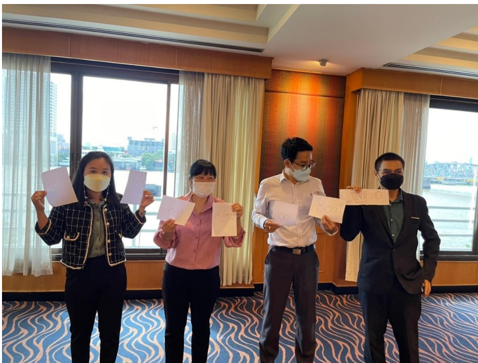
อบรมเชิงปฏิบัติการเทคนิคการจัดการเรียนการสอนภาษาอังกฤษ ณ ห้องประชุมโรงแรมรอยัลริเวอร์ เขตพวงมณี กรุงเทพมหานคร