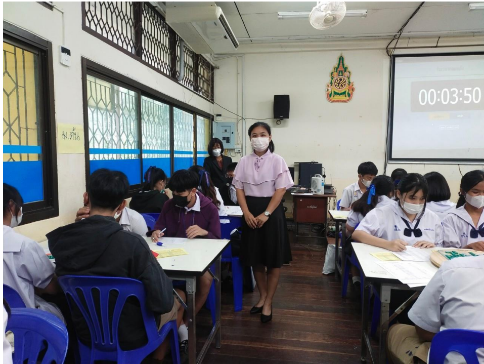
ร่วมเป็นคณะกรรมการตัดสินการแข่งขันต่อคำศัพท์ภาษาอังกฤษ (Crossword) งานศิลปหัตถกรรมนักเรียนครั้งที่ 70 ปีการศึกษา 2565