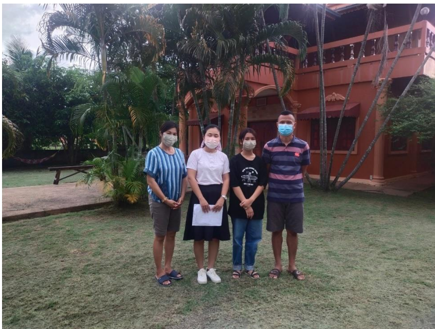
โครงการเยี่ยมบ้านนักเรียนประจำปีการศึกษา 2565