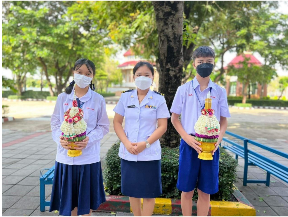
กิจกรรมวันไหว้ครูประจำปีการศึกษา 2565