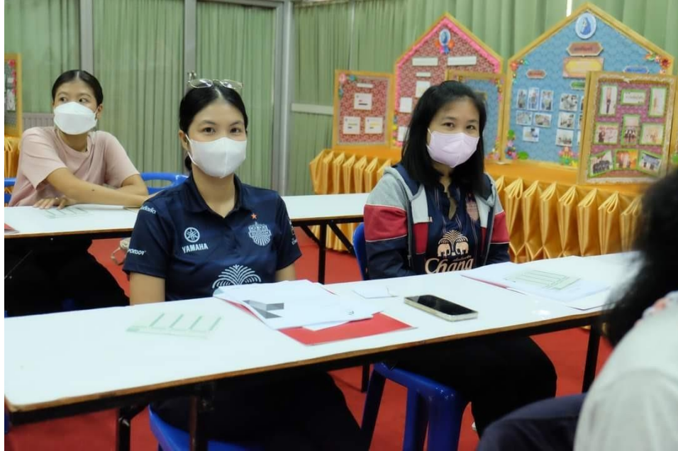
อบรมเชิงปฏิบัติการ “การพัฒนาสมรรถนะผู้เรียน ด้วยหลักสูตรแกนกลางฯ พ.ศ.2551 (ฉบับปรับปรุง พ.ศ.2560) สู่หลักสูตรฐานสมรรถนะ