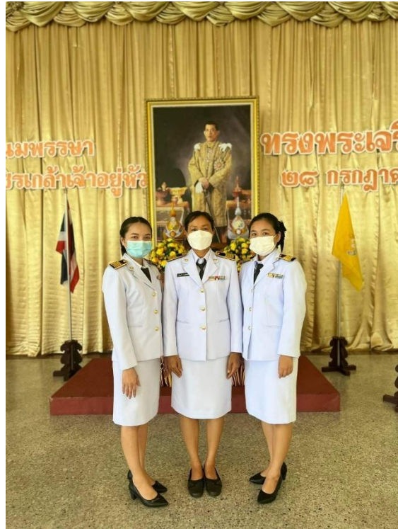
ร่วมกิจกรรมถวายพระพรรัชกาลที่ 10