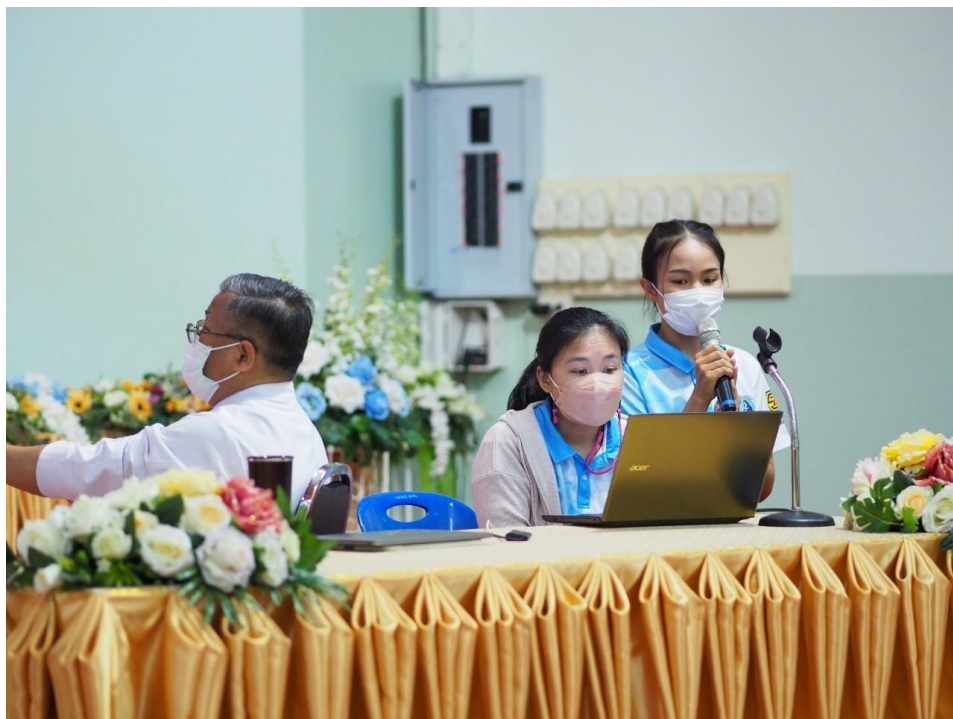
อบรมเชิงปฏิบัติการโรงเรียนคุณธรรม เรื่อง การพัฒนาครูโครงการคุณธรรม