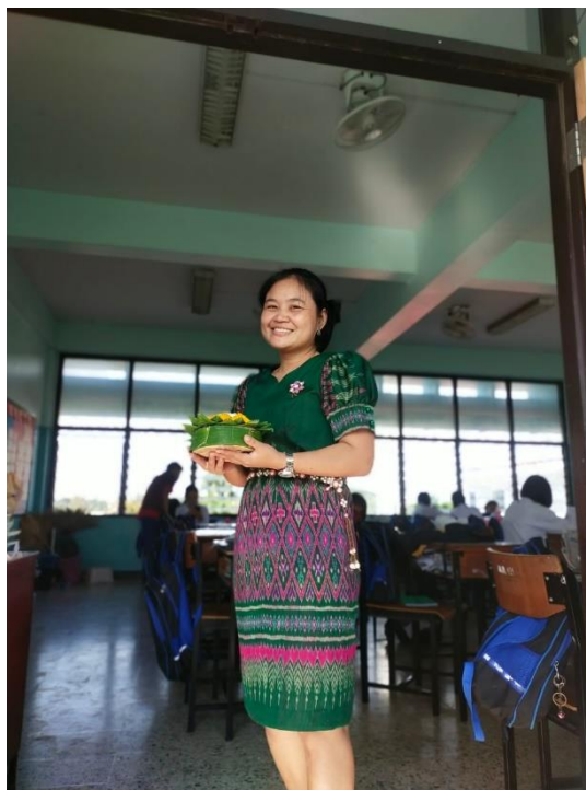
ร่วมกิจกรรมลอยกระทงประจำปีการศึกษา 2565