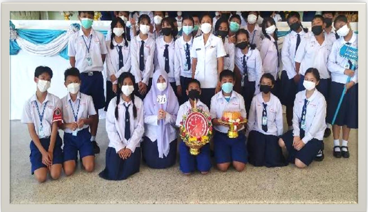
กิจกรรมวันไหว้ครู