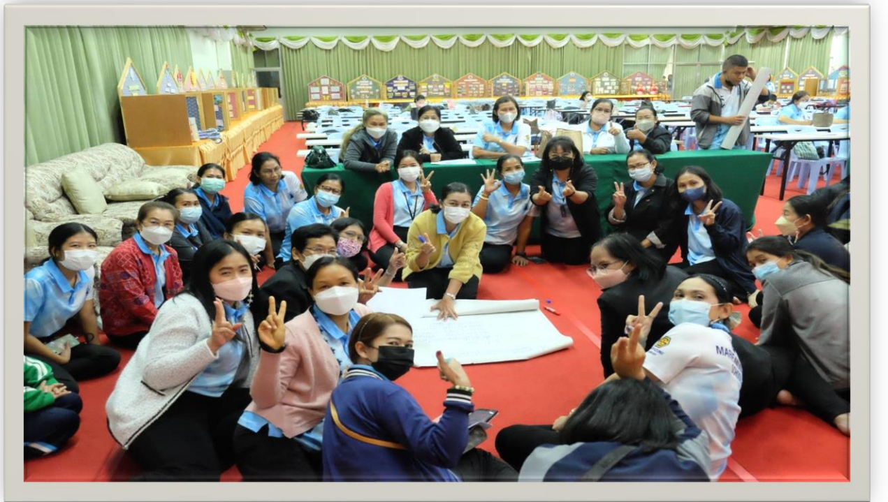
อบรมเชิงปฏิบัติการการจัดทำแผนพัฒนาคุณภาพการศึกษา