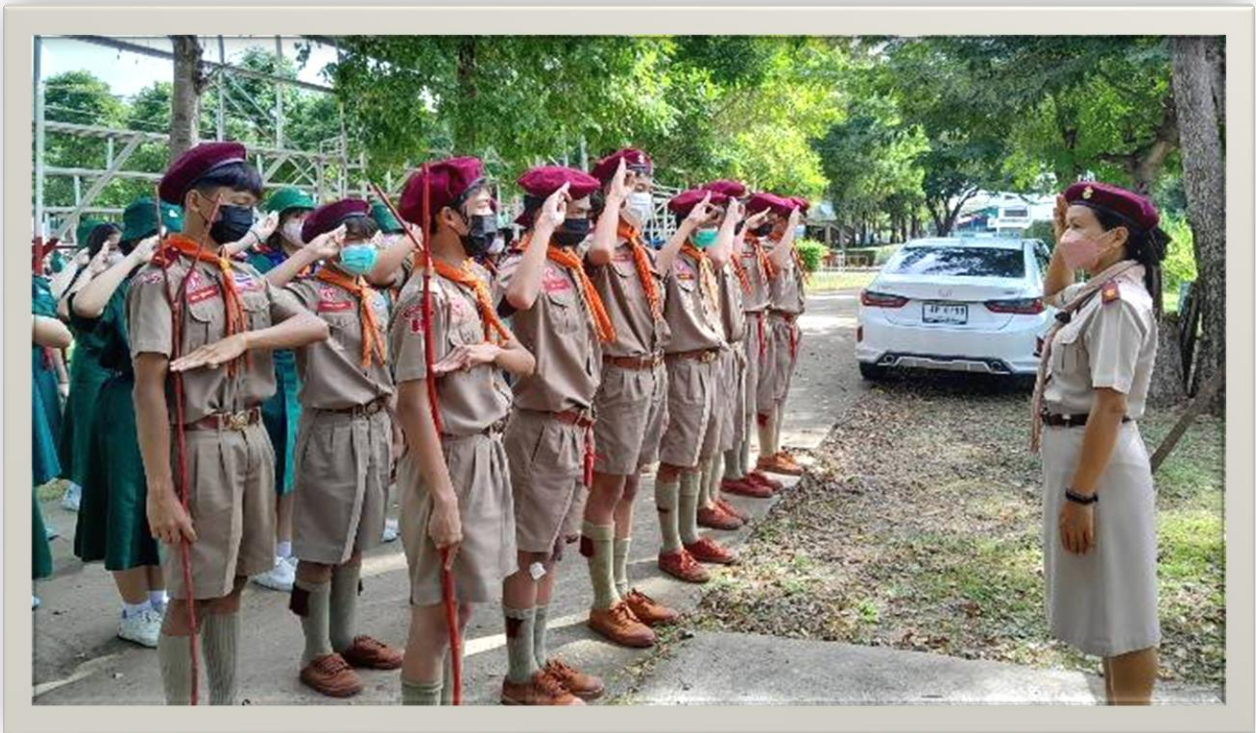
ปฏิบัติหน้าที่สอนกิจกรรมลูกเสือ