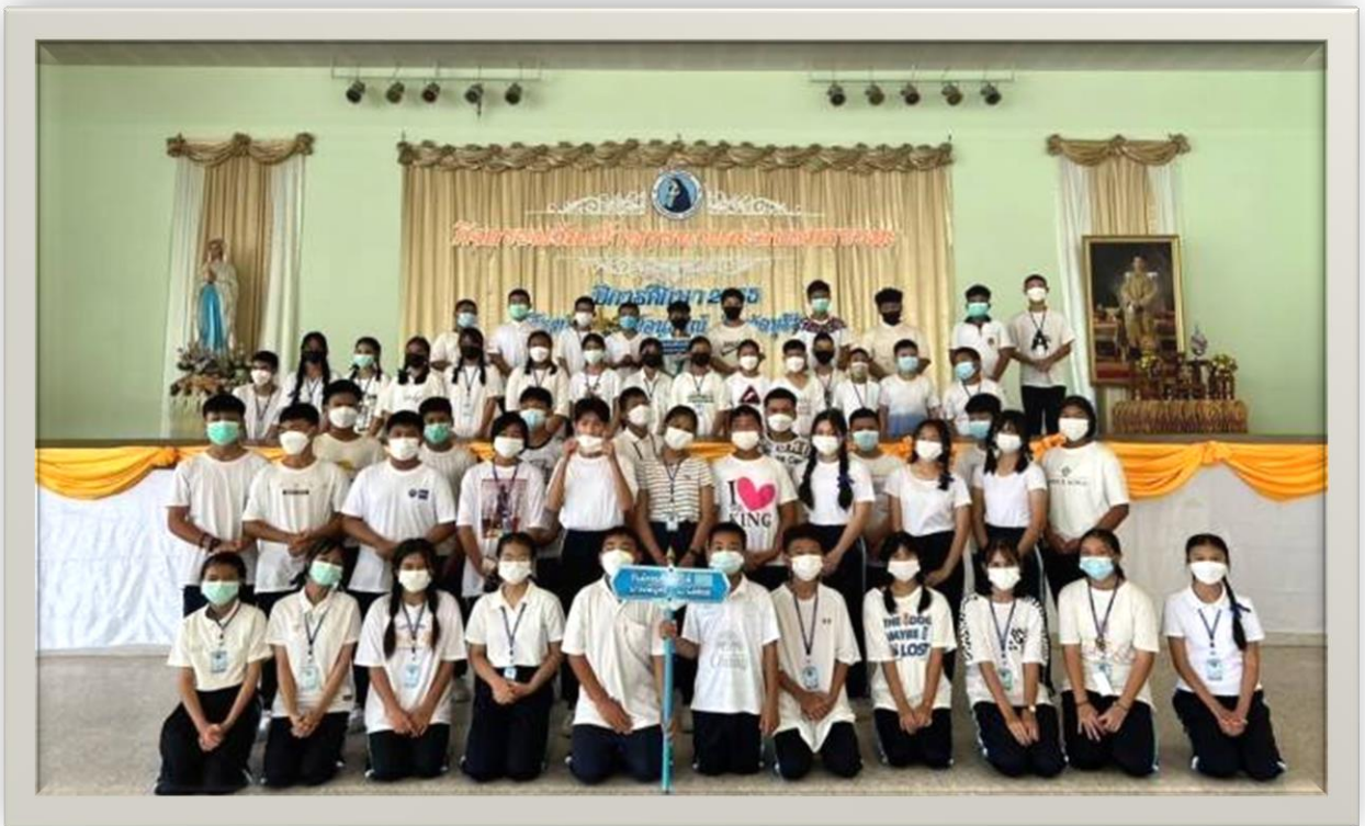
ครูประจำชั้น นักเรียนชั้น มัธยมศึกษาปีที่ 2 /3