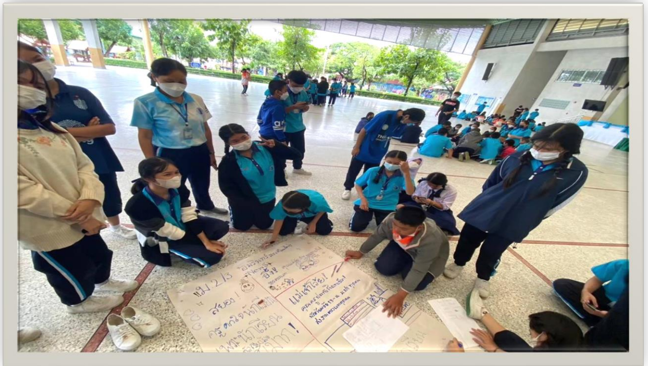
ระดมความคิด ร่วมด้วยช่วยกัน ม.2/3