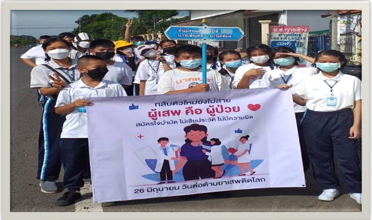
ร่วมรณรงค์ต่อต้านยาเสพติด กับนักเรียนระดับชั้นมัธยมศึกษาปีที่ 1-3