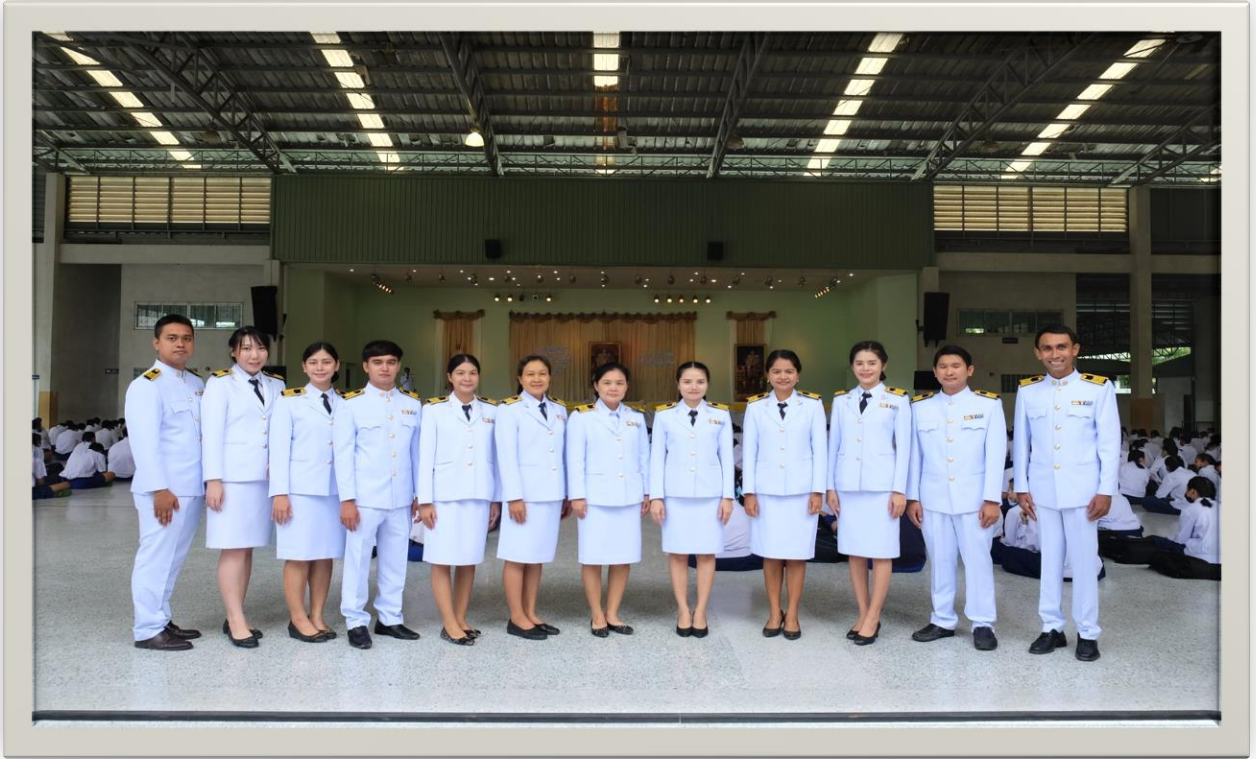
ร่วมกิจกรรมเฉลิมพระชนมพรรษารัชกาลที่ 10