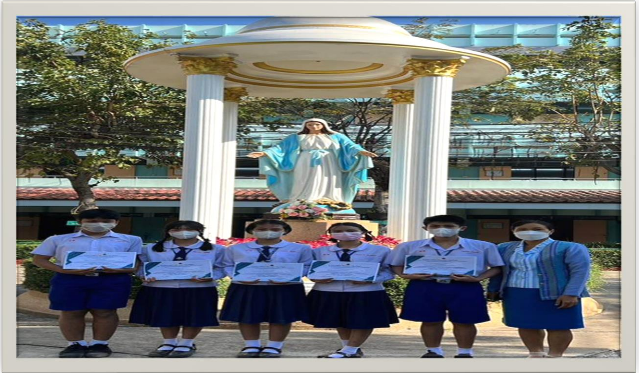
ครูผู้ฝึกซ้อม ชนะเลิศประเภทโครงการคุณธรรม ระดับชั้นมัธยมศึกษาปีที่ 1-3