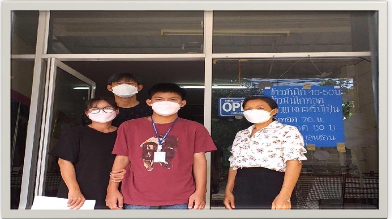
กิจกรรมเยี่ยมบ้านนักเรียน