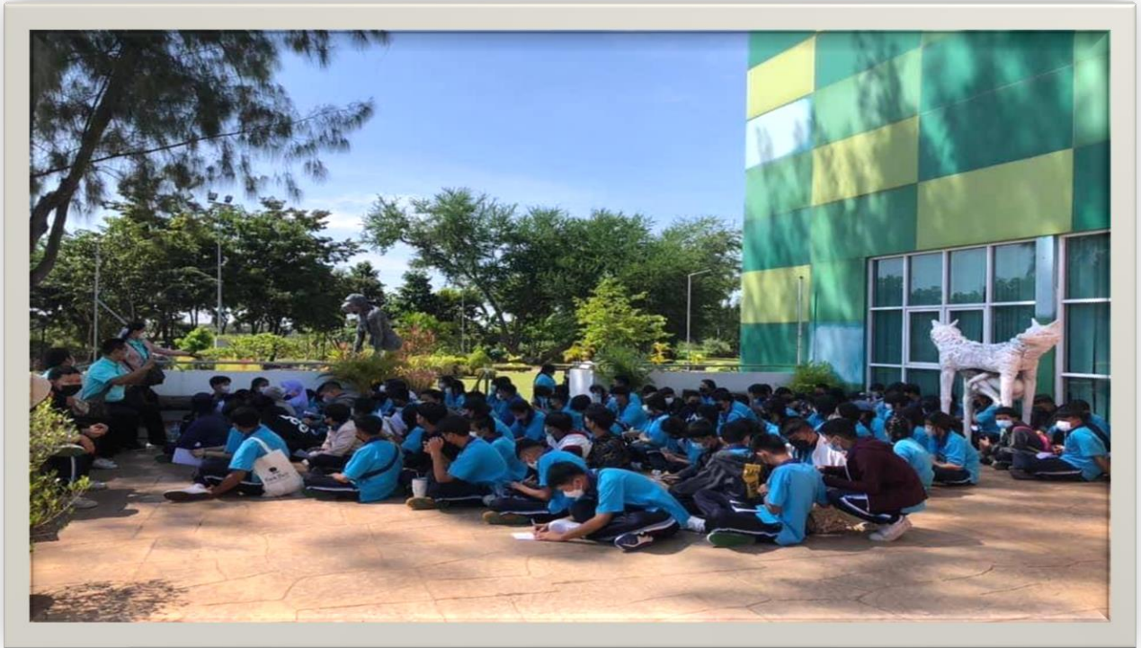
นักเรียนชั้นมัธยมศึกษาปีที่ 2 ทักษะศึกษา ณ พิพิธภัณฑ์ธรรมชาติ มหาวิทยาลัยขอนแก่น จังหวัดขอนแก่น