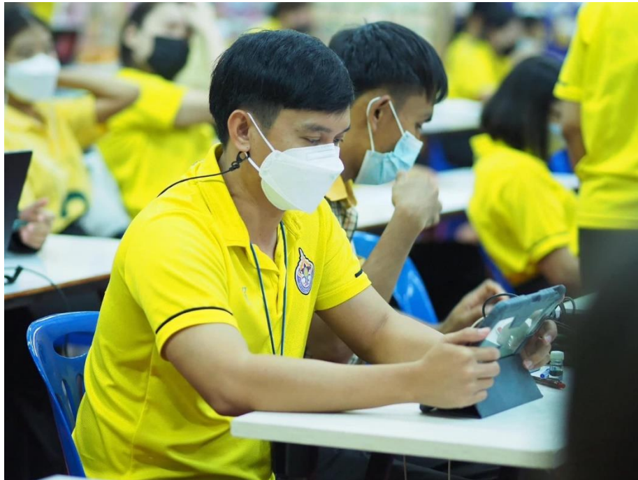
อบรมเชิงปฏิบัติการโรงเรียนคุณธรรม เรื่อง การพัฒนาครูโครงการคุณธรรม