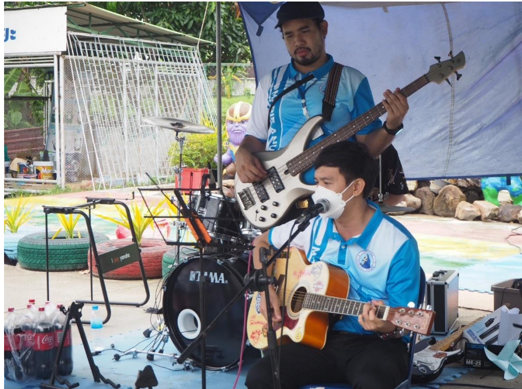
กิจกรรม Open house