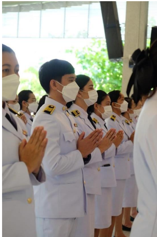
กิจกรรมถวายพระพร สมเด็จพระนางเจ้า พระบรมราชินี