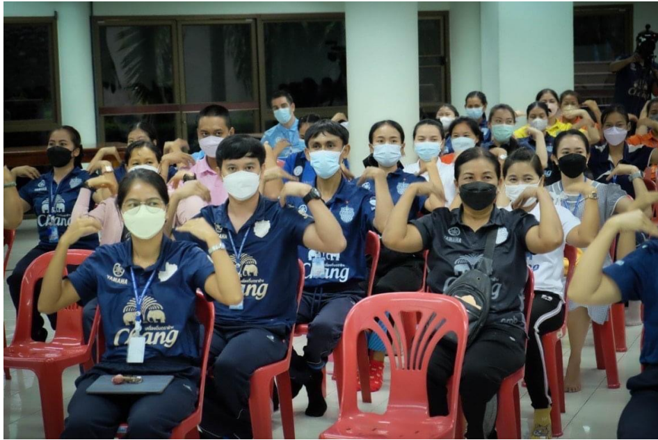
ร่วมกิจกรรม ทูปಿನမ်เบอร์วัน