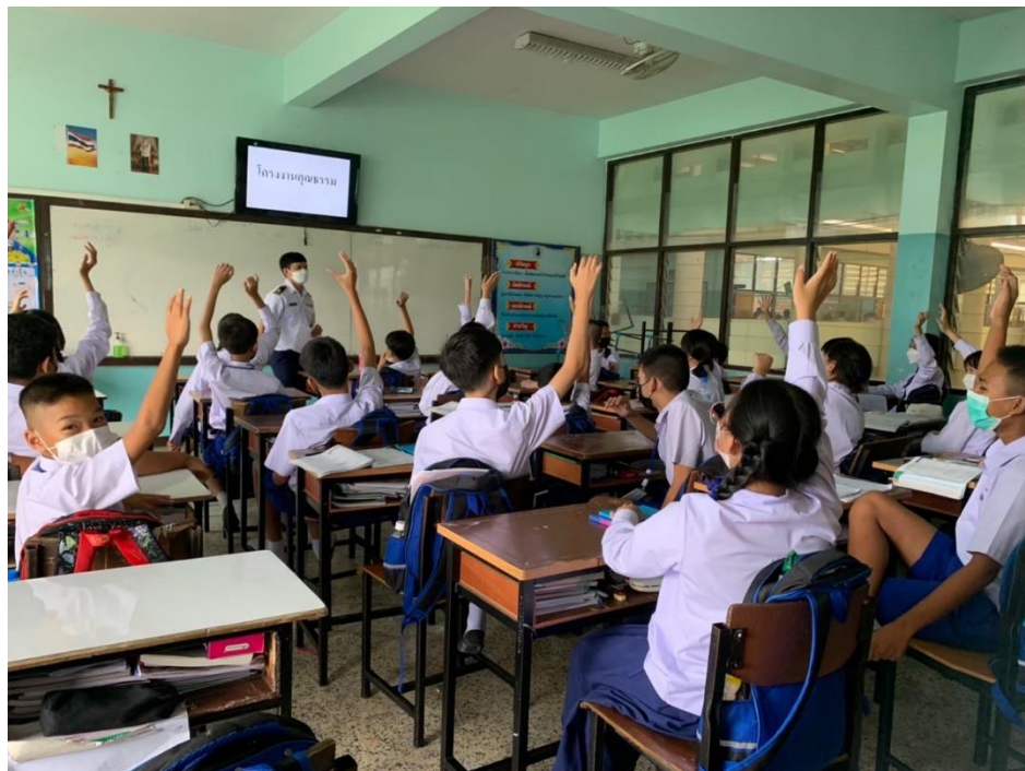
กิจกรรมการคัดเลือกโครงการงานคุณธรรม