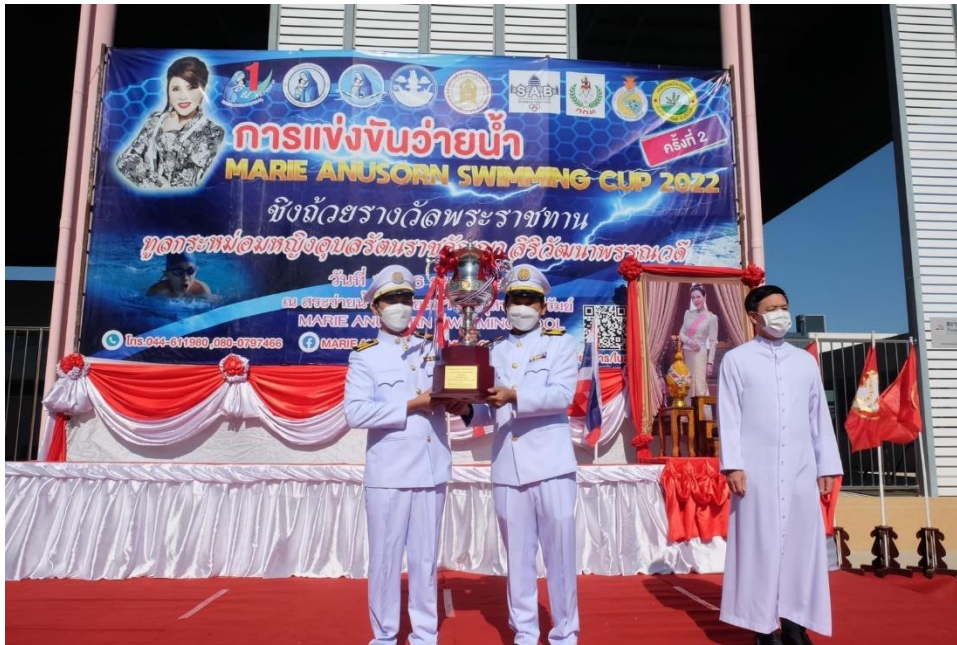
ร่วมพิธีเปิดการแข่งขันว่ายน้ำ ซึ่งถ้วยพระราชทาน