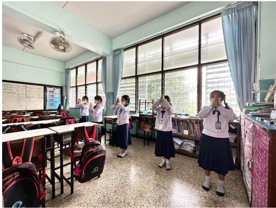
กิจกรรมการฝึกซ้อมการประกวดเพลงคุณธรรม