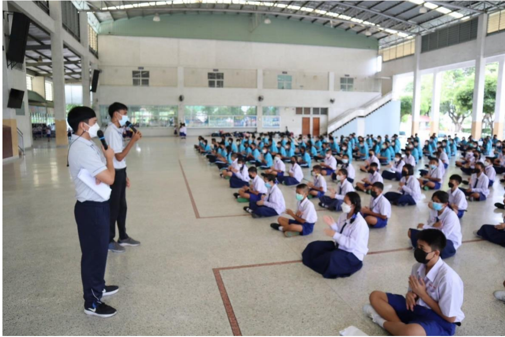
กิจกรรมรับน้อง