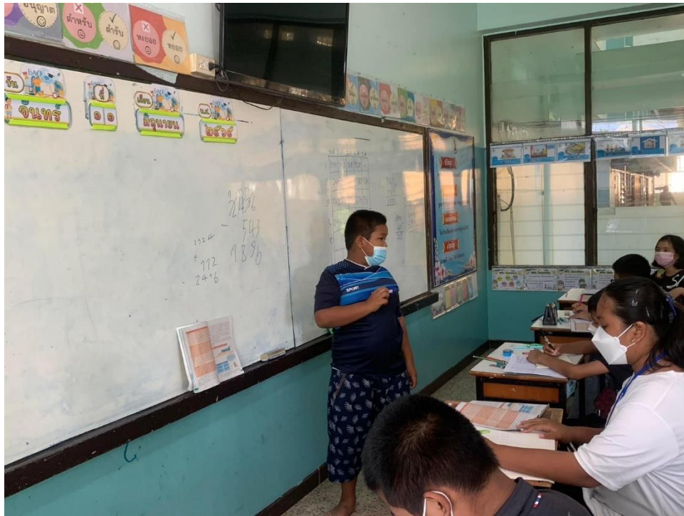
กิจกรรมการสอน เรื่อง การเทียบศักราช