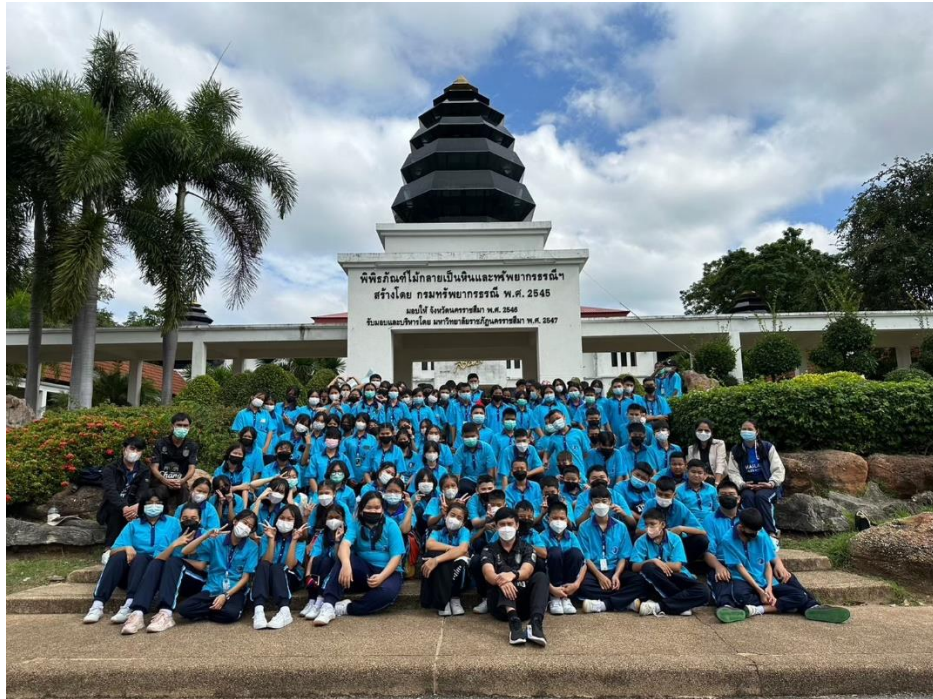
ร่วมกิจกรรมทัศนศึกษานักเรียน ม.1 ณ พิพิธภัณฑสถานแห่งชาติไม้เกลือเป็นหิน