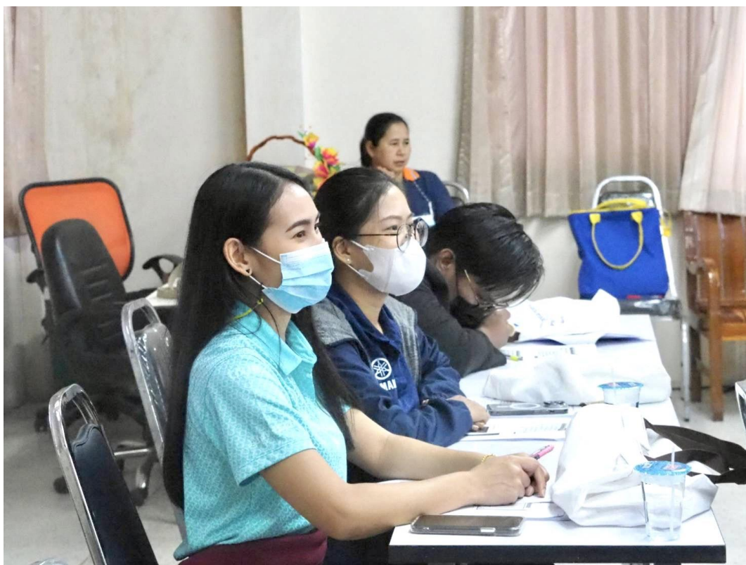
อบรมโครงการการใช้โปรแกรม Excel จากโปรแกรมเครดิตก้าวหน้า ชมรมเจ้าหน้าที่เครดิตยูเนียนอีสาน เขต 4 ณ เครดิตยูเนียนคอคโคจังหวัดสุรินทร์