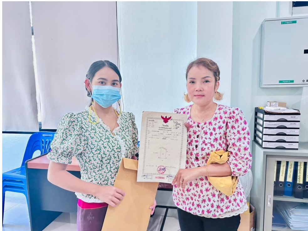
ปฏิบัติหน้าที่ เจ้าหน้าที่การเงินกลุ่มเครดิตฯ ดำเนินการด้านการเงินแก่สมาชิก