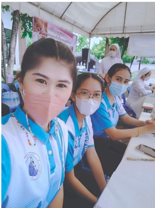
ประจำเต็นท์กองอำนวยการงานฉลองวัด ณ โรงเรียนมารีย์อนุสรณ์บุรีรัมย์