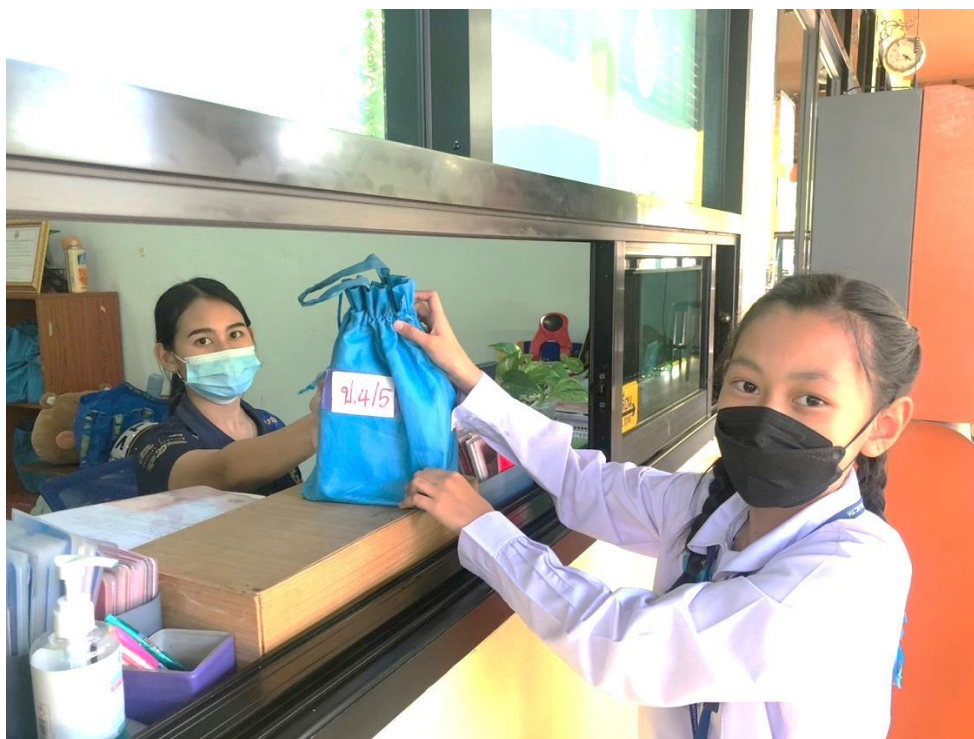
ปฏิบัติหน้าที่ เจ้าหน้าที่การเงินกลุ่มเครดิตฯ รับฝาก- ถอนเงินเด็ก