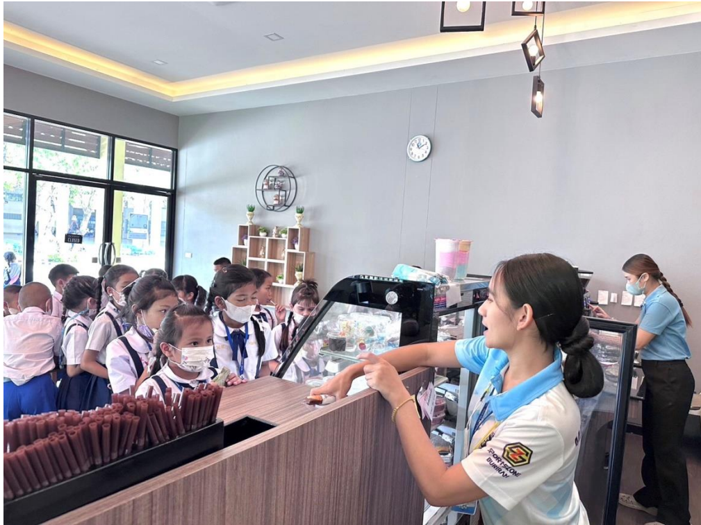
งานอื่นๆ นอกเหนือจากงานประจำที่ได้รับมอบหมาย ณ ร้านมารี๋ยคาเฟ่ โรงเรียนมารี๋ยอนุสรณ์