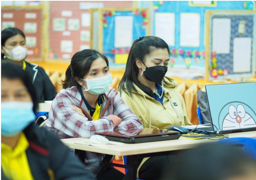
กิจกรรมอบรมโครงการคุณธรรม