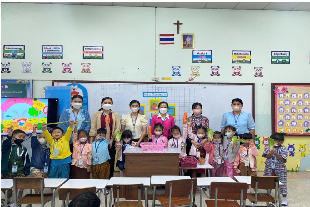
นิเทศการสอนเทอม 2