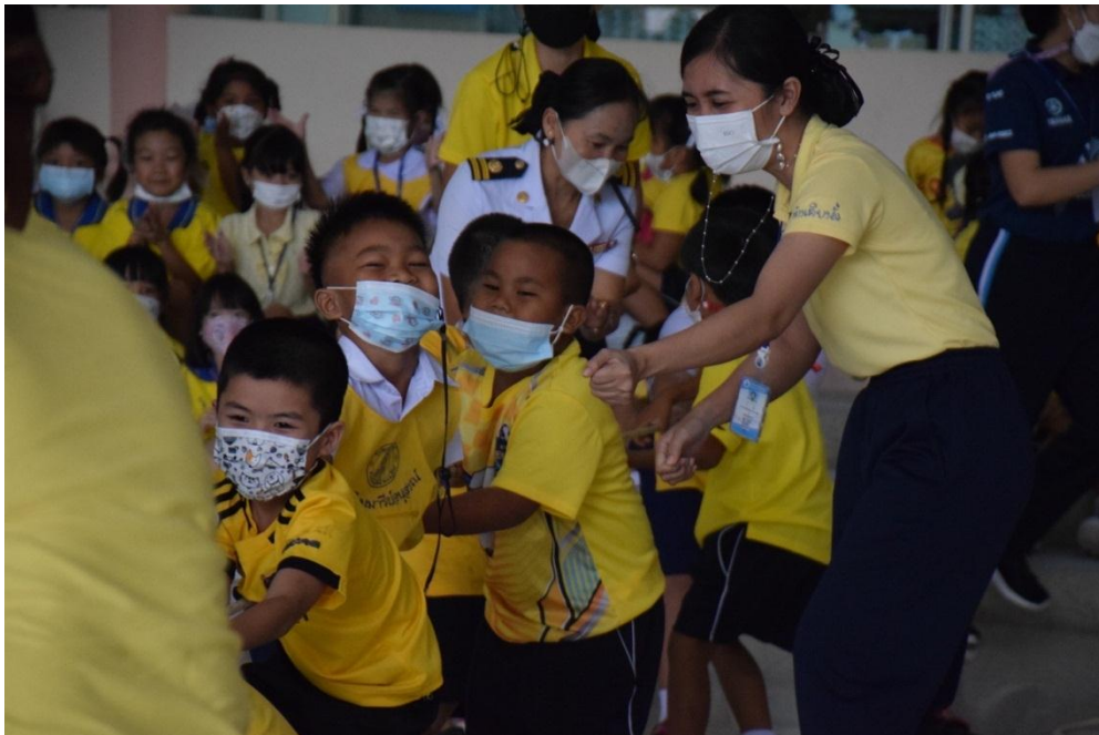
กิจกรรมวันกีฬา