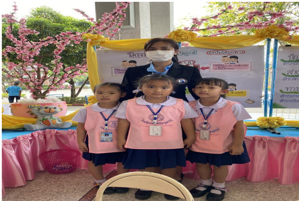
กิจกรรมการนำเสนอโครงการคุณธรรม