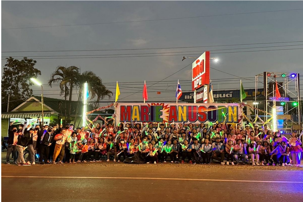
กิจกรรมวิ่งมาราธอน