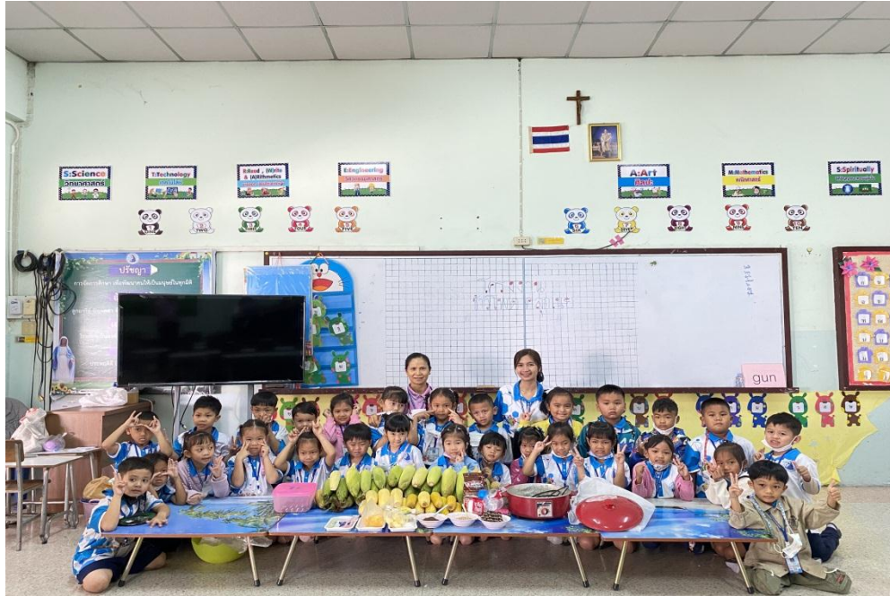
โครงการ “ข้าวโพดอบเนย”