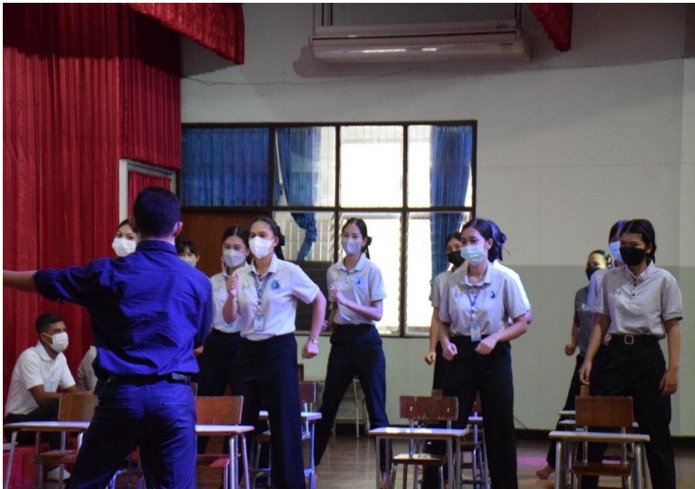
กิจกรรมปฐมนิเทศ