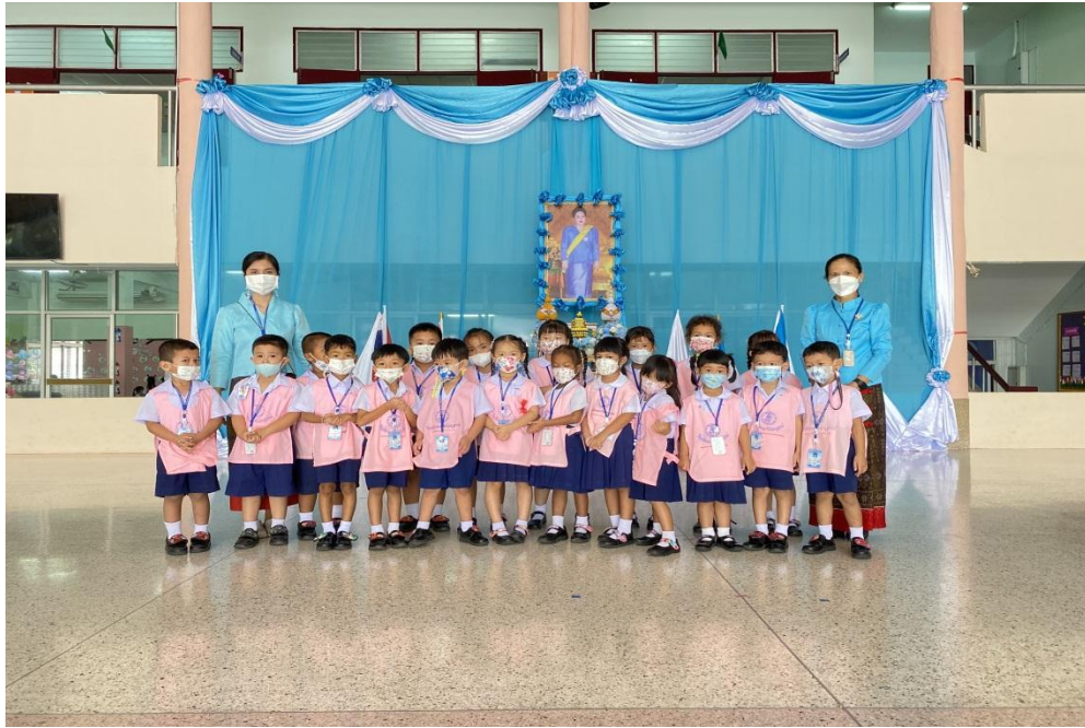
กิจกรรมวันแม่แห่งชาติ