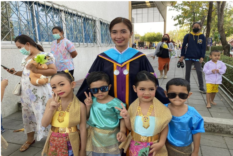
ฝึกซ้อมการแสดงวันบัณฑิตน้อย