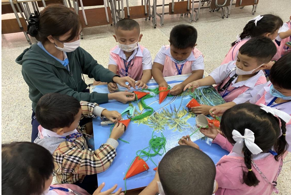
กิจกรรมสตรีม