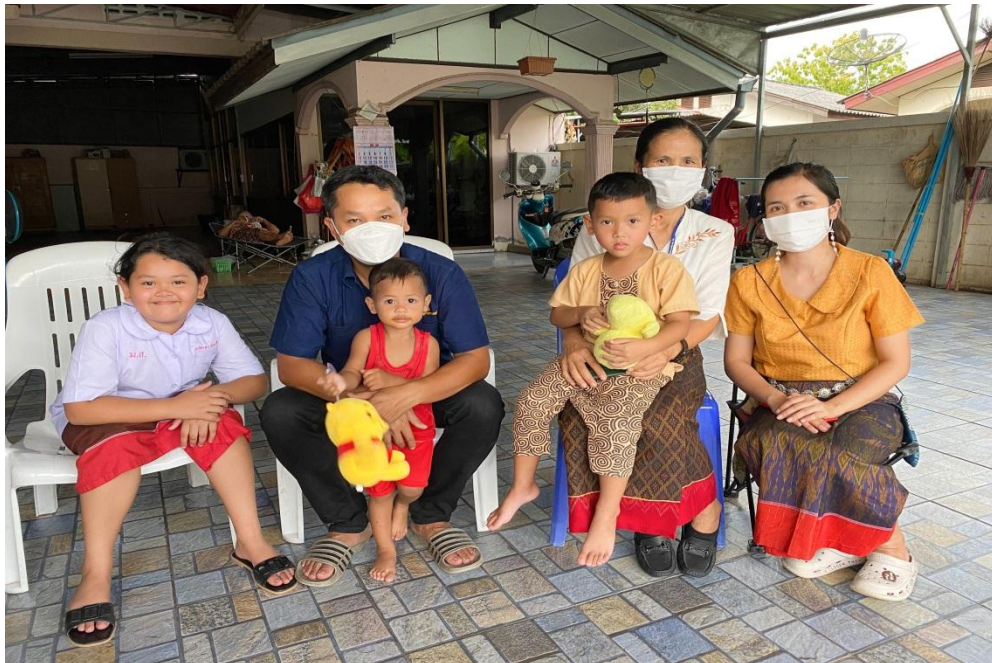
การเยี่ยมบ้านนักเรียน