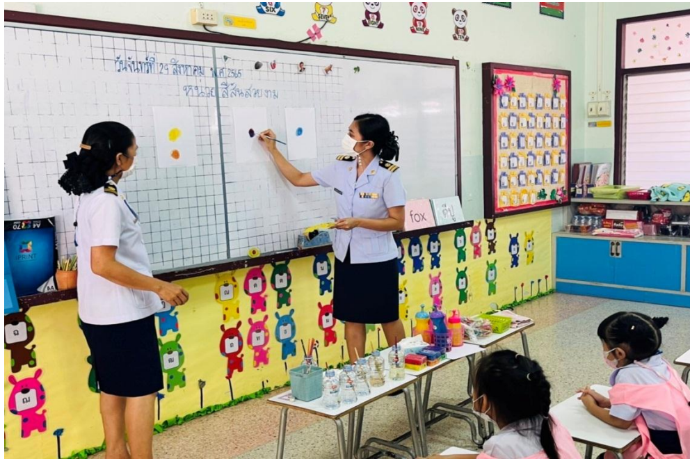
นิเทศการสอนเทอม 1