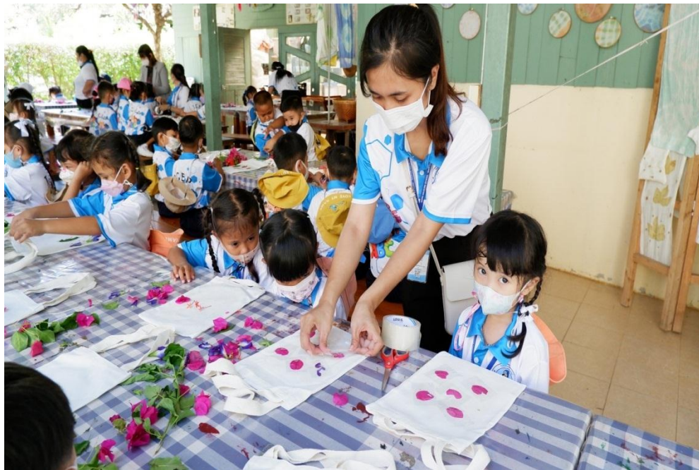
กิจกรรมทัศนศึกษา