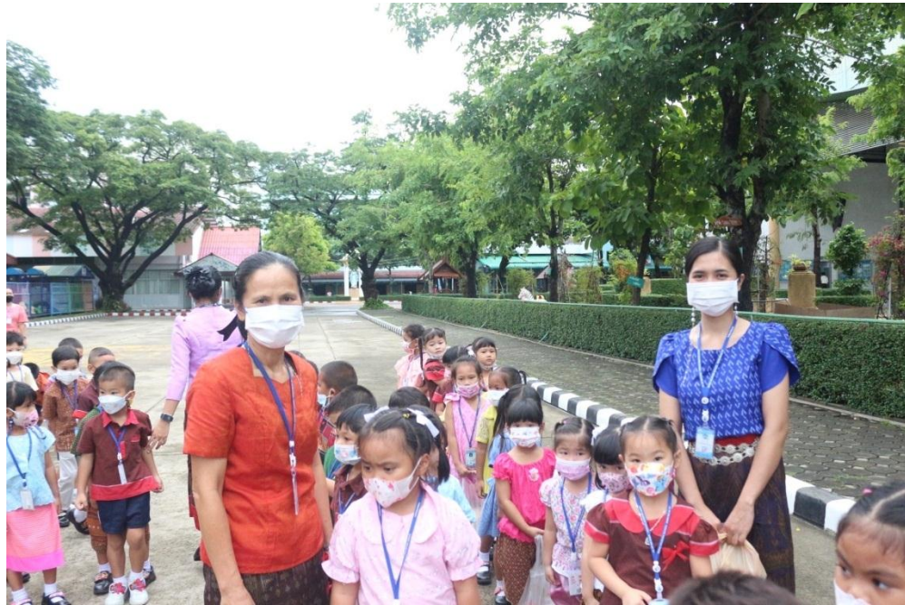
กิจกรรมแห่เทียนพรรษา