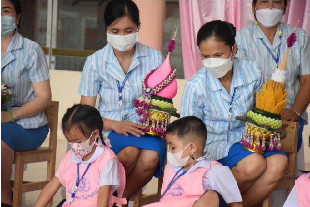
กิจกรรมวันไหว้ครู