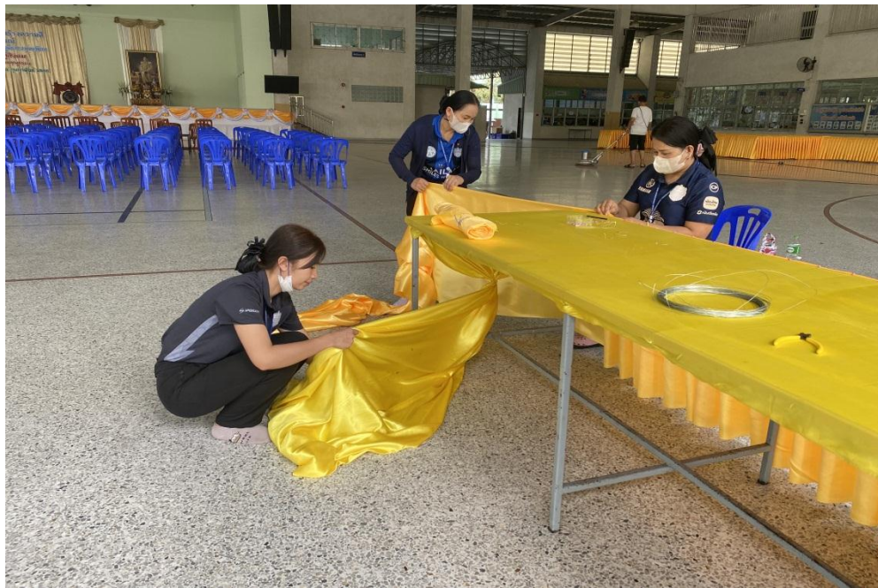
จับผ้าเตรียมงานต่างๆ