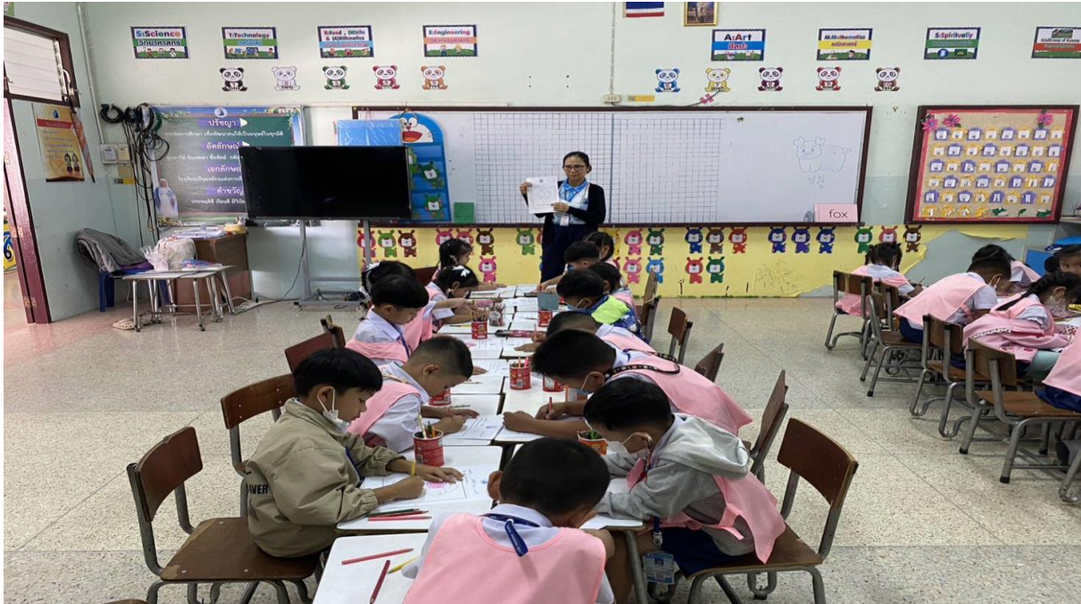
จัดกิจกรรมเสริมประสบการณ์ ตามหน่วยการเรียนรู้