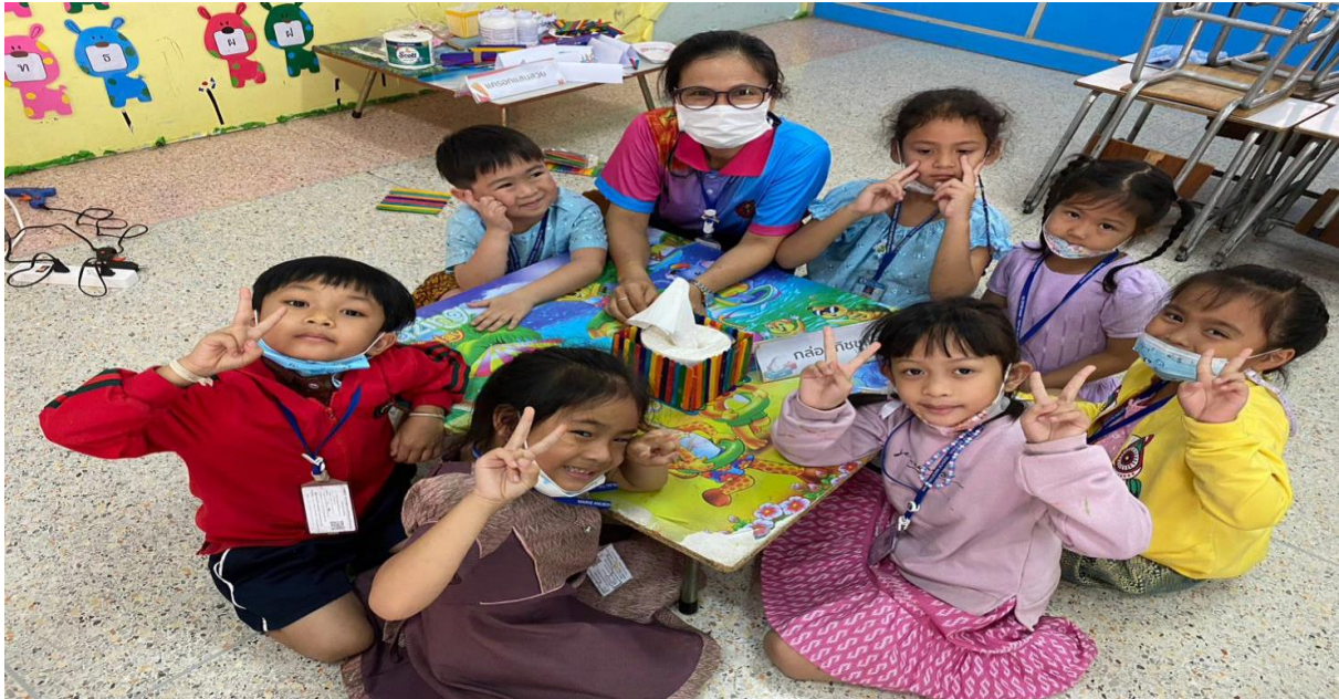
กิจกรรม stem และ steam ของห้องอนุบาล 2/2