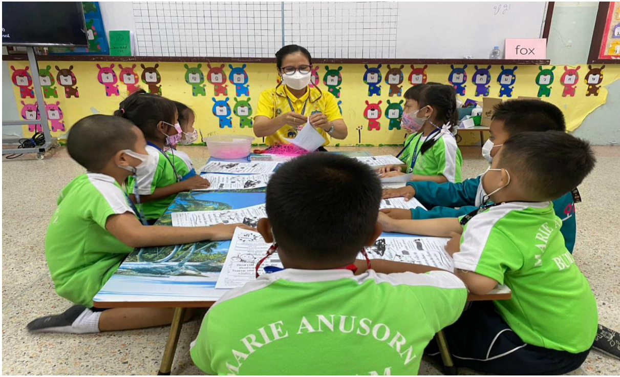
ดูแลการเรียนการสอนเด็กอนุบาล 2/2