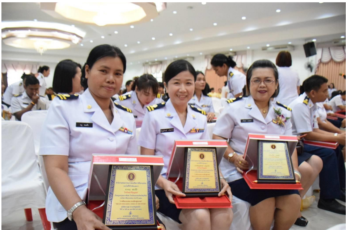
ได้รับโลรางวัลครูดีเด่น วันการศึกษาเอกชน