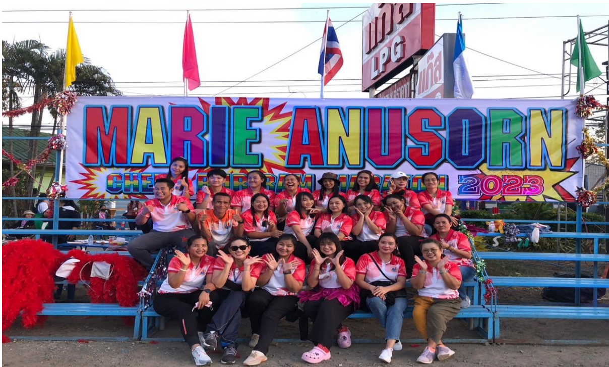
ร่วมกิจกรรมเชียร์กีฬาวิ่งมาราธอน ปี2565