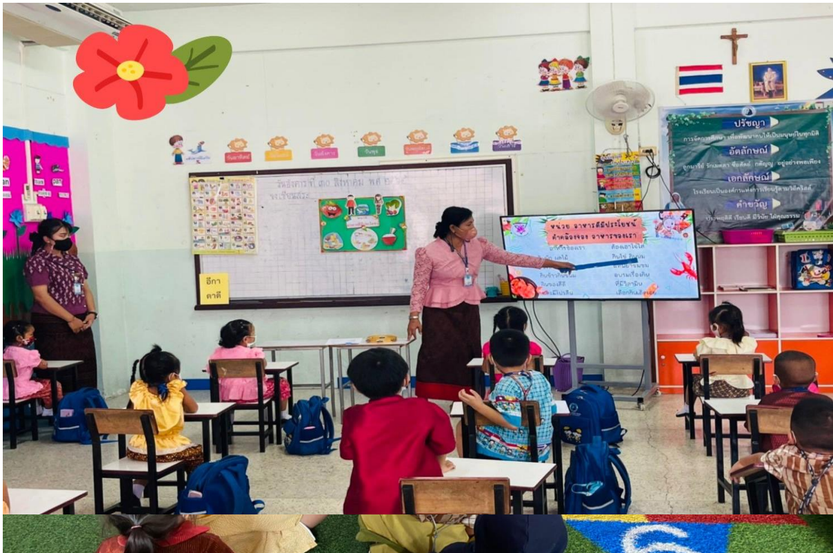
กิจกรรมนิเทศการสอน ภาคเรียนที่1 เรื่อง อาหารดีมีประโยชน์