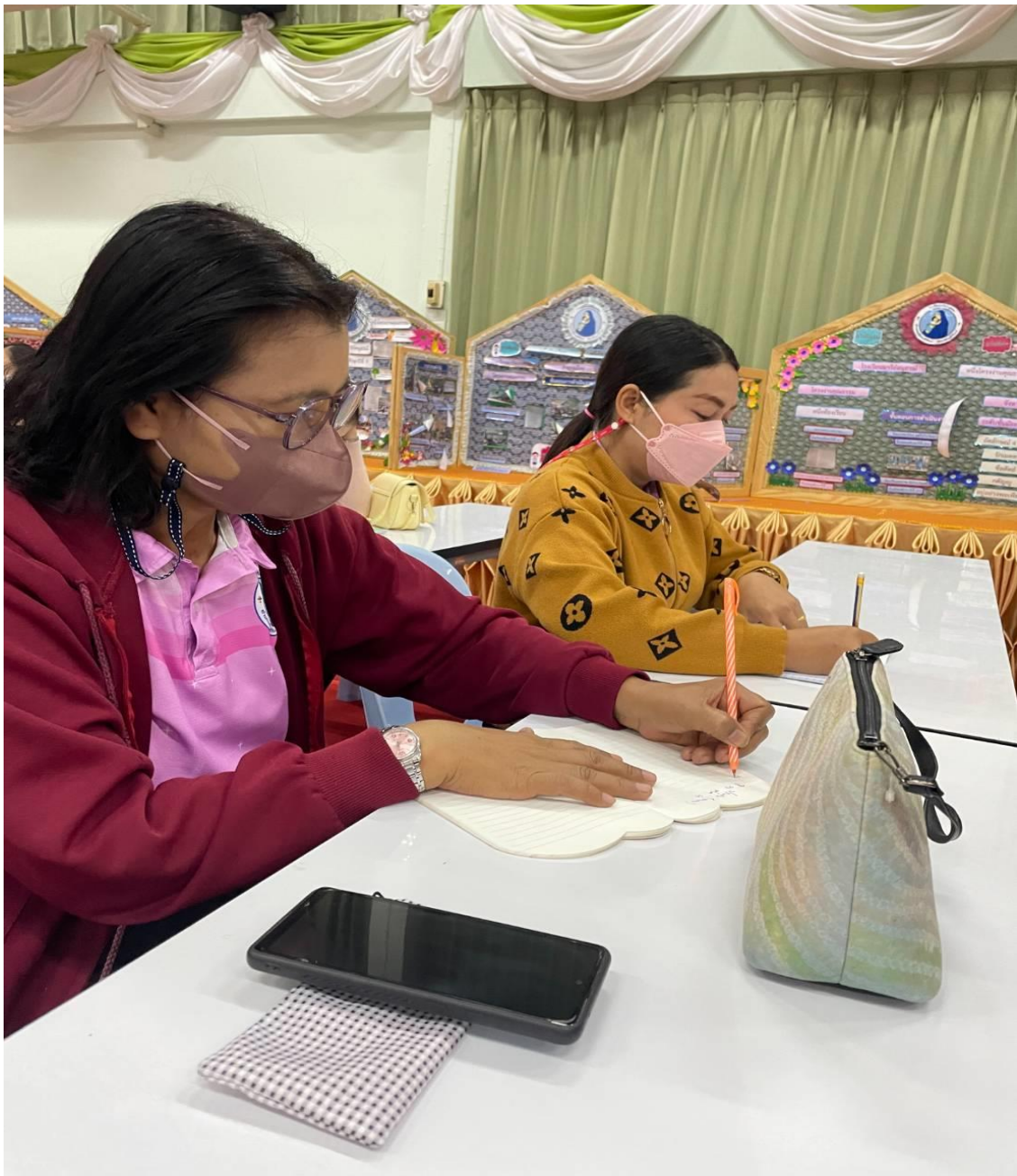
อบรมเชิงปฏิบัติการโรงเรียนคุณธรรม เรื่อง การพัฒนาครูโครงการคุณธรรม อบรมเชิงปฏิบัติการ “การพัฒนาสมรรถนะผู้เรียน ด้วยหลักสูตรแกนกลางฯ พ.ศ.2551 (ฉบับปรับปรุง พ.ศ.2560) สู่หลักสูตรฐานสมรรถนะ