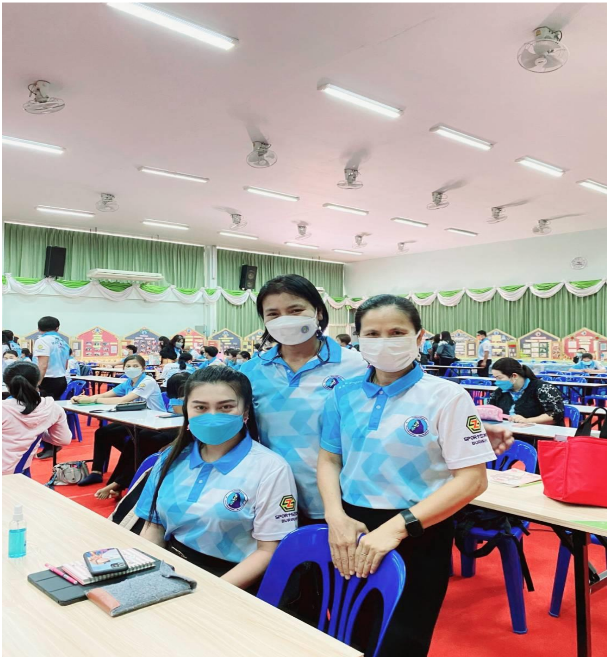
อบรมเชิงปฏิบัติการโรงเรียนคุณธรรม เรื่อง การพัฒนาครูโครงการคุณธรรม อบรมเชิงปฏิบัติการ “การพัฒนาสมรรถนะผู้เรียน ด้วยหลักสูตรแกนกลางฯ พ.ศ.2551 (ฉบับปรับปรุง พ.ศ.2560) สู่หลักสูตรฐานสมรรถนะ