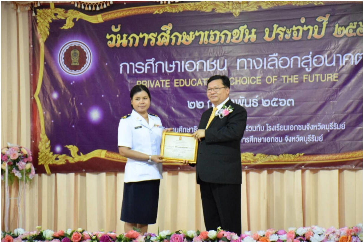
ได้รับเกียรติบัตรครูดีเด่น วันการศึกษาเอกชน