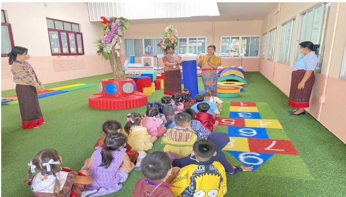
กิจกรรมนิเทศการสอน ภาคเรียนที่2 เรื่อง คณิตศาสตร์น่ารู้ รูปทรงเรขาคณิต