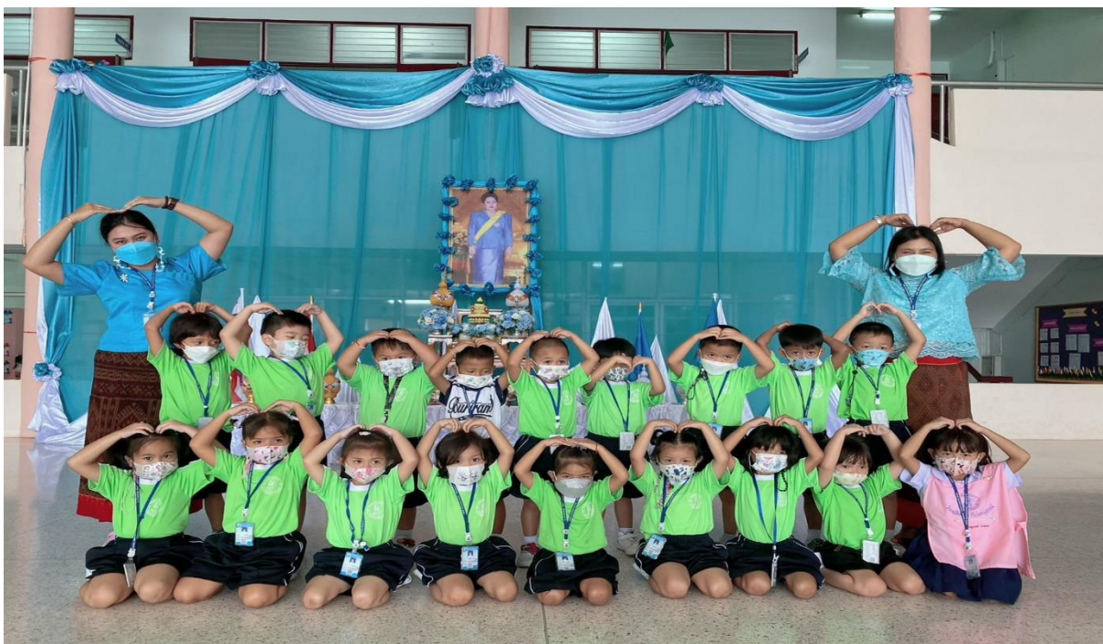
ร่วมกิจกรรมวันแม่