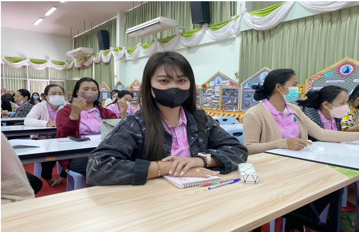
อบรมเชิงปฏิบัติการโรงเรียนคุณธรรม เรื่อง การพัฒนาครูโครงการคุณธรรม อบรมเชิงปฏิบัติการ “การพัฒนาสมรรถนะผู้เรียน ด้วยหลักสูตรแกนกลางฯ พ.ศ.2551 (ฉบับปรับปรุง พ.ศ.2560) สู่หลักสูตรฐานสมรรถนะ