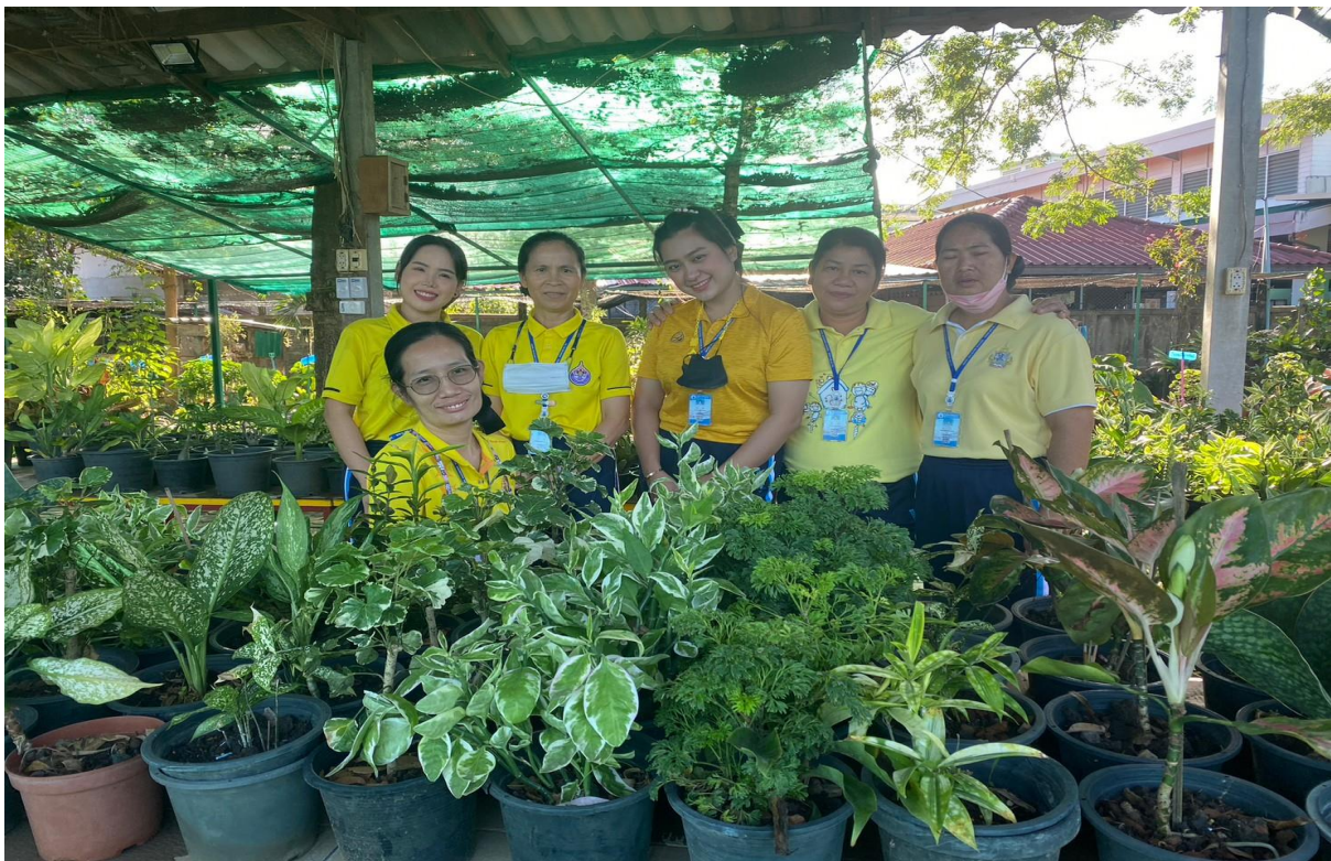
ขายต้นไม้วันดินโลก