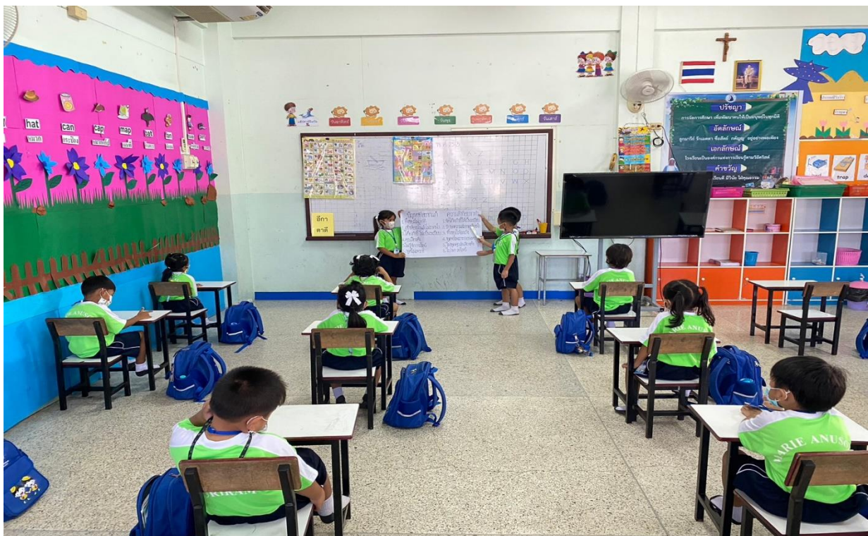
เป็นครูที่ปรึกษาจัดทำโครงการคุณธรรมเรื่อง หนึ่งโครงการ หนึ่งห้องเรียนคุณธรรมโครงการ คุณธรรมเรื่อง จัดโต๊ะเก้าอี้ เด็กดีทำได้