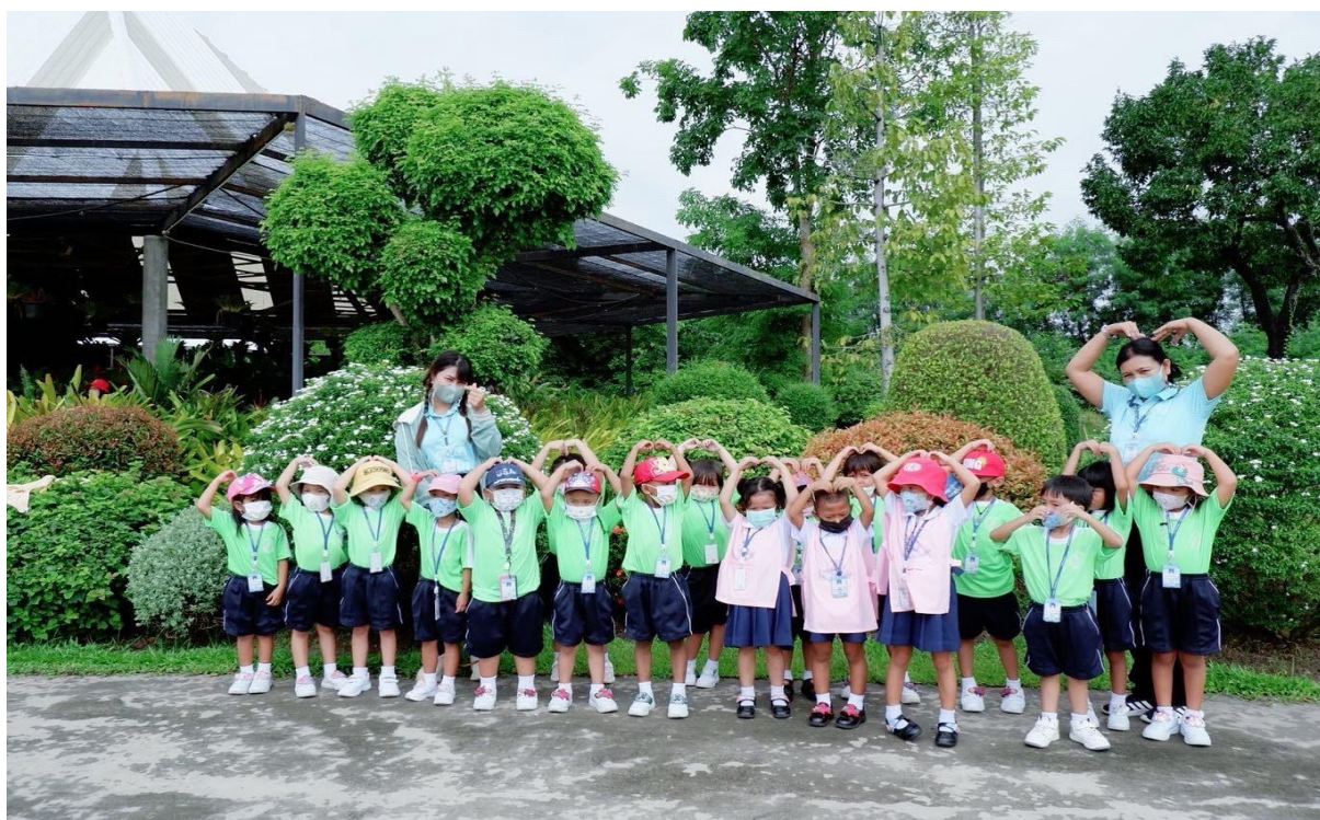
ร่วมกิจกรรมทัศนศึกษาเด็กนักเรียนระดับชั้นอนุบาลปีที่ 2/7 ณ สนามช้างอารีนา จังหวัดบุรีรัมย์