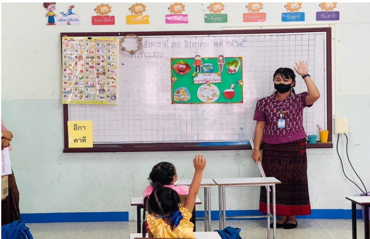
กิจกรรมนิเทศการสอน ภาคเรียนที่1 เรื่อง อาหารดีมีประโยชน์