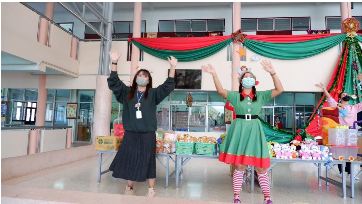
ร่วมกิจกรรมวันคริสต์มาส