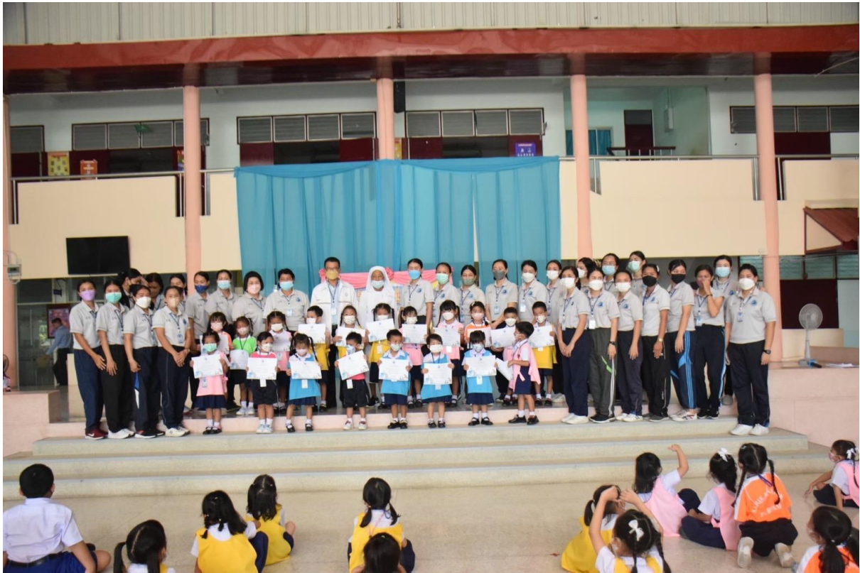
เป็นผู้รับผิดชอบกิจกรรม วันสุนทรภู่ ปีการศึกษา 2565 ณ โรงเรียนมารีย์อนุสรณ์