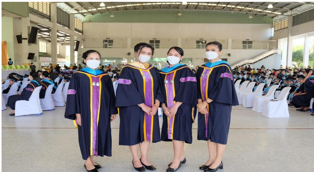
ร่วมกิจกรรมวันบัณฑิตน้อยของนักเรียนระดับอนุบาล 3 ณ โรงเรียนมารีย์อนุสรณ์