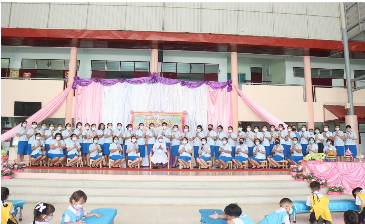
ร่วมกิจกรรมวันไหว้ครู