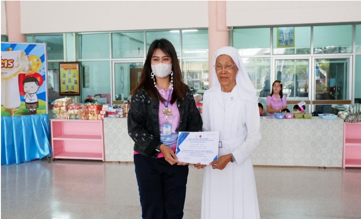
ครูผู้ฝึกสอนนักเรียนกิจกรรมการประกวดผลงานสิ่งประดิษฐ์ทางวิทยาศาสตร์ ระดับชั้นปฐมวัย การแข่งขันมารยาทไทย