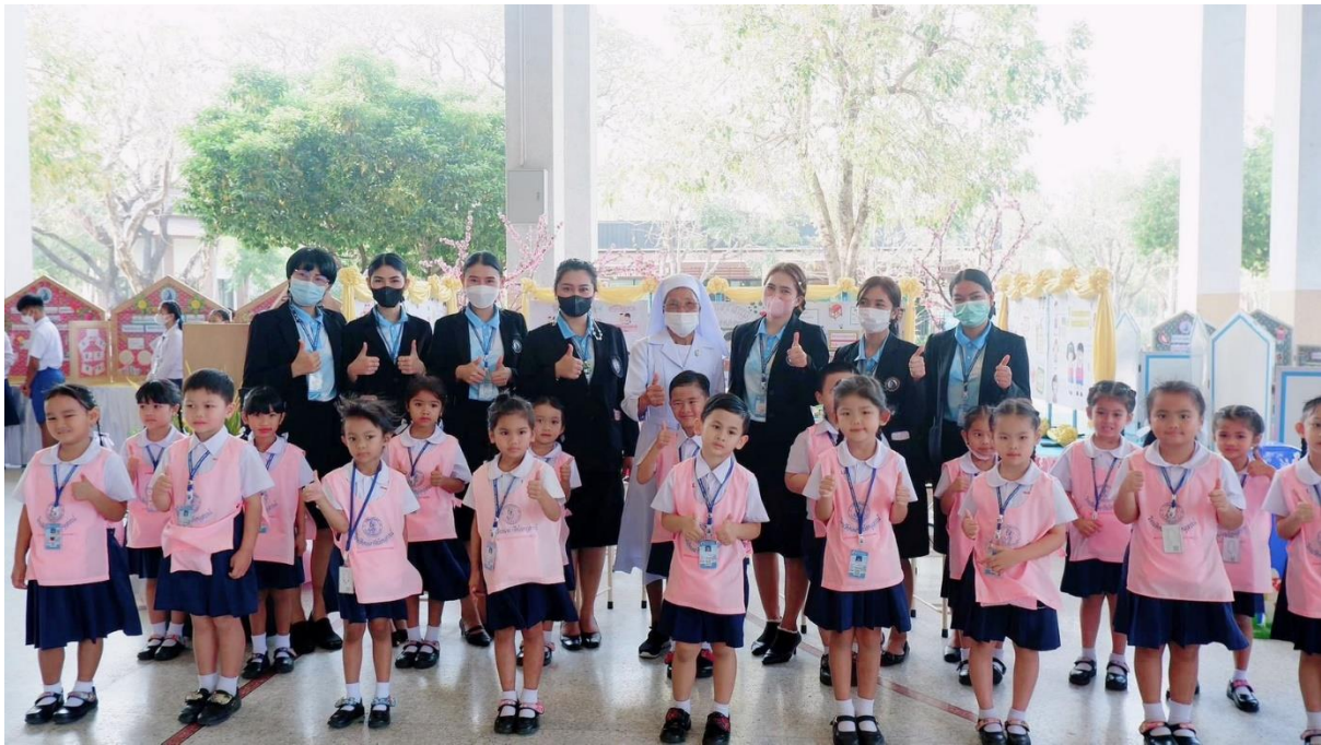
ครูฝึกสอนการแสดงของเด็กวันตลาดนัดโครงการคุณธรรม