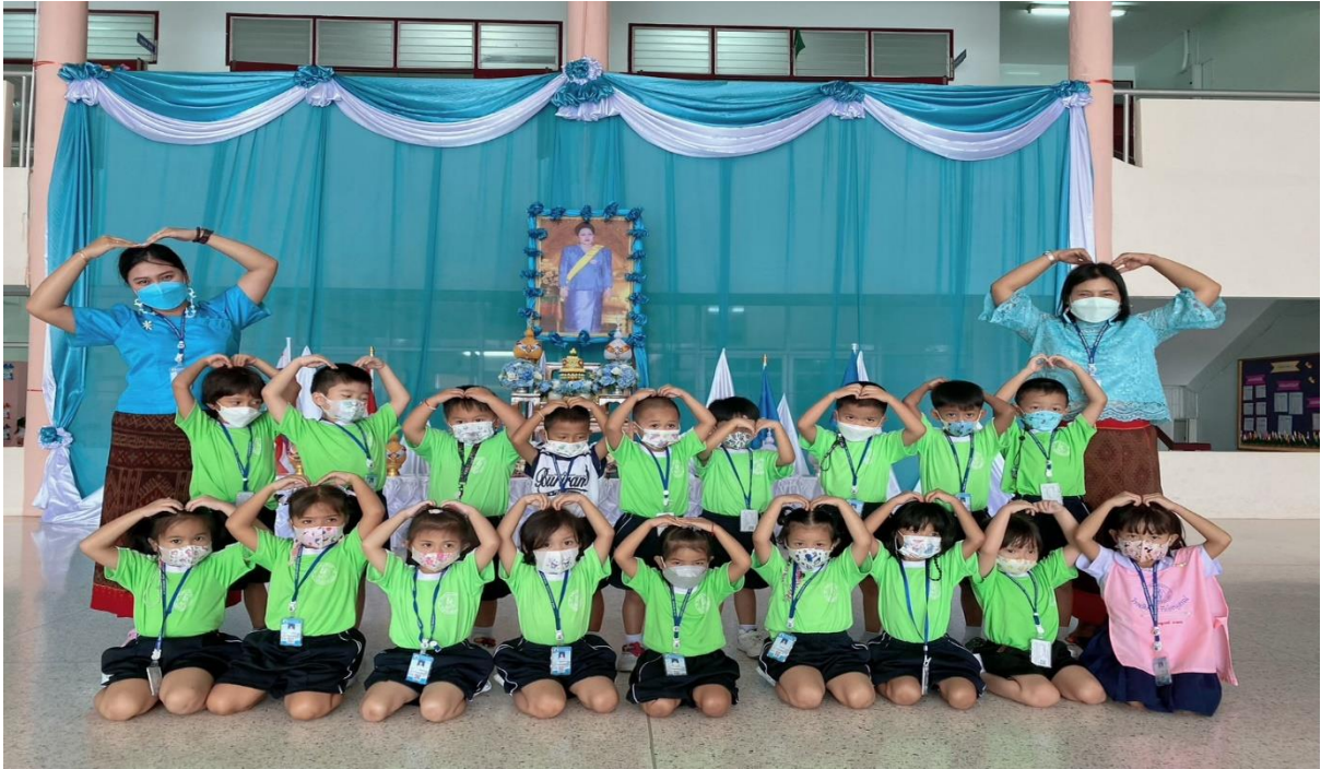
ร่วมกิจกรรมวันแม่