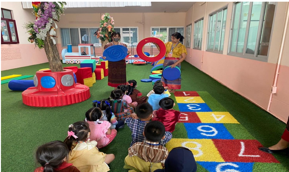
กิจกรรมนิเทศการสอน ภาคเรียนที่2 เรื่อง คณิตศาสตร์น่ารู้ รูปทรงเรขาคณิต