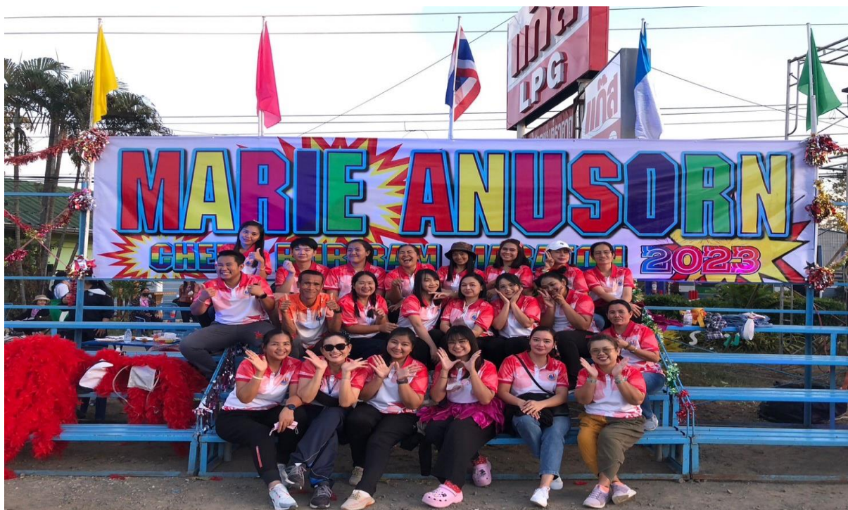
ร่วมกิจกรรมเชียร์กีฬาวิ่งมาราธอน ปี2565