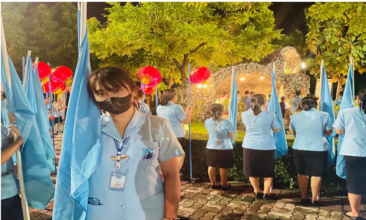
ร่วมกิจกรรมมิตซาของโรงเรียนมารีย์อนุสรณ์