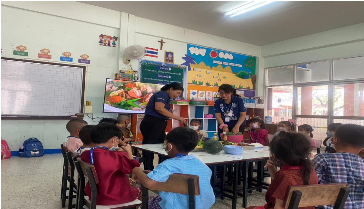
จัดทำโครงการในห้องเรียน เรื่องผักดีมีประโยชน์