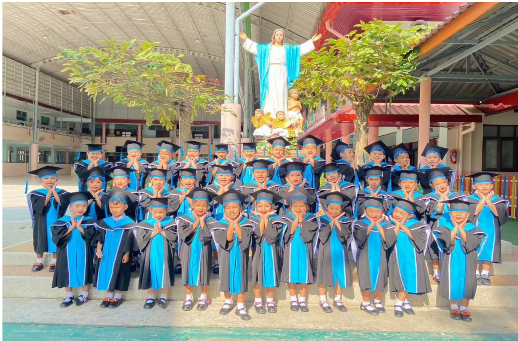
รูปภาพที่ 18 กิจกรรมบัณฑิตน้อย