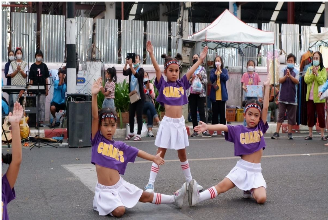
รูปภาพที่ 16 กิจกรรมคริสต์มาสสู่ชุมชน