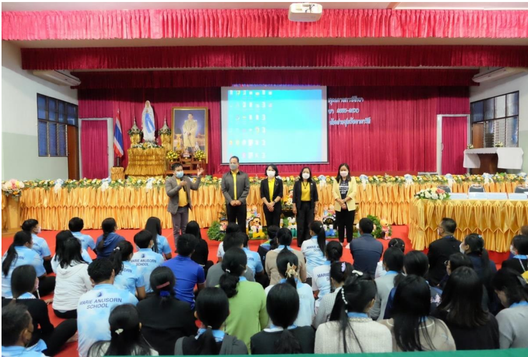
รูปภาพที่ 13 กิจกรรมอบรมเชิงปฏิบัติการการจัดทำแผนพัฒนาคุณภาพการศึกษา