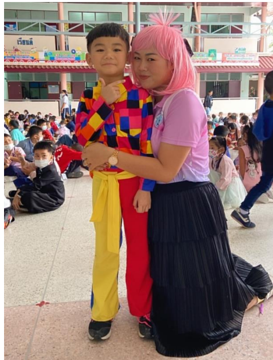
รูปภาพที่ 8 กิจกรรมวันเด็กแห่งชาติ