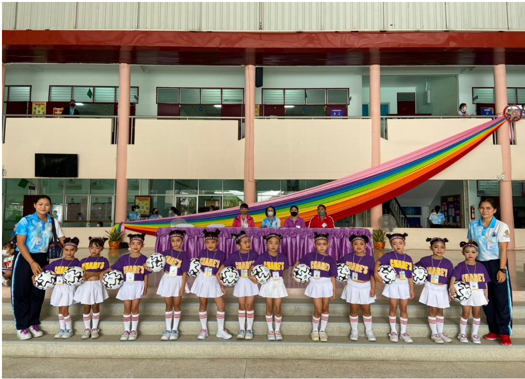
รูปภาพที่ 9 กิจกรรมการแข่งขันออกกำลังกายประกอบเพลง ระดับปฐมวัย