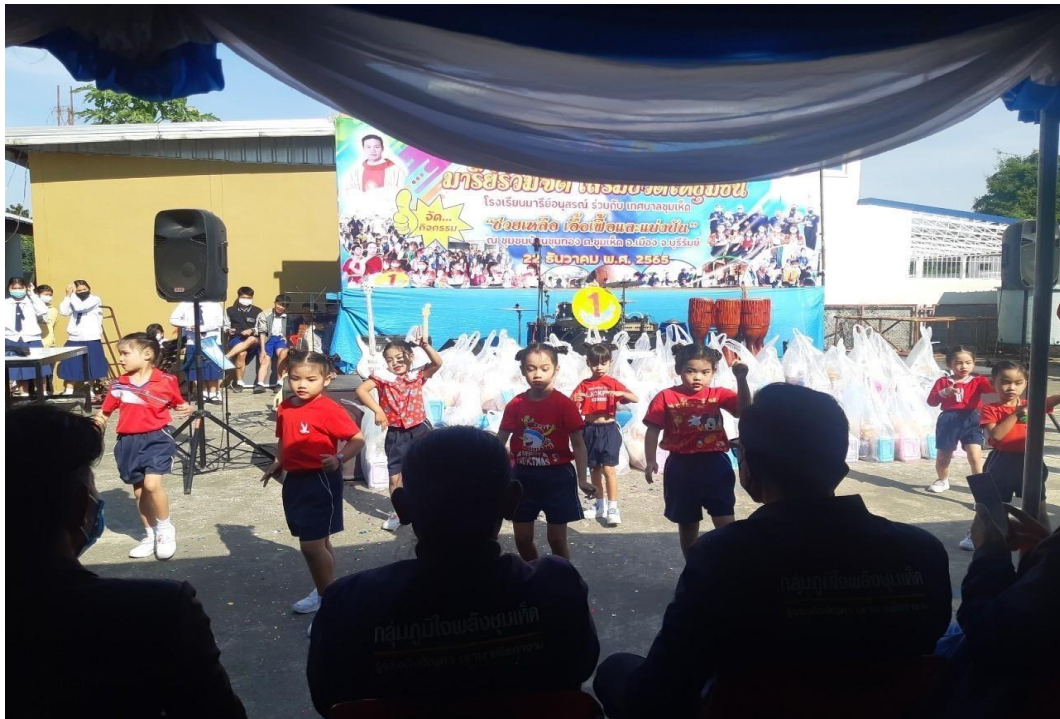
รูปภาพที่ 12 กิจกรรมมารีย์ร่วมจิต