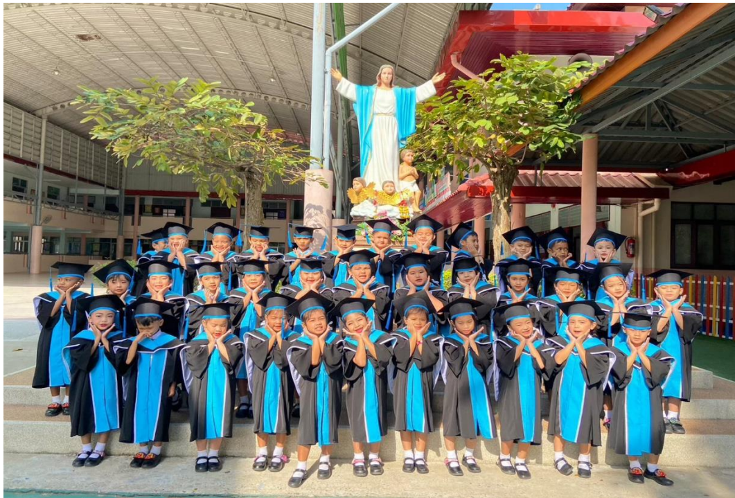
รูปภาพที่ 17 กิจกรรมบัณฑิตน้อย