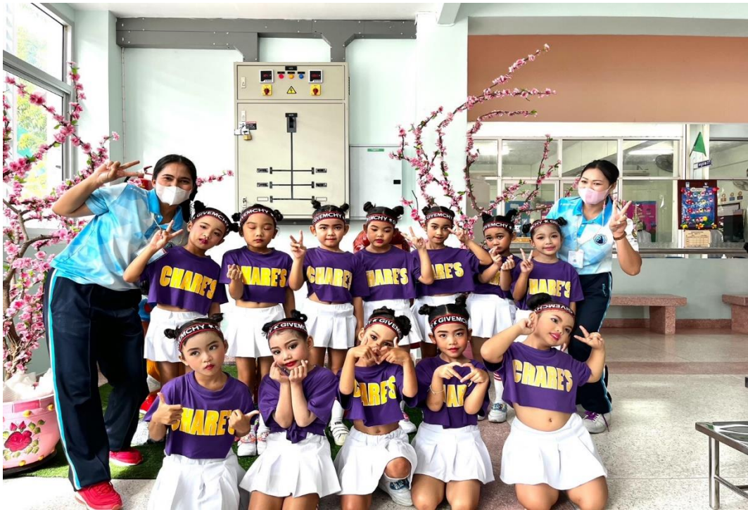
รูปภาพที่ 10 กิจกรรมการแข่งขันออกกำลังกายประกอบเพลง ระดับปฐมวัย