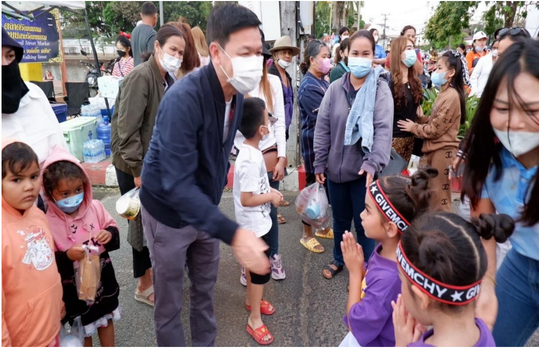
รูปภาพที่ 15 กิจกรรมคริสต์มาสสู่ชุมชน