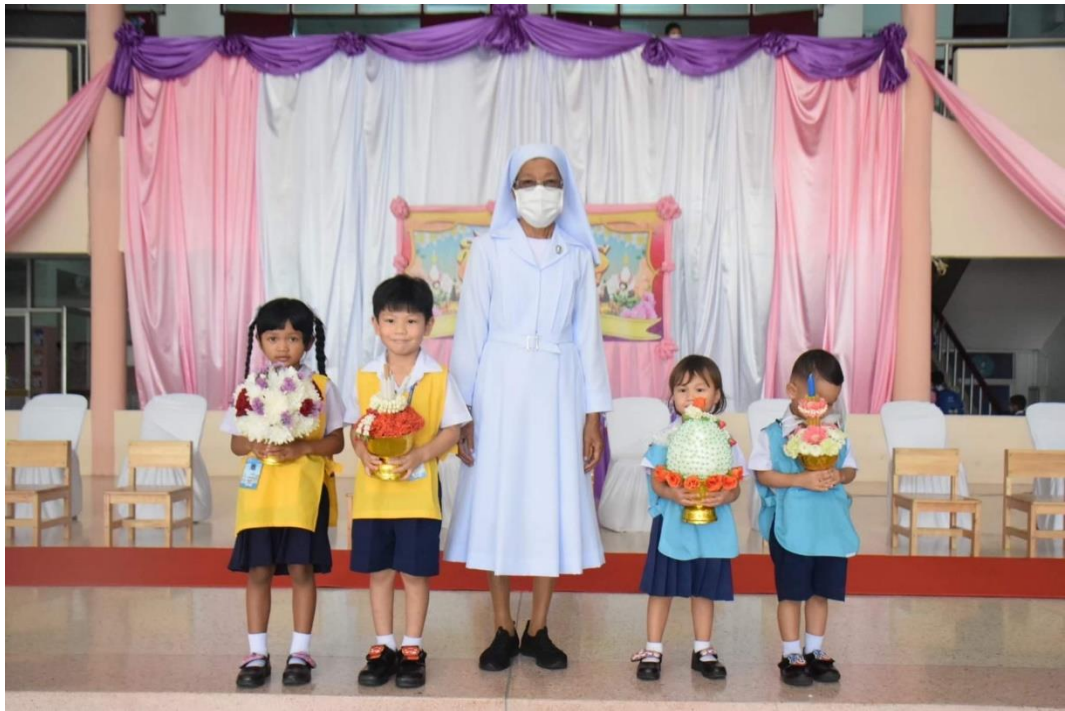
รูปภาพที่ 1 กิจกรรมวันไหว้ครู