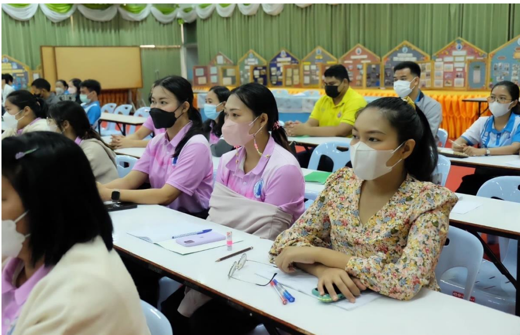
รูปภาพที่ 14 กิจกรรมอบรมเชิงปฏิบัติการการจัดทำแผนพัฒนาคุณภาพการศึกษา