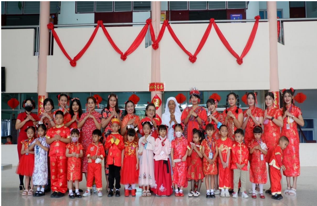
รูปภาพที่ 5 กิจกรรมตรุษจีน