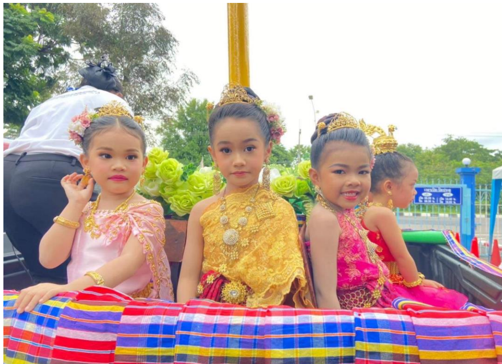
รูปภาพที่ 4 กิจกรรมวันเข้าพรรษา