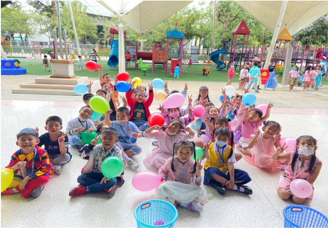
รูปภาพที่ 7 กิจกรรมวันเด็กแห่งชาติ