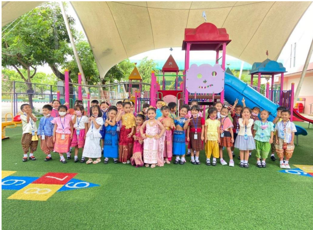
รูปภาพที่ 3 กิจกรรมวันเข้าพรรษา