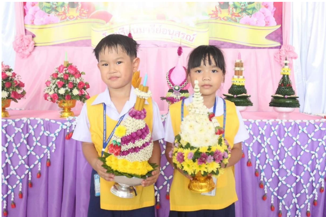
รูปภาพที่ 2 กิจกรรมวันไหว้ครู