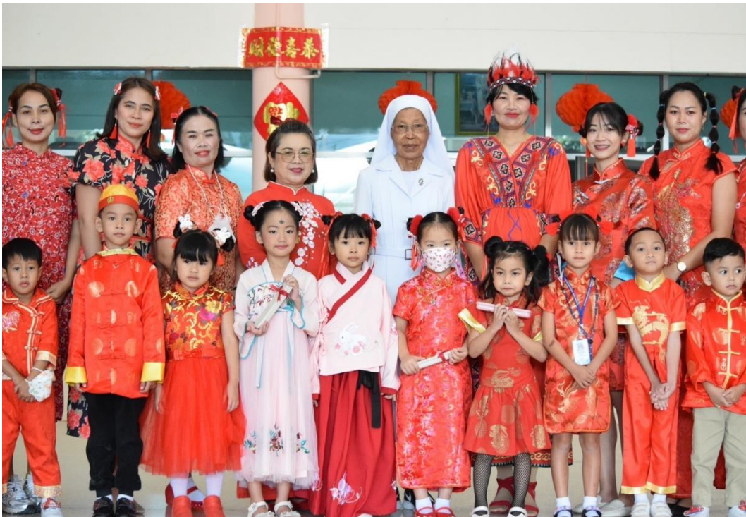
รูปภาพที่ 6 กิจกรรมตรุษจีน