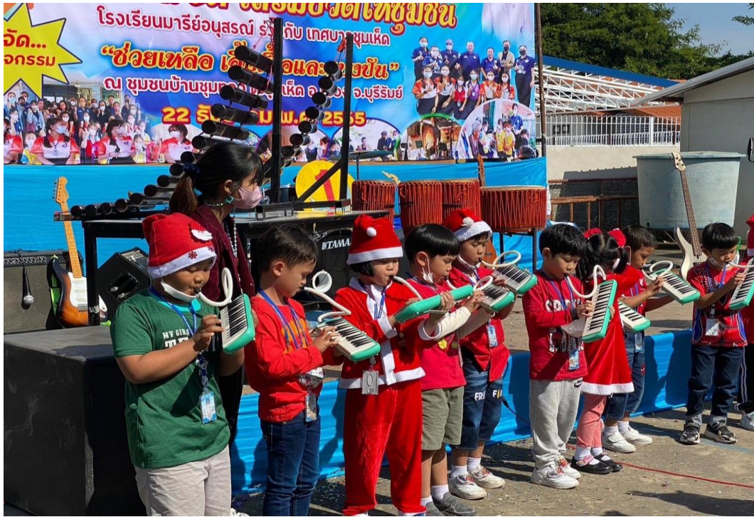
รูปภาพที่ 11 กิจกรรมมารีย์ร่วมจิต