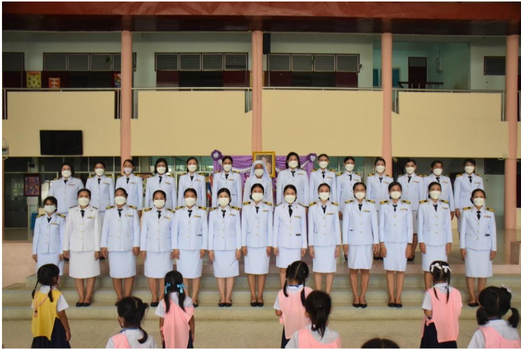
วันคล้ายวันเฉลิมพระชนมพรรษาสมเด็จพระนางเจ้าสุทิดา พัชรสุธาพิมลลักษณ พระบรมราชินี