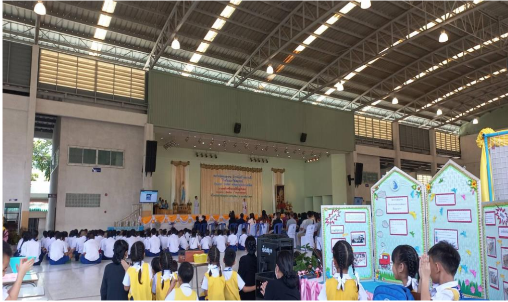
กิจกรรม ตลาดนัดโครงการคุณธรรม