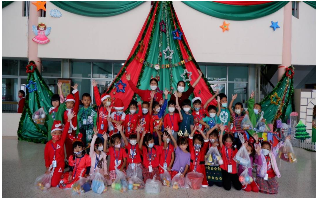
กิจกรรมวันคริสต์มาส จับฉลาก