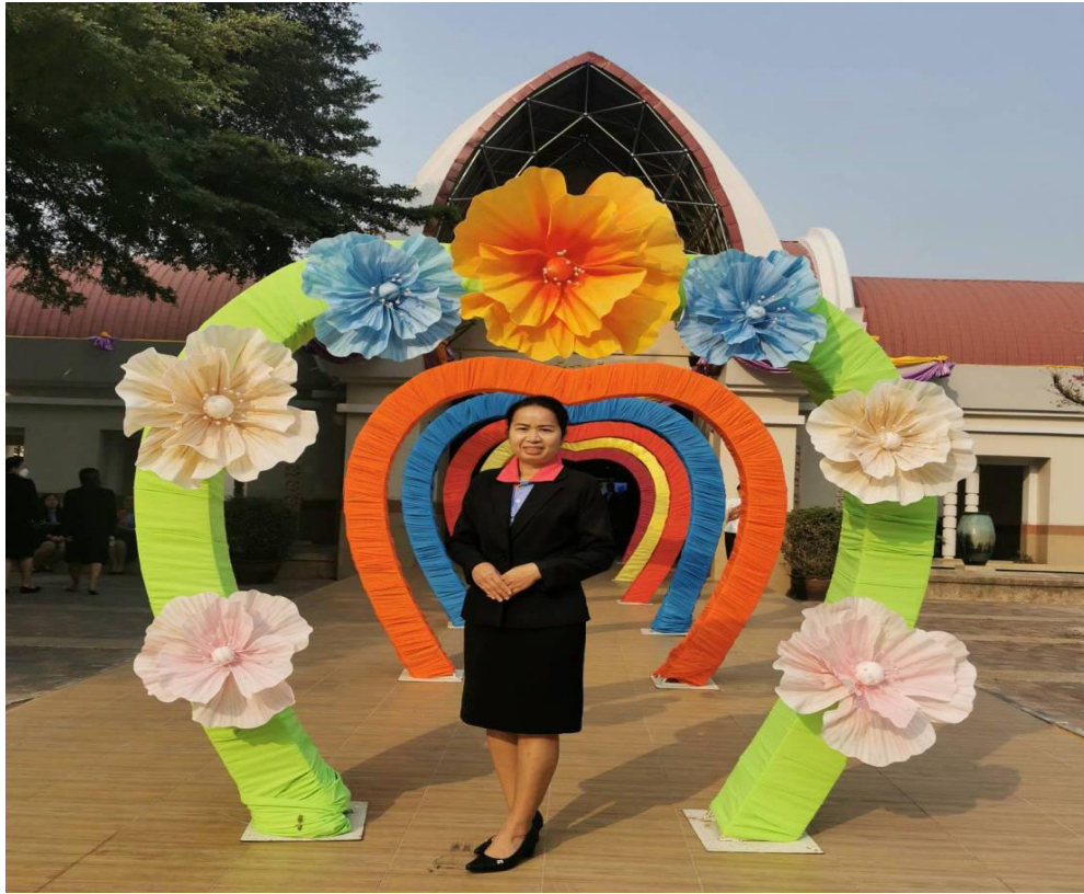
กิจกรรม วันการศึกษาครูโรงเรียนเอกชน