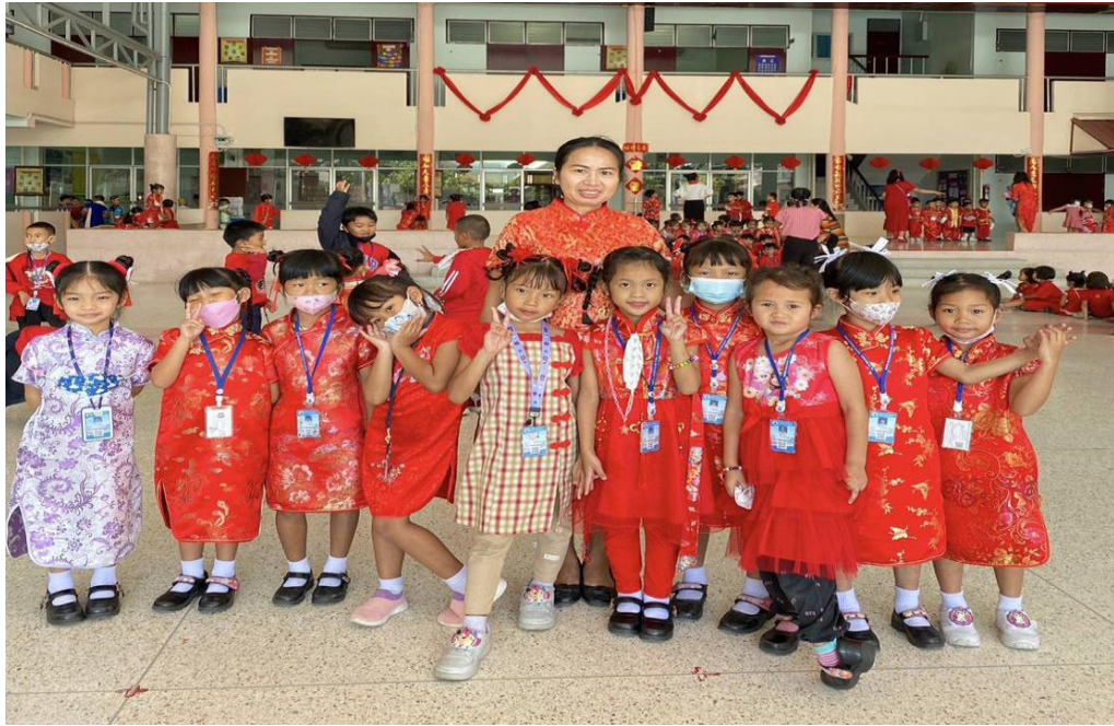
กิจกรรมวันตรุษจีน