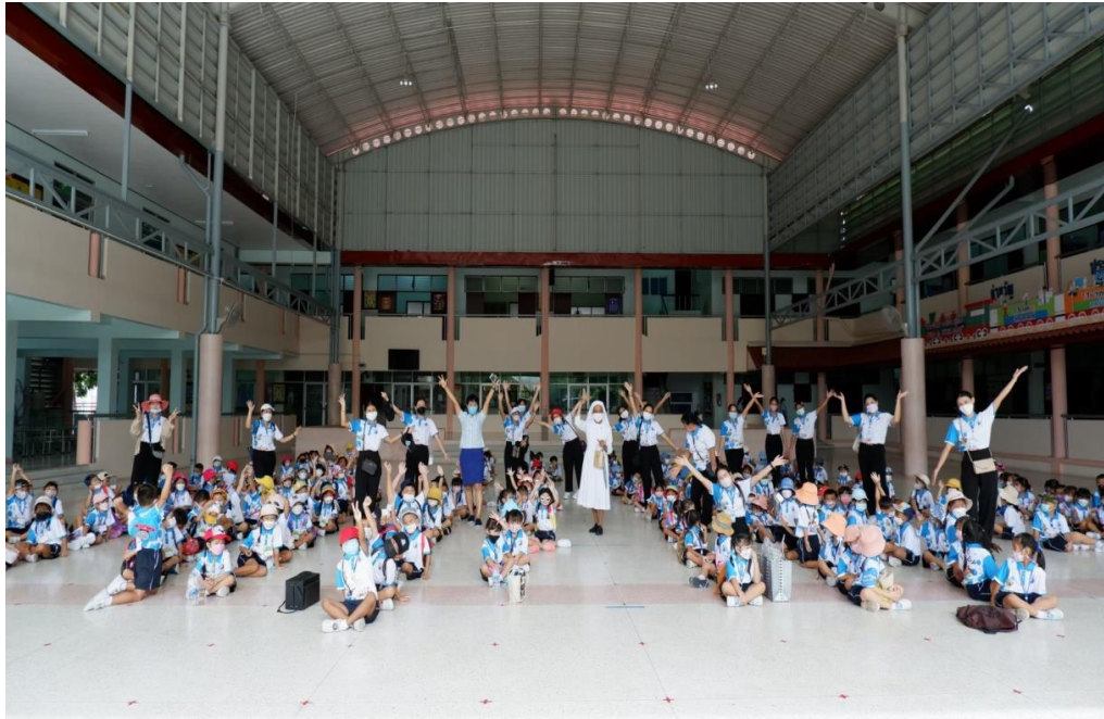
กิจกรรมทัศนศึกษา ณ เลาเพลิน