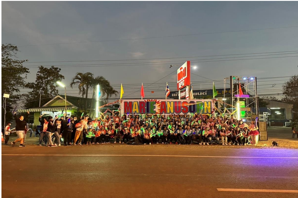
เข้าร่วมกิจกรรมเชียร์วิ่งมาราธอน