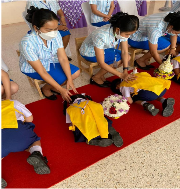
กิจกรรมไหว้ครูปีการศึกษา 2565