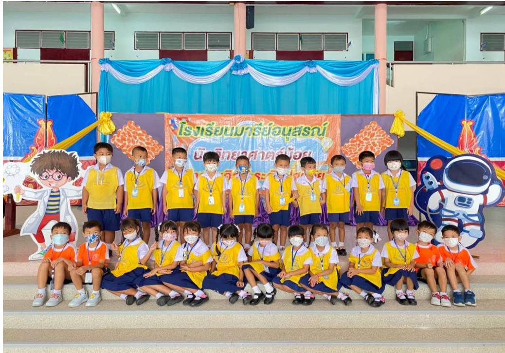
กิจกรรม นักวิทยาศาสตร์น้อย