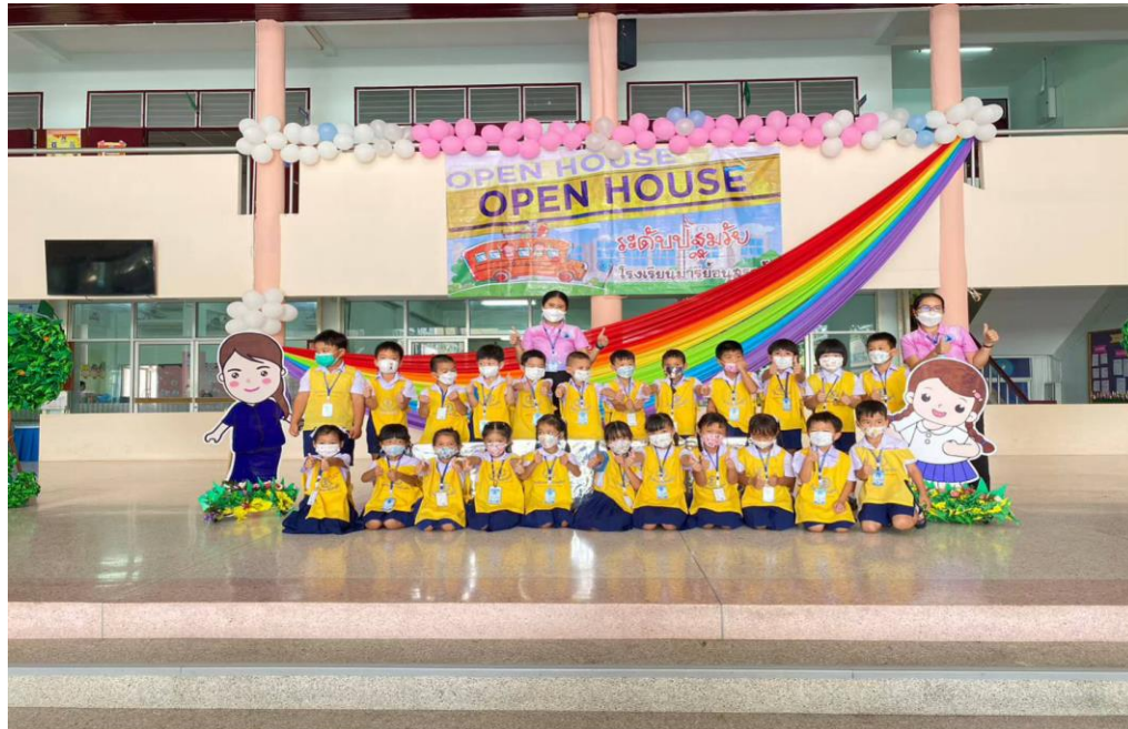
กิจกรรมมอบเกียรติบัตรเด็กทำความดีและกิจกรรม OPEN HOUSE ปีการศึกษา2565