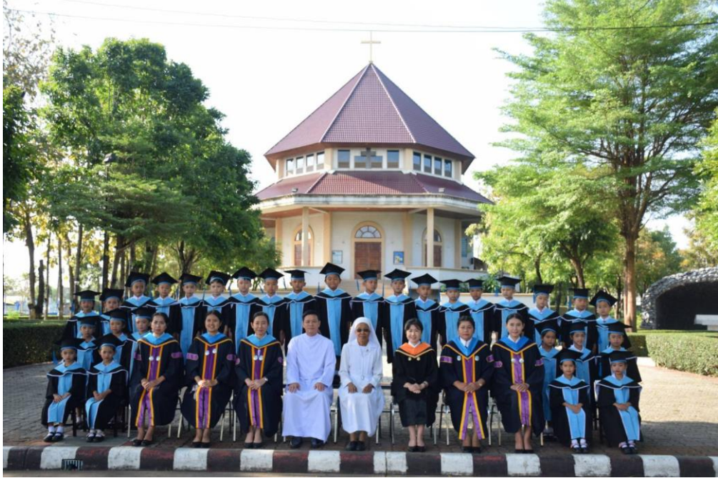
ร่วมกิจกรรมยวบัณฑิต ปีการศึกษา 2565