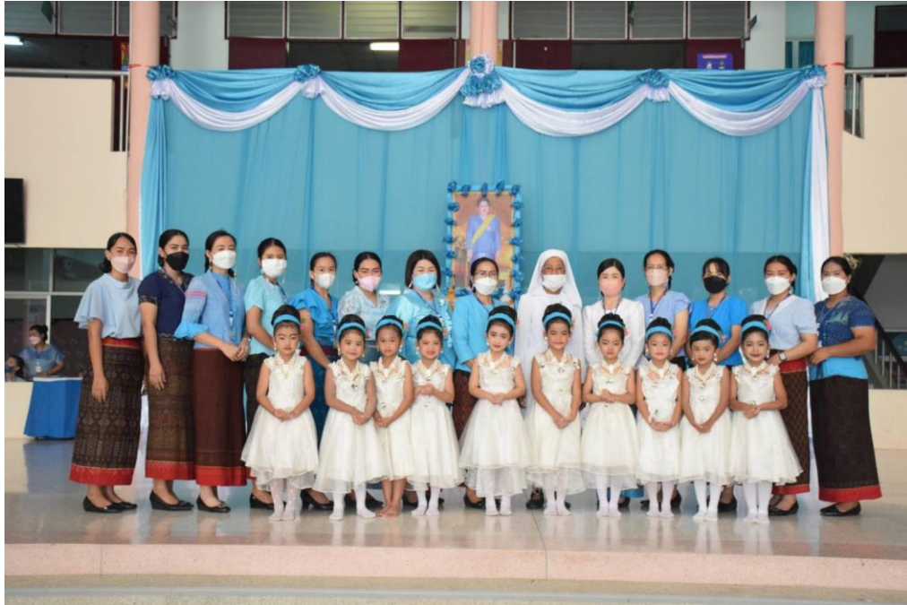
กิจกรรมวันแม่แห่งชาติ