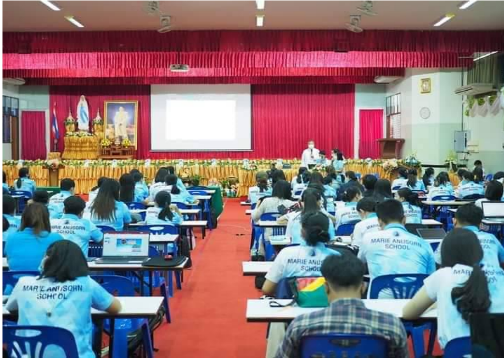
อบรมเชิงปฏิบัติการโรงเรียนคุณธรรม เรื่อง “การพัฒนาครูโครงการคุณธรรม”