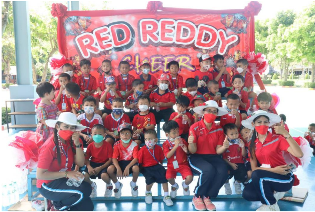
กิจกรรมกีฬาสู่นูบาล