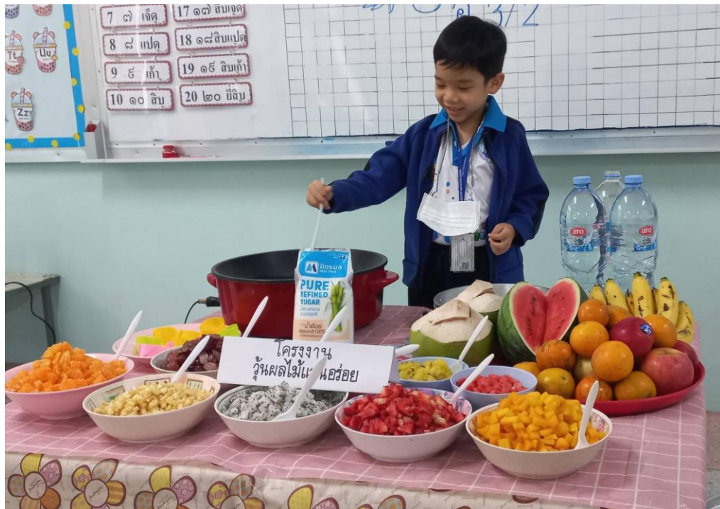
โครงการ ใช้น้ำผลไม้แสนอร่อย อนุบาล 3/2