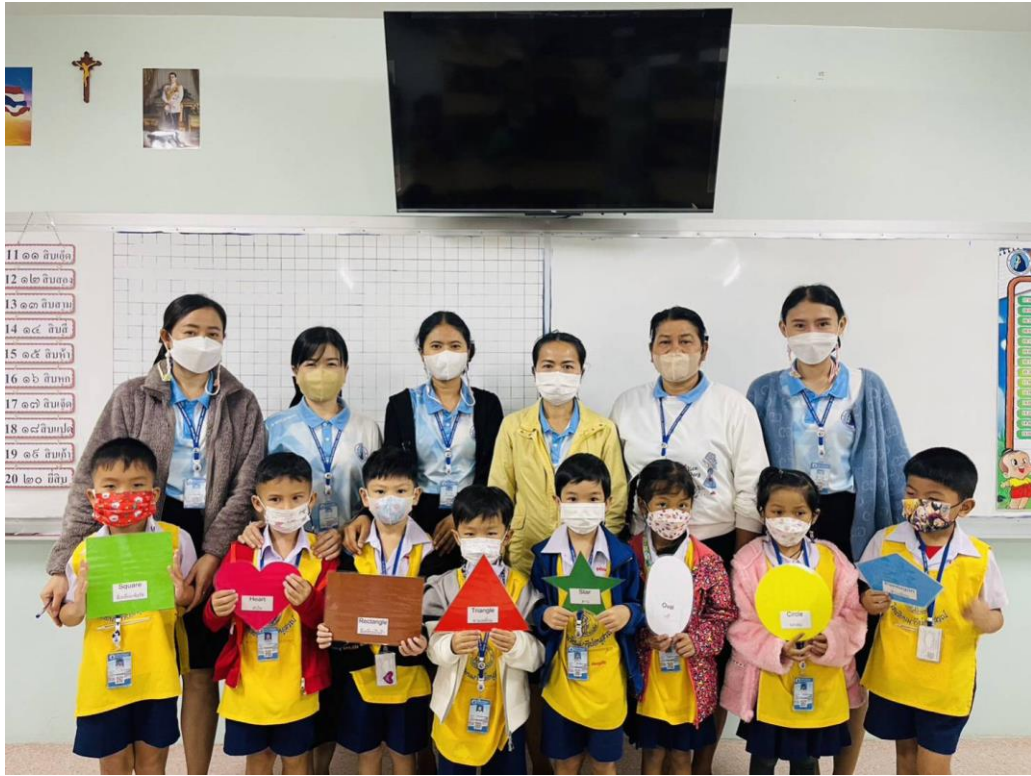
กิจกรรมนิเทศการสอนของครูชั้นอนุบาล 3/2