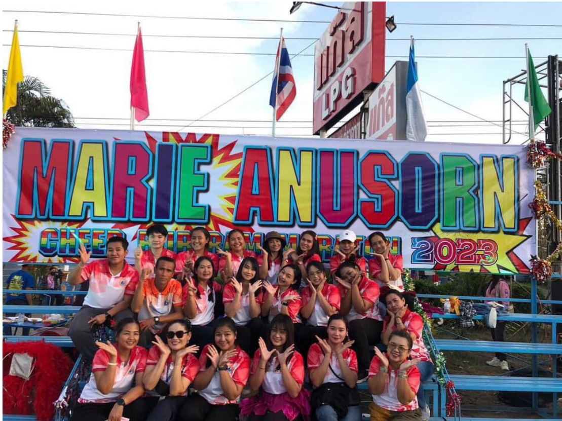
เข้าร่วมกิจกรรมเชียร์วิ่งมาราธอน