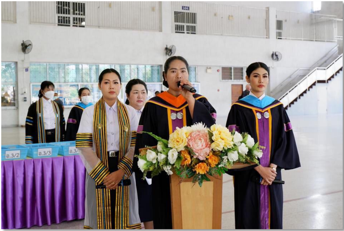
ร่วมกิจกรรมยวบัณฑิต ปีการศึกษา 2565