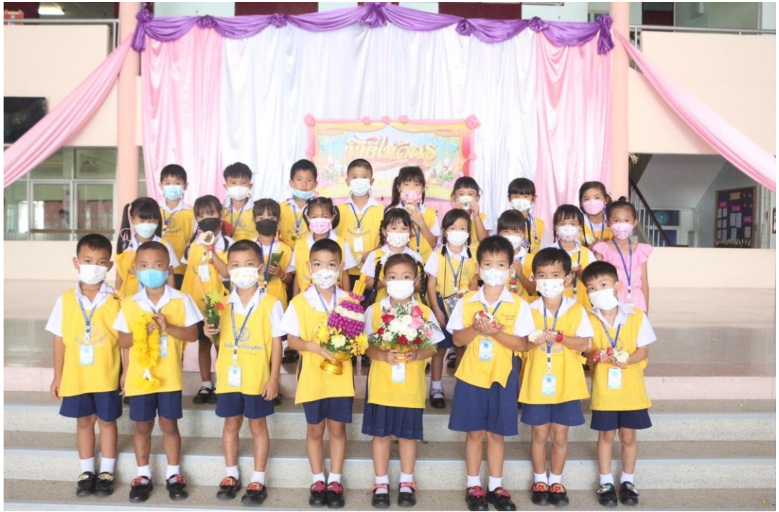
กิจกรรมไหว้ครูปีการศึกษา 2565