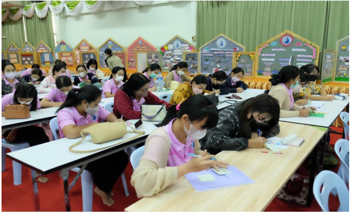
อบรมเชิงปฏิบัติการจัดทำแผนพัฒนาคุณภาพการศึกษาโรงเรียนมารีย์อนุสรณ์