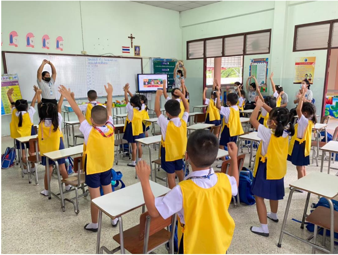
กิจกรรมนิเทศการสอนของครูชั้นอนุบาล 3/5