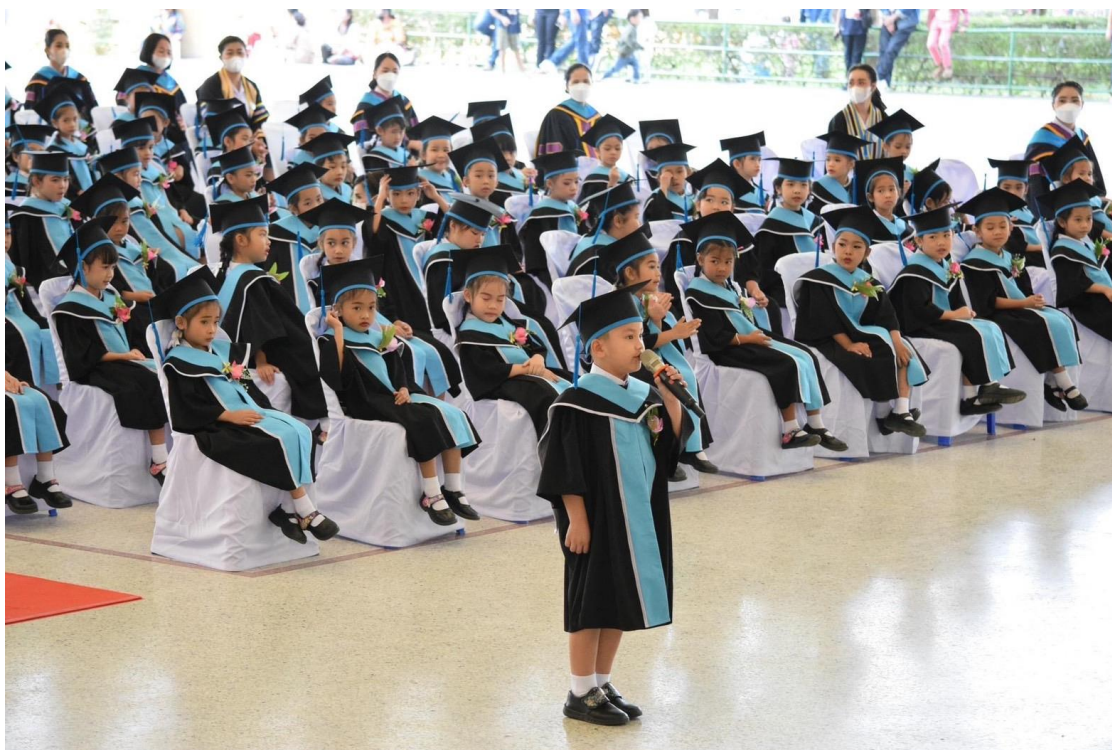
ร่วมกิจกรรมยวบัณฑิต ปีการศึกษา 2565