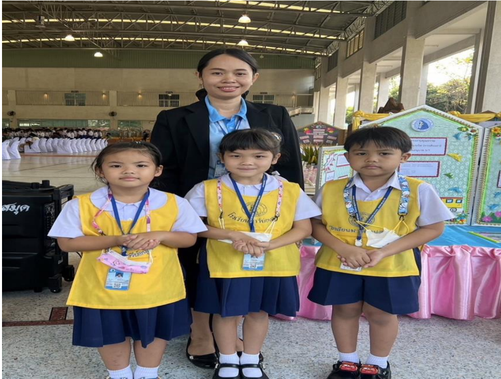
เข้าร่วมกิจกรรมคุณธรรม