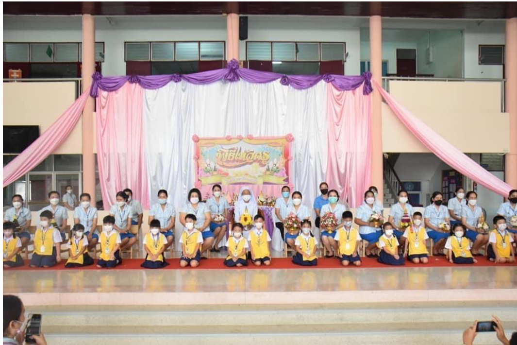
กิจกรรมไหว้ครูปีการศึกษา 2565