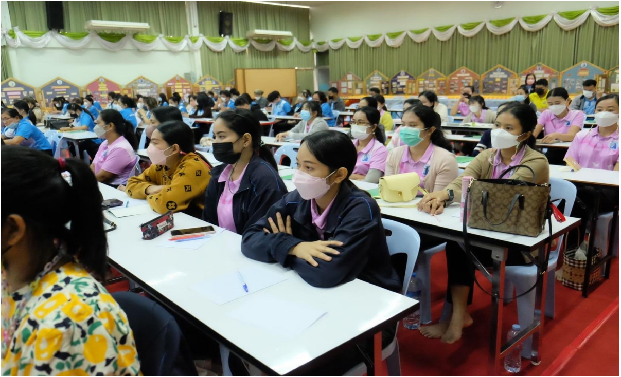
อบรมเชิงปฏิบัติการจัดทำแผนพัฒนาคุณภาพการศึกษาโรงเรียนมารีย์อนุสรณ์