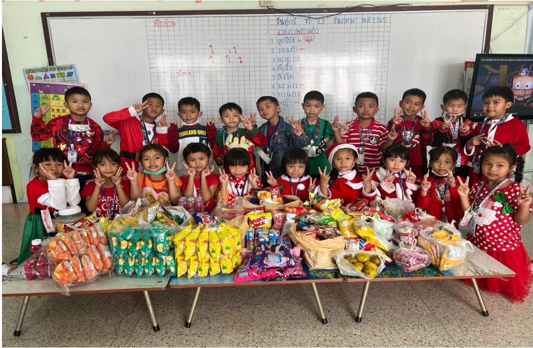
กิจกรรมวันคริสต์มาส จับฉลาก