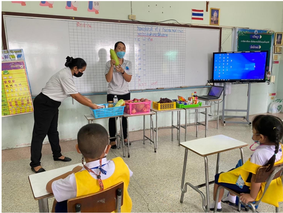
กิจกรรมนิเทศการสอนของครูชั้นอนุบาล 3/5