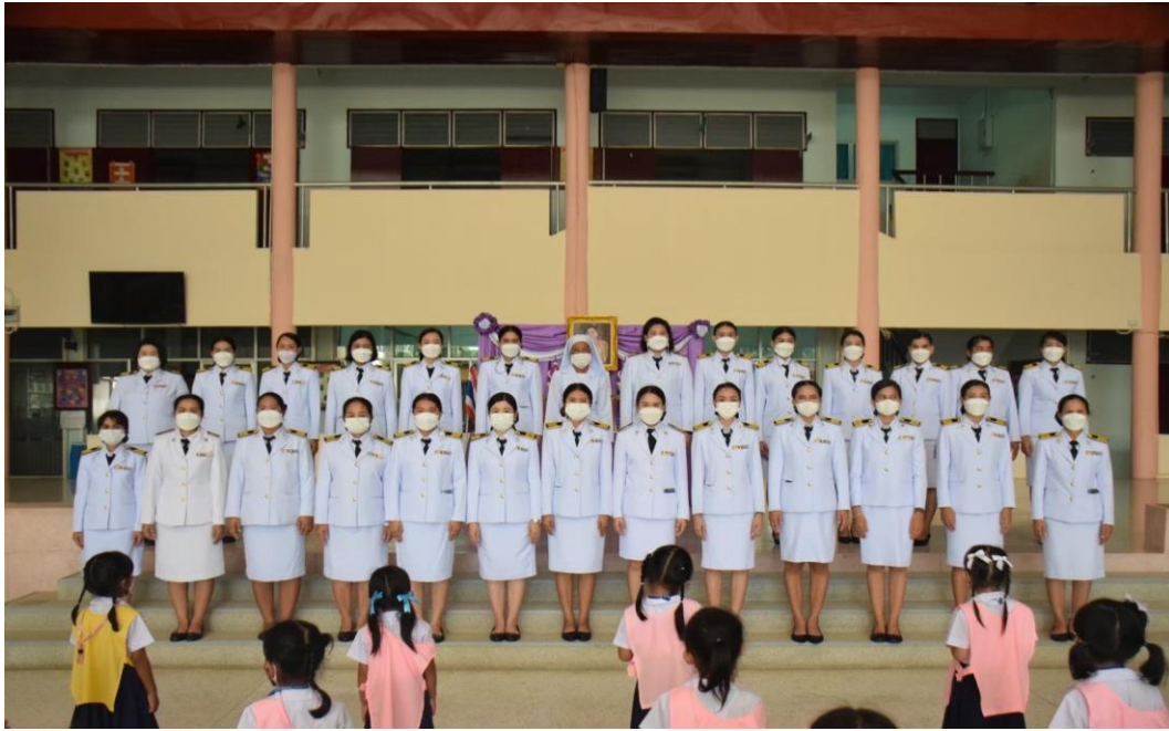
3 มิถุนายน 22565วันคล้ายวันเฉลิมพระชนมพรรษาสมเด็จพระนางเจ้าสุทิดา พัชรสุธาพิมลลักษณ พระบรมราชินี