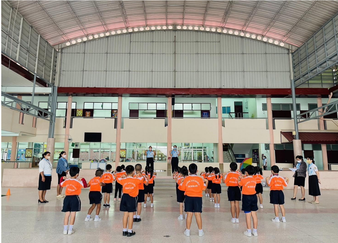
กิจกรรมนิเทศการสอนของครูชั้นอนุบาล 3/5