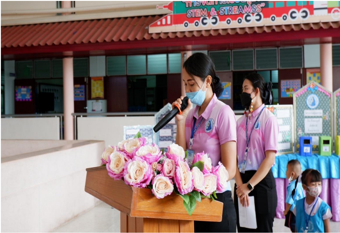
กิจกรรม OPEN HOUSE ปีการศึกษา2565