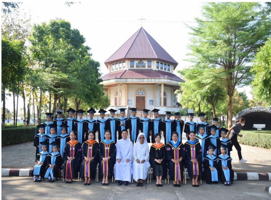
ร่วมกิจกรรมยวบัณฑิต ปีการศึกษา 2565