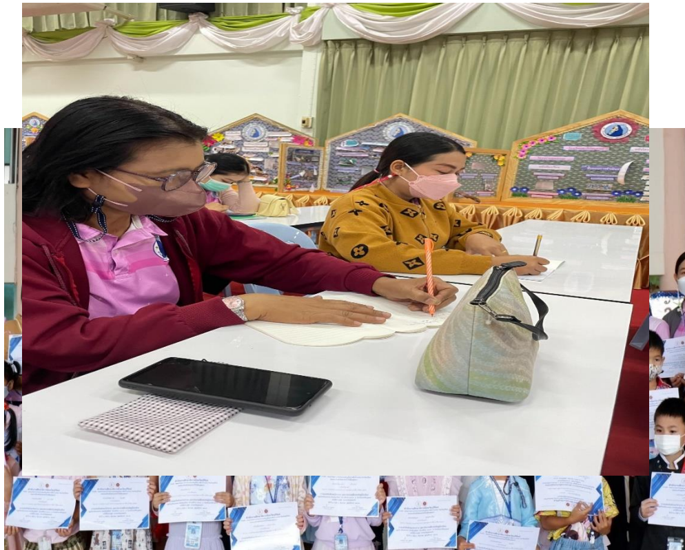
อบรมเชิงปฏิบัติการจัดทำแผนพัฒนาคุณภาพการศึกษา ปีการศึกษา 2565