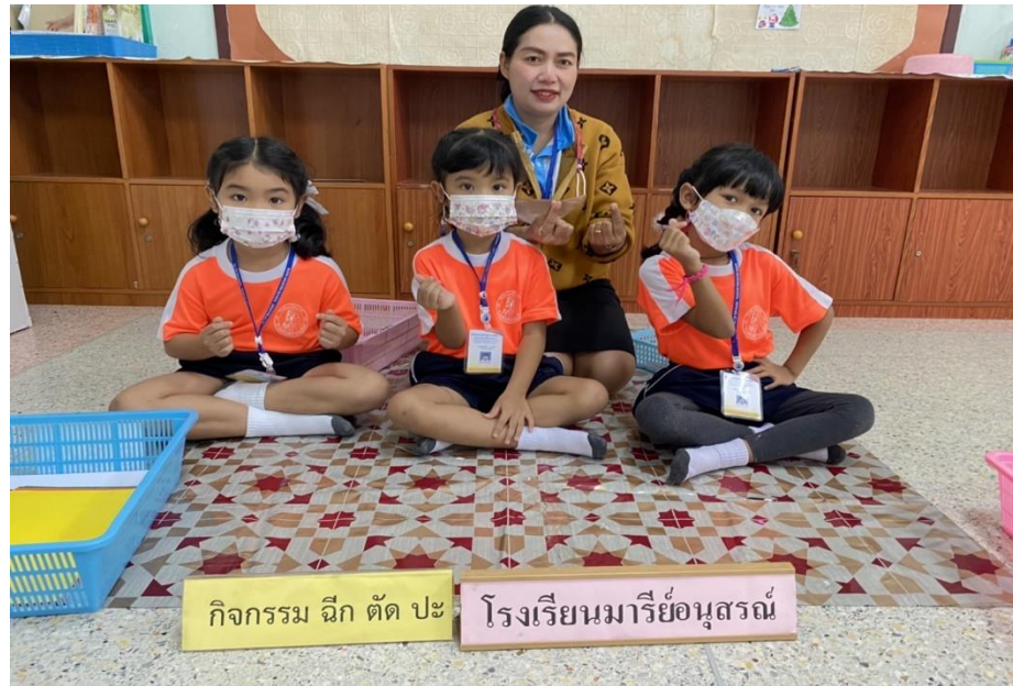
กิจกรรมแข่งขันทักษะทางวิชาการ ปีการศึกษา 2565 ณ. โรงเรียนอนุบาลบุรีรัมย์