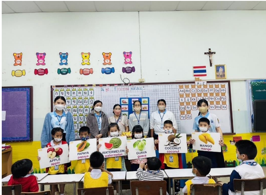
กิจกรรมนิเทศการสอน ปีการศึกษา 2565