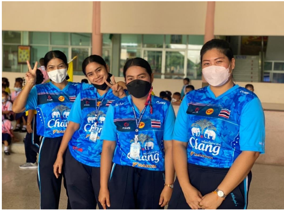
กิจกรรมกีฬาปีการศึกษา 2565