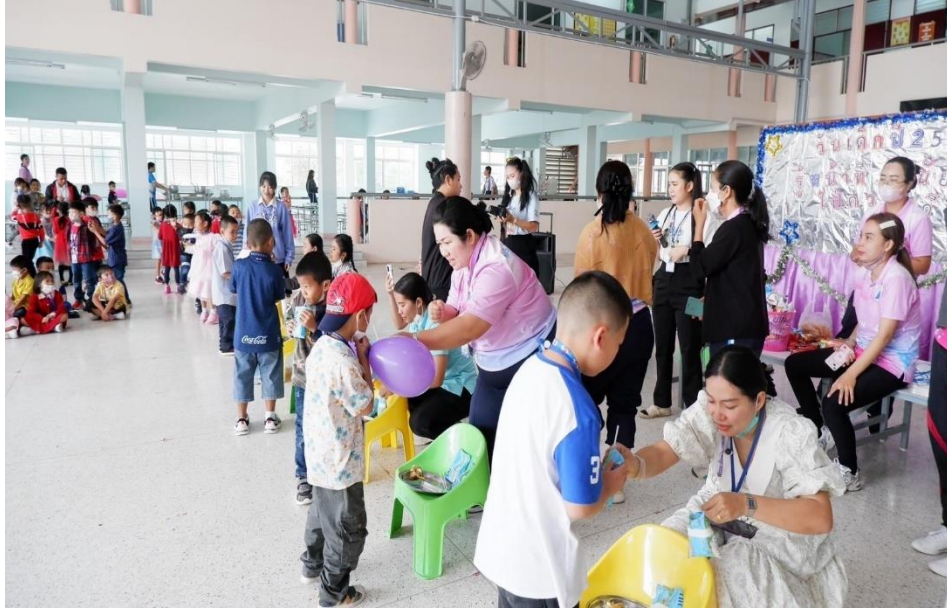
กิจกรรมวันเด็กปีการศึกษา 2565