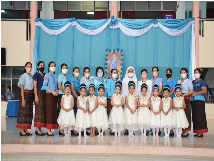
กิจกรรมวันแม่แห่งชาติ ปีการศึกษา 2565