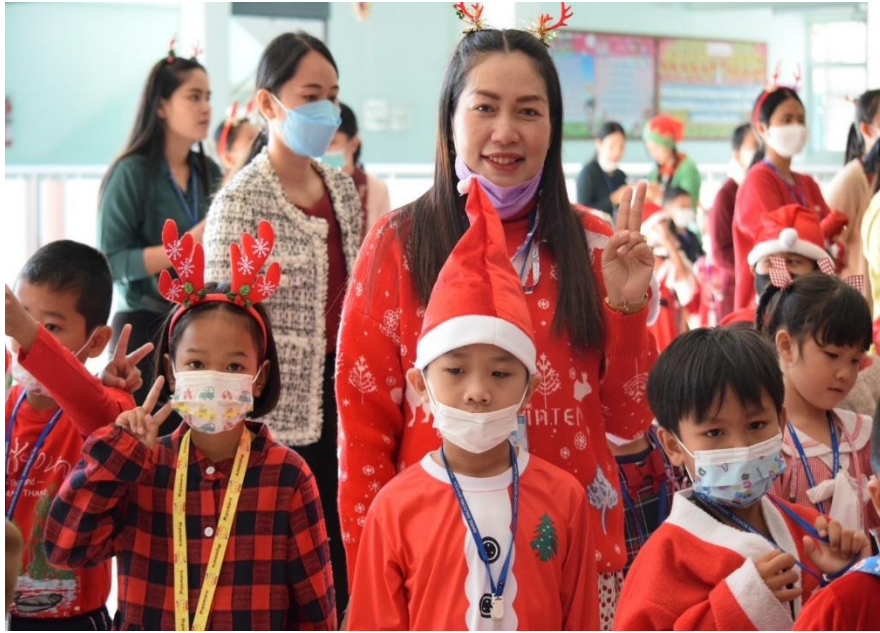
กิจกรรมวันคริสต์มาส ปีการศึกษา 2565