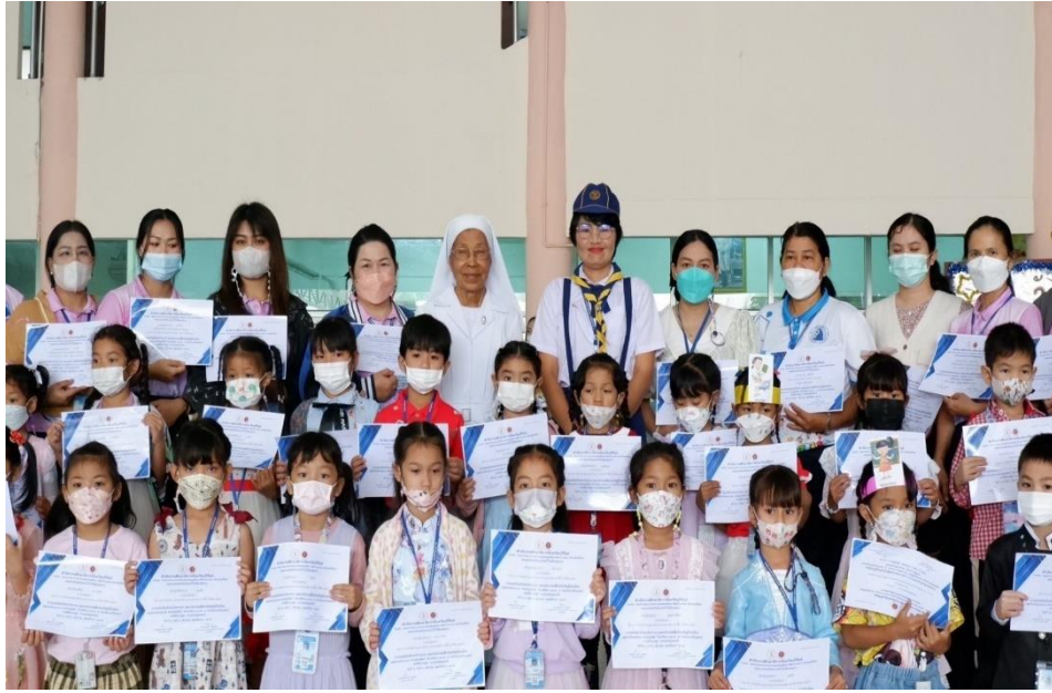
กิจกรรมมอบเกียรติบัตรแข่งขันทักษะทางวิชาการ