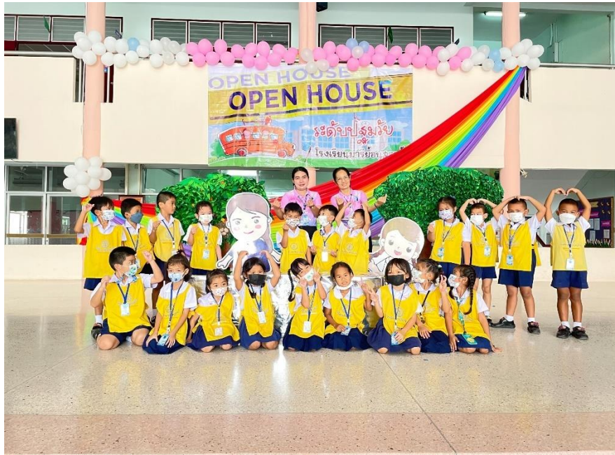
กิจกรรมมอบเกียรติบัตรเด็กทำความดีและกิจกรรม OPEN HOUSE ปีการศึกษา2565