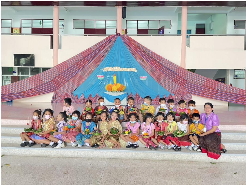
กิจกรรมลอยกระทง ปีการศึกษา 2565