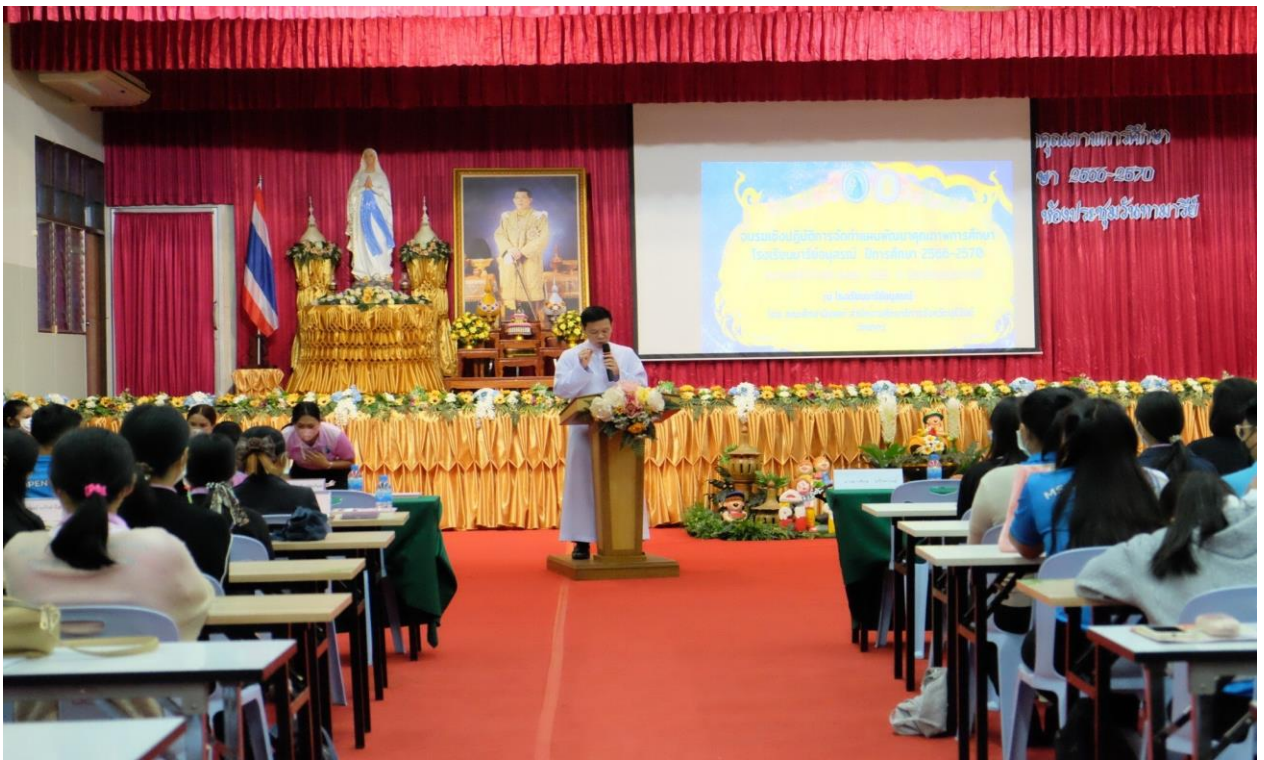
โครงการอบรมเชิงปฏิบัติการปีการศึกษา 2565