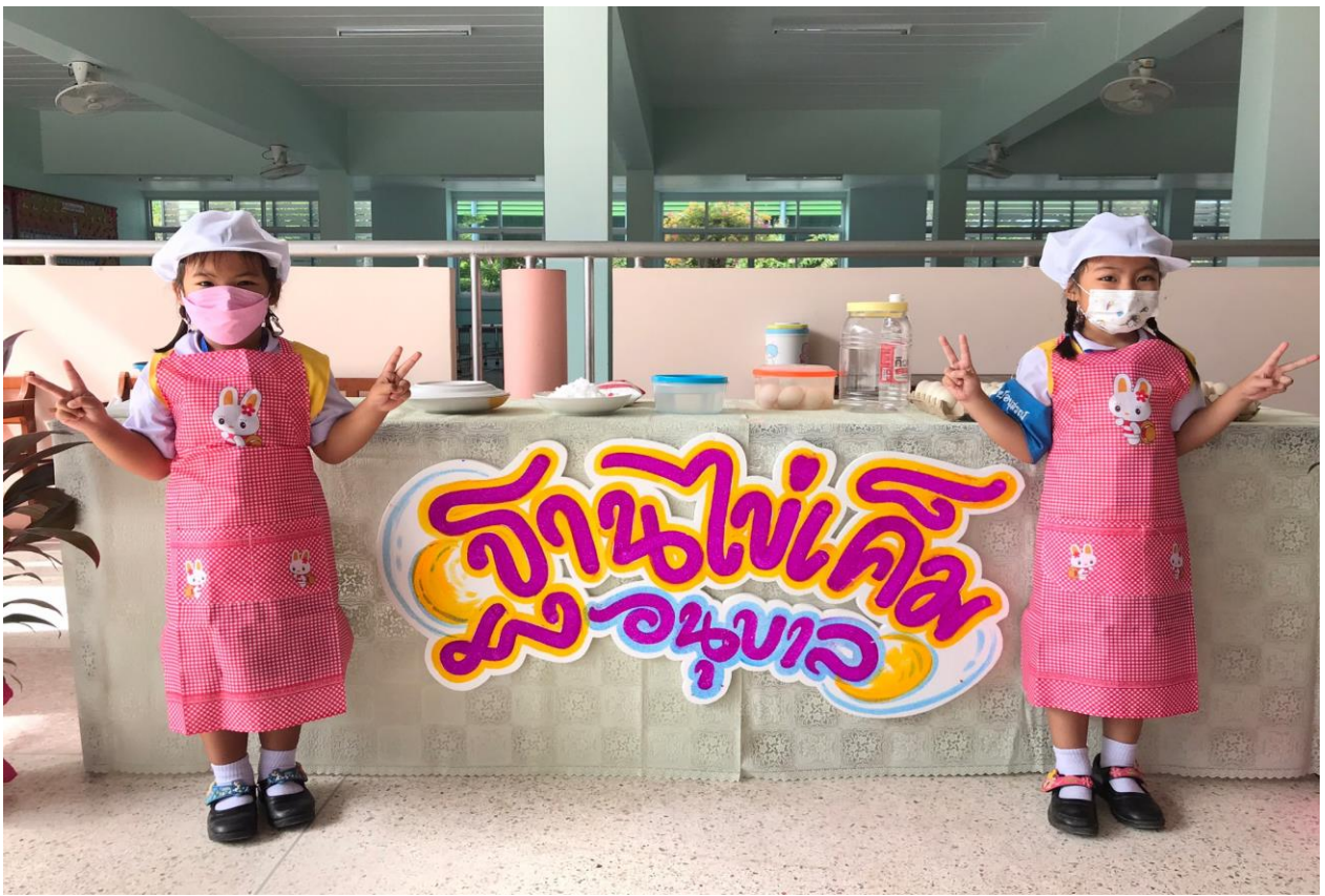
กิจกรรมวัน Open House ปีการศึกษา 2565