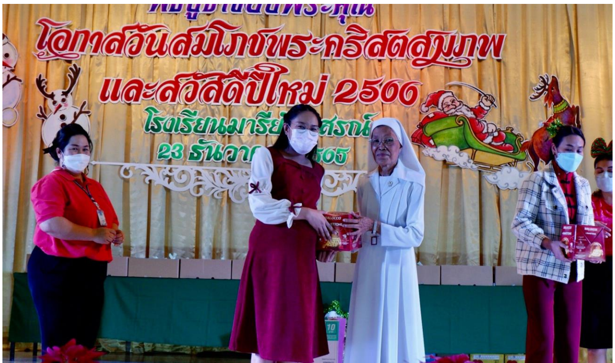
ภาพการเข้าร่วมกิจกรรมวันคริสต์มาสและปีใหม่ ปี 2566