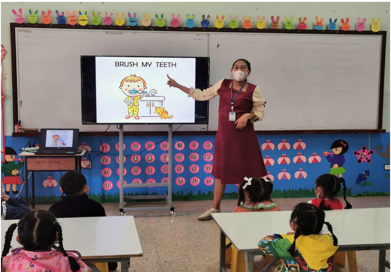
ภาพการจัดการเรียนการสอนห้องเรียน ICEP ระดับปฐมวัย ปีการศึกษา 2565