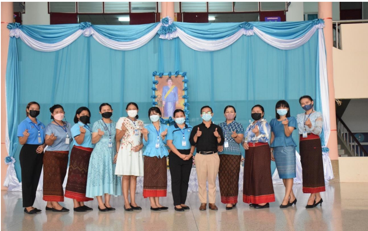
กิจกรรมวันแม่แห่งชาติ ปีการศึกษา 2565