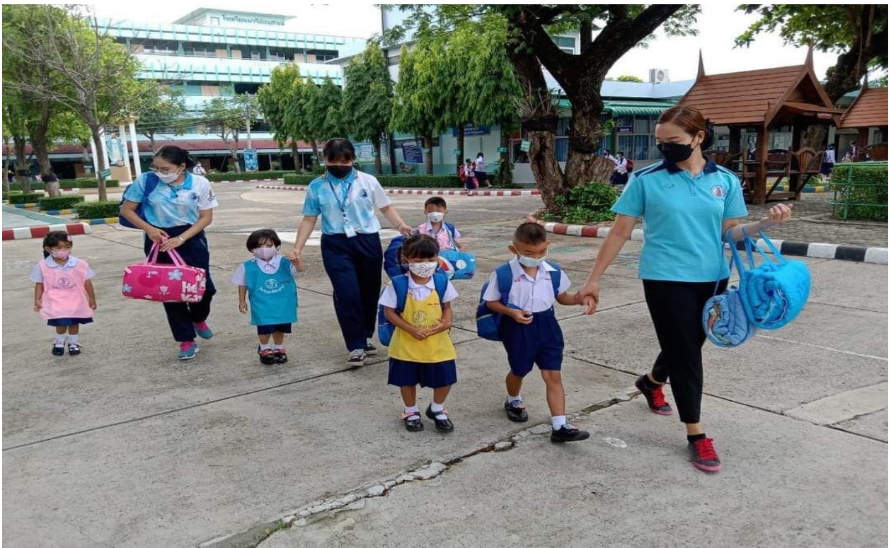
การปฏิบัติหน้าที่เวรประจำวันเปิดภาคเรียน ปีการศึกษา 2565