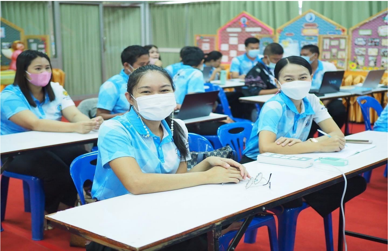
อบรมโครงการคุณธรรม ปี 2565