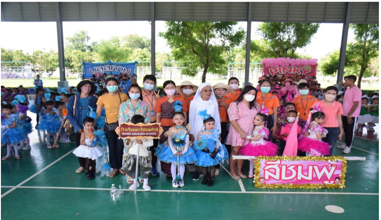
กิจกรรมกีฬา ระดับ ปฐมวัย ปีการศึกษา 2565