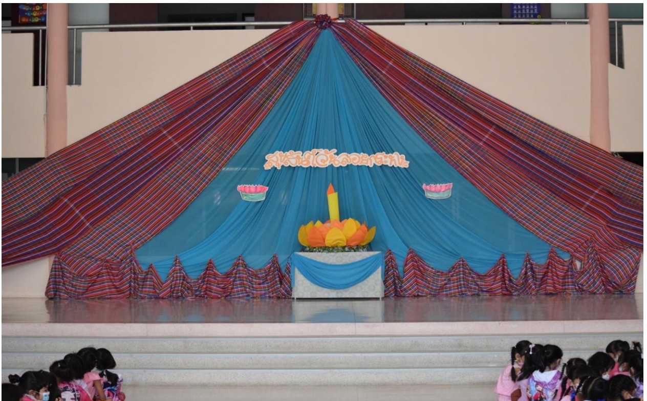
กิจกรรมวันลอยกระทง ปีการศึกษา 2565