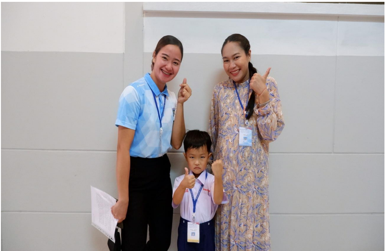
การแข่งขันทักษะทางวิชาการ รายการ Speech ห้องเรียนสามัญ ระดับปฐมวัย ประจำปีการศึกษา 2565