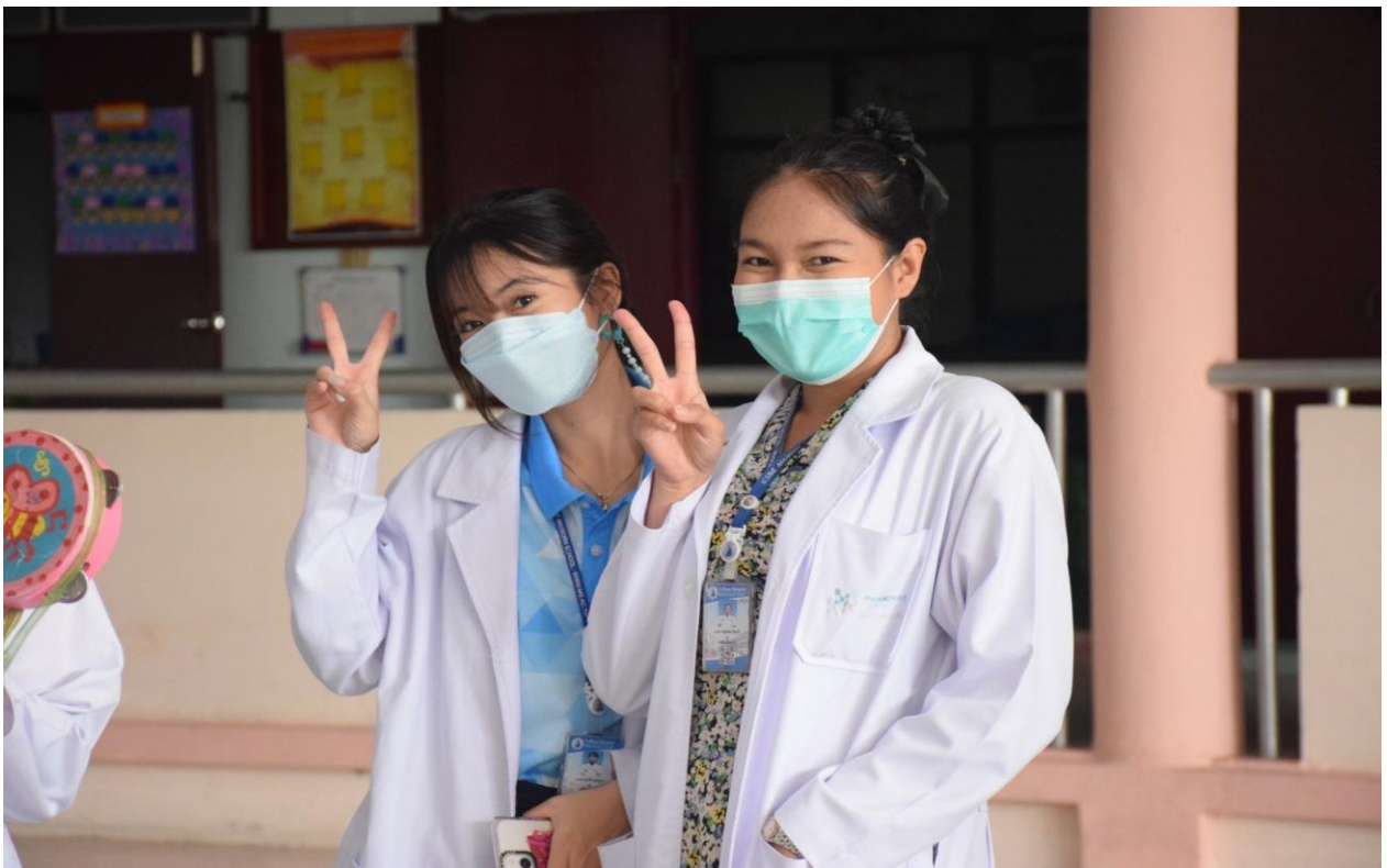
กิจกรรมวันวิทยาศาสตร์ ระดับปฐมวัย ปีการศึกษา 2565