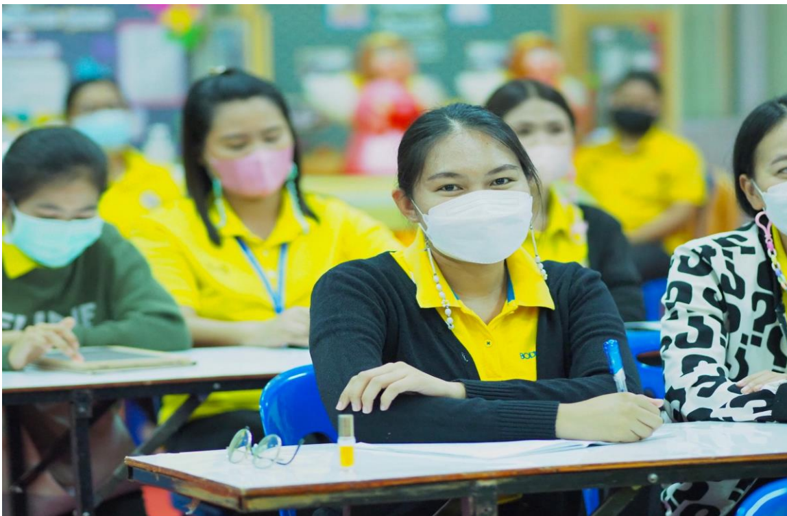
อบรมโครงการคุณธรรม ปี 2565