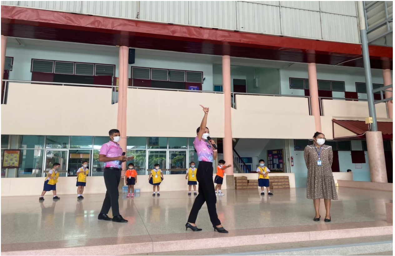
กิจกรรม Morning Activity ทุกวันจันทร์ ปีการศึกษา 2565