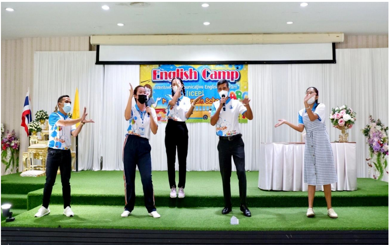
กิจกรรมการเข้าค่าย English Camp ห้องเรียน ICEP ณ เพลาเพลิน ปีการศึกษา 2565