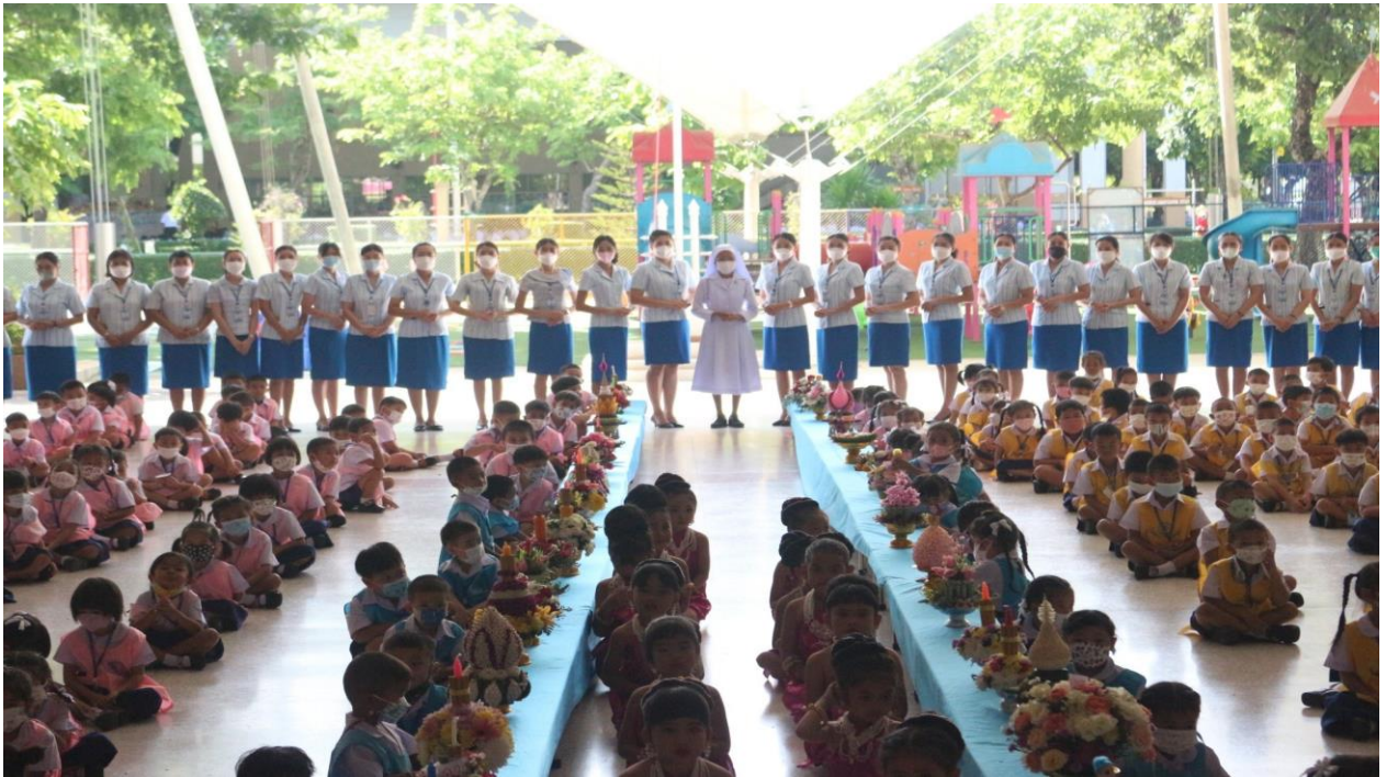
กิจกรรมวันไหว้ครู ปีการศึกษา 2565