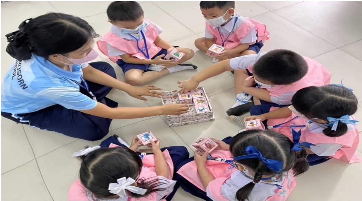
พาเด็กๆ เล่นเกมการศึกษา ร่วมเชียร์บุรุษรั้มมาราธอน