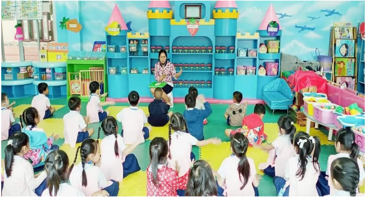
เรียนรู้กับห้องเรียนพหุปัญญา