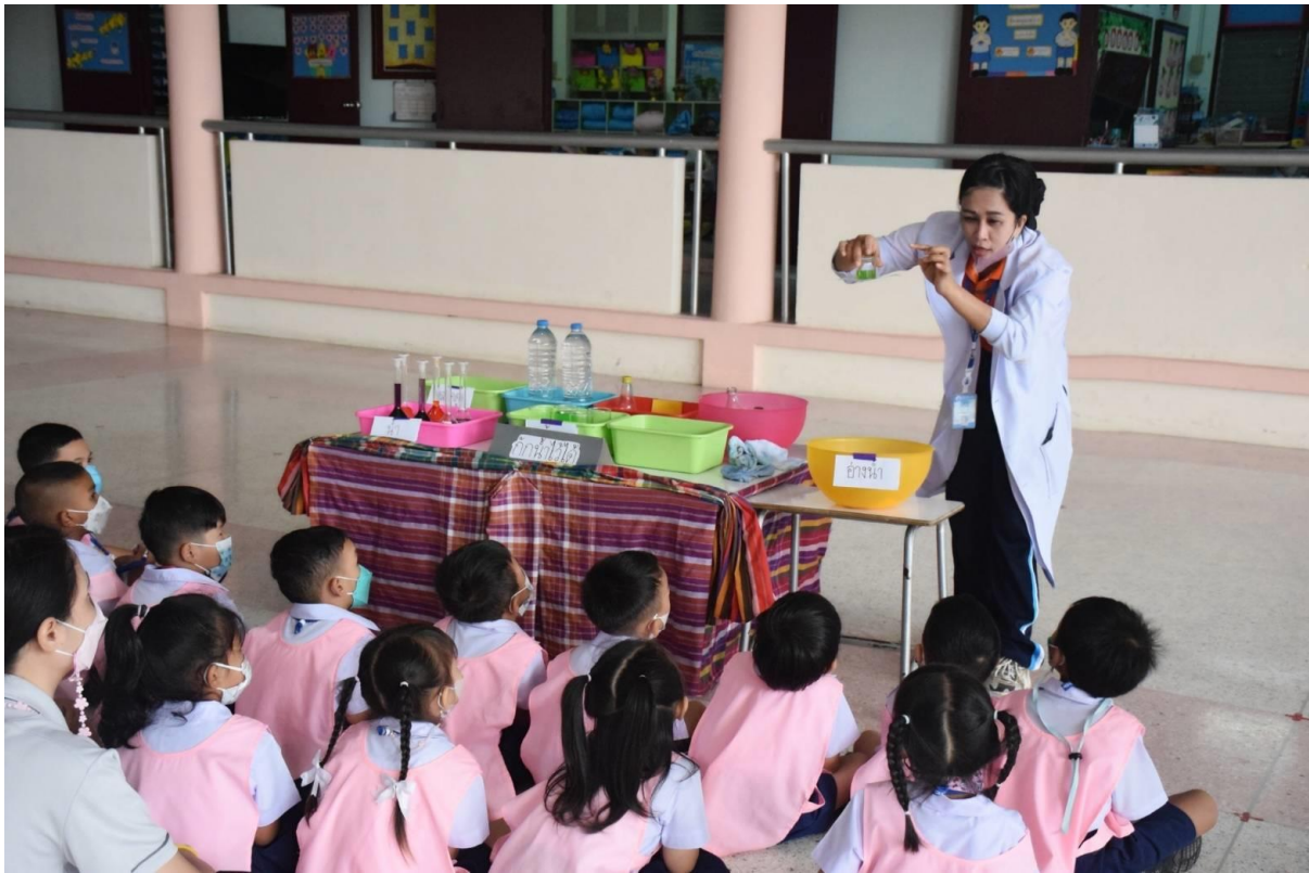
กิจกรรมนักวิทยาศาสตร์น้อยอนุบาล