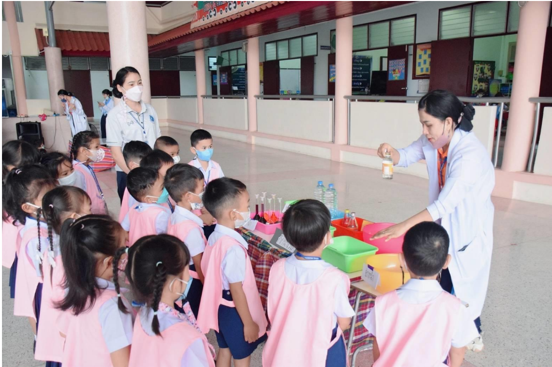
กิจกรรมนักวิทยาศาสตร์น้อยอนุบาล