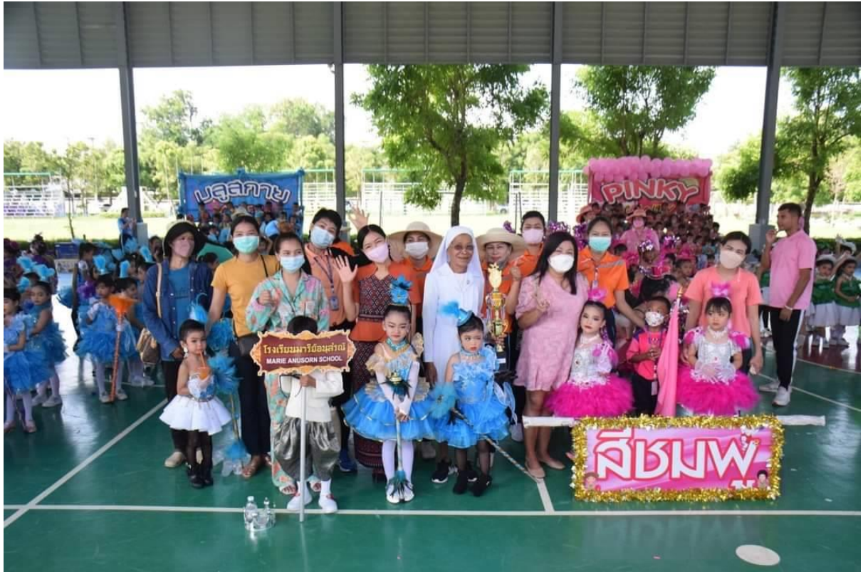
ร่วมงานกิจกรรมกีฬาอนุบาลลูกรัก