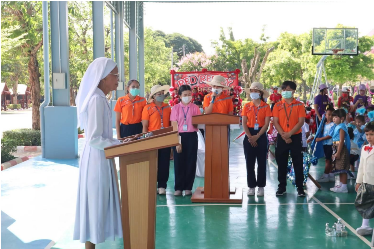
กิจกรรมกีฬาสีนุบาลลูกรัก