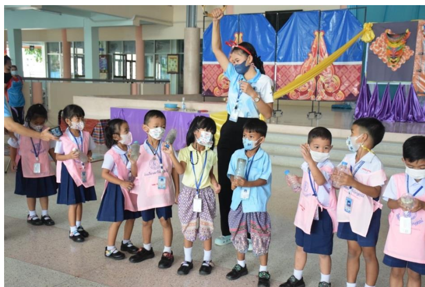
กิจกรรมเข้าค่ายศิลปะและดนตรี ปีการศึกษา 2565