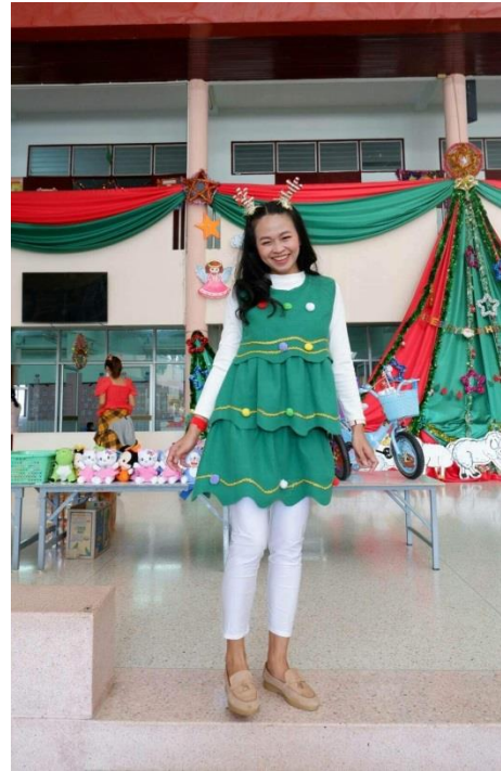
กิจกรรมวันคริสต์มาส