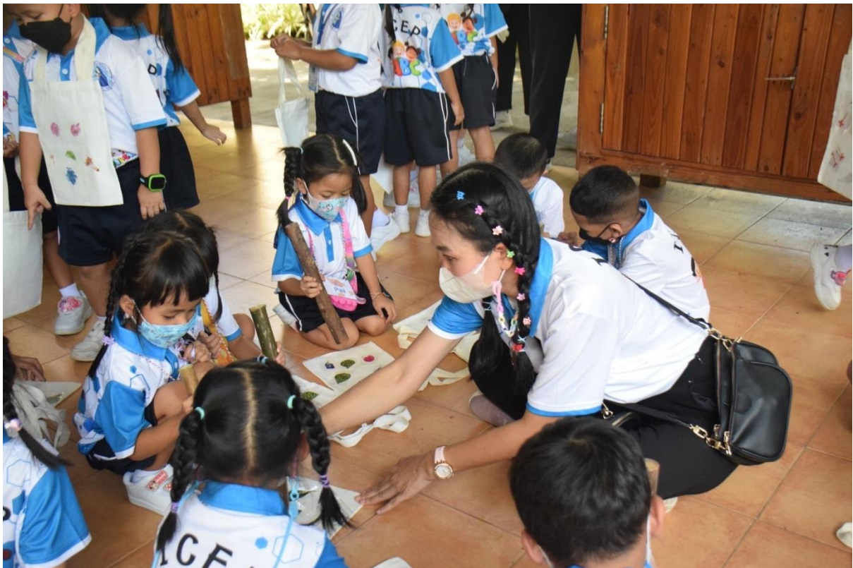
กิจกรรมทาบดอกไม้กระเป๋าทัดสนศึกษา นักเรียนชั้นปฐมวัยปีที่ 2 ที่เพลลาเพลิน