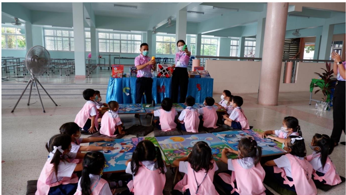
กิจกรรม Open House