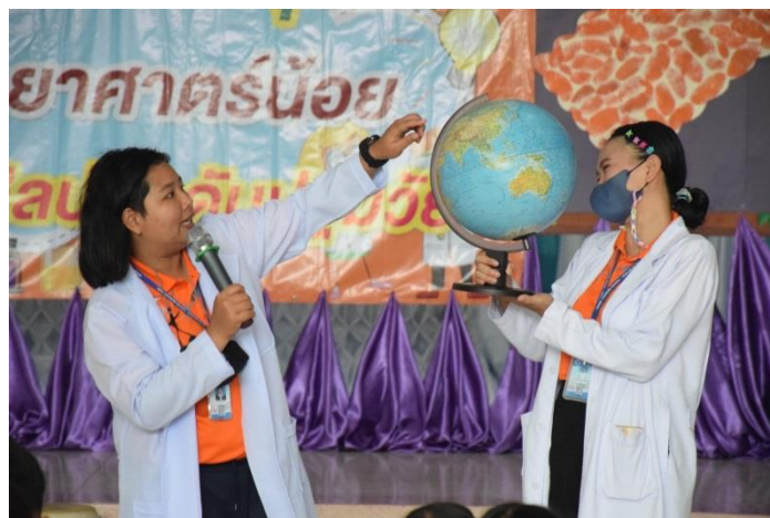
กิจกรรมวันวิทยาศาสตร์