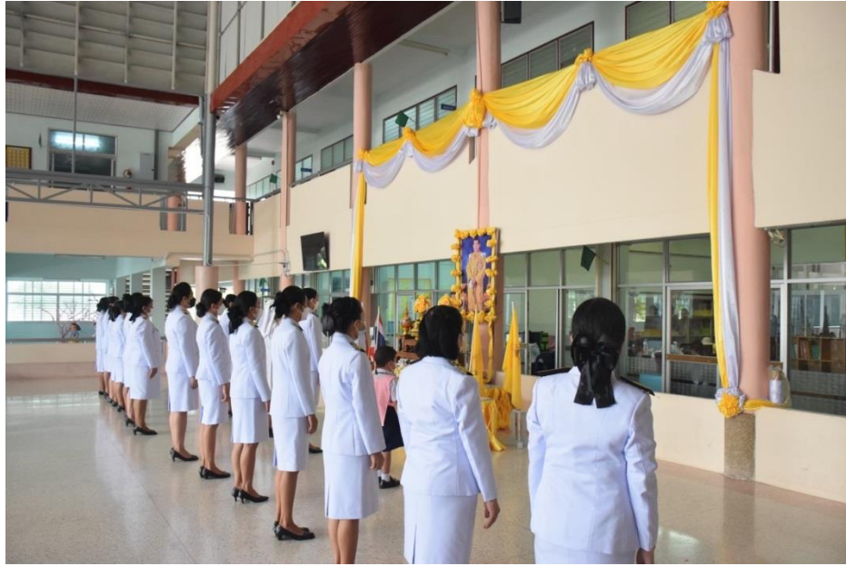
กิจกรรมวันเฉลิมพระชนมพรรษา