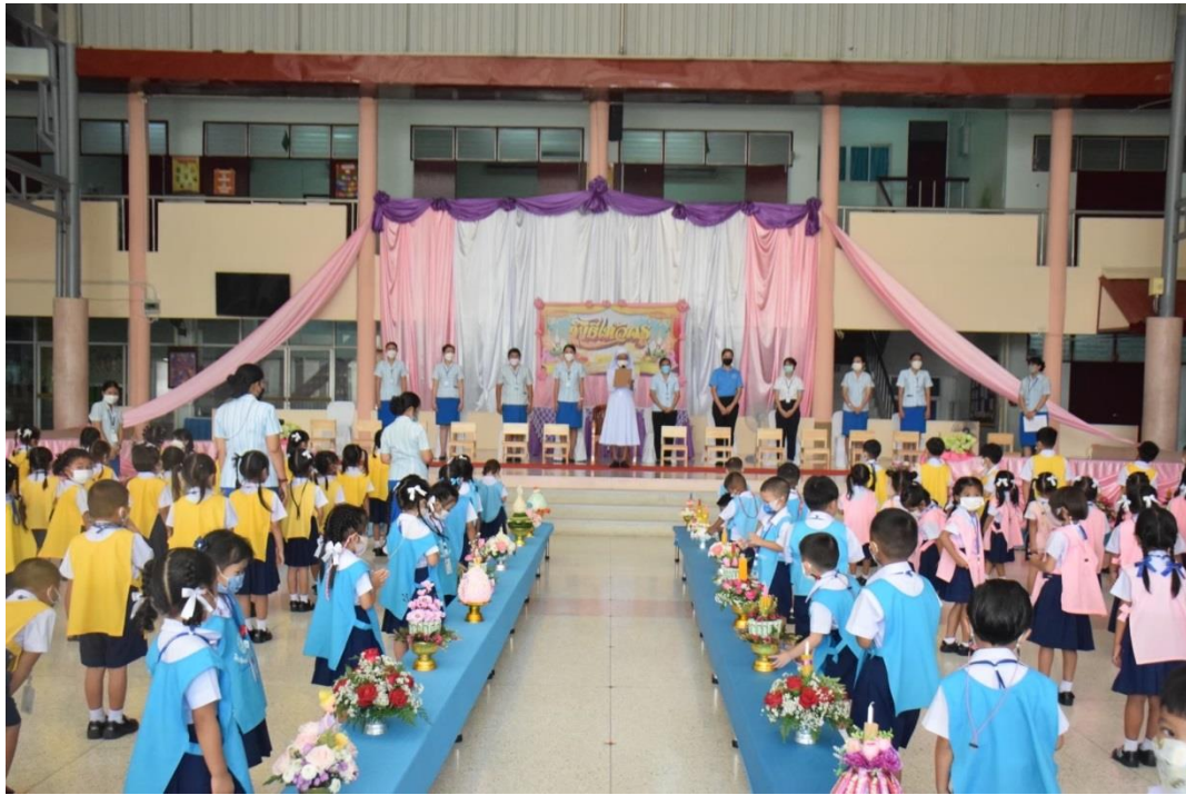
กิจกรรมวันไหว้ครู ปีการศึกษา 2565