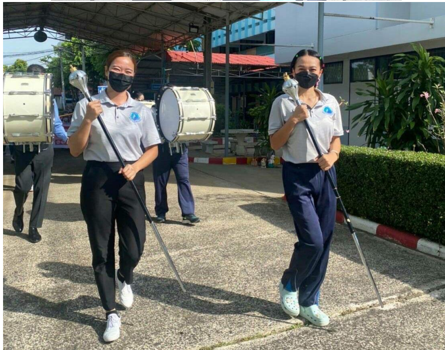
พาเด็กๆซ้อมเดินขบวนกีฬาสี