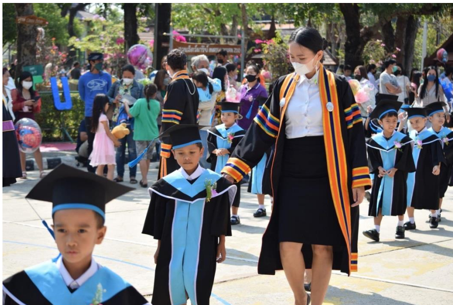
กิจกรรมยูวบัณฑิต