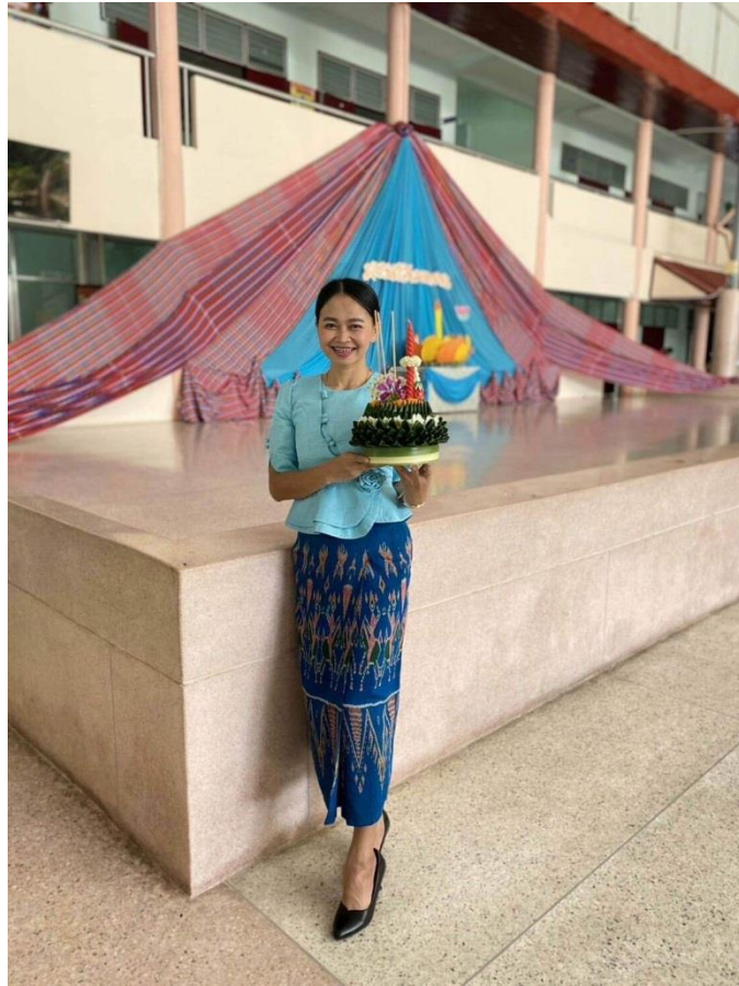
กิจกรรมวันลอยกระทง