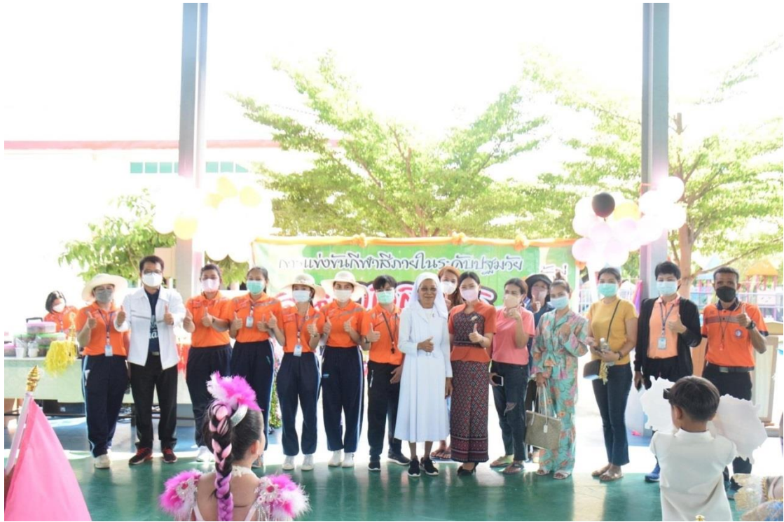
กิจกรรมกีฬาเพื่อนขาดรัก