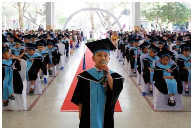
ฝึกเด็กตัวแทนกล่าวแสดงความยินดีเป็นภาษาอังกฤษ