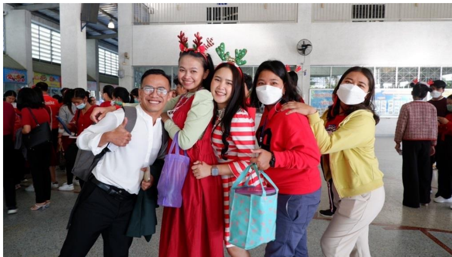
กิจกรรมจับฉลากปีใหม่ที่โรงเรียน