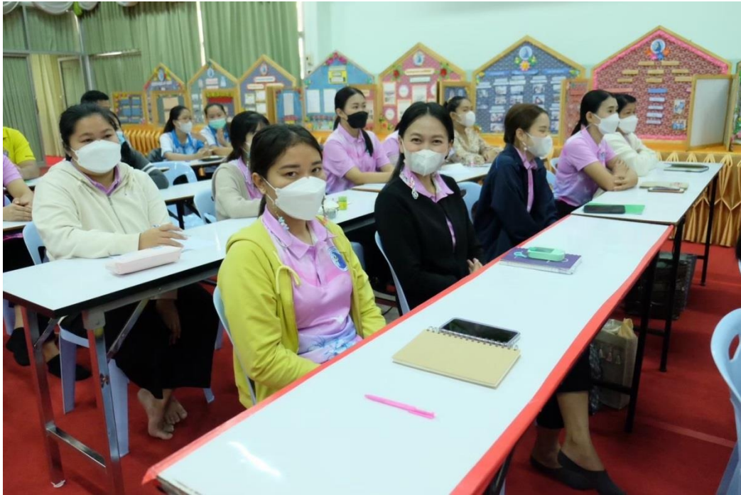
อบรมจัดทำแผนพัฒนาคุณภาพการศึกษา ที่ โรงเรียนมารีย์อนุสรณ์