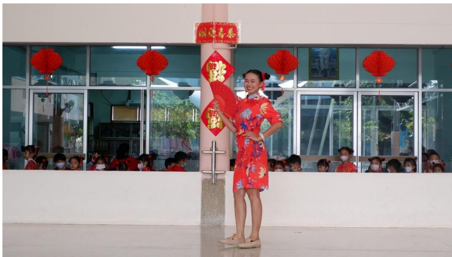
กิจกรรมวันตรุษจีน