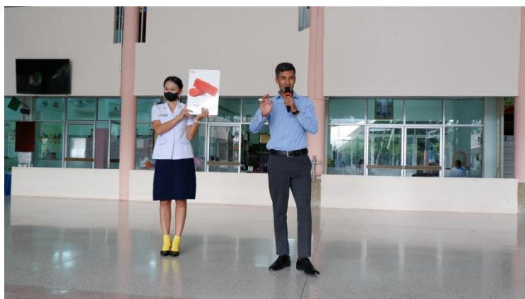
จัดกิจกรรมภาษาอังกฤษหน้าเสาธง