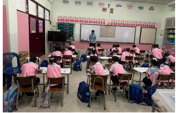
กิจกรรมการจัดการเรียนการสอนในห้องเรียน