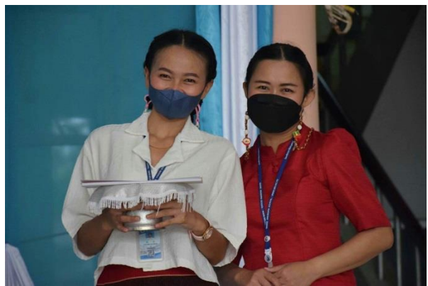
พิธีมอบรางวัลเด็กดีศรีมารีย์ และ วันเกิดของเด็กๆ