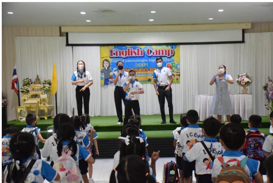
กิจกรรม English camp ห้องเรียน ICEP