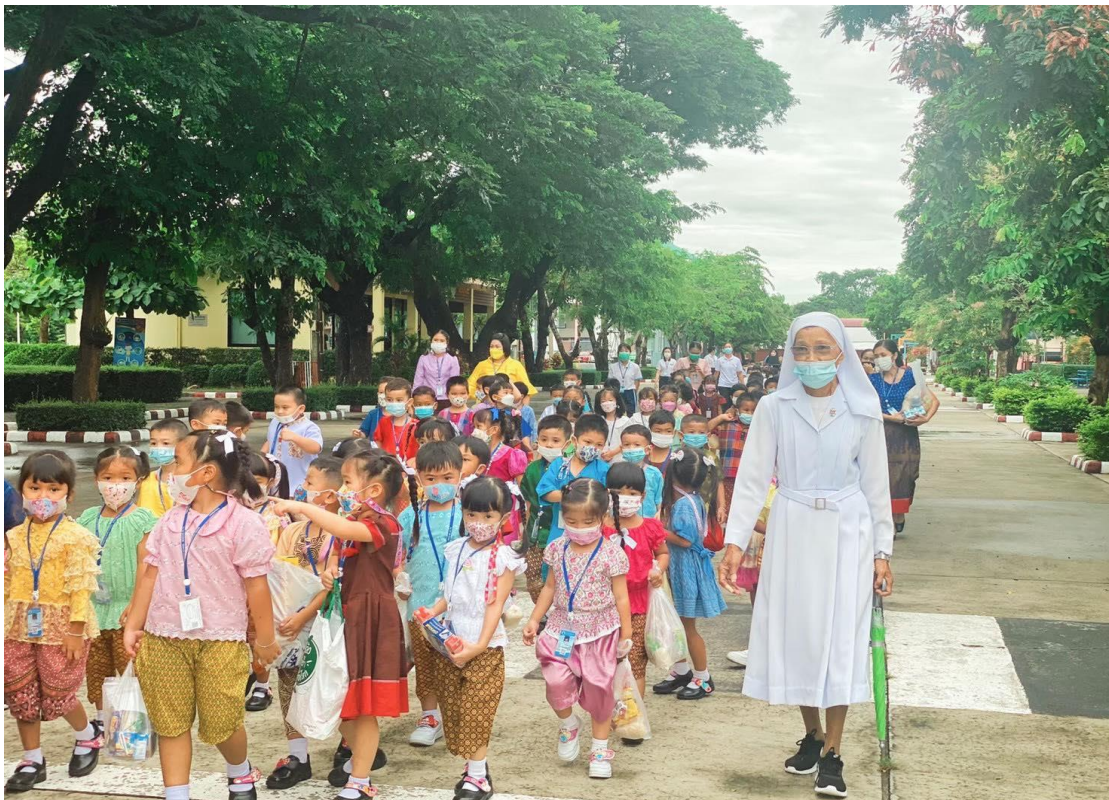
ได้รับมอบหมายทำหน้าที่บันทึกภาพกิจกรรมวันเข้าพรรษา