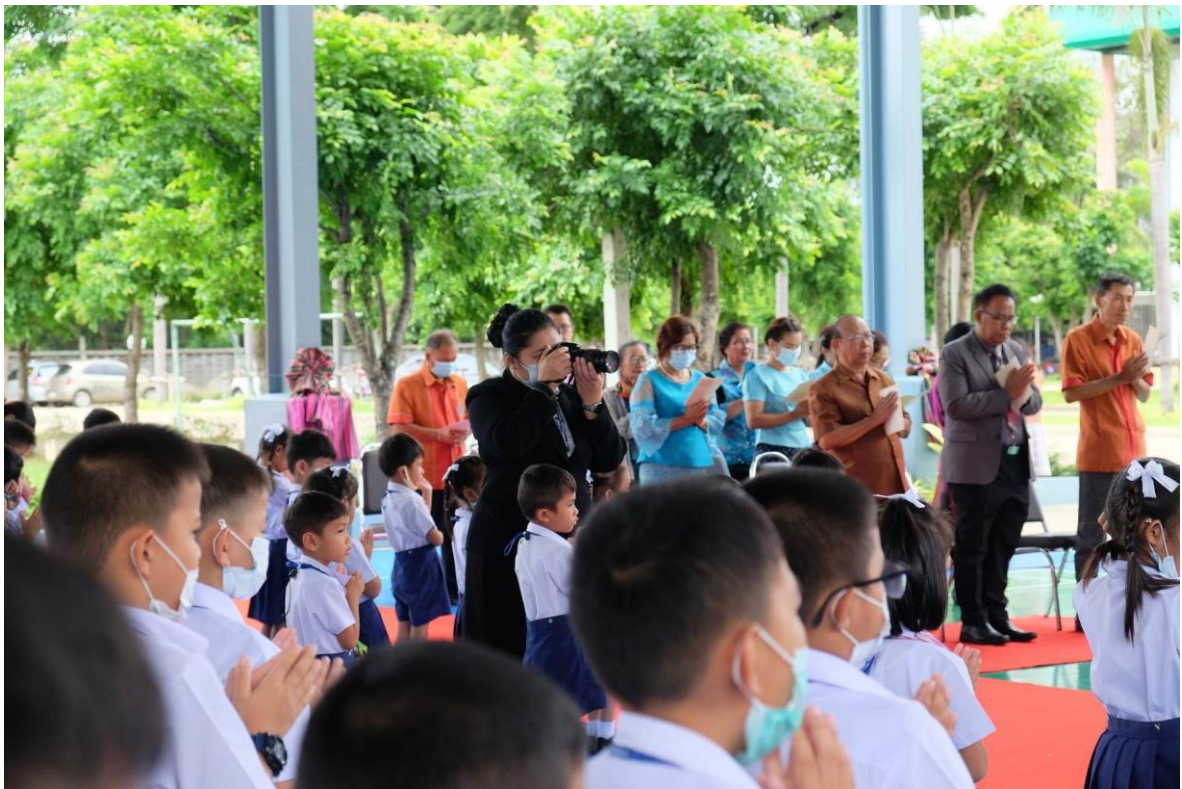
ได้รับมอบหมายทำหน้าที่บันทึกภาพในกิจกรรมต่างๆ