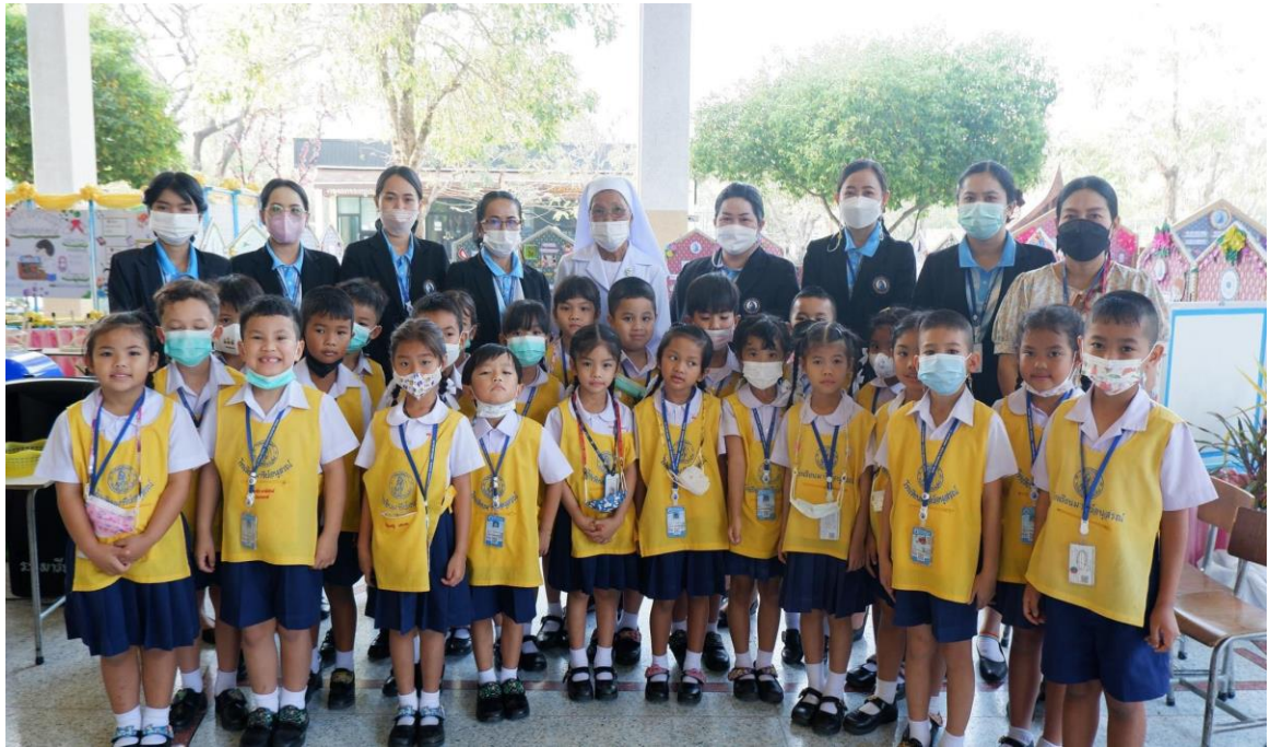
ได้รับมอบหมายทำหน้าที่บันทึกภาพกิจกรรมตลาดนัดคุณธรรม นำพลังสร้างความคิด