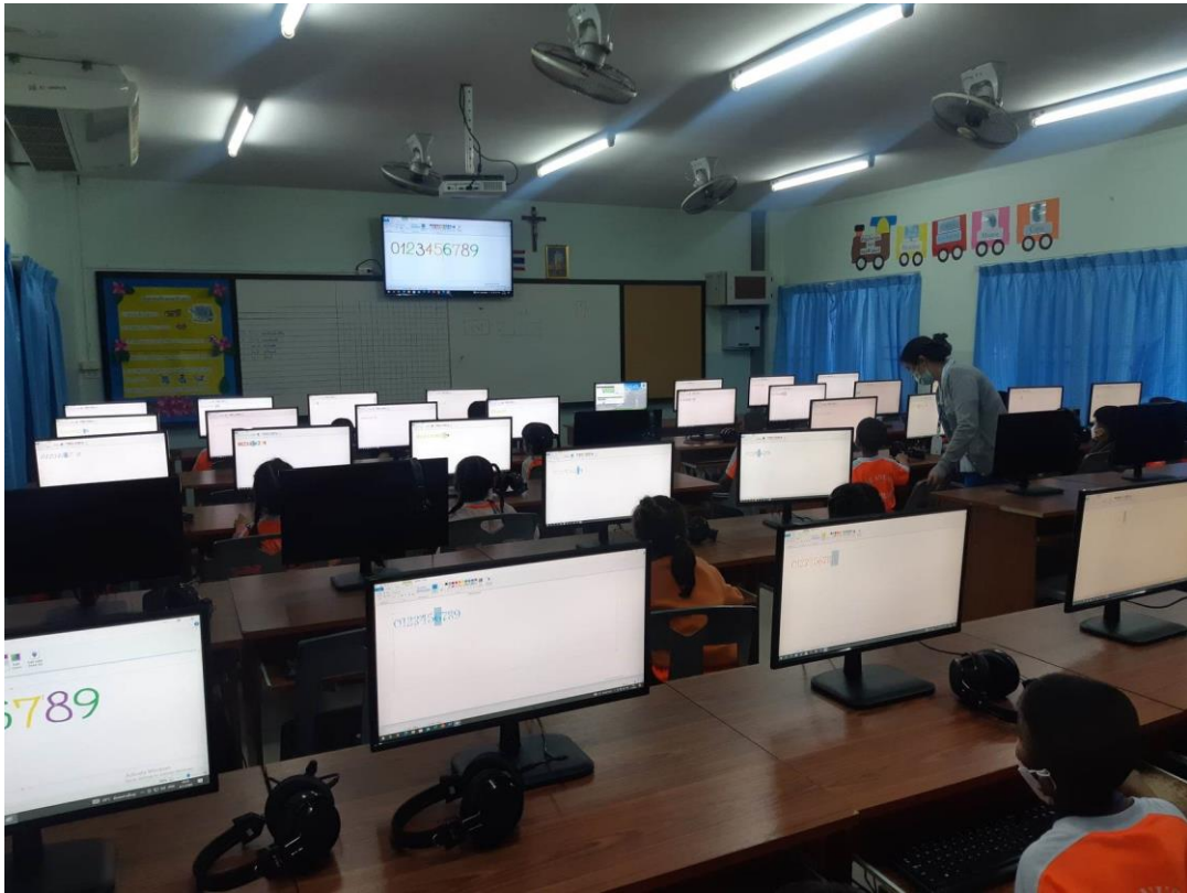
ปฏิบัติหน้าที่ครูผู้สอนในรายวิชาคอมพิวเตอร์ ระดับชั้นอนุบาล1-3