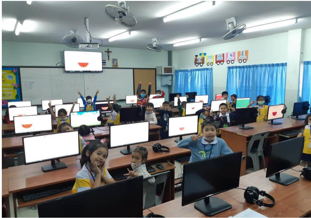
ปฏิบัติหน้าที่ครูผู้สอนในรายวิชาคอมพิวเตอร์ ระดับชั้นอนุบาล1-3