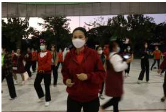
กิจกรรมการโครงการคุณธรรม ปี 65