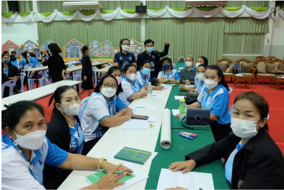
ภาพอบรมจัดทำแผนพัฒนาคุณภาพการศึกษา