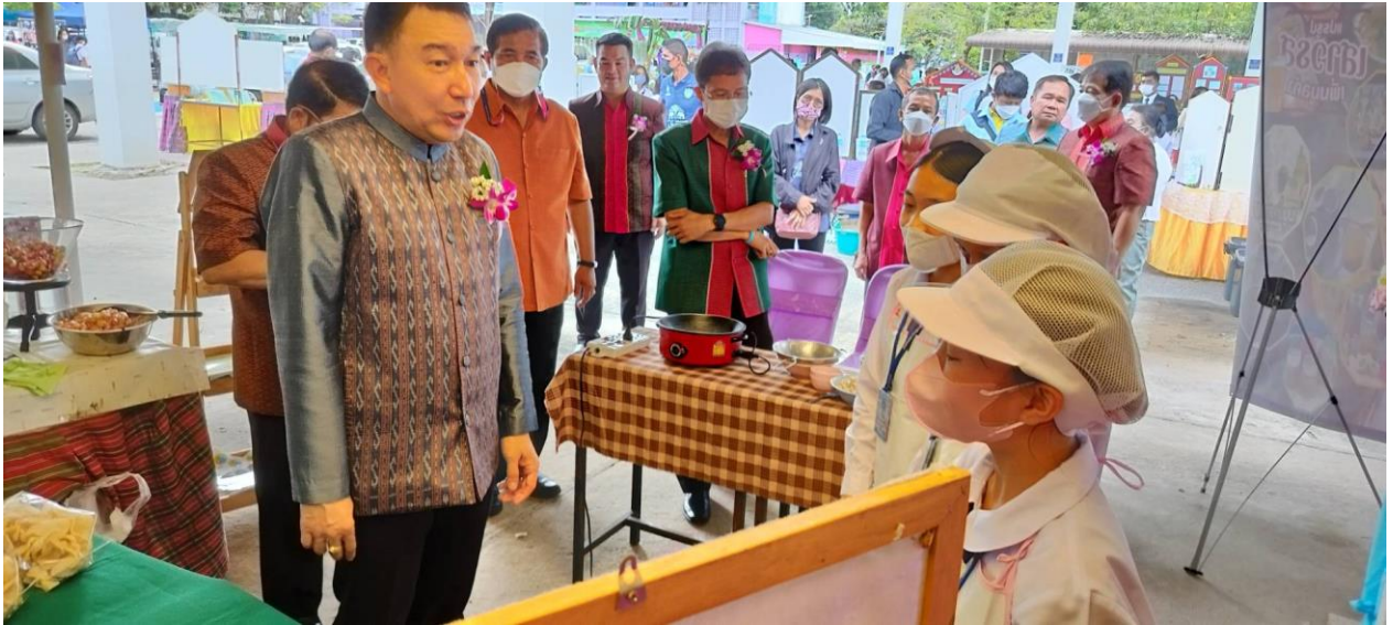
แข่งทักษะ