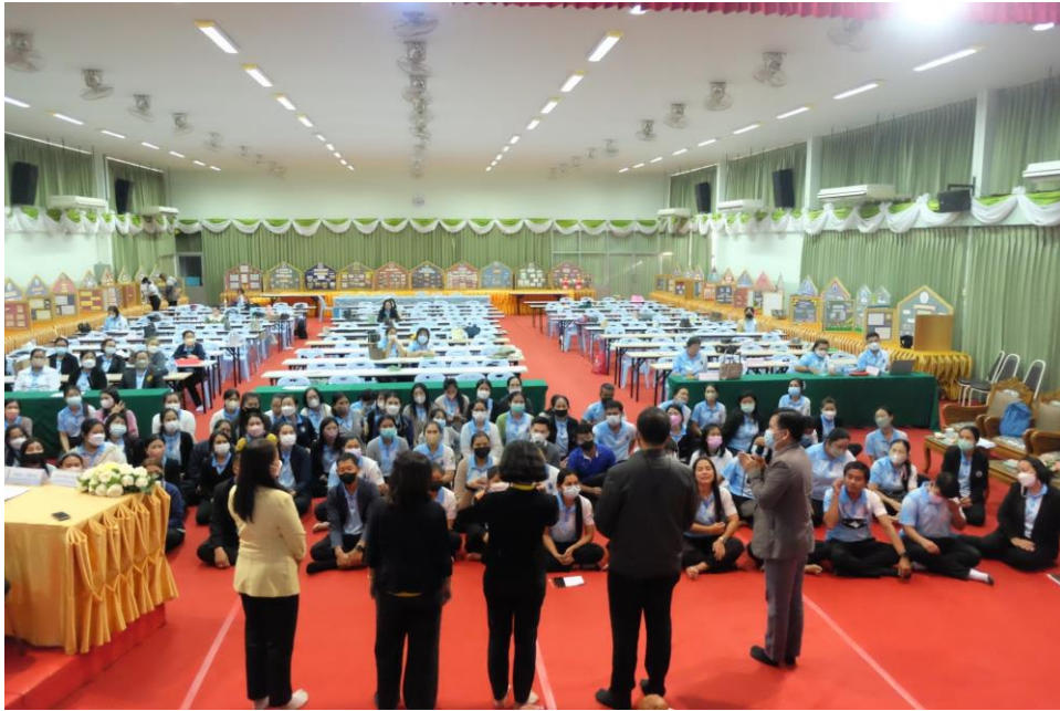
ภาพอบรมจัดทำแผนพัฒนาคุณภาพการศึกษา