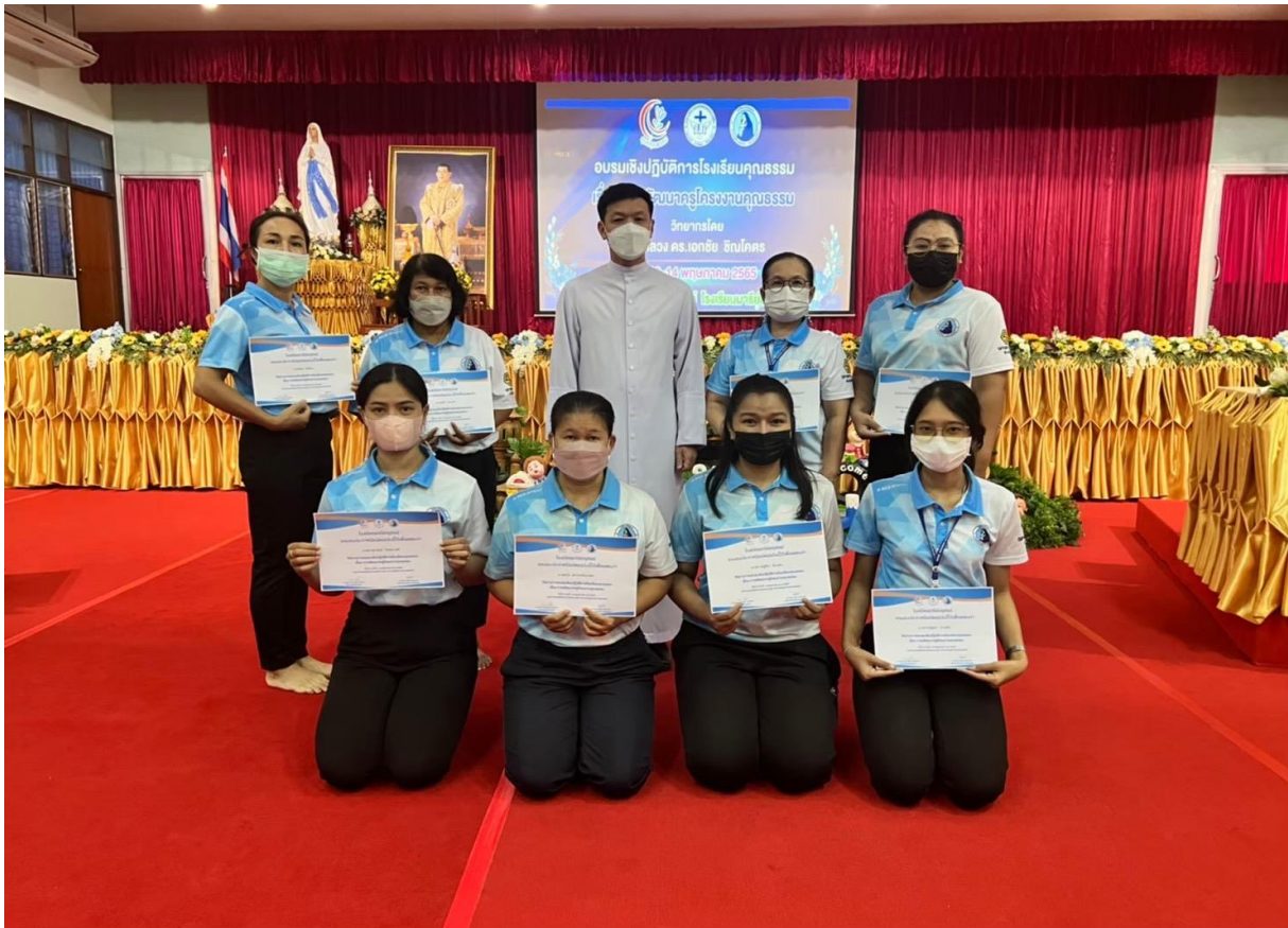
การอบรมเชิงปฏิบัติการโรงเรียนคุณธรรม เรื่อง การพัฒนาครูโรงเรียนคุณธรรม