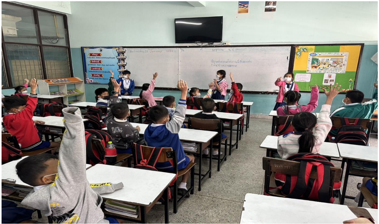
นักเรียนชั้น ป.2/3 ดำเนินการทำโครงการคุณธรรม ห้องเรียนสะอาดดี เพราะมีความรับผิดชอบ