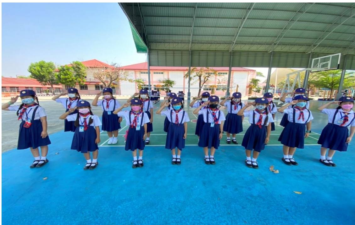
นักเรียนชั้น ป.2/3 ปฏิบัติกิจกรรมเข้าค่ายลูกเสือ