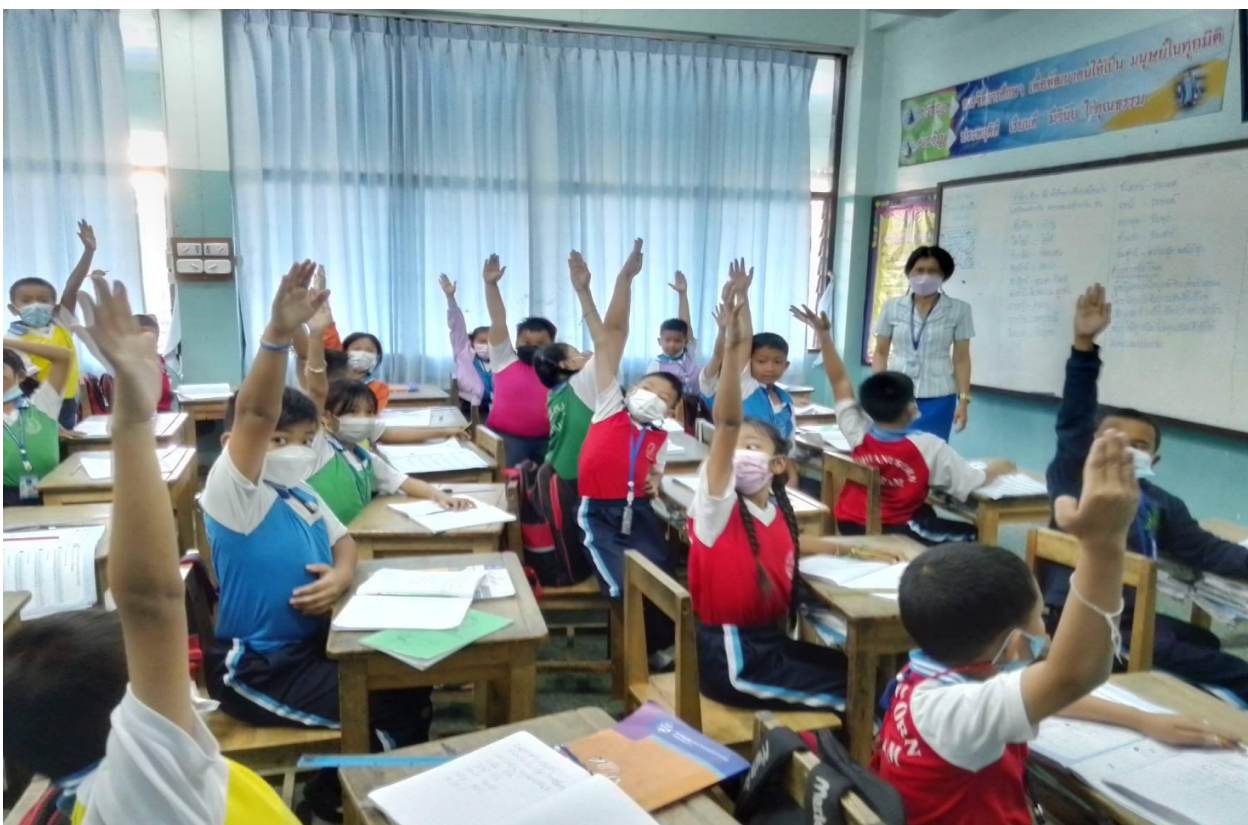
กิจกรรมการเรียนการสอน