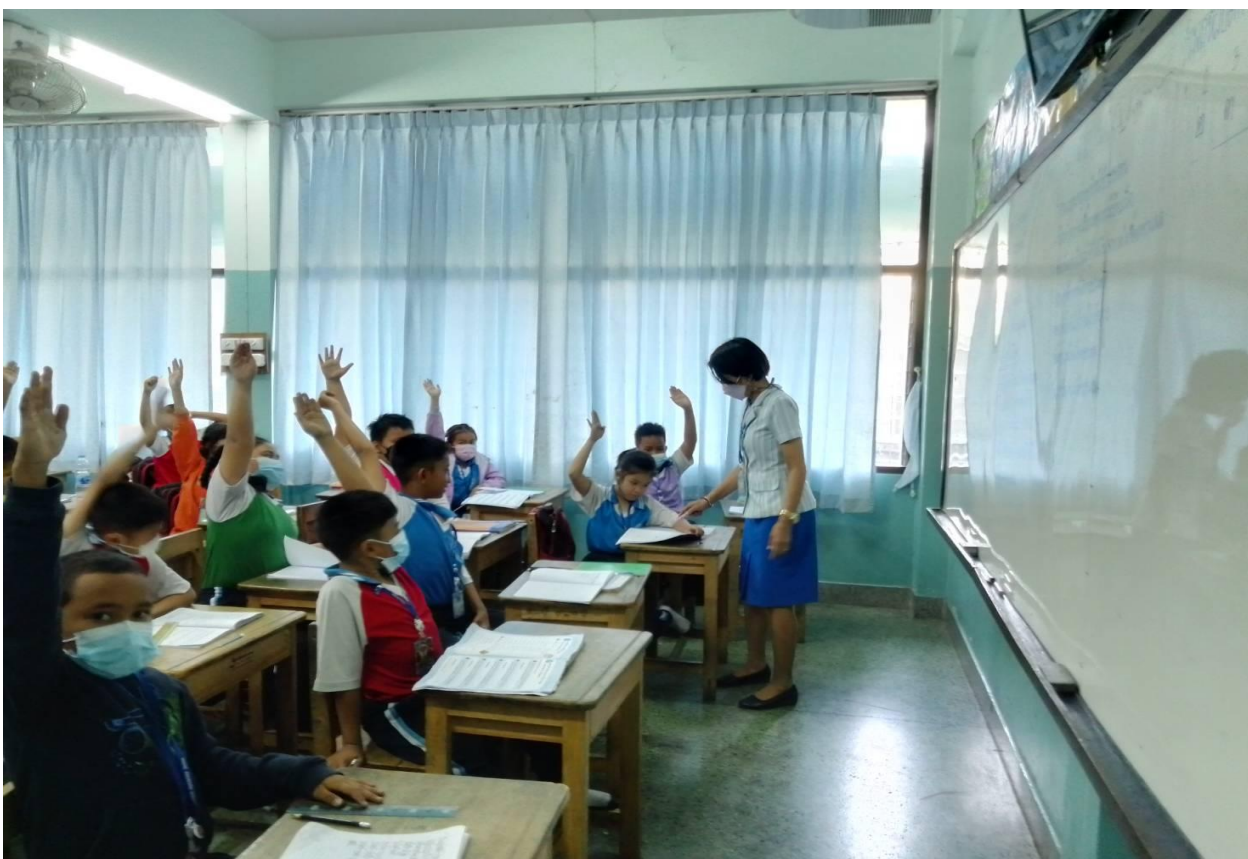
กิจกรรมการเรียนการสอน