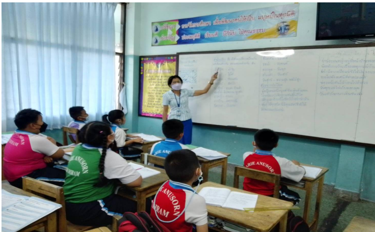
กิจกรรมการเรียนการสอน