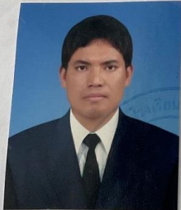
หมายเลขบัตรประชาชน