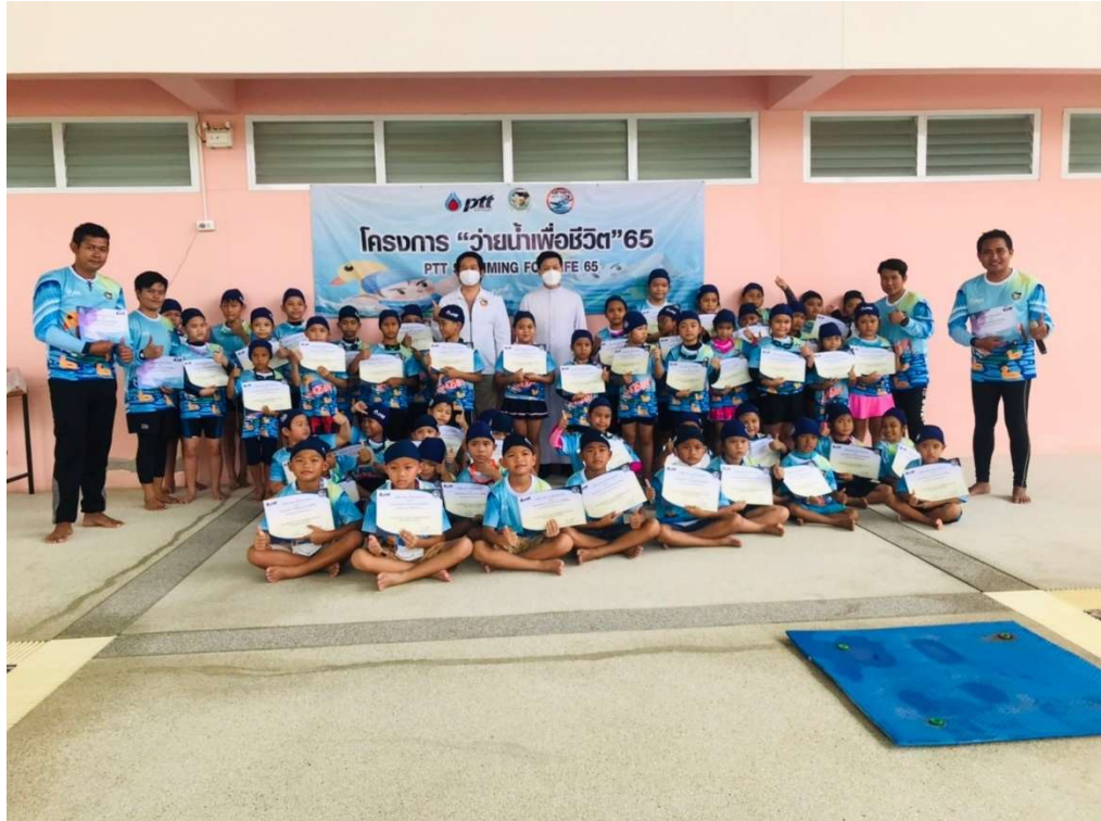
เป็นวิทยากร โครงการ จ่ายน้ำเพื่อชีวิต