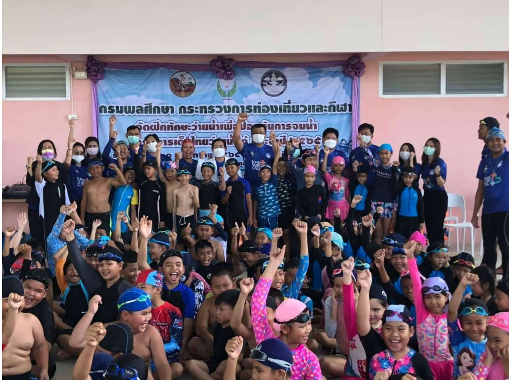
เป็นวิทยากร โครงการ เด็กไทยว่ายน้ำได้