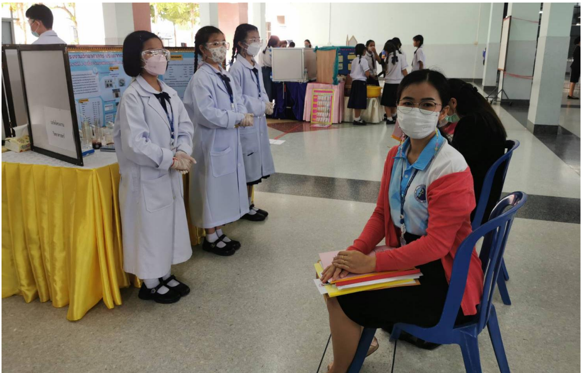
เป็นกรรมการและเลขานุการตัดสิน การประกวดโครงงานทางวิทยาศาสตร์ ระดับชั้น ป.4 - ป.6