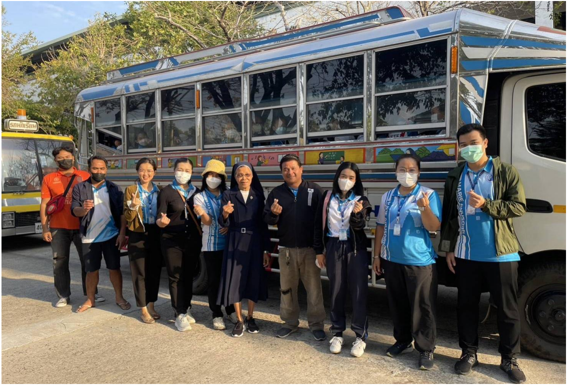
ร่วมกิจกรรมและดูแลนักเรียนห้องเรียนพิเศษวิทยาศาสตร์ คณิตศาสตร์ ระดับชั้น ป.4 ที่เพลาเฟลิน