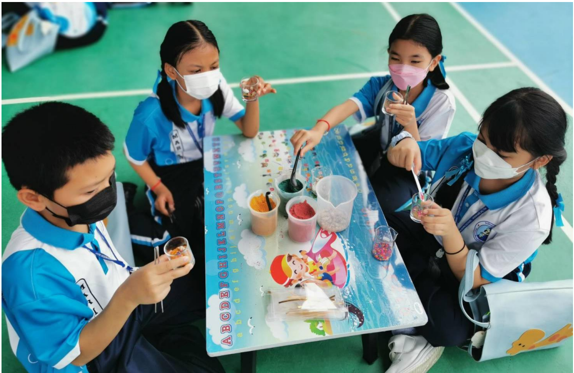
ร่วมกิจกรรมค่ายวิทยาศาสตร์ ห้องเรียนพิเศษวิทยาศาสตร์ คณิตศาสตร์ (GIFTED) ที่โรงเรียนมารีย์อนุสรณ์