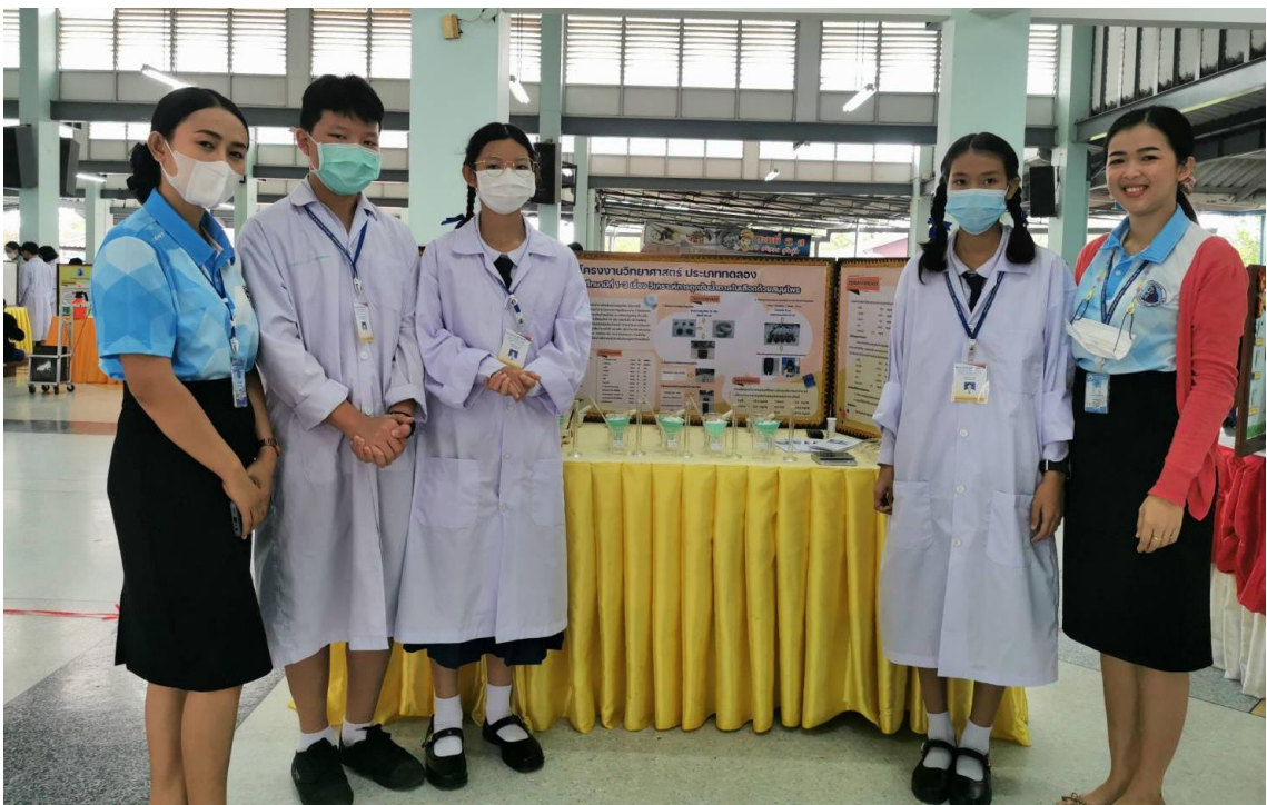
เป็นครูผู้ฝึกสอนนักเรียน กิจกรรม การประกวดโครงการงานทางวิทยาศาสตร์ ระดับชั้น ม.1 - ม.3