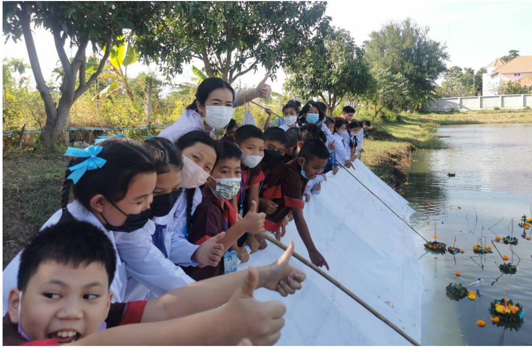
กิจกรรมวันลอยกระทงประจำปีการศึกษา 2565