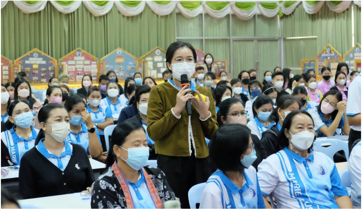
อบรมเชิงปฏิบัติการการจัดทำแผนพัฒนาคุณภาพการศึกษาโรงเรียนมารีย์อนุสรณ์ ปีการศึกษา 2566-2570