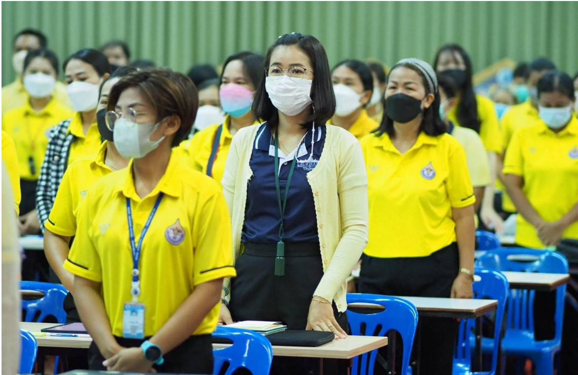
อบรมเชิงปฏิบัติการโรงเรียนคุณธรรม เรื่อง การพัฒนาครูโครงการงานคุณธรรม