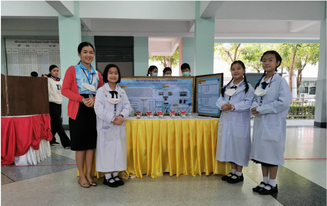
เป็นครูผู้ฝึกสอนนักเรียน กิจกรรม การประกวดโครงงานทางวิทยาศาสตร์ ระดับชั้น ป.4 - ป.6