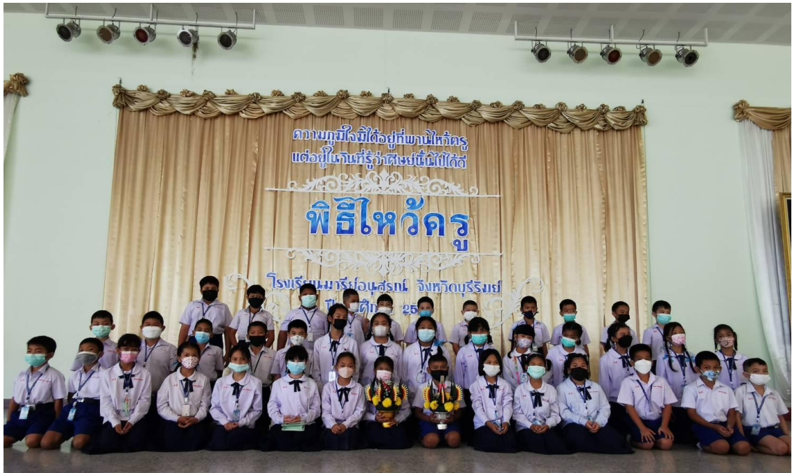
กิจกรรมไหว้ครูประจำปีการศึกษา 2565