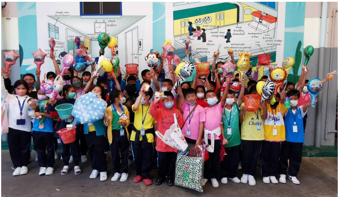
กิจกรรมคริสต์มาส