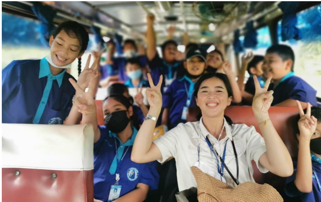
ร่วมกิจกรรมทัศนศึกษานักเรียน ป.4/4 ณ บ้านสวนพรีตการ์เด็นส์