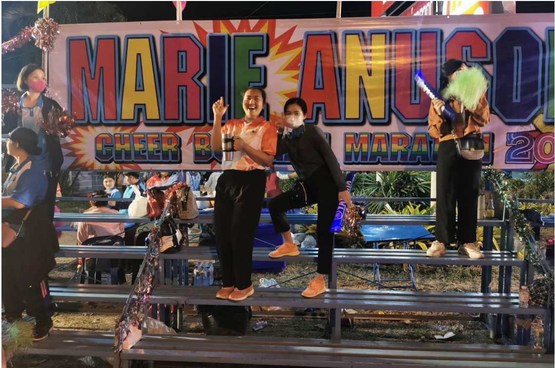
ร่วมกิจกรรมเชียร์การแข่งขันวิ่งมาราธอน