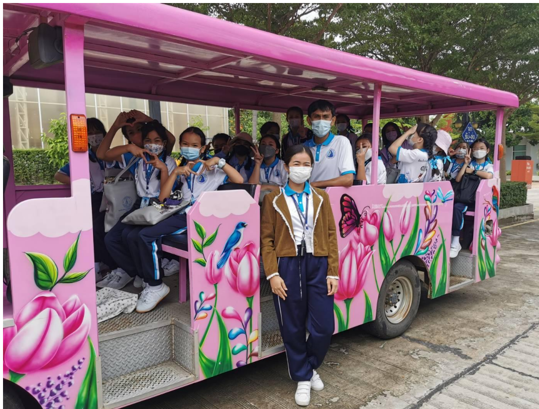
ร่วมกิจกรรมและดูแลนักเรียนห้องเรียนพิเศษวิทยาศาสตร์ คณิตศาสตร์ ป.5/8 ที่เฟลาเฟลิน