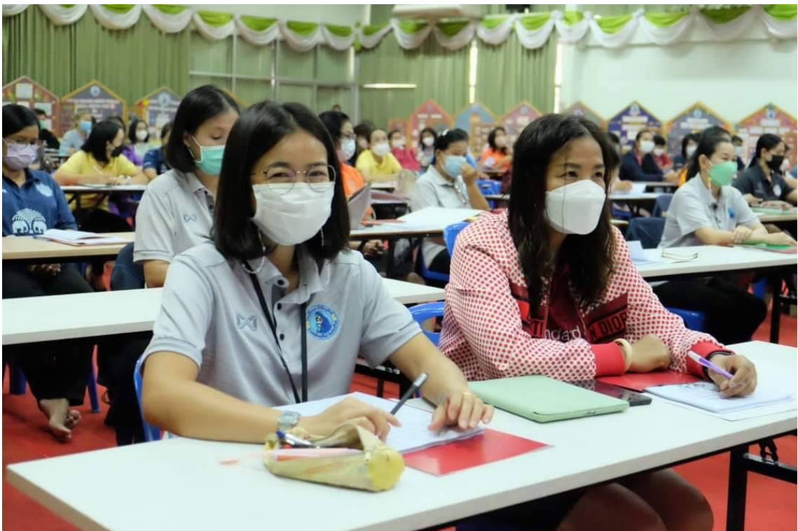
อบรมเชิงปฏิบัติการ “การพัฒนาสมรรถนะผู้เรียน ด้วยหลักสูตรแกนกลางฯ พ.ศ.2551 (ฉบับปรับปรุง พ.ศ.2560) สู่หลักสูตรฐานสมรรถนะ