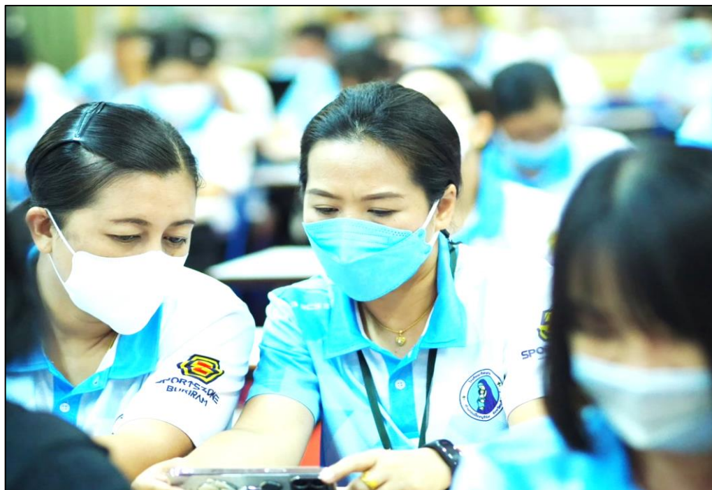
การอบรมเชิงปฏิบัติการเรื่องการพัฒนาครูโครงการคุณธรรม