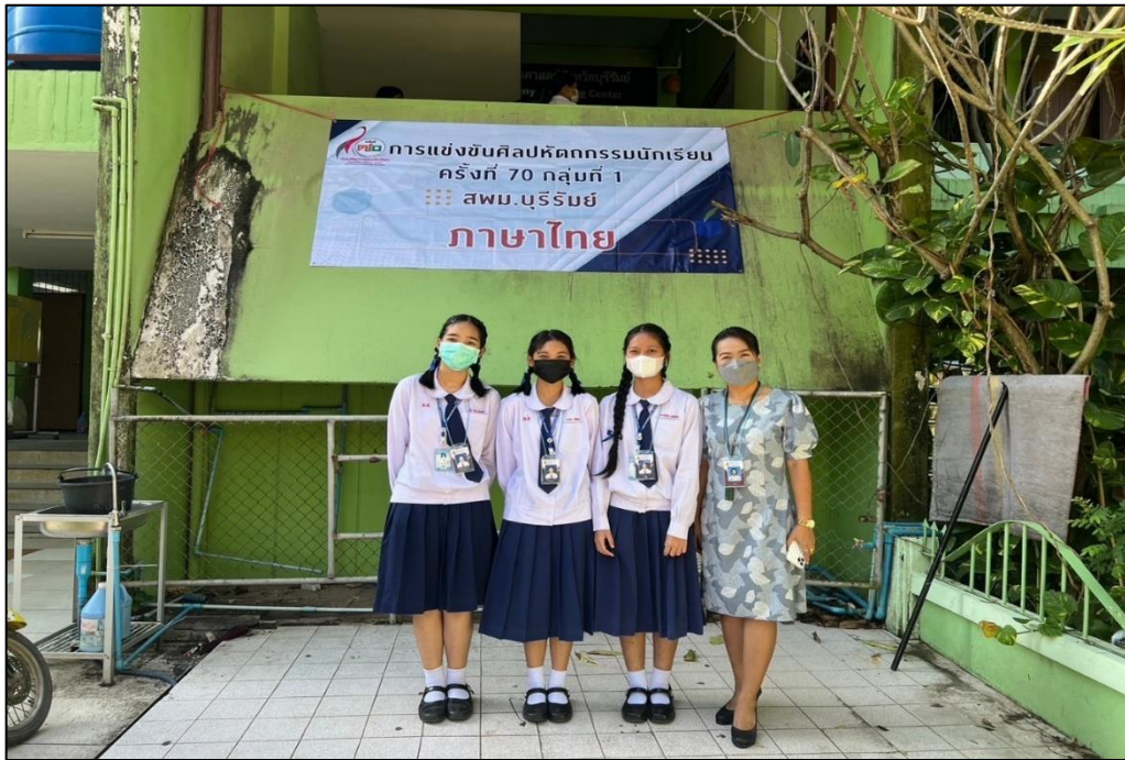
ส่งนักเรียนเข้าร่วมการแข่งขันทักษะทางวิชาการในรายการต่าง ๆ