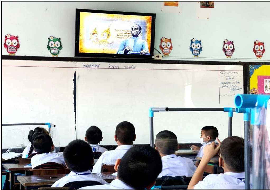
สอนเรื่องประวัติและผลงานของสุนทรภู่โดยใช้สื่อวีดิทัศน์ประกอบ