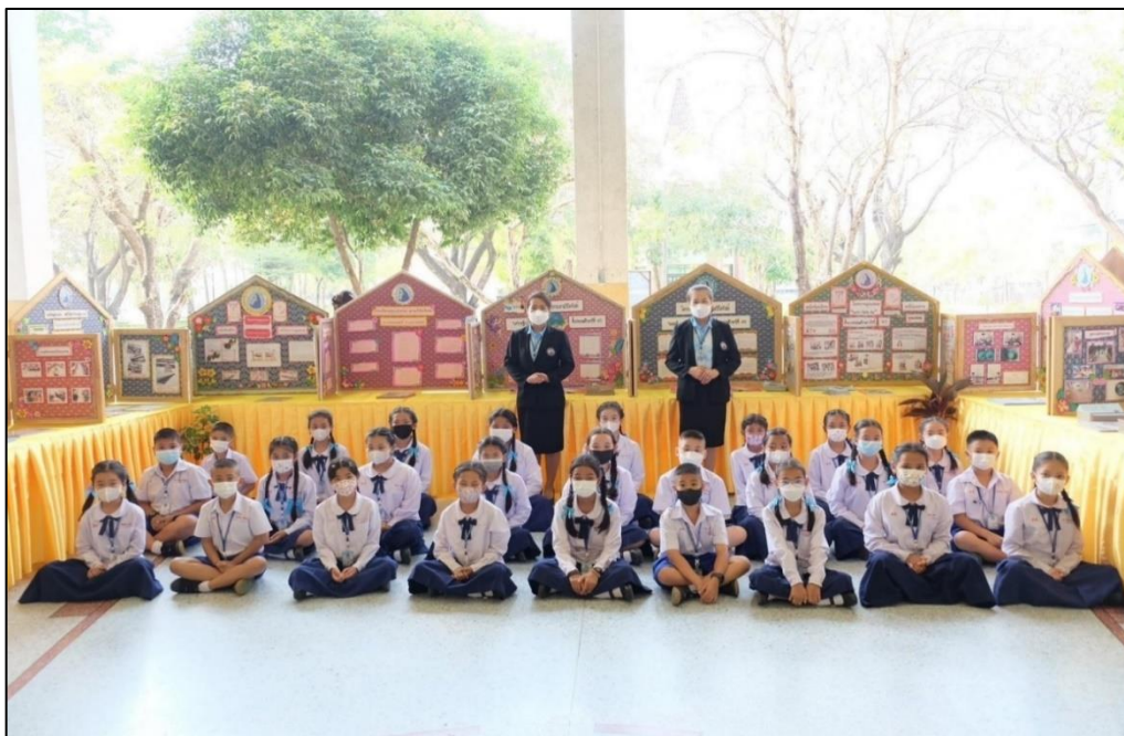
ร่วมกิจกรรมตลาดนัดคุณธรรม