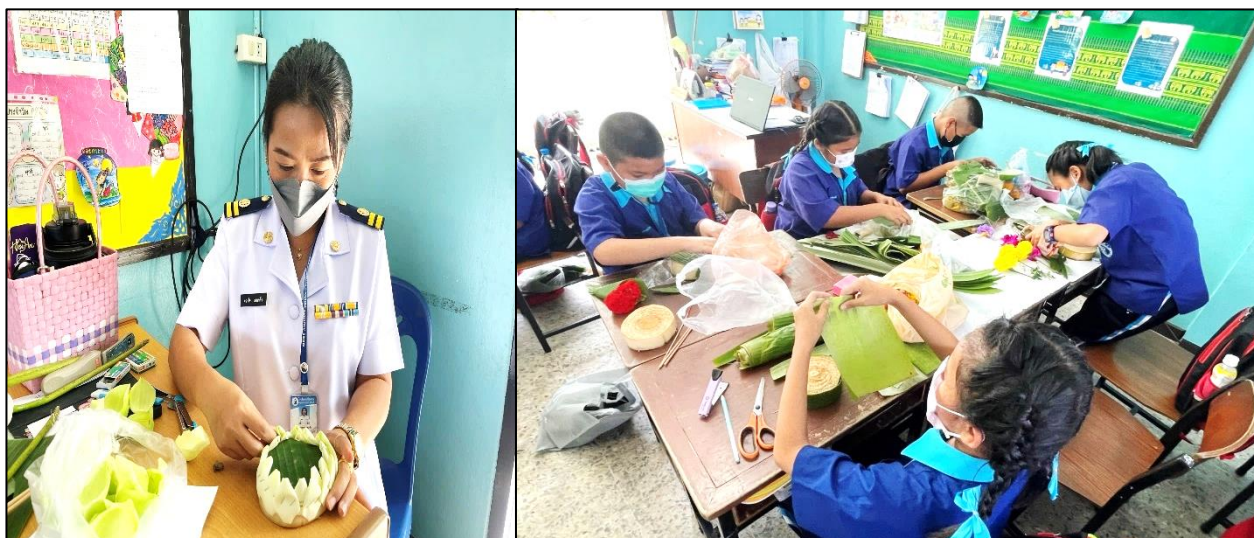
สอนให้นักเรียนเรียนรู้ด้วยการลงมือปฏิบัติจริง