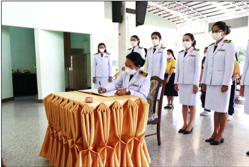
ร่วมกิจกรรมวันสำคัญต่าง ๆ ที่ทางโรงเรียนจัดขึ้น