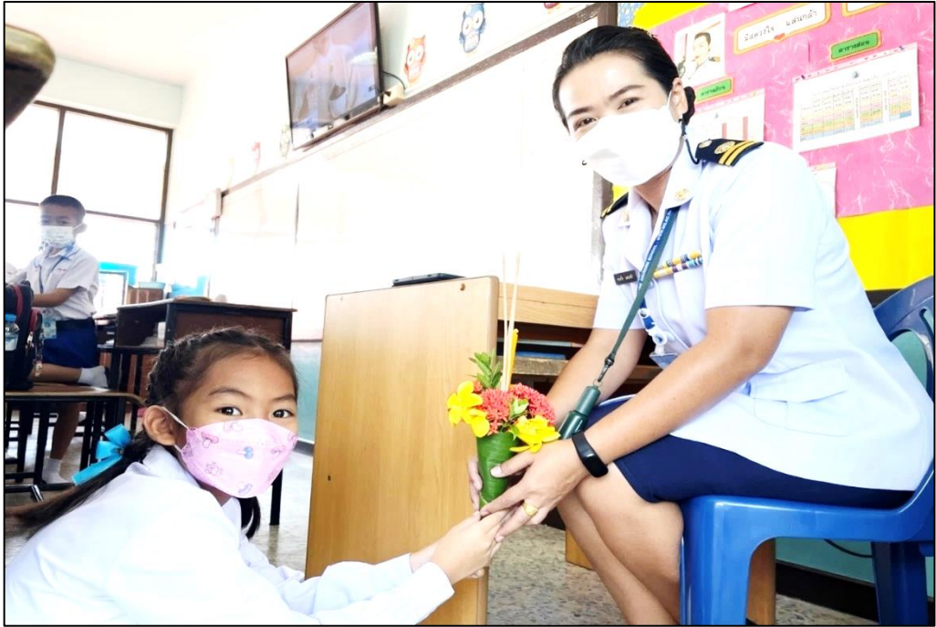
กิจกรรมวันไหว้ครู ปีการศึกษา 2565