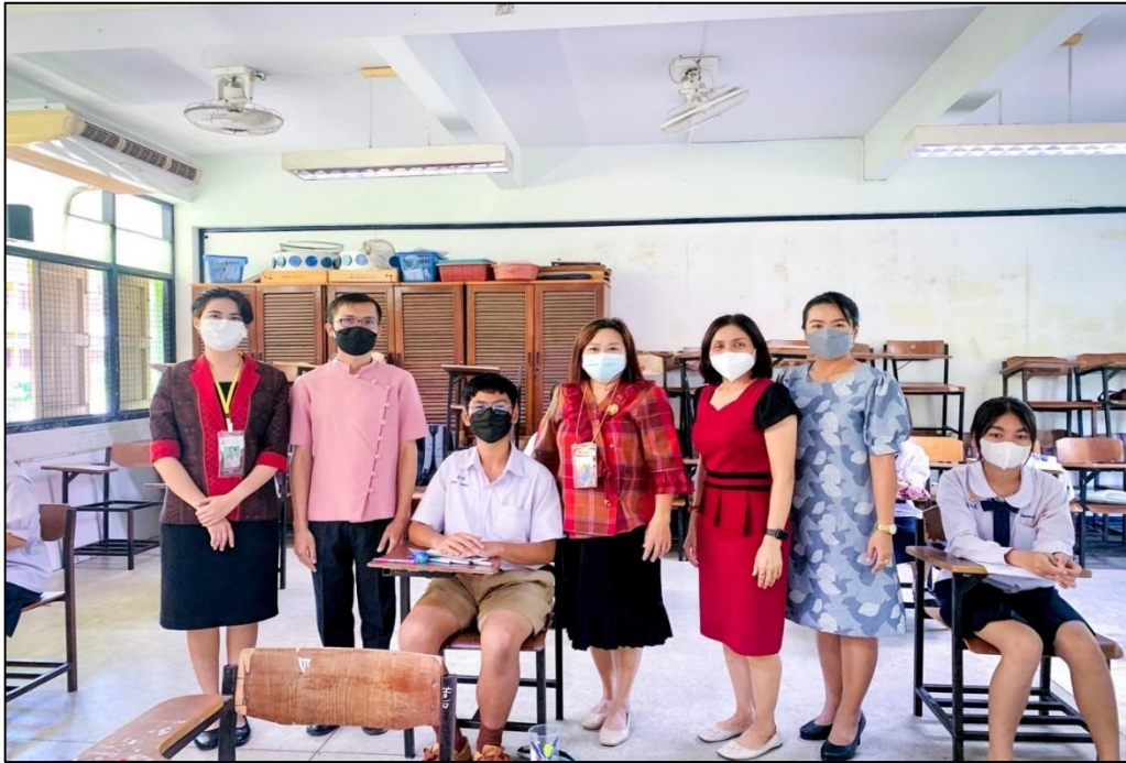
ร่วมเป็นกรรมการตัดสินกิจกรรมการแข่งขันในกลุ่มสาระการเรียนรู้ภาษาไทย