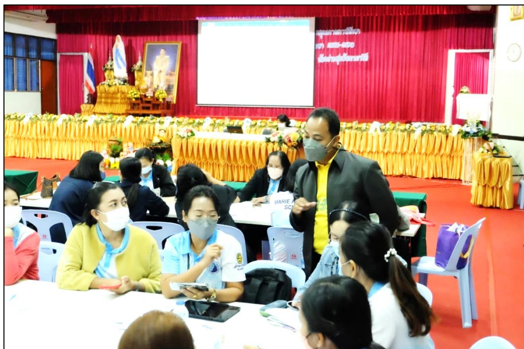
อบรมเชิงปฏิบัติการการจัดทำแผนพัฒนาคุณภาพการศึกษาโรงเรียนมารีย์อนุสรณ์ ปีการศึกษา 2566 – 2570