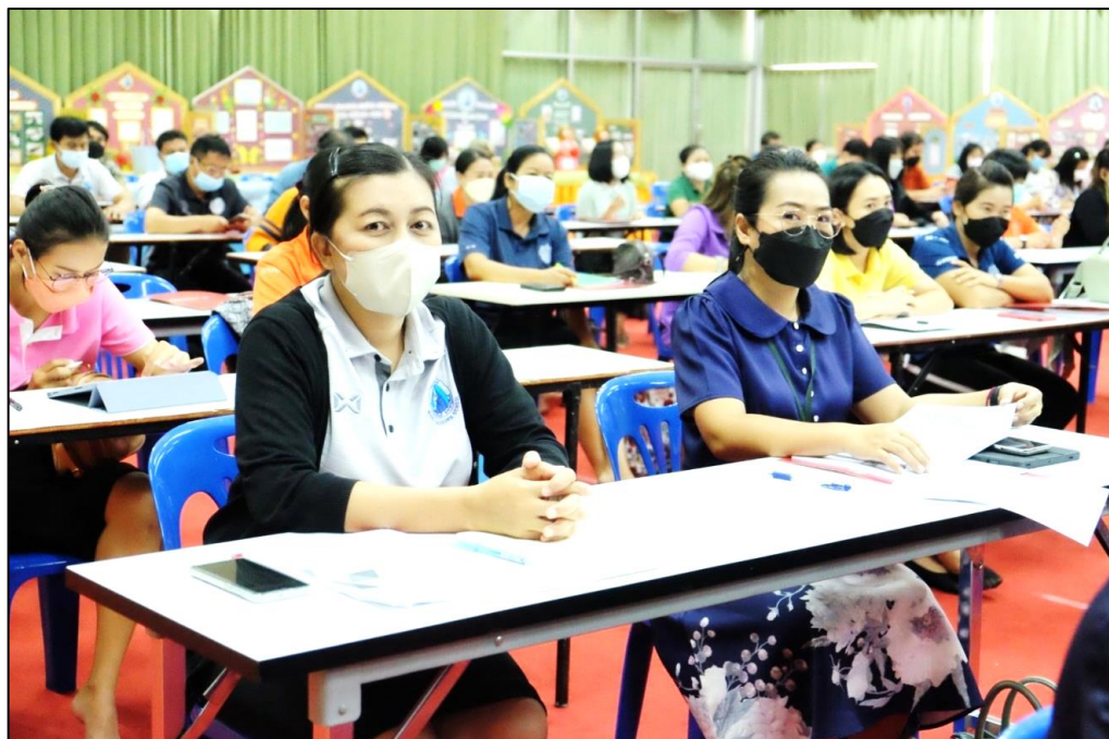
อบรมเชิงปฏิบัติการ “การพัฒนาสมรรถนะผู้เรียนด้วยหลักสูตรแกนกลางฯ พ.ศ.2551 (ฉบับปรับปรุง พ.ศ.2560) สู่หลักสูตรฐานสมรรถนะ”