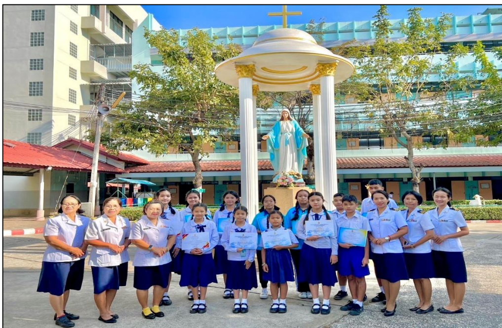
ร่วมแสดงความยินดีกับนักเรียนในกลุ่มสาระฯ ภาษาไทยที่ได้รับรางวัลในการแข่งขันต่าง ๆ