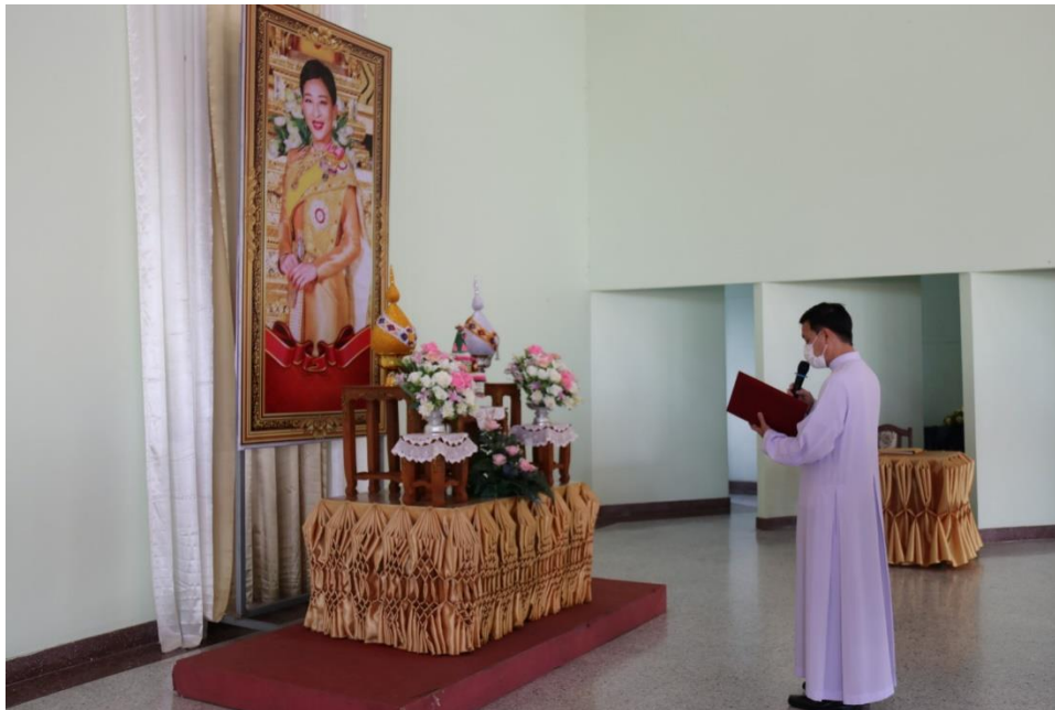
ร่วมกิจกรรมลงนามถวายพระพร สมเด็จพระเจ้าลูกเธอ เจ้าฟ้าพัชรกิติยาภาฯ