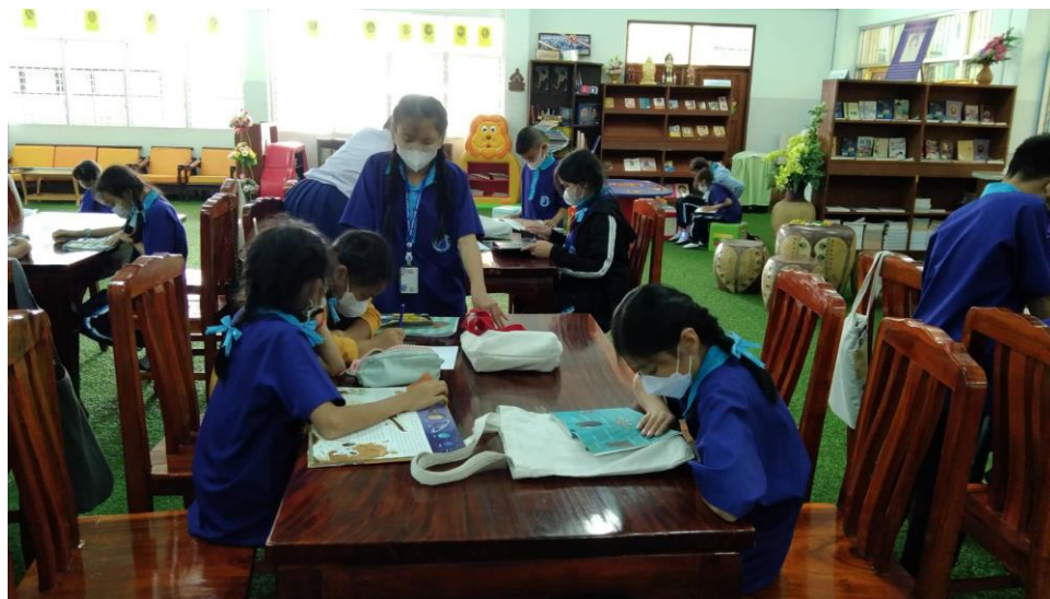
สอนกิจกรรม เรื่อง การสืบค้นสภาพอากาศและฤดูกาล