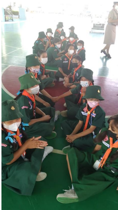
สอนกิจกรรมลูกเสือเนตรนารี