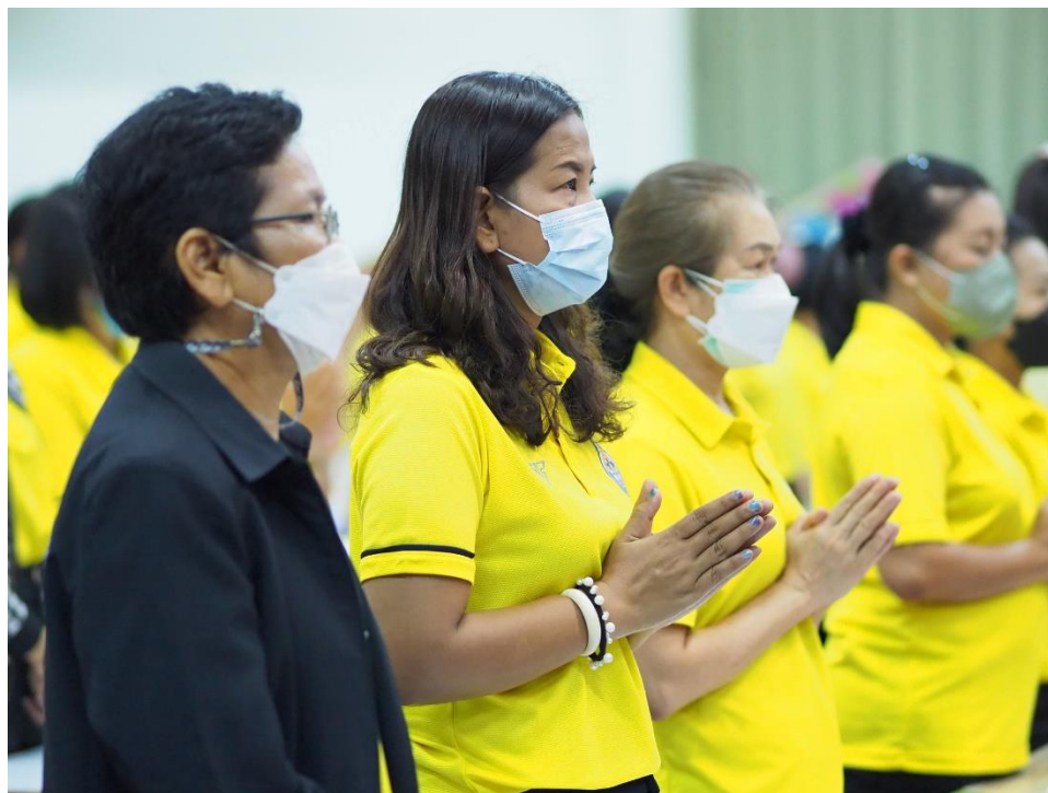
อบรมเชิงปฏิบัติการโรงเรียนคุณธรรม เรื่อง การพัฒนาครูโครงการคุณธรรม