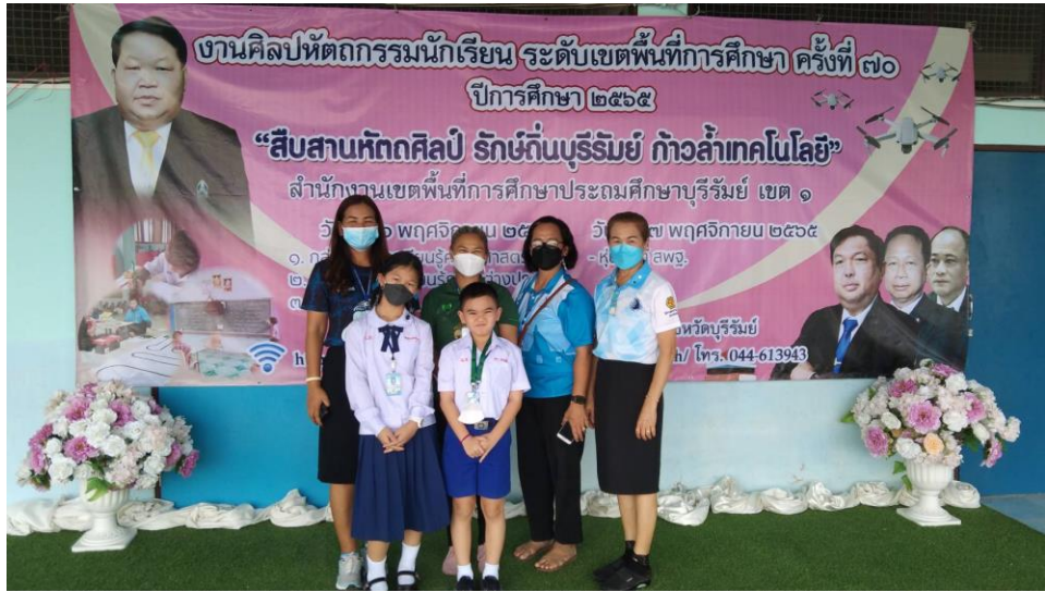
ร่วมแข่งขันกิจกรรมงานศิลปหัตถกรรมนักเรียน ระดับเขตพื้นที่การศึกษา ครั้งที่ 70 ปีการศึกษา 2565