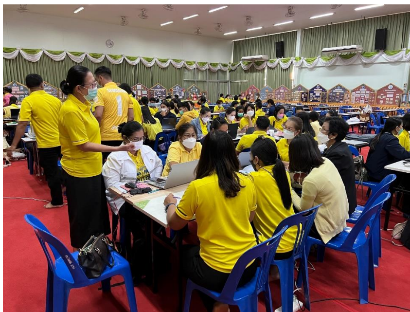
อบรมเชิงปฏิบัติการ “การพัฒนาสมรรถนะผู้เรียน ด้วยหลักสูตรแกนกลางฯ พ.ศ.2551 (ฉบับปรับปรุง พ.ศ.2560) สู่หลักสูตรฐานสมรรถนะ