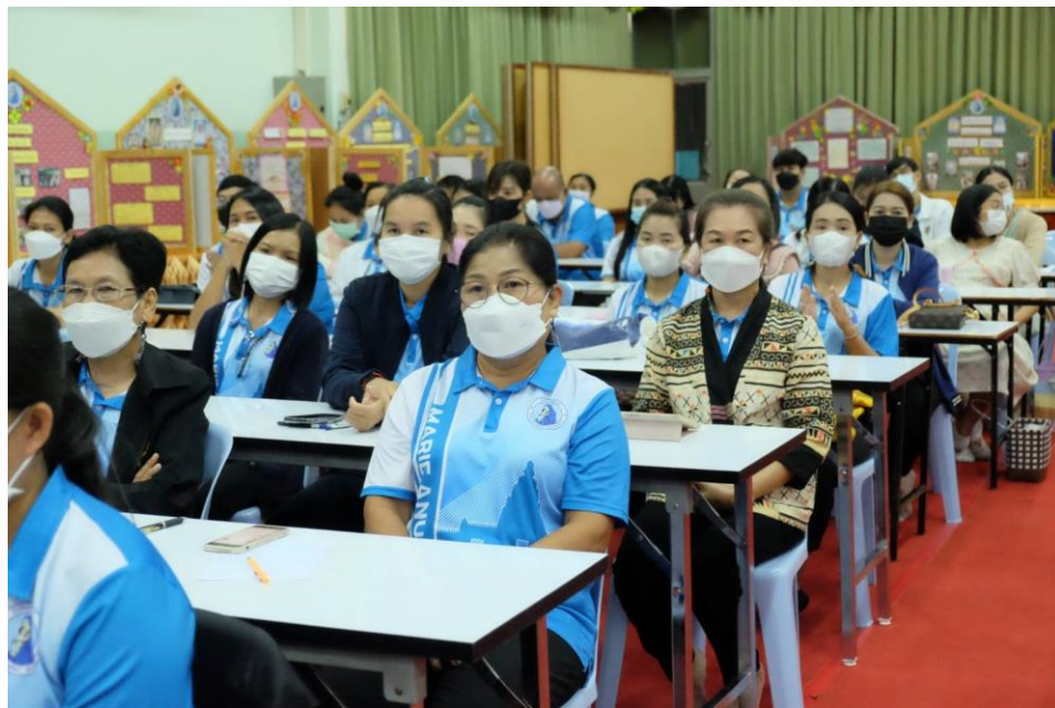
อบรมเชิงปฏิบัติการการจัดทำแผนพัฒนาคุณภาพการศึกษาโรงเรียนมารีย์อนุสรณ์ ปีการศึกษา 2566-2570