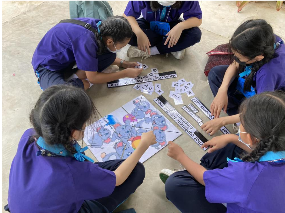
ร่วมกิจกรรมทัศนศึกษานักเรียน ป.4/7 ณ เพลาเพลิน