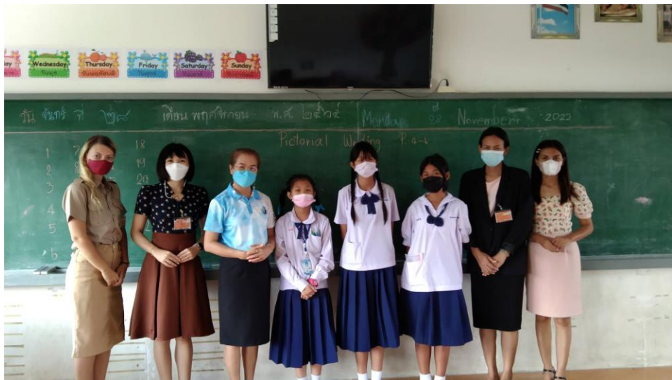
เป็นกรรมการคณะกรรมการอำนวยการกลุ่มสาระการเรียนรู้ภาษาต่างประเทศ