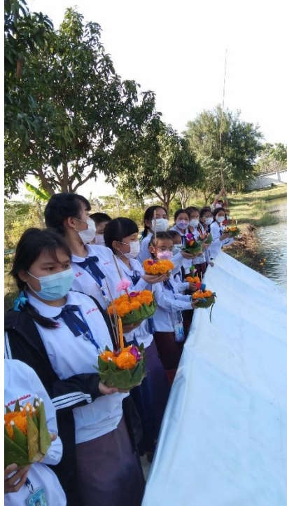
ร่วมกิจกรรมประเพณีลอยกระทง