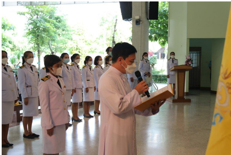
ร่วมกิจกรรมเฉลิมพระเกียรติพระบาทสมเด็จพระเจ้าอยู่หัวรัชกาลที่ 10