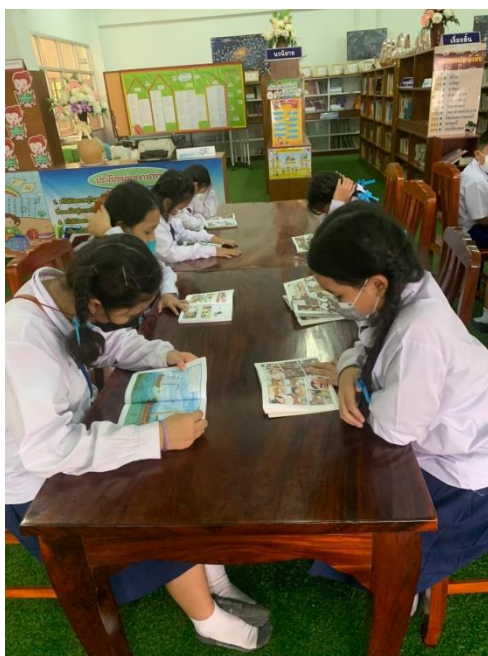
สอนกิจกรรมเข้าห้องสมุด เรื่อง การอ่านหนังสือตามความสนใจ