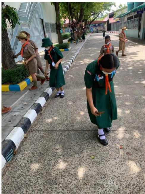
สอนกิจกรรมลูกเสือเนตรนารี บำเพ็ญประโยชน์เพื่อส่วนรวม