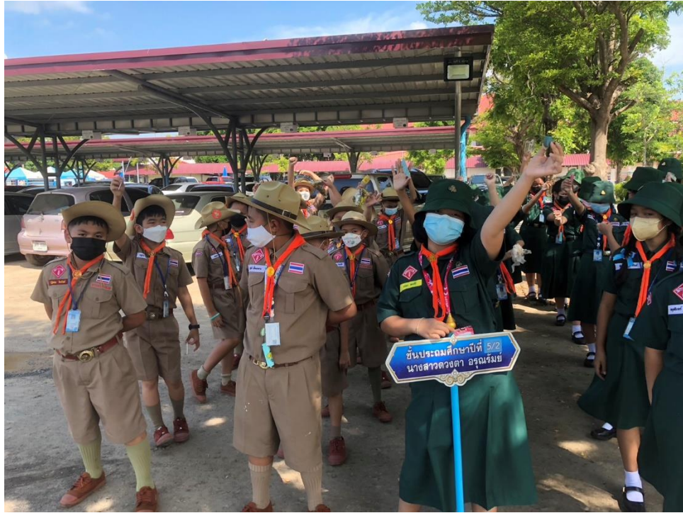
สอนกิจกรรมลูกเสือเนตรนารี ฐานเครื่องหมายจราจร