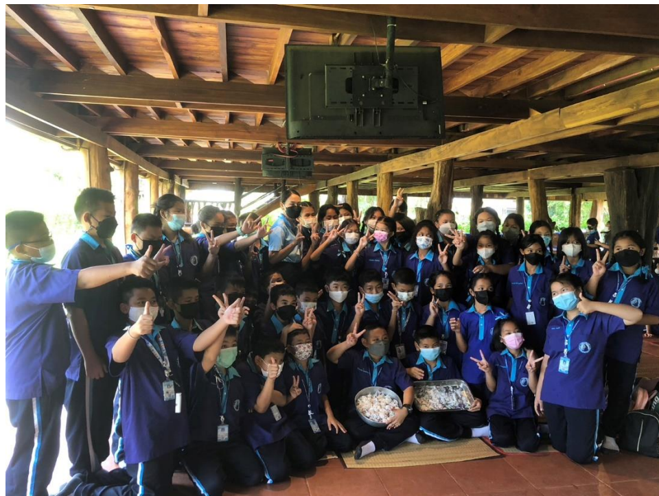
ร่วมกิจกรรมทัศนศึกษานักเรียน ป.5/2 ณ สวนพรีตการ์เด็นท์