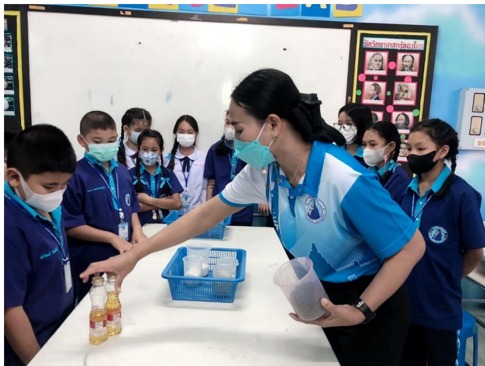
สอนกิจกรรมการทดลอง เรื่อง การละลายของสารในน้ำ