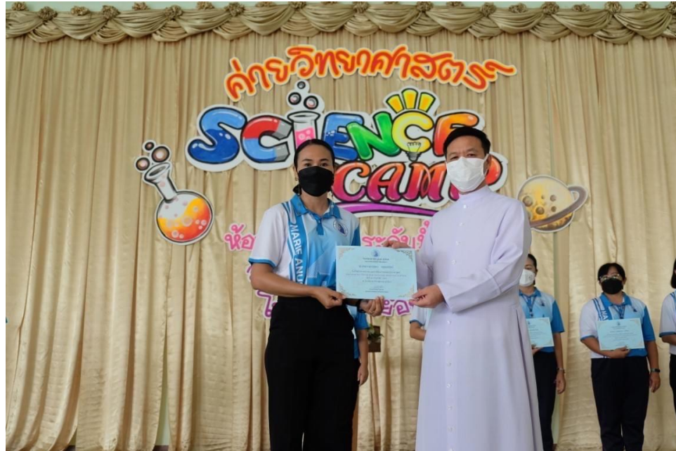
เป็นวิทยากรและอนุเคราะห์จัดการทดลองวิทยาศาสตร์ ค่ายวิทยาศาสตร์ ห้องเรียนพิเศษวิทยาศาสตร์ คณิตศาสตร์ (GIFTED)