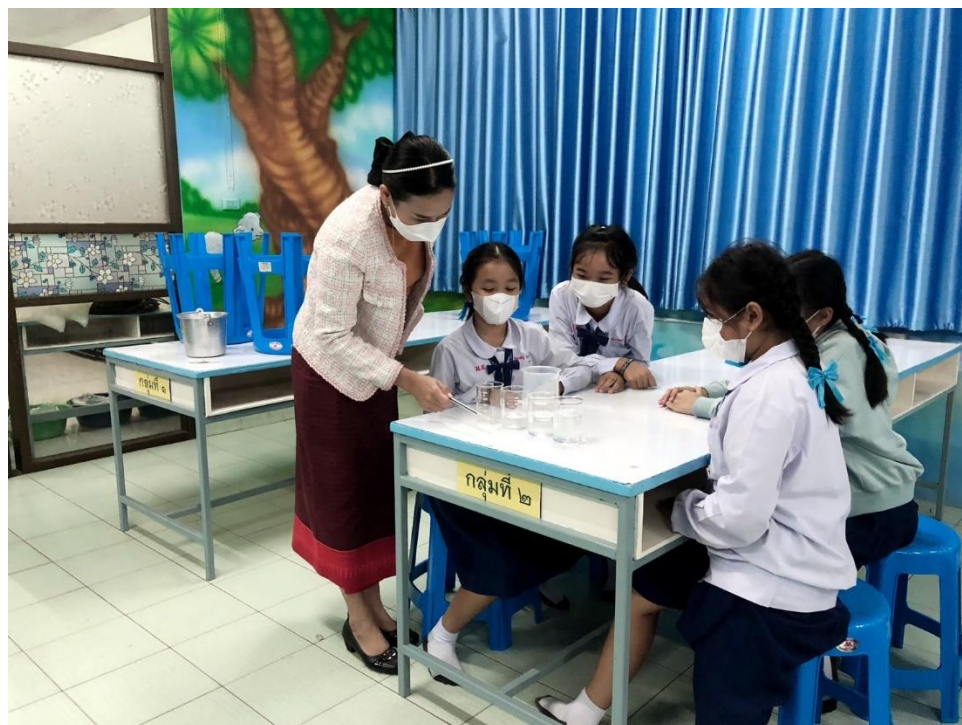
สอนกิจกรรมการทดลอง เรื่อง การเกิดเสียงสูง-เสียงต่ำ