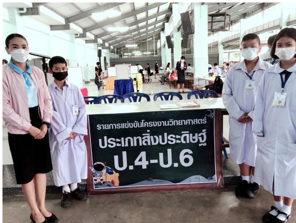
เป็นกรรมการและเลขานุการตัดสิน การแข่งขันโครงงานวิทยาศาสตร์ ประเภทสิ่งประดิษฐ์ ระดับชั้น ป.4-ป.6