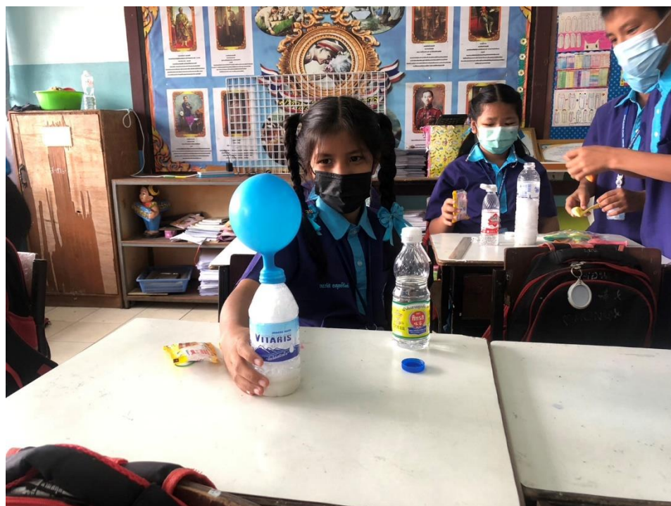
สอนกิจกรรมการทดลอง เรื่อง การเปลี่ยนแปลงทางเคมี