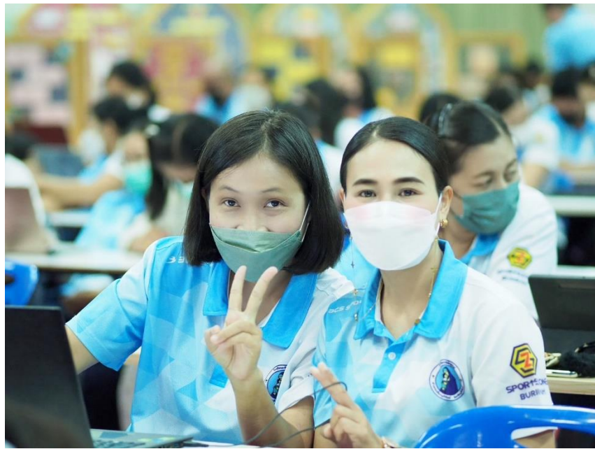
อบรมเชิงปฏิบัติการ “การพัฒนาสมรรถนะผู้เรียน ด้วยหลักสูตรแกนกลางฯ พ.ศ.2551 (ฉบับปรับปรุง พ.ศ.2560) สู่หลักสูตรฐานสมรรถนะ