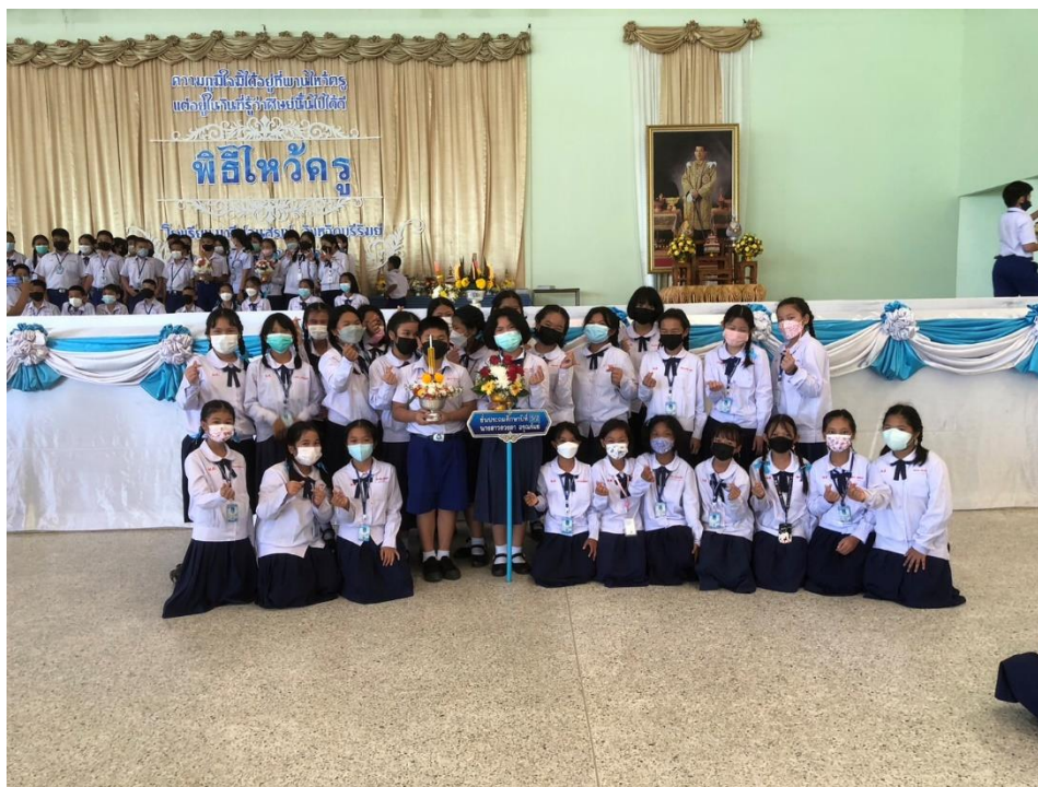
กิจกรรมไหว้ครูประจำปีการศึกษา 2565