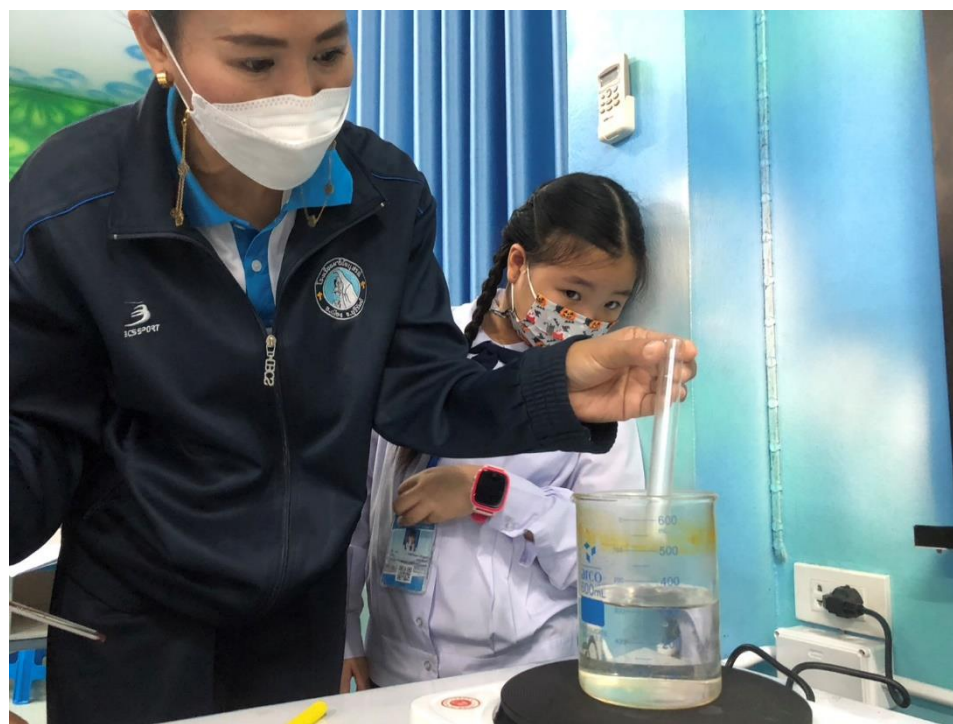
สอนกิจกรรมการทดลอง เรื่อง การเปลี่ยนสถานะของสาร