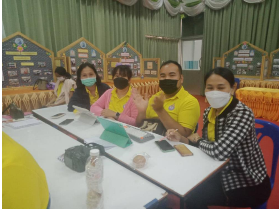
อบรมเชิงปฏิบัติการโรงเรียนคุณธรรม เรื่อง การพัฒนาครูโครงการคุณธรรม