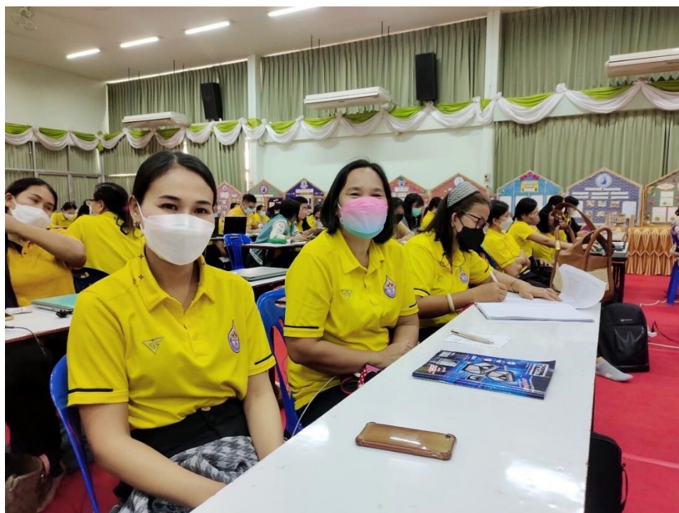
อบรมเชิงปฏิบัติการการจัดทำแผนพัฒนาคุณภาพการศึกษาโรงเรียนมารีย์อนุสรณ์ ปีการศึกษา 2566-2570