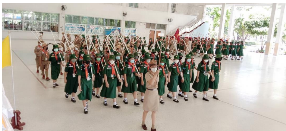
กิจกรรมงานวันสถาปนาคณะลูกเสือแห่งชาติ ประจำปีการศึกษา 2565