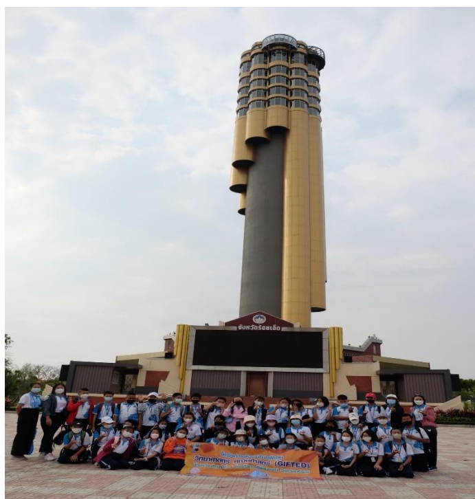
ทัศนศึกษาในโครงการห้องเรียนพิเศษวิทยาศาสตร์ คณิตศาสตร์ ณ หอโหวต 101