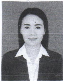
หมายเลขบัตรประชาชน

ให้ไว้ ณ วันที่..... ๑ ..... เดือน..... พฤษภาคม ..... พ.ศ..... ๒๕๖๒