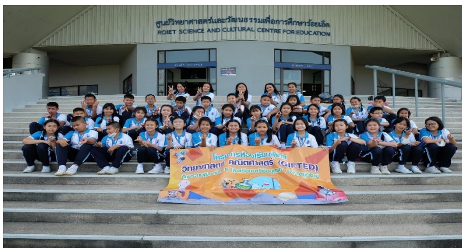
ทัศนศึกษาในโครงการห้องเรียนพิเศษวิทยาศาสตร์ คณิตศาสตร์ ณ ศูนย์วิทยาศาสตร์ จ.ร้อยเอ็ด